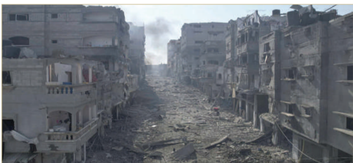
أحياء بأكملها دُمّرت في جباليا

خطورة، ما يُعرض استقرار المنطقة بأسرها إلى تهديد جسيم، ويدفعها لوضع غير معلوم. وقال أبو الفيط، إن وزراء الخارجية العرب "يجتمعون في طرف عصيب، والتصعيد الجاري بين حماس والإسرائيليين غير مسبوق في حدته وآثاره، مُخذراً مما وصفه باحتمالات جادة "لانفلات الأوضاع".