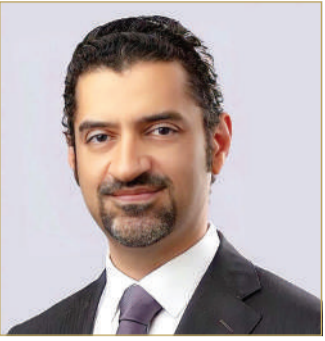
وزير شؤون البلديات والزراعة

المجلس البلدي لمدينة المحرق تنفيذ الخطة بما يحقق الأهداف المنشودة، لافتاً إلى أنها ستشهد تنويع في التشجير.