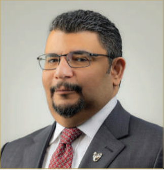
وزير شؤون الكهرباء والماء

بشكل تكاملي لترجمة الأمر الملكي السامي وتنفيذ توجيهات صاحب السمو الملكي ولي العهد رئيس مجلس الوزراء، خصوصاً فيما يتعلق بتطوير خدمات البنية التحتية والمرافق العامة؛ من أجل تحقيق الهدف المنشود من هذه الخطة الوطنية الواحدة.