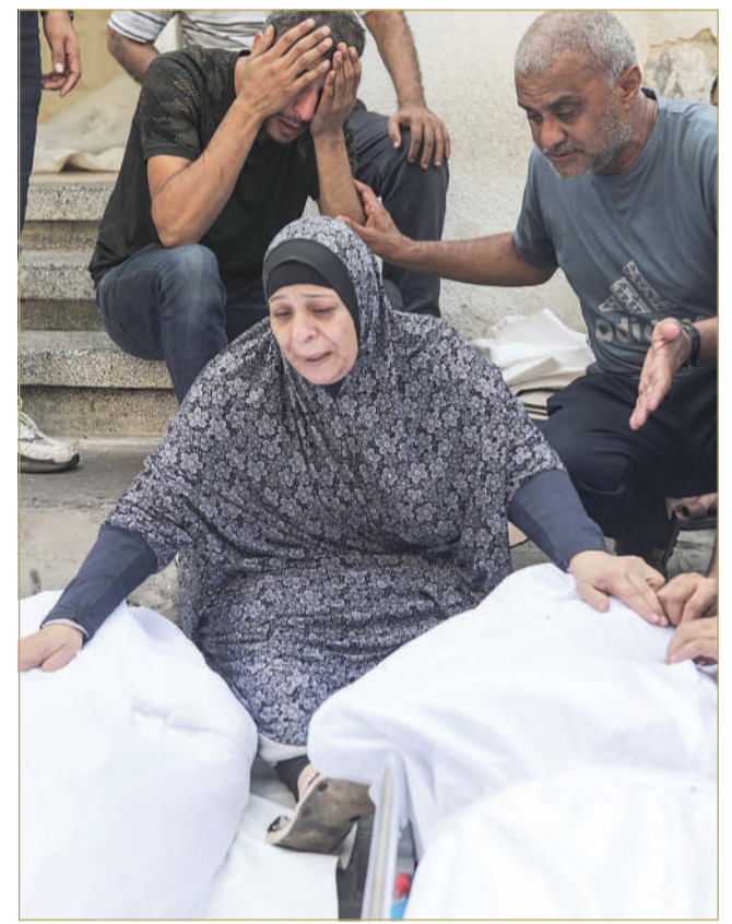
فلسطينيون أمام جناحين أحبايمهم بمستشفى الشفاء

أخذت الغارات الإسرائيلية في اليوم الخامس للحرب على قطاع غزة، أمس الأربعاء، منحى انتقامياً أكبر، واستهدفت بشكل عنيف أحياء سكنية سوتها بالأرض، وارتكبت 23 مجزرة، بقصف العائلات الآمنة في منازلها دون سابق إنذار، متبعة سياسة "الأرض المحروقة" بصورة بشعة ترقى لمستوى جرائم الحرب والإبادة الجماعية. وارتفع عدد ضحايا القصف الإسرائيلي في غزة إلى 1055 شهيداً و5184 جريحاً، وامتألت المستشفيات بالمصابين، وتوقفت محطة توليد الكهرباء الوحيدة في قطاع غزة بعد نفاذ الوقود. واعتبر مركز "بتسيلم" الحقوقي الإسرائيلي، أمس، أن إسرائيل "ترتكب جرائم حرب في قطاع غزة". وقال متحدث المركز كريم جبران: "ما تم إعلانه بشكل واضح من قبل وزير الدفاع الإسرائيلي يوأف غالانت بقطع الماء والكهرباء والوقود والمواد التموينية عن قطاع غزة الذي يضم 2.23 مليون فلسطيني جريمة حرب كاملة". وأضاف "قطاع غزة كان وما زال بحاجة إلى إمدادات بشكل يومي بما في ذلك إعلان الحصار على هذه المنطقة تحت القصف". وحذر جبران من أنه "إذا لم يتم الإسراع في إيصال المساعدات الإنسانية والطبية والمياه والكهرباء إلى الناس تحت القصف والقتل، فإن هذا شكل آخر من أشكال القتل والتنصيف والعقوبات البربرية التي يفعلها الجانب الإسرائيلي بتصريحات رسمية". وذكر أن "تقديرات الأمم