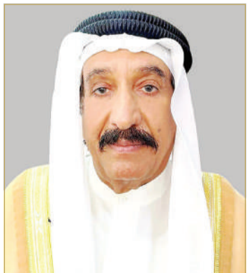
الشيخ محمد بن حمد

وأعرب عن اعتزازه بهذا البرنامج الوطني والحقوقى المتميز، ودوره في تحقيق الأهداف السامية للعملية الإصلاحية والعدالة الاجتماعية، وإرساء القانون وتشريعاته المنظمة لكرامة الإنسان البحريني، عبر إعادة المحكوم للمجتمع في نهج راسخ لتوطين وإعطاء الفرصة له، ما يعزز الأمن والأمان والألفة الاجتماعية، مثمناً دور وزير الداخلية في الارتقاء بمشروعات العقوبات البديلة، ومن ضمنها برنامج السجون المفتوحة، منوها بدعمه الحثيث والمستدام وحرصه الواضح على تعزيز دور الشراكة المجتمعية في تنفيذ هذه النوعية من البرامج المشرفة، ما له الأثر المشرف على القطاع القانوني.