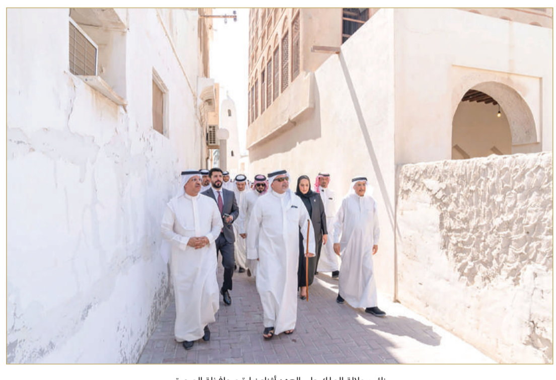
نائب جلالة الملك ولي العهد أثناء زيارة محافظة المحرق

المنامة - بنا وجه نائب جلالة الملك ولي العهد صاحب السمو الملكي الأمير سلمان بن حمد آل خليفة، أثناء زيارة سموه محافظة المحرق، للبدء بالإجراءات الفورية لخطة تطوير مدينة المحرق، من أعمال الاستملاك والتصاميم التفصيلية والتنفيذ، كما وجه سموه للإسراع في استكمال مشروع مسار اللؤلؤ. وقال سموه إن المحرق كما قال عنها صاحب الجلالة ملك البلاد المعظم ”أم المدن“، وهي مدينة العراقة والأصالة، وتاريخها ممتد ضمن حضارة الوطن الذي نعتز ونفتخر به، ونؤكد أن المحرق برجلاتها ونسائها لها مكانة خاصة في قلوب جميع أهل البحرين، وأهلها لهم في التاريخ الوطني قصص ملهمة، وهي محل اعتزاز وقُدوة لأجيال الحاضر والمستقبل. (04) و(05)