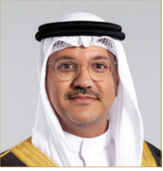
رئيس هيئة البحرين للثقافة والآثار

وغير المادي. وتواصل الهيئة جهدها في وضع اسم المدينة على خارطة السياحة الثقافية والسياحية العالمية، إذ استطاعت وضع مسار اللؤلؤ وما يحتويه من بيوت ومواقع وساحات على لائحة التراث الإنساني العالمي لمنظمة اليونسكو، وتقوم الهيئة بتفعيل المواقع الثقافية التي تشهد لعراقة المدينة وأهميتها التاريخية.