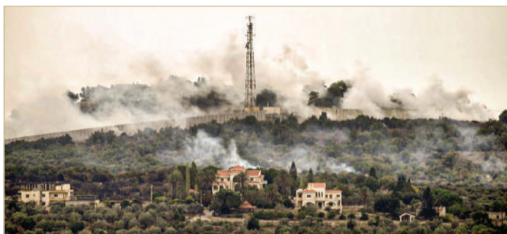
تصاعد الدخان جراء القصف على بلدة الضهيره

بالاتجاه، من لبنان. وتحدثت القناة 14 الإسرائيلية عن تسليح مسلحين إلى منطقة معيان باروخ في الشمال وأبناء عن تسليح 20 طائرة مسيرة. وتداول رواد مواقع التواصل الاجتماعي فيديو لاستهداف مركبة إسرائيلية على الحدود بين لبنان وإسرائيل من قبل حزب الله.