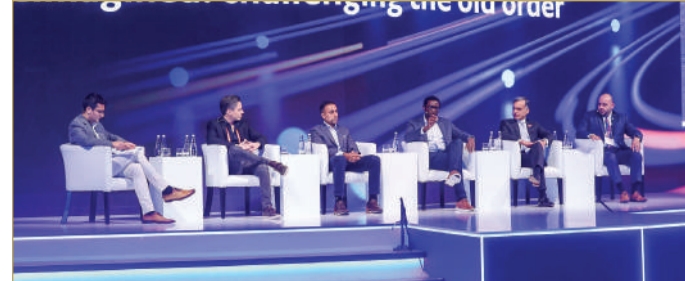
جانب من جلسة النقاش

شركة طيور الدواجن Hainan Poultry Company