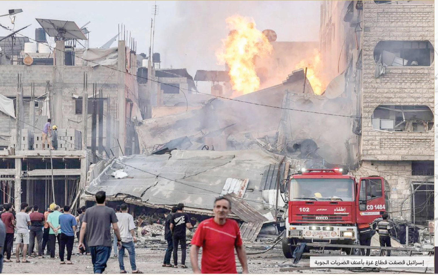
إسرائيل قصفت قطاع غزة باعنف الصربات الجوية

international@albiladpress.com 15 البلاد