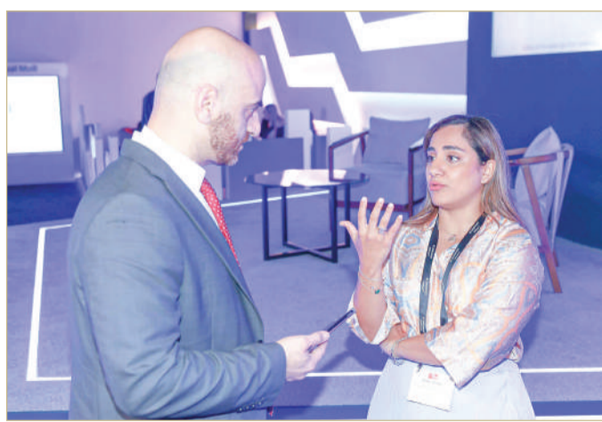
الصفار مصرحة لـ "البلاد"

وقالت على هامش مشاركتها في منتدى "مستقبل التكنولوجيا المالية 2023" أمس، إن "فيزا" وقعت اتفاقية شراكة مع شركة "ترايب" البحرينية من أجل إطلاق منتجات وحلول في المملكة وخارجها فيما يتعلق بالبنوك المفتوحة. وأشارت إلى أن الخطوة ستتيح