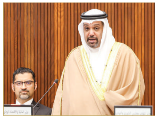
الشيخ سلمان بن خليفة

وعلى وقع جني الثمار، وإنفاذًا للتوجيهات الملكية السامية وموافقة سمو ولي العهد رئيس الوزراء وجه رئيس مجلس أمناء وقف عيسى بن سلمان التعليمي الخيري رئيس مجلس إدارة صندوق العمل سمو الشيخ عيسى بن سلمان بن حمد آل خليفة بإطلاق حزمة من البرامج الجديدة هي الأكبر منذ تأسيس "تمكين"، تستهدف دعم 50 ألف بحريني في السنة، تركز على 3 مبادرات رئيسية. وعلى الصعيد ذاته، خرج وزير العمل جميل حميدان ليعلن اللانحة التفسيرية لتوجيهات رئيس مجلس إدارة صندوق العمل سمو الشيخ