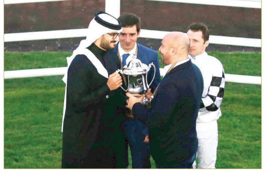
سمو الشيخ عيسى بن سلمان يتوج بطل نسخة السباق