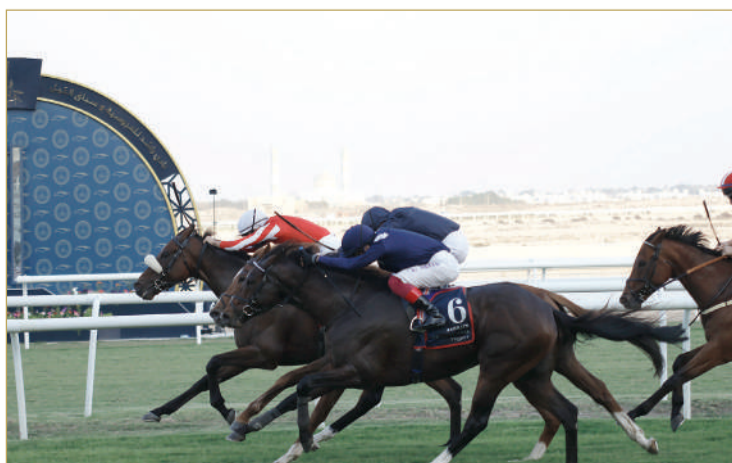
صراع قوي بين الجياذ العالمية

أما سباق النسخة الثانية عام 2020 فقد شهد سيطرة الجياذ البحرينية على المراكز الأولى عبر فوز الجواد "سمسير" لإسطبل فيكتوربيوس فيما جاء خلفه الجواد "جلوبال جاينت" لإسطبل العاديات، تلاه الجواد الأيرلندي "سوفرين" ثالثاً ثم "بورت ليونز" لإسطبل فيكتوربيوس رابعاً، فيما حقق الجواد البريطاني "لورد غليترز" اللقب في النسخة الثالثة 2021، فيما شهدت النسخة الرابعة الفوز الإماراتي الأول باللقب عبر الجواد "دبي فيوتشر".