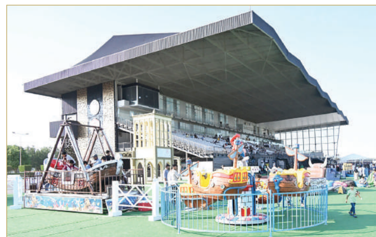
فعاليات ترفيهية تنتظر جمهور السباق