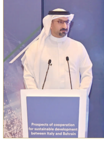
وزير الصناعة والتجارة

وفيما يتعلق بالواردات البحرينية، تحتل إيطاليا المرتبة الأولى في القطع