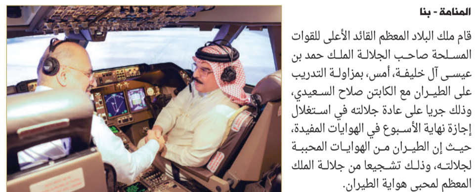
المنامة - بنا

قام ملك البلاد المعظم القائد الأعلى للقوات المسلحة صاحب الجلالة الملك حمد بن عيسى آل خليفة، أمس، بمزاولة التدريب على الطيران مع الكابتن صلاح السعدي، وذلك جرياً على عادة جلالته في استغلال إجازة نهاية الأسبوع في الهوايات المفيدة، حيث إن الطيران من الهوايات المحببة لجلالته، وذلك تشجيعاً من جلالة الملك المعظم لمحبّي هواية الطيران.