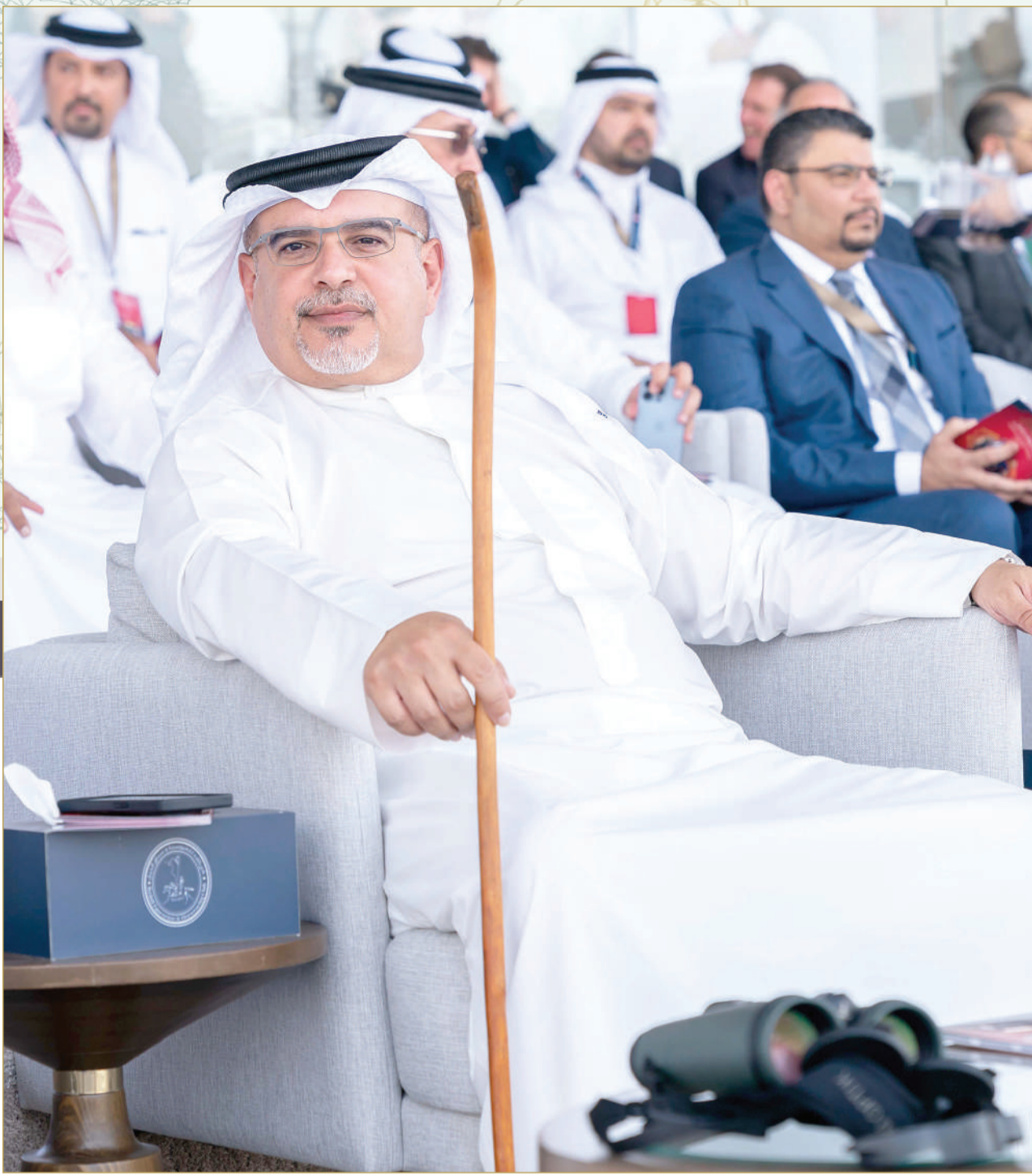
سمو ولي العهد رئيس الوزراء لدى حضوره سباق العام الماضي