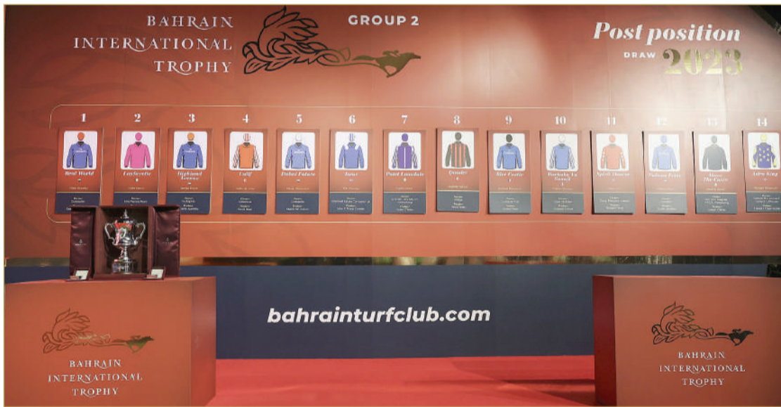
بوابات الانطلاق للجياذ المشاركة في كأس البحرين الدولي