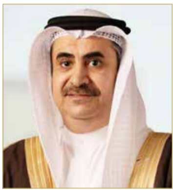
النائب العام علي البوعيين

الطفل، حيث بلغ عدد المستفيدين من البرنامج 869 مستفيداً. ويعد هذا المشروع خطوة مهمة نحو حماية حقوق الأطفال، وتعزيز عملية العدالة فيما يتعلق بالتحقيقات الجنائية. ومن المؤمل أن يشكل المشروع نموذجاً يحتذى به في المنطقة في مجال حماية حقوق الطفل وتوفير بيئة آمنة له أثناء عملية التحقيق.