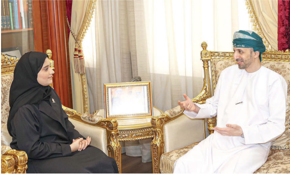
"البلاد" تحاور سفير سلطنة عُمان لدى مملكة البحرين

ولفت إلى أن رؤيتي البلدين لديهما تطلعات طموحة ومتشابهة نحو التنويع الاقتصادي، الأمر الذي يسهم في فتح الفرص للاستثمار في القطاعات الداعمة لهذه الغايات ومنها الاستثمار في الأمن الغذائي، لافتًا إلى أن هذا نتاج عمل اللجنة العمانية البحرينية المشتركة التي تعمل على تعزيز آفاق التعاون بين البلدين الشقيقين في العديد من المجالات الاقتصادية والاستثمارية؛ لتحقيق التكامل بين الرؤيتين.