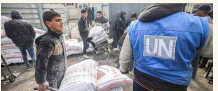
تارزون فلسطينيون يتلقون مساعدات في مركز "الأونروا" في غزة