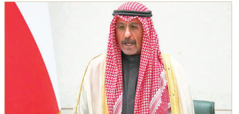
الشيخ محمد صباح السالم أدى اليمين الدستورية نائباً لأمير الكويت