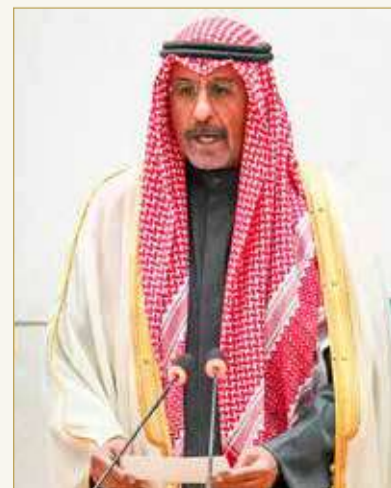
محمد صباح السالم يؤدي اليمين الدستورية

أدى رئيس مجلس الوزراء الكويتي سمو الشيخ محمد صباح السالم الصباح، أمس، اليمين الدستورية نائبا لأمير دولة الكويت صاحب السمو الشيخ مشعل الأحمد الجابر الصباح، في جلسة خاصة لمجلس الأمة.