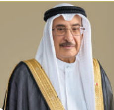
معالي الشيخ خالد بن عبدالله آل خليفة نائب رئيس مجلس الوزراء