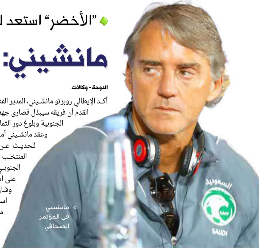
مانشيني في المؤتمر الصحافي

أكد الإيطالي روبرتو مانشيني، المدير الفني للمنتخب السعودي لكرة القدم أن فريقه سيبدل قصارى جهده من أجل الفوز على كوريا الجنوبية وبلوغ دور الثمانية بكأس آسيا 2023. وعقد مانشيني أمس الإثنين مؤتمراً صحافياً للحديث عن المواجهة المرتقبة بين المنتخب السعودي ونظيره الكوري الجنوبي والمقررة مساء الثلاثاء على استاد المدينة التعليمية. وقال مانشيني إن الأخضر استعداد لهذه المباراة مثل أي مباراة أخرى، معرفًا عن سعاده بمواجهة منتخب قوي يضم العديد من