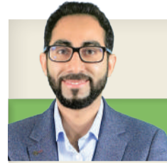
* أمين التاجر @ameenaltajer