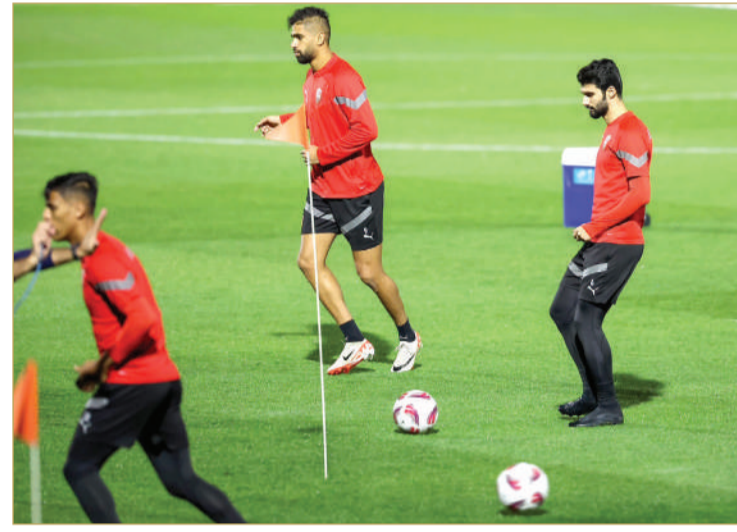
الاتحاد البحريني لكرة القدم

رفع المنتخب الوطني الأول لكرة القدم حدة استعداداته، وذلك للمواجهة المرتقبة التي تجمعها بظهير منتخب اليابان، يوم غد الأربعاء عند الساعة 2.30 ظهرًا على ملعب استاد الثمامة المونديالي، ضمن مباريات دور 16 منافسات النسخة 18 لنهائيات كأس آسيا قطر 2023.