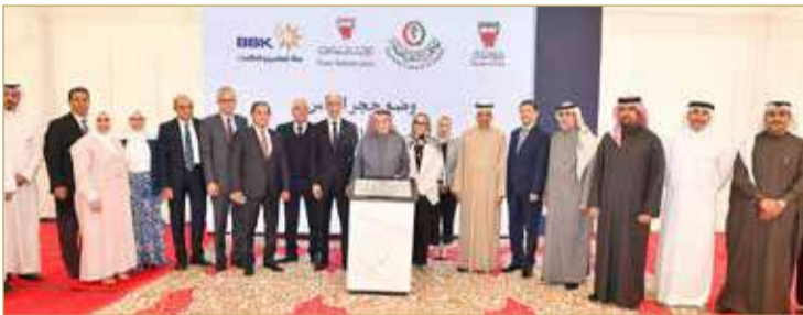
رئيس المجلس الأعلى للصحة يضع حجر الأساس

أكد رئيس المجلس الأعلى للصحة الفريق طبيب الشيخ محمد بن عبدالله آل خليفة، الحرص على المضي قدما في تنفيذ مزيد من المشروعات والمرافق التي تدعم تطوير منظومة الخدمات الصحية بمملكة البحرين. جاء ذلك لدى وضعه حجر الأساس لمركز بنك البحرين والكويت الصحي، في منطقة قلالي، ويعتبر هذا المشروع الأكبر من نوعه على مستوى البحرين. بدوره، قال وزير الأشغال إبراهيم الحواج إن المساحة الإجمالية للمشروع 6828 مترا مربعا، ويتكون مبنى المركز من طابقين، ويشمل الطابق الأرضي 14 عيادة استشارية، و14 غرفة فحص للمرضى، وقسما للطوارئ بسعة 12 سريرا، في حين يتضمن الطابق الأول