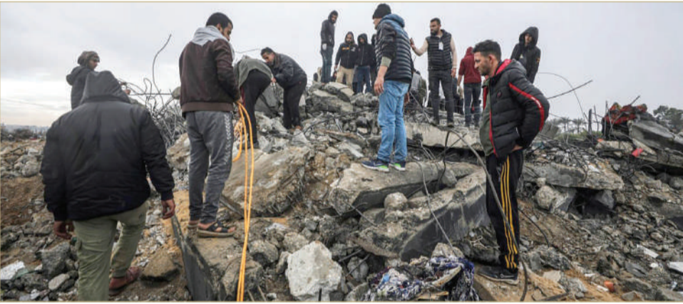
فلسطينيون يبحثون بين أنقاض مبنى مدمر بعد غارات إسرائيلية في دير البلح بقطاع غزة

الإثنين، ارتفاع حصيلة القصف الإسرائيلي والعمليات البرية في قطاع غزة إلى 26637 شهيداً، بينهم ما يزيد على 7100 امرأة أكثر من 10400 طفل، وذلك منذ بدء العمليات العسكرية في غزة في السابع من أكتوبر. وأضافت الوزارة أن نحو 65387 شخصاً أصيبوا منذ اندلاع الحرب، مؤكدة أن عدداً من الضحايا ما زالوا تحت الركام وفي الطرقات يمنع الاحتلال وصول طواقم الإسعاف والدفاع المدني الوصول إليهم. وقدرت وزارة الصحة أن عدد المفقودين والعالقين تحت الأنقاض يتجاوز 8 آلاف شخص. وقالت الوزارة إن عدد من استشهدوا في الضفة الغربية بلغ 352 شهيداً، بينهم 86 طفلاً، فيما زاد عدد الجرحى على 4 آلاف جريح.