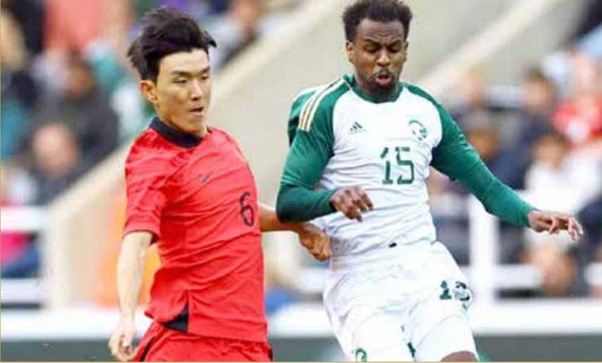
مواجهة سابقة بين السعودية وكوريا الجنوبية

التاريخ يقف إلى جانب "الأخضر" أمام "مباري تايجوك"