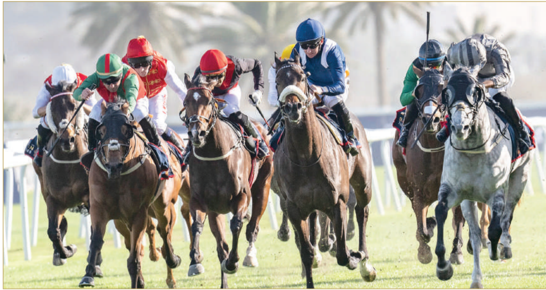
نخبة الجياد تتنافس في السباق الكبير

السباقات الموسمية والبطولات الدولية، ما جعلها محط اهتمام لاستقطاب جياد الإسطبلات من مختلف أنحاء العالم. ويترقب جمهور ومتابعو سباق الخيل اليوم الثلاثاء إعلان قائمة الجياد المشاركة في السباق الكبير، عبر إجراء قرعة التداخل النهائية، بعدما سجل عدد الجياد المسجلة في التداخل المبدئية، التي تمت باليومين الماضيين، مشاركة كبيرة بلغت 134 جوادًا في الأشواط الثمانية للسباق، إذ شهدت القائمة تسجيل نخبة الجياد في الإسطبلات البحرينية، في مؤشر ينذر بمنافسات قوية ومثيرة مرتقبة بين نخبة الجياد.