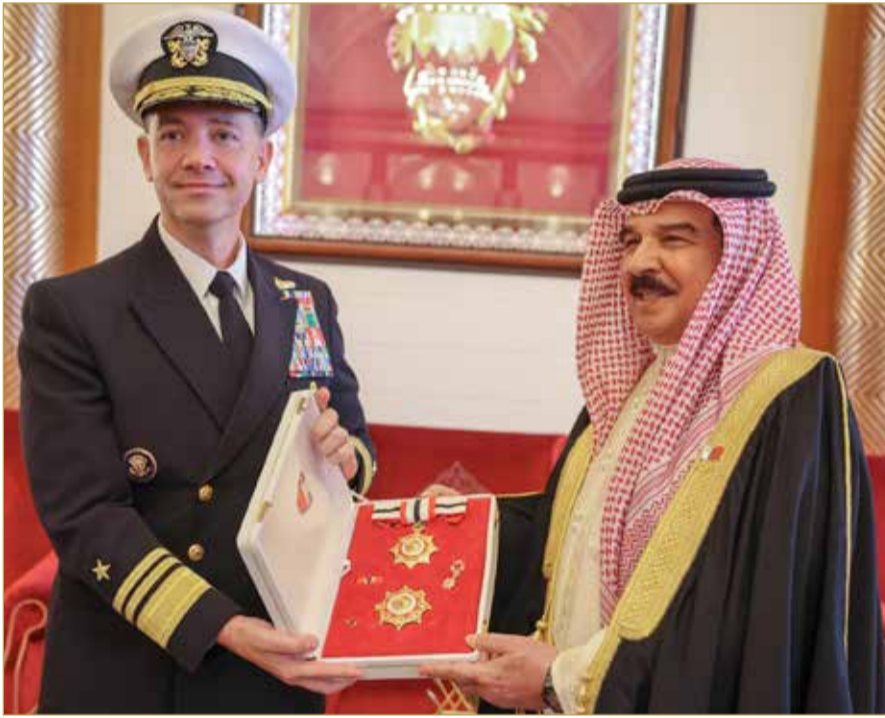
جلالة الملك المعظم يمنح قائد الأسطول الخامس وسام البحرين من الدرجة الأولى

استقبل ملك البلاد المعظم القائد الأعلى للقوات المسلحة صاحب الجلالة الملك حمد بن عيسى آل خليفة، أمس في قصر الصافية، قائد القوات البحرية بقيادة المركزية الأميركية قائد الأسطول الخامس الفريق بحري تشارلز برادفورد كوبر؛ للسلام على جلالتهم بمناسبة انتهاء فترة عمله.