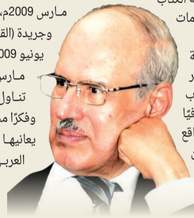
محمد جابر الأنصاري

تتعدد الذكريات مع المفكر البحريني المعروف الدكتور محمد جابر الأنصاري الذي تربطني به علاقة قوية جداً. فقد كان حريصاً على توثيق تراثنا الثقافي والحضاري، ووفقاً لنصيحته وتشجيعه أصدرت كتاب (واقع الحركة الفكرية في البحرين) في عام 1993م فنال إعجابه، فقال هذا الكتاب يفضل أن يطلع عليه جلالة الملك المعظم عندما كان ولياً للعهد لأنه مهم جداً بتراثنا الفكري والثقافي. قام بترتيب مقابلة صاحب الجلالة الملك حمد بن عيسى آل خليفة ملك البلاد المعظم في عام 1993م حين كان ولياً للعهد، وسلمت جلالتة الكتاب بحضور الدكتور الأنصاري، فأعجب به كثيراً لما احتواه من معلومات وفيرة حول الحركة الفكرية في البحرين. وعندما قررت اللجنة الأهلية لتكريم رواد الفكر والإبداع بمملكة البحرين في اجتماعها في يناير 2008م تكريم الدكتور محمد جابر الأنصاري في عام 2009م، وجدت الفرصة سانحة لإصدار كتاب توثيقي عن سيرة حياته وفكره، فقد تبني مشروعاً فكرياً وثقافياً بالغ الأهمية يتمثل في دراسة البنيين الذهنية والمجتمعية للواقع العربي، وهو المشروع الذي نال اهتمام النخب المثقفة في الوطن العربي.