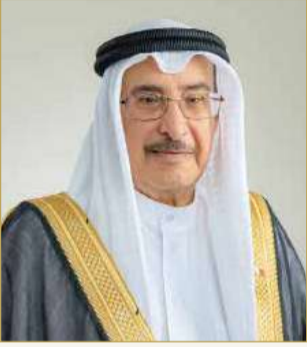
الشيخ خالد بن عبدالله

ترأس نائب رئيس مجلس الوزراء الشيخ خالد بن عبدالله آل خليفة، الاجتماع الاعتيادي الأسبوعي لمجلس الوزراء، الذي عقد أمس بقصر القضيبة. وأكد المجلس مواصلة تبني المبادرات التي تدعم الأمن البيئي وتعزيز الشراكة المجتمعية في تحقيق الأهداف البيئية، في ضوء الإشارة إلى يوم البيئة الوطني، الذي يصادف 4 فبراير من كل عام. وقرر المجلس الموافقة على مذكرة مجلس الخدمة المدنية بشأن إعادة هيكلة عدد من الوزارات والجهات الحكومية؛ بهدف تحسين الأداء وزيادة الكفاءة، والموافقة على مذكرة اللجنة الوزارية للشؤون المالية والاقتصادية والتوازن المالي بشأن تنفيذ عدد من المشروعات بالتعاون مع القطاع الخاص، والموافقة على مذكرة اللجنة