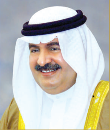
سمو الشيخ علي بن خليفة

وتلقى ولي العهد نائب القائد الأعلى للقوات المسلحة رئيس مجلس الوزراء صاحب السمو الملكي الأمير سلمان بن حمد آل خليفة، برقية تهنئة من مستشار صاحب السمو الملكي ولي العهد رئيس مجلس الوزراء، سمو الشيخ علي بن خليفة آل خليفة، رفع فيها أسمى آيات التهاني والتبريكات بمناسبة الذكرى السادسة والخمسين لتأسيس قوة دفاع البحرين، منوها بالدعم اللامحدود من سموه، والذي أسهم في تطوير إمكانات قوة الدفاع وتعزيز قدراتها لتظل حامية للوطن ورمزاً للعزة وداعمة للمسيرة التنموية الشاملة بقيادة جلالة الملك القائد الأعلى للقوات المسلحة.