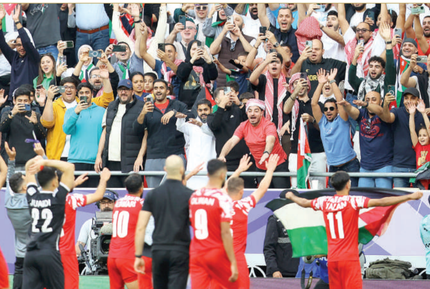
المنتخب الأردني حقق الإنجاز

القادمة والتي تعد الأهم في تاريخ الكرة الأردنية حتى الآن، هل سيواصل أبناء الحسين عموته كتابة التاريخ أم يتوقف الحلم عند هذه المرحلة؟