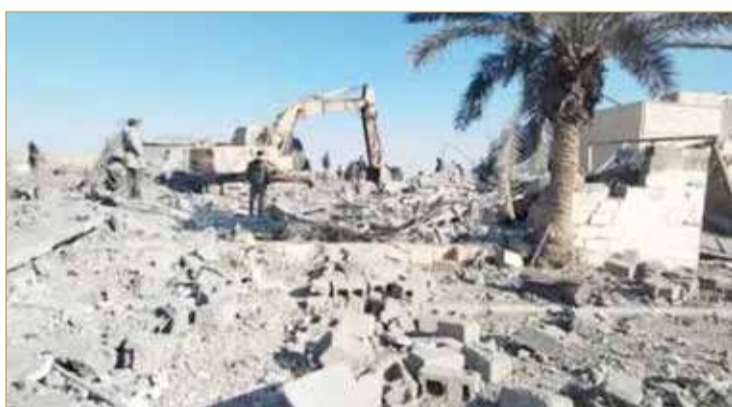
الدمار في مدينة القائم العراقية بعد القصف الأميركي

إيران وستركز على أهداف خارجها. وأعلن بايدن أن الجيش الأميركي وجه سلسلة ضربات على منشآت في العراق وسوريا ليل الجمعة يستخدمها الحرس الثوري الإيراني والفصائل المسلحة التابعة له لمهاجمة القوات الأميركية. وفي وقت سابق من أمس، قال المتحدث العسكري باسم جماعة الحوثي يحيى سريع، إن الولايات المتحدة وبريطانيا شنتا 48 غارة جوية على بلدات يمنية عدة في الساعات الماضية.