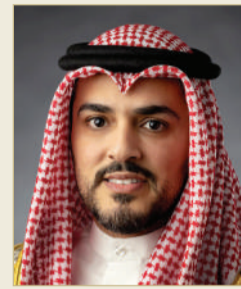
الشيخ علي بن خليفة بن محمد

صدر عن ملك البلاد المعظم صاحب الجلالة الملك حمد بن عيسى آل خليفة أمر ملكي رقم (11) لسنة 2024 بتعيين أمين عام للمؤسسة الملكية للأعمال الإنسانية، فيما يلي نصه: