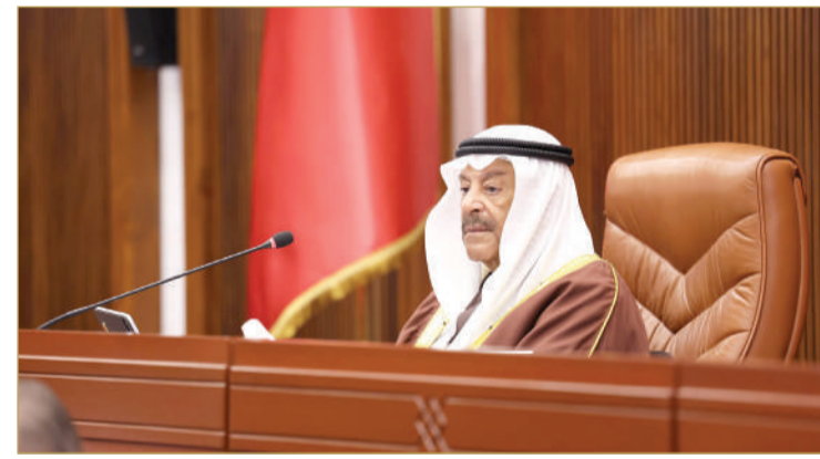
رئيس مجلس الشورى