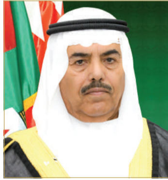
الفريق الركن عبدالله النعيمي

تلقى ملك البلاد المعظم القائد الأعلى للقوات المسلحة صاحب الجلالة الملك حمد بن عيسى آل خليفة، برقية تهنئة من وزير شؤون الدفاع الفريق الركن عبدالله بن حسن النعيمي، رفع فيها إلى مقام الكريم لصاحب الجلالة الملك المعظم، أسمى آيات التهاني والتبريكات؛ بمناسبة الذكرى السادسة والخمسين لتأسيس قوة دفاع البحرين، معرباً عن بالغ فخره واعتزازه بهذه المناسبة العظيمة، وبالمستوى المشرف الذي وصلت إليه قوة دفاع البحرين، بفضل الله سبحانه وتعالى ثم بفضل جلالتهم، داعياً الله القدير أن يمن على جلالتهم بموفور الصحة والسعادة وطول العمر، ولقوة دفاع البحرين المزيد من التطور في ظل قيادة جلالتهم الحكيمة.