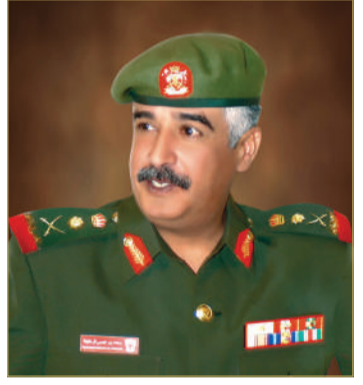
سمو رئيس الحرس الوطني

واهتمام صاحب السمو الملكي ولي العهد نائب القائد الأعلى للقوات المسلحة رئيس مجلس الوزراء لقوة دفاع البحرين ساهم بشكل كبير في تطوير هذا الصرح العسكري الشامخ وازدهاره، حتى بات يتمتع بمستويات متقدمة من الجاهزية القتالية والكفاءة العسكرية من خلال ما تشهده قوة دفاع البحرين من تطور واسع في إمكانياتها وقدراتها العسكرية باعتبارها خط الدفاع الأول عن سيادة المملكة ومكتسباتها الحضارية والتنموية. داعياً سموه المولى العلي القدير أن يعيد هذه المناسبة العزيرة على صاحب السمو الملكي ولي العهد نائب القائد الأعلى للقوات المسلحة رئيس مجلس الوزراء وهو بنعم بموفور الصحة والعافية، وأن يمده بعونه وتوفيقه لمواصلة الدعم اللامحدود الذي يوليه لقوة دفاع البحرين في ظل قيادة