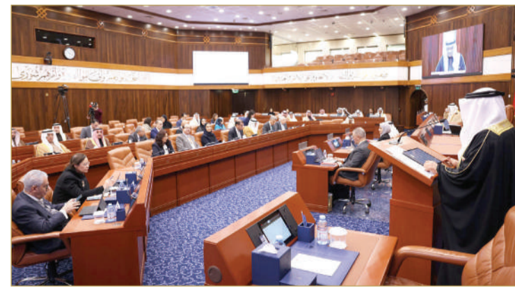
جانب من جلسة مجلس الشورى أمس