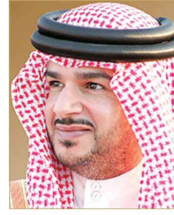
سمو الشيخ علي بن عيسى بن سلمان

بن عيسى بن سلمان آل خليفة؛ بمناسبة الذكرى السادسة والخمسين لتأسيس قوة دفاع البحرين. ورفع سمو وزير شؤون الديوان الملكي إلى صاحب السمو الملكي ولي العهد، نائب القائد الأعلى للقوات المسلحة، أسمى آيات التهاني والتبريكات بهذه المناسبة الوطنية، معرباً سموه عن بالغ الفخر والاعتزاز بما وصلت إليه قوة دفاع البحرين التي أسس جلالته ركائزها الأولى حتى أصبحت اليوم الحصن المنيع للوطن وحامية مكتسباته ومقدراته. كما أشاد سموه بالدعم اللامحدود من لدن سموه والذي أسهم فيما وصلت إليه من مستويات متقدمة من الكفاءة والجهوزية العسكرية، بما يمكنها من أداء دورها الوطني في ظل رعاية ودعم صاحب الجلالة ملك البلاد المعظم القائد الأعلى للقوات المسلحة اللامحدود وتوجيهاته السديدة، متمنياً سموه لهذه القوة العسكرية مزيداً من التقدم والتطور.