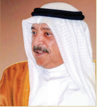
الشيخ خالد بن أحمد

تلقى ملك البلاد المعظم القائد الأعلى للقوات المسلحة صاحب الجلالة الملك حمد بن عيسى آل خليفة، برقية تهنئة من وزير الديوان الملكي الشيخ خالد بن أحمد آل خليفة، رفع فيها إلى جلالتهم خالص التهاني والتبريكات؛ بمناسبة الاحتفال بالذكرى السادسة والخمسين لتأسيس قوة دفاع البحرين، مشيداً بما تحققت لهذا الصرح الوطني الكبير، في ظل رعاية جلالتهم السامية، وتوجيهاته الحكيمة، ومتابعة جلالتهم الدؤوبة لتطوير هذا الصرح الوطني الشامخ، من إنجازات عظيمة، ومن مكتسبات جليلة، على الأصعدة كافة، ما جعل قوة دفاع البحرين في أعلى مستويات الجهوية والتدريب والقدرة على الاستخدام الأمثل والفعال للتقنيات العسكرية الحديثة والمتطورة؛ لتكون قادرة على الدفاع الفعال عن حياض وطننا العزيز ومكتسباته وإنجازاته الحضارية، في جميع الأوقات والأحوال، سائلاً الله تعالى أن يحفظ جلالة الملك المعظم عزاً وذخراً، ومواصلة قيادة مسيرة الخير والنماء.