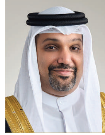
الشيخ سلمان بن خليفة

المالية والاقتصاد الوطني الشيخ سلمان بن خليفة آل خليفة، رفع فيها إلى سموه أسمى آيات التهاني والتبريكات بمناسبة الذكرى السادسة والخمسين لتأسيس قوة دفاع البحرين. وأكد أن هذه المناسبة تشكل مبعثاً للفخر والاعتزاز بفضل الإنجازات الرفيعة التي تواصل تحقيقها قوة دفاع البحرين في ظل الرعاية والاهتمام الذي تحظى به من جلالته الملك المعظم القائد الأعلى للقوات المسلحة، ومتابعة سمو ولي العهد نائب القائد الأعلى للقوات المسلحة رئيس مجلس الوزراء، لتطور هذا الدرع المنيع وتعزيز دوره المهم في الدفاع عن حياض الوطن.