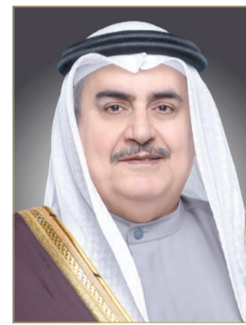
الشيخ خالد بن أحمد

جلالة الملك للشؤون الدبلوماسية الشيخ خالد بن أحمد بن محمد آل خليفة، رفع فيها إلى سموه أسمى آيات التهاني والتبريكات بمناسبة الذكرى السادسة والخمسين لتأسيس قوة دفاع البحرين، مشيداً بما وصلت إليه منظومة قوة دفاع البحرين من جهوزية عالية بفضل رعاية صاحب الجلالة ملك البلاد المعظم القائد الأعلى للقوات المسلحة، ومتابعة صاحب السمو الملكي ولي العهد نائب القائد الأعلى للقوات المسلحة رئيس مجلس الوزراء عزم من دورها في الدفاع عن الوطن والحفاظ على منجزاته ومكتسباته بكل اقتدار وكفاءة.