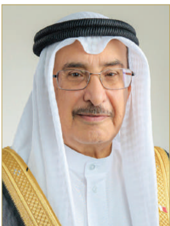
الشيخ خالد بن عبدالله

رئيس مجلس الوزراء الشيخ خالد بن عبدالله آل خليفة، رفع فيها إلى سموه أسمى آيات التهاني والتبريكات بمناسبة الذكرى السادسة والخمسين لتأسيس قوة دفاع البحرين، مؤكداً أن المواقف أثبتت منذ التأسيس وحتى هذا اليوم قدرة قوة دفاع البحرين، على الحفاظ على مقدرات الوطن بما يصون مكتسباته ويحفظه أمنه واستقراره، كما مكنتها جاهزيتها العالية واستعدادها الدائم للذود عن الحق وترسيخ الأمن والسلام الدوليين في المنطقة والعالم.