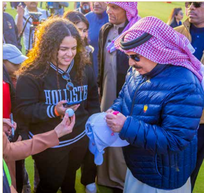
جلالة الملك المعظم يشمل برعايته الكريمة ختام منافسات النسخة الأولى لبطولة البحرين الدولية للجولف

المنامة - بنا تفضل ملك البلاد المعظم صاحب الجلالة الملك حمد بن عيسى آل خليفة، وشمل برعايته الكريمة، أمس، ختام منافسات النسخة الأولى لبطولة البحرين الدولية للجولف المقدمة من "بايكو إنرجيز"، والتي جمعت نخبة من نجوم العالم ضمن جولة دي بي ورلد العالمية للجولف، والتي استضافتها مملكة البحرين تحت رعاية كريمة من جلالة الملك المعظم على مدى 4 أيام بالنادي الملكي للجولف. وشاهد ملك البلاد المعظم جاتبا من ختام منافسات النسخة الأولى لبطولة البحرين الدولية للجولف، وقدم كيث بيبي إيجازا عن مراحل منافسات البطولة بمشاركة كوكبة من النجوم العالميين من مختلف دول العالم وكذلك من مملكة البحرين والأشقاء من المملكة العربية السعودية. وأعرب جلالته في كلمة بهذه المناسبة عن الشكر باسمه وباسم مملكة البحرين وشعبها لـ"دي بي ورلد" على دعمهم وتعاونهم للعمل على عودة الغولف الاحترافي إلى البحرين. وقال جلالته في كلمته إن مملكة البحرين من دول الريادة في المنطقة، فهي أول بلد يكتشف فيها النفط وذلك في العام 1932، وأول بلد يكون فيها ملعب غولف وذلك في العام 1934.