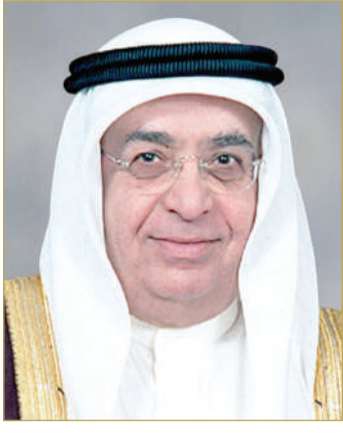
سمو الشيخ محمد بن مبارك

الأعلى للقوات المسلحة رئيس مجلس الوزراء، بمناسبة الذكرى السادسة والخمسين لتأسيس قوة دفاع البحرين. وأشاد سمو الممثل الخاص لجلالة الملك المعظم بما وصله إليه هذه المؤسسة الوطنية ومنسبها كافة ضباطاً وأفراداً من كفاءة وجهوزية عالية تبعث على الفخر والاعتزاز، وذلك لما تقوم به من دور كبير في حماية الوطن وسيادته ومنجزاته، وتعزيز أمنه واستقراره، والحفاظ على وحدته وسلامة أراضيه، في ظل ما تحظى به من دعم ورعاية من صاحب الجلالة الملك المعظم القائد الأعلى للقوات المسلحة، ومتابعة صاحب السمو الملكي ولي العهد نائب القائد الأعلى للقوات المسلحة رئيس مجلس الوزراء.