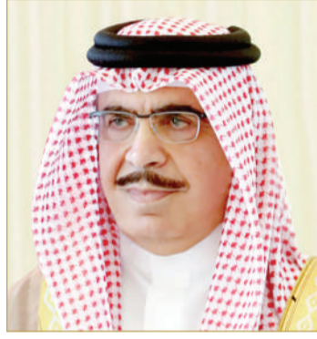
الشيخ راشد بن عبدالله

تلقى ملك البلاد المعظم القائد الأعلى للقوات المسلحة صاحب الجلالة الملك حمد بن عيسى آل خليفة، برقية تهنئة من وزير الداخلية الفريق أول ركن الشيخ راشد بن عبدالله آل خليفة، رفع فيها إلى مقام جلالتهم الكريم أسمى آيات التهاني والتبريكات بمناسبة الذكرى السادسة والخمسين لتأسيس قوة دفاع البحرين، معرباً عن بالغ الفخر والاعتزاز بما وصلت إليه قوة دفاع البحرين من مستوى رفيع من التدريب والجهوية والاستعداد الدائم للتضحية والفداء، مستحضراً جلالتهم بكل الفخر، عن اعتزازه بما حققته هذه المؤسسة الوطنية العتيقة، من قادة وضباط وأفراد، من إنجازات نوعية، بما بلغوه من مستوى رفيع من التدريب والجهوية والاستعداد الدائم للتضحية والفداء، مستحضراً جلالتهم بكل الثقة والتقدير، الدور الوطني الكبير الذي يضطلع به، بكل كفاءة واقتدار، مع منتسبي وزارة الداخلية، بالتعاون والتعاقد مع قوة دفاع البحرين والحرس الوطني لحماية مملكة البحرين وضمان استقرارها ونمائها بإذن الله، سائلاً الله تعالى أن يمتعه بموفور الصحة والعافية، وأن يحفظه ويسدد على طريق الخير خطاه.