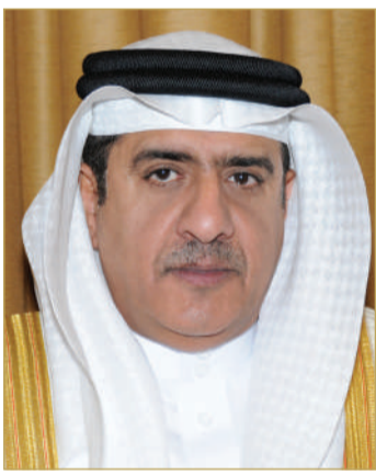
الفريق عادل الفاضل

كافة منتسبي جهاز المخابرات الوطني أسمى آيات التهاني والتبريكات بمناسبة احتفال البلاد بالذكرى السادسة والخمسين لتأسيس قوة دفاع البحرين. وأكد رئيس جهاز المخابرات الوطني أن أبناء مملكة البحرين يفتخرون بهذا الصرح الذي يمثل العزة والمنعة والدرع الحصين والسياح المنيع الذي يذود عن حمى الوطن ويحمي استقراره ويصون وحدته وإنجازاته. متمنياً لسموه ولكافة منسوبي قوة دفاع البحرين التوفيق والسداد لأداء واجباتهم في خدمة الوطن في ظل توجيهات صاحب الجلالة ملك البلاد المعظم القائد الأعلى للقوات المسلحة، داعياً المولى عز وجل أن يحفظ سموه وبمئنته بالصححة والسعادة وأن تبقى البحرين واحة أمن واستقرار. وبعث صاحب السمو الملكي ولي العهد نائب القائد الأعلى للقوات المسلحة رئيس مجلس الوزراء برقية شكر جوازية إلى رئيس جهاز المخابرات الوطني الفريق عادل الفاضل، ضمنها سموه الشكر والتقدير على تهادي ومشاعر سعاداته بمناسبة الذكرى السادسة والخمسين لتأسيس قوة دفاع البحرين. داعياً سموه المولى عز وجل أن يعيد هذه المناسبة العزيزة ومملكة البحرين تنعم بمزيد من التطور والازدهار في ظل قيادة صاحب الجلالة الملك المعظم القائد الأعلى للقوات المسلحة.