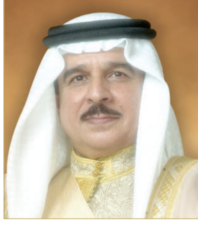
جلالة الملك المعظم