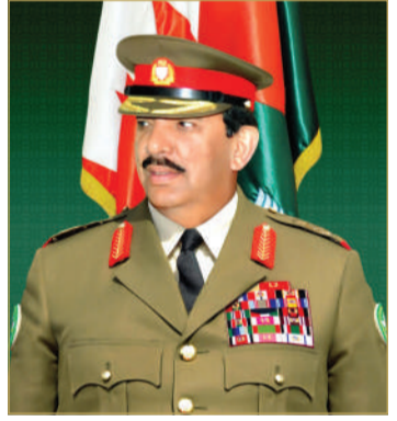
القائد العام لقوة دفاع البحرين

نائب القائد الأعلى للقوات المسلحة رئيس مجلس الوزراء هذه المناسبة العزيرة أعواماً عدّة وأزمنة مديدة وهو بنعم بموفور الصحة والسعادة وعلى وطننا الغالي بالتقدم والخير والازدهار. وقد بعث صاحب السمو الملكي ولي العهد نائب القائد الأعلى للقوات المسلحة رئيس مجلس الوزراء برفقة شكر جوابية إلى القائد العام لقوة دفاع البحرين، ضمنها سموه خالص الشكر والتقدير على الجهود المتواصلة لمعالجه وكافة منتسبي قوة دفاع البحرين لرفع مستوى الجاهزية القتالية والإدارية لقوة دفاع البحرين والذي مكنتها من المحافظة على سيادة وأمن واستقرار المملكة. مؤكداً سموه بأن قوة دفاع البحرين بفضل ما تحظى به من دعم واهتمام من صاحب الجلالة ملك البلاد المعظم القائد الأعلى للقوات المسلحة، سوف تبقى موضع اعتزاز وتقدير وثقة مع العمل الدؤوب على تطويرها المستمر، للتعامل مع مختلف المنظومات العسكرية وأحدثها، لتضاهي أفضل الممارسات الدفاعية المتقدمة، وتواكب كل ما يستجد في مختلف المجالات لعسكرية والتقنية. مجدداً سموه الإشادة بما يبذله منتسبو قوة دفاع البحرين من جهود كبيرة لتطوير مسيرة هذا الصرح العسكري الشامخ منذ مرحلة التأسيس وحتى اليوم، سائلاً الله تعالى أن يحفظه وأن يسدد على طريق الخير خطاه.