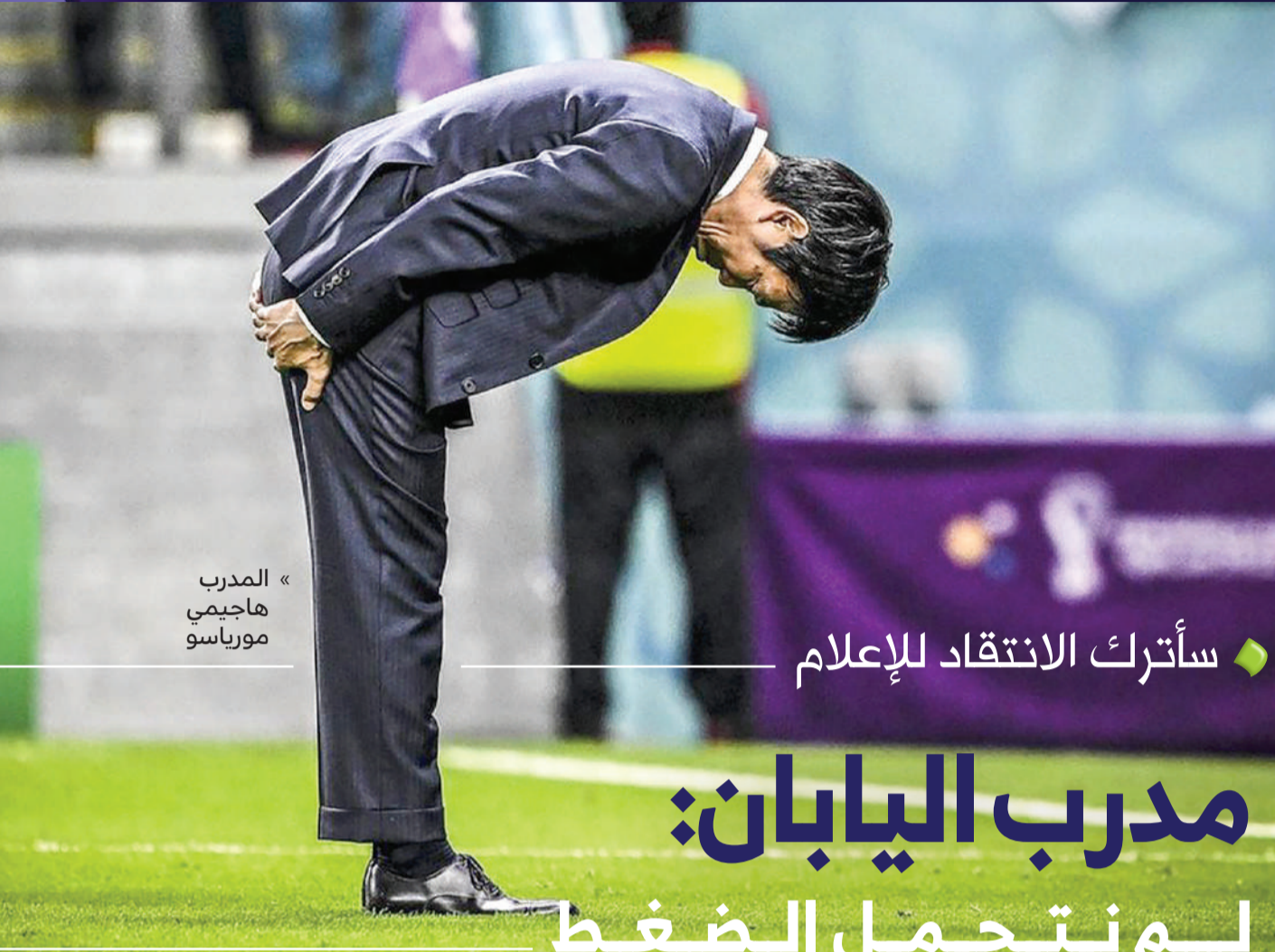
« المدرب هاجيمي مورياسو »