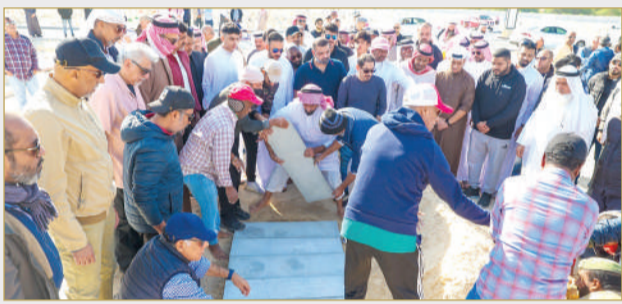
البلاد | أسامة الماجد

شيعت جموع غفيرة يوم أمس الفنان المسرحي القدير عبدالله السعداوي لمشواه الأخير بمقبرة الحنينية، بحضور عدد كبير من نجوم الفن، الذين اعتصرهم الحزن والأسى على فقد المعلم والمربي وصاحب المدرسة المتفردة في المسرح ورائد المسرح التجريبي في الخليج. وبدأ التأثر واضحًا، خصوصًا على تلاميذه الذين تعلموا منه أبجديات الوقوف على خشبة.