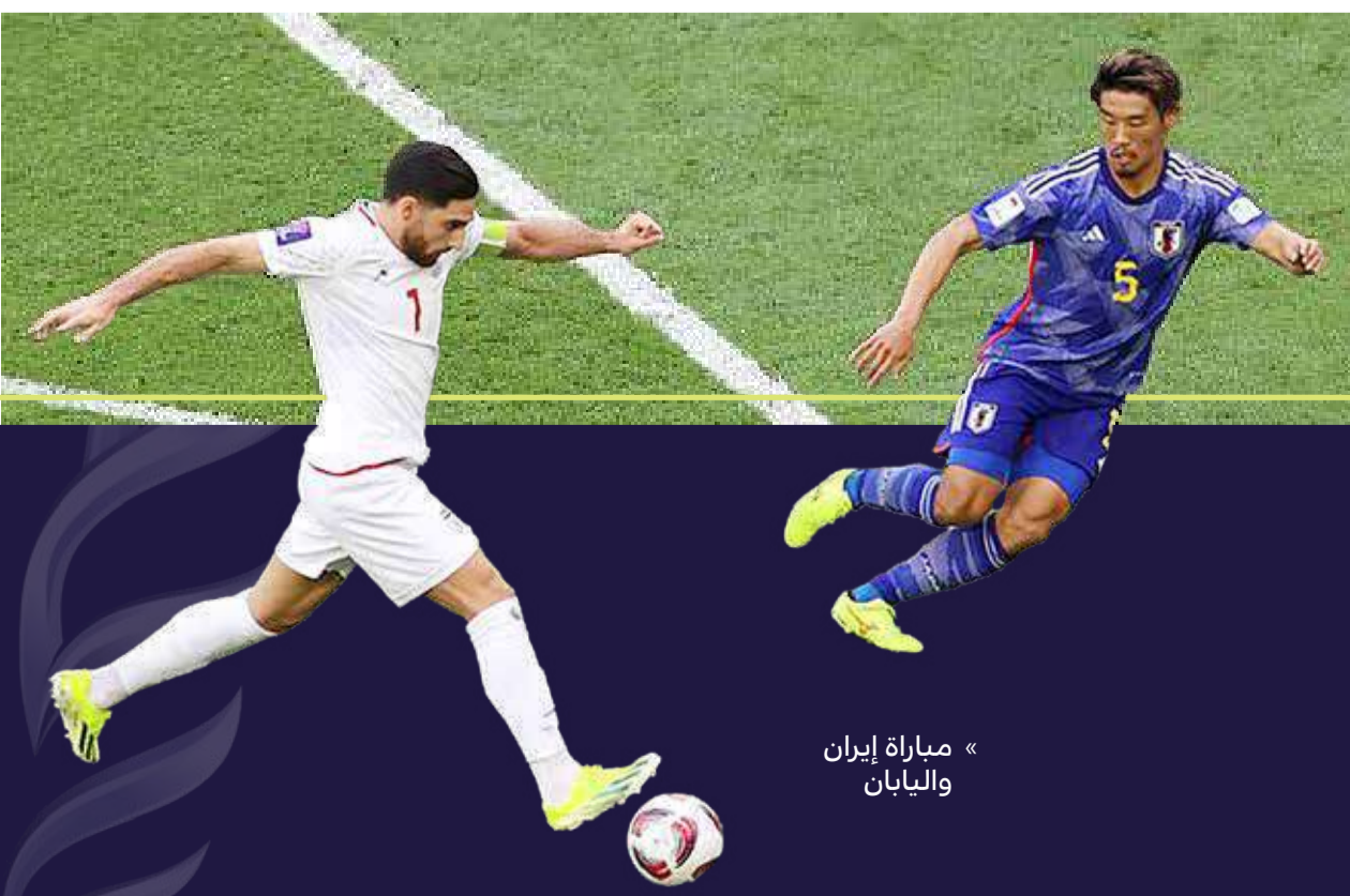
«مباراة إيران واليابان»

ويتقابل منتخب إيران في الدور قبل النهائي يوم