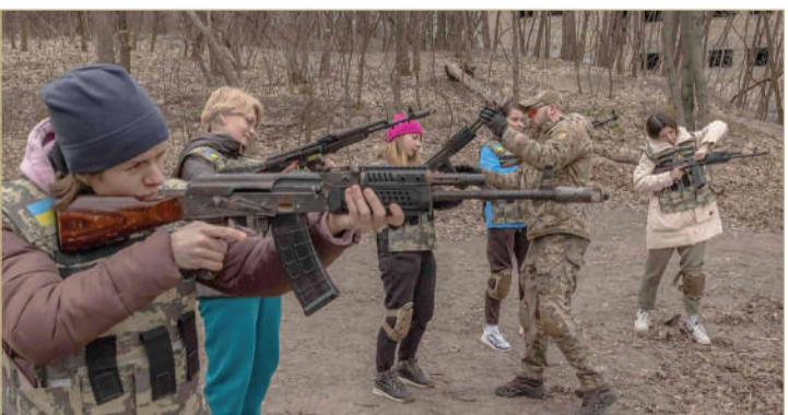
أوكرانيات مدنيات لدى حضورهن تدريباً على استخدام الأسلحة في كييف

2023. وتقول أوكرانيا إنها بحاجة ماسة إلى الأسلحة والذخيرة لمقاومة الهجمات الروسية المتعددة، مؤكدة إمكانية احتواء الجيش الروسي إذا امتلكت ما يكفي من القذائف.