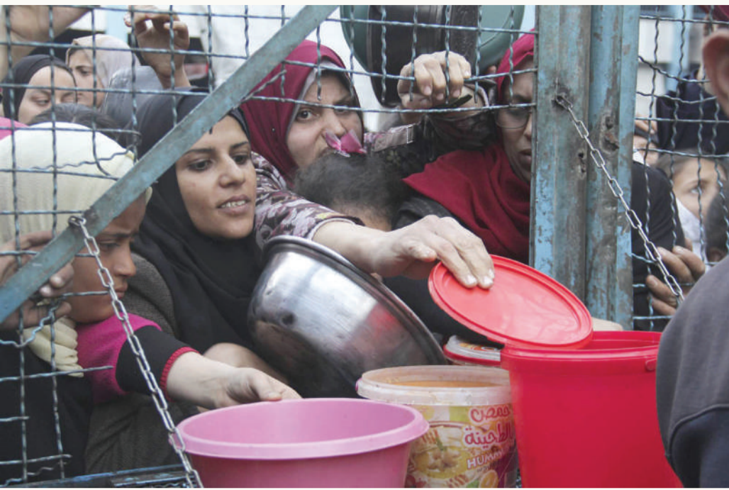
فلسطينيون يصطفون لاستلام وجبات مجانية في مخيم جباليا للاجئين بقطاع غزة "أب"

لاتفاق بات قريباً، لكن التفاؤل الحذر موجود، وقال "لا يمكن أن نعلن أي نجاحات، ولكن لدينا أمل".