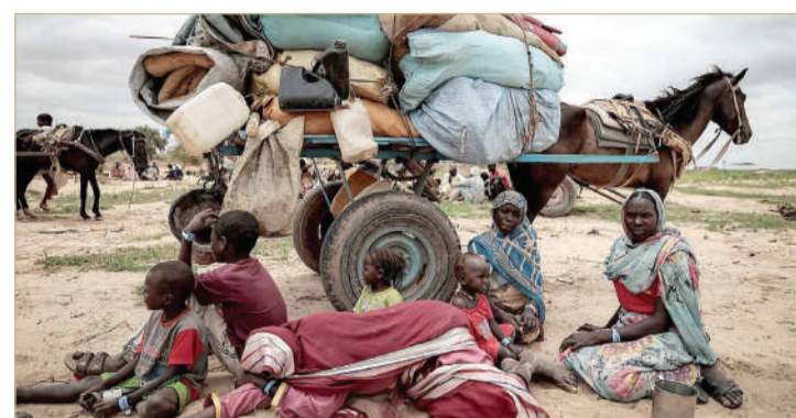
الحرب في السودان أدت إلى نزوح الملايين

المشروع ودعت لتشكيل كتلة مدنية لوقف الحرب. يشار إلى أنه كان من المفترض أن يشهد شهر رمضان الحالي وفقاً لإطلاق النار بين الجيش بقيادة عبد الفتاح البرهان وقوات الدعم السريع التي يتزعمها محمد حمدان دقلو، إلا أن المساعي باءت بالفشل، على الرغم من أن مجلس الأمن أقر مطلع الشهر الحالي (مارس 2024) مشروع قرار يدعو إلى هدنة برمان، وأيدته 14 دولة.