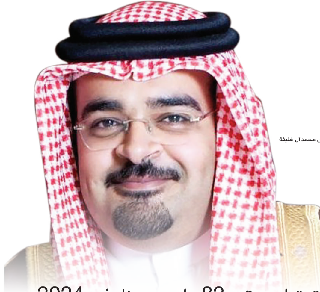
الشيخ حمد بن محمد آل خليفة