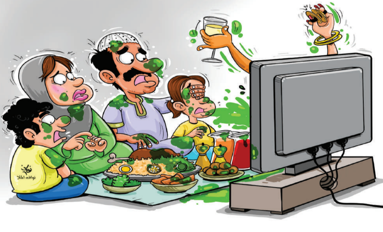
كاركاتير خفاف المير

الشباب البحريني هو من ستوكل إليه عملية بناء المستقبل