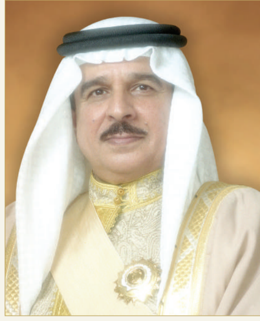
جلالة الملك المعظم