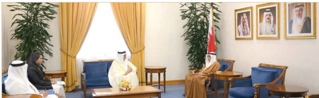
الممثل الخاص لجلالة الملك المعظم يستقبل وزير الخارجية