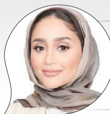
مرحلة محورية فارقة أمل رمضان