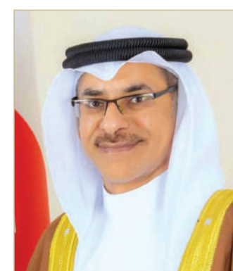
وزير التنمية الاجتماعية

ثم وزير التنمية الاجتماعية أسامة العصفور، ما تحقق من منجزات وطنية بارزة على جميع المستويات، في إطار ترسيخ وتوجيه قيم ثقافة التعاون والتضامن بين مختلف القطاعات، مؤكداً أهمية الشراكة المجتمعية والانتماء الوطني في تحقيق الأثر التنموي المستدام، والتي تعكس النهضة الحضارية بقيادة ملك البلاد المعظم صاحب الجلالة الملك حمد بن عيسى آل خليفة، ضمن أطر دولة القانون والمؤسسات بدعم ومساندة من ولي العهد رئيس مجلس الوزراء صاحب السمو الملكي الأمير سلمان بن حمد آل خليفة. كما أشاد بجهود وزير الداخلية الفريق أول الشيخ راشد بن عبدالله آل خليفة، رئيس لجنة متابعة تنفيذ الخطة الوطنية لتعزيز الانتماء