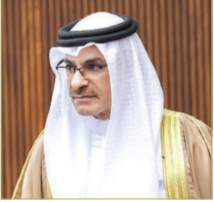
وزير التنمية الاجتماعية

البلاد كشف وزير التنمية الاجتماعية أسامة العصفور عن وجود أكثر من 130 جمعية خيرية لديها تصريح وتحويل لجمع الأموال والتي تقوم بأدوار اجتماعية. وأكد العصفور أنه لا يمكن جمع الأموال لمعالجة شخص مريض أو شخص فقير أو تزويج وبعد ذلك يتم صرف هذه الأموال في فعاليات أو أمور مغايرة عن الغرض الذي جمعت لأجله، مختتماً أنه لا بد أن يكون غرض الجمع واضحا لعيان الناس، ليكونوا على بينة من أمرهم فيما يتبرعون به.