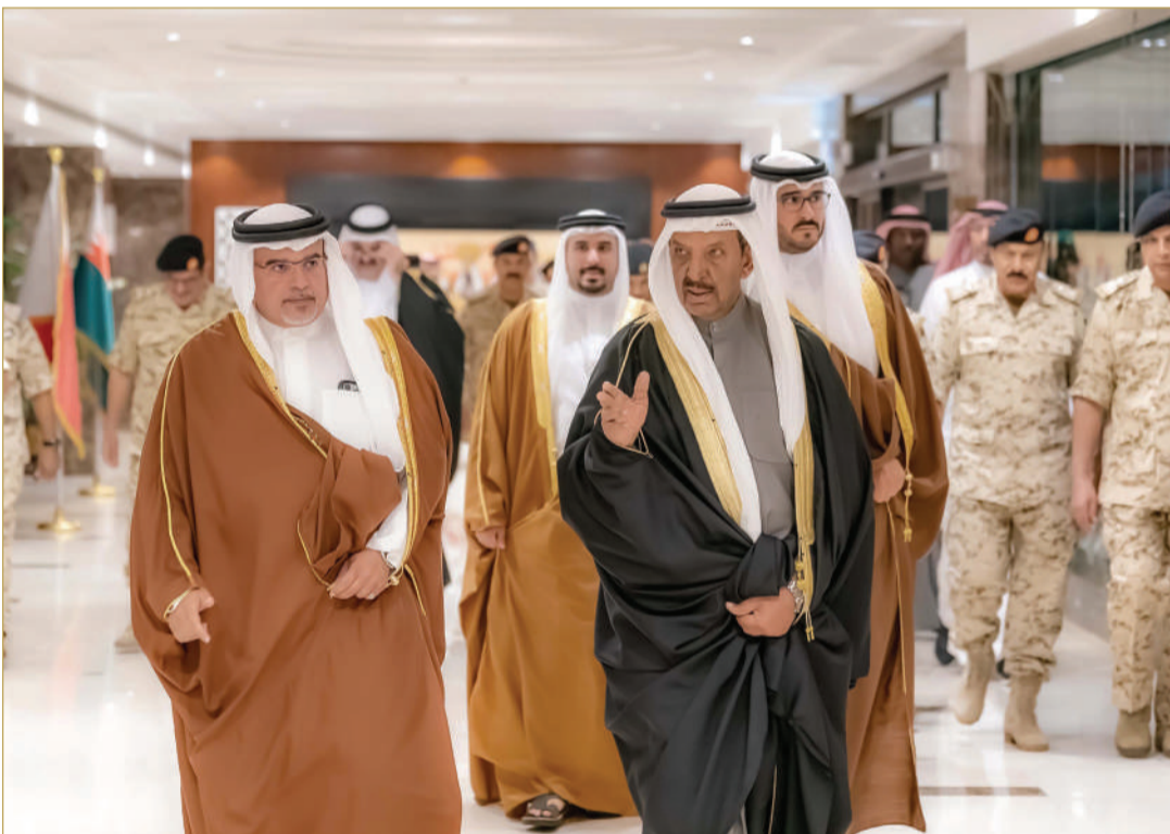
سمو ولي العهد نائب القائد الأعلى للقوات المسلحة رئيس مجلس الوزراء أثناء مأدبة الإفطار

أكد ولي العهد نائب القائد الأعلى للقوات المسلحة رئيس مجلس الوزراء صاحب السمو الملكي الأمير سلمان بن حمد آل خليفة، ما وصلت إليه قوة دفاع البحرين من جهوزية واحترافية عالية، عززت من دورها في الاضطلاع بواجبها الوطني المقدس، في ظل رعاية واهتمام ملك البلاد المعظم القائد الأعلى للقوات المسلحة صاحب الجلالة الملك حمد بن عيسى آل خليفة، مشيراً سموه إلى أن تضحيات وبسالة رجال قوة دفاع البحرين الخالدة في ميادين العزة والبطولة إلى جانب إخوانهم من القوات المسلحة في الدول الشقيقة والصديقة من أجل حفظ أمن واستقرار المنطقة، ستظل ماثلة في الذاكرة الوطنية لما قدمته من دروس ملهمة. جاء ذلك أثناء مأدبة الإفطار التي أقامها سموه لعدد من كبار ضباط قوة دفاع البحرين؛ بمناسبة حلول شهر رمضان المبارك، فلدَى وصول سموه يرافقه رئيس مجلس أمناء وقف عيسى بن سلمان التعليمي الخيري رئيس مجلس إدارة صندوق العمل سمو الشيخ عيسى بن سلمان بن حمد آل خليفة، وسمو الشيخ محمد بن سلمان بن حمد آل خليفة، وكان في الاستقبال القائد العام لقوة دفاع البحرين المشير الركن الشيخ خليفة بن أحمد آل خليفة، ووزير شؤون الدفاع الفريق الركن عبدالله النعيمي، ورئيس هيئة الأركان الفريق الركن ذياب النعيمي، وعدد من كبار ضباط قوة دفاع البحرين. (04-05)