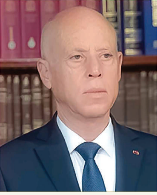
رئيس الجمهورية التونسية