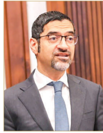
وزير شؤون البلديات والزراعة

البلاد كشف وزير شؤون البلديات والزراعة وائل المبارك عن وجود مشروع جديد بمرحلة المناقصة حالياً يتعلق بمسح المياه الجوفية، إضافة إلى مشروع توسعة المياه المعالجة بالتعاون مع وزارة الأشغال بحيث يتم توفير البدائل للمزارعين. وأكد الوزير تشجيع الوزارة للمزارعين على استخدام الطاقة المستدامة حيث توجد جملة من المبادرات في هذا الشأن، كما وستعمل الوزارة على مبادرات جديدة في المرحلة المقبلة لتعزيز استعمال مصادر الطاقة