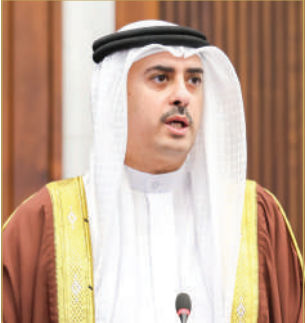
وزير العدل والشؤون الإسلامية والوقفات

البلاد قال وزير العدل والشؤون الإسلامية والوقفات نواف المععودة إنه جرى خلال الفترة الماضية تسجيل 14 مسجداً وجامعاً لم تكن تمتلك وثائق فيما سبق، إلى جانب عدد من المساجد التي مازالت في طور التسجيل. ودعا إدارة الأوقاف الجعفرية وإدارة الأوقاف السنبة وكل من له حق باللجوء للقضاء لإثبات ملكيته وأحقته، مؤكداً حرص الحكومة على تثبيت حقوق وملكيات المآتم والمساجد.