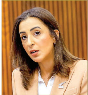
وزيرة التنمية المستدامة

إدارة التقييم والدراسات، وإدارة التواصل والعلاقات الدولية.