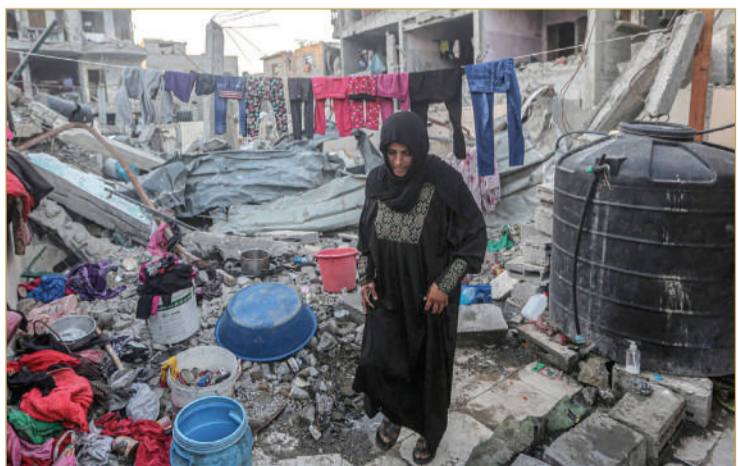
سيدة فلسطينية تعلق ملابسها وسط حطام منزل دمره القصف الإسرائيلي

لم ينح من نقص الدواء والغذاء. ما يعانيه أهالي قطاع غزة من حصار ونقص في الغذاء والدواء سيعانيه أسراكم أيضا. وكانت كتائب القسام قد أعلنت سابقا مقتل أكثر من 70 محتجزا في القصف الإسرائيلي منذ 7 أكتوبر الماضي، على مواقع مختلفة في قطاع غزة، واتهمت إسرائيل بتعمد قتل المحتجزين للتخلص من هذا الملف.