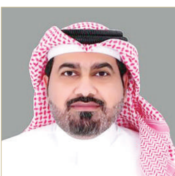
مدير عام بلدية المحرق

وزارة الأشغال قد أحيلت إلى وزارة الأشغال لإبداء مرنيتها بهذا الخصوص. جاء ذلك في ردها على توصية مجلس المحرق البلدي.