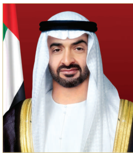
سمو الشيخ محمد بن زايد آل نهيان