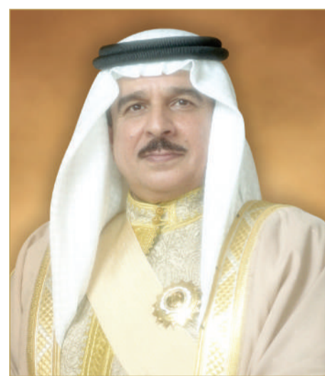
جلالة الملك المعظم

الراسخة بين دولة الإمارات ومملكة البحرين، وسبل تعزيز تعاونهما في مختلف المجالات خصوصا الاقتصادية والاستثمارية والتنموية، وغيرها من الجوانب التي تصب في صالح البلدين وشعبهما الشقيقين. (02)