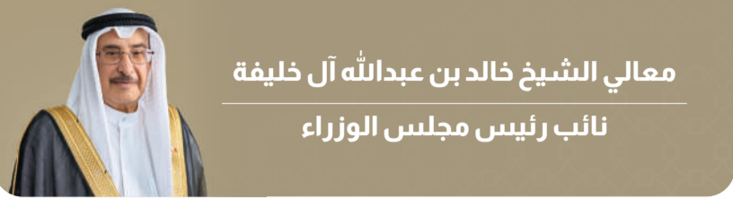
معالي الشيخ خالد بن عبدالله آل خليفة نائب رئيس مجلس الوزراء