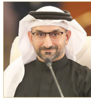
وزير الصناعة والتجارة

الإجمالية للمناطق الصناعية 14.5 مليون متر مربع وتضم ما يقارب 851 قسيمة صناعية، في حين تبلغ نسبة التأجير منها 91%، كما أن المساحة المتبقية والقابلة للتأجير لا تتعدى 90% من المساحة الكلية للمناطق الصناعية، أما فيما يتعلق بالمرود المادي من التأجير يبلغ حوالي 14.5 مليون دينار سنوياً، أما بالنسبة للمرود الاقتصادي فبلغ إجمالي الاستثمارات المسجلة في المناطق الصناعية 3.7 مليار دينار.