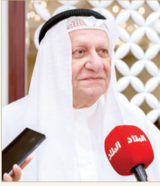
المؤيد مصراً لـ “البلاد”

وقال المؤيد: “إن السياحة في البحرين بحاجة إلى تطوير، من خلال جلب السياح الأجانب من مختلف دول العالم سواء أوروبا أو جنوب شرق آسيا، الذين يحبون السياحة الحقيقية”، مشيراً إلى ضرورة عدم الاعتماد على زوار البحرين من دول مجلس التعاون فقط. وأضاف: “يجب أن يكون هناك اتفاقيات مع مكاتب خارجية، تستقطب السياح إلى مملكة البحرين، كما تفعل دول المنطقة والعالم، ولكن إلى الآن لم نر النتائج جميع من جاؤوا من الخليج، وقليلين يأتيون من خارج المنطقة. وأشار إلى أن تدفق بعض الجاليات الهندية لتنظيم الأعراس في مملكة البحرين هو أمر جيد ويجب تطويره.