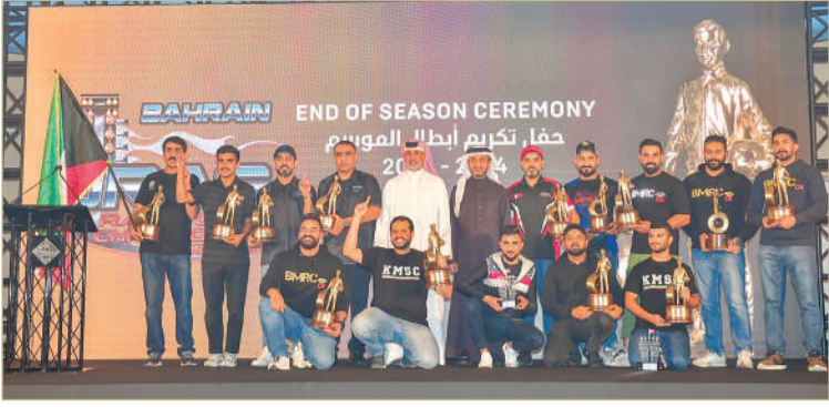
الشيخ سلمان بن عيسى يتوسط الأبطال في صورة تذكارية بعد التتويج

من دول الخليج كالسعودية والكويت والإمارات.