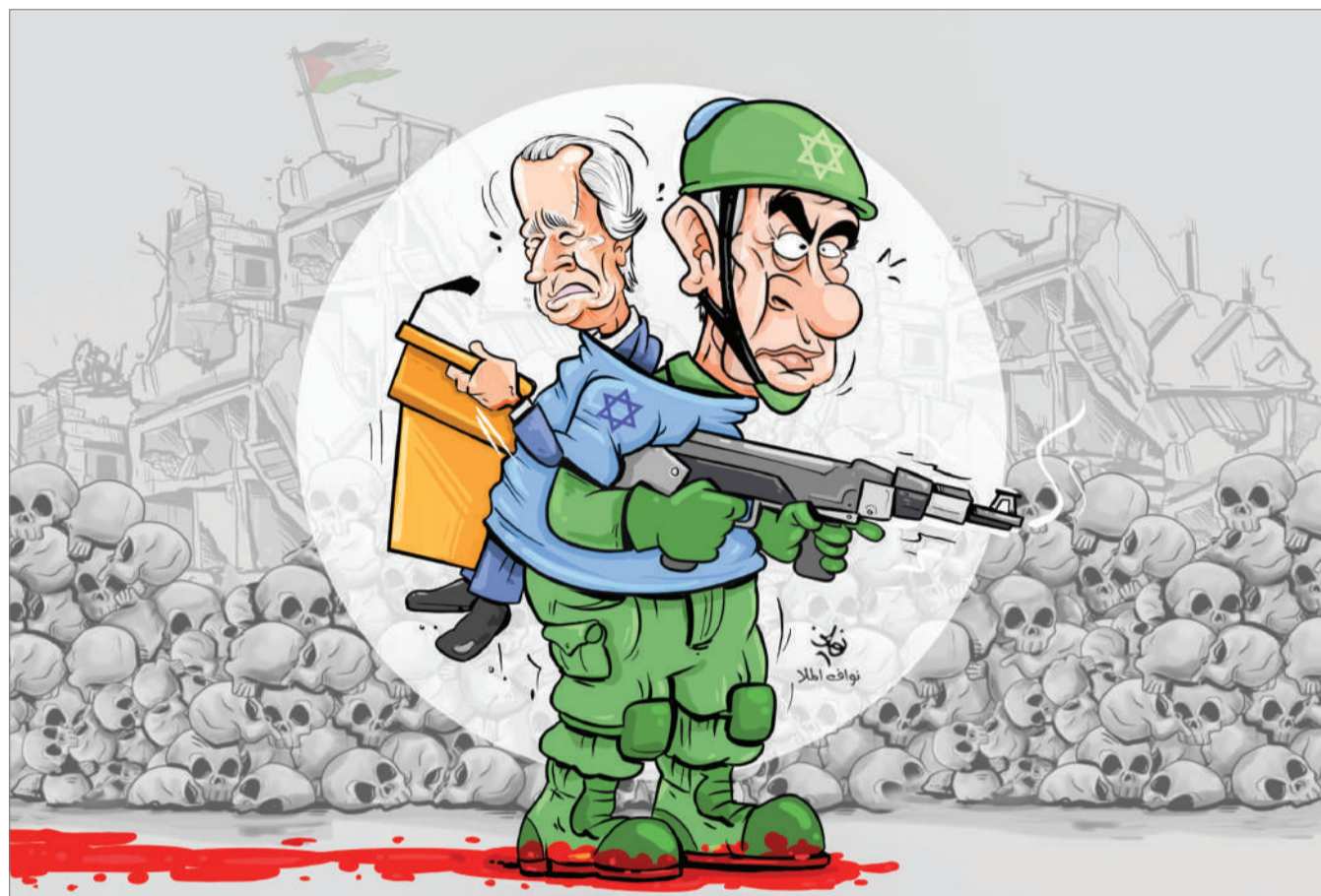
كاركاتير نواف الملا

هناك نقاط عدة تتعلق بالثروة السمكية تنمى من الجهات المعنية تنويرنا بحسب الرؤية المستقبلية لتطوير هذا القطاع الحيوي كما ينبغي، فالملاحظ أن رخص الصيد الممنوحة تفوق حجم البحر لدينا، وهذه إشكالية كبيرة تحتاج إلى معطيات ودراسات بكل الأساليب والأشكال، ومن الضروري التفكير في المدى والطريقة التي تمنح فيها رخصة الصيد بما يتناسب مع ثروتنا السمكية وحمايتها، كما أن عمليات الصيد الجائر التي يمارسها الصيادون الآسيويون باستخدام "الغزل الإسرائيلي" لا تزال مستمرة رغم الجهود المشكورة التي تقوم بها دوريات خفر السواحل، فإحصائيات قيادة خفر السواحل خلال العام 2023 تشير إلى ضبط 2365 مخالفة، تمثلت في ضبط مخالفين لقوانين الصيد، والتسجيل والترخيص والحظر البحري، وشباك ممنوع استخدامها، وهذا الرقم كبير جداً مقارنة مع مساحة البحر. ولعل القضية الأهم التي تعد في طليعة اهتمام المواطن، هي شح