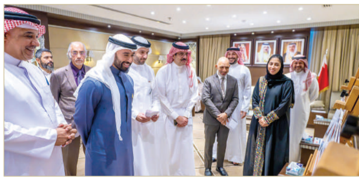
جانب من اجتماع رؤساء الاتحادات في اللجنة الأولمبية

96 لاعبا و20 لاعبة و52 من الجهاز الفني والإداري، وتطلع لتحقيق النتائج المرجوة من المشاركة بعدما وقع الاختيار على الألعاب، بناء على تقييمهم لمستوياتهم ونتائجهم المتوقعة، متمنيا لهم جميعا التوفيق والنجاح. وعقب ذلك استمع الكوهجي إلى تحضيرات واستعدادات الاتحادات وملاحظاتهم الفنية والإدارية بخصوص المشاركة وتوقعاتهم للنتائج.