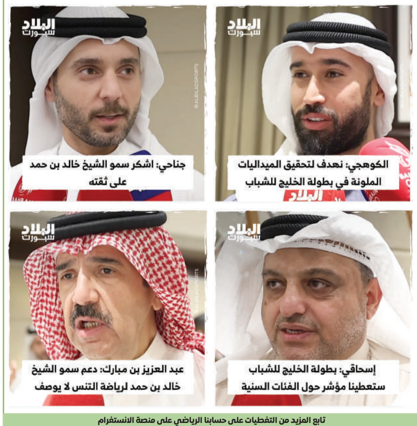
جناحي: اشكر سمو الشيخ خالد بن حمد على ثقته

على منصة "البلاد سبورت" تغطية بالفيديو لاجتماع رؤساء الاتحادات