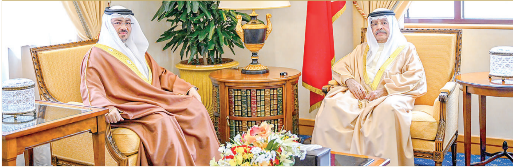
سمو الشيخ علي بن خليفة آل خليفة مستقبلاً سفير مملكة البحرين لدى جمهورية كوريا