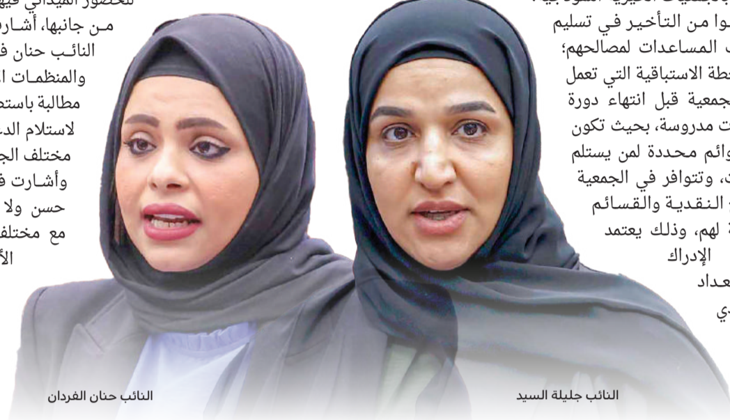
النائب حنان الفردان

ودعت فردان إلى استثناء الجمعيات الخيرية عن غيرها من الجمعيات والمنظمات الأهلية في الإجراءات ومتطلبات واشترطات جمع الأموال، عبر مراعاة أن جوهر عملها يتمثل في جمع الأموال والتبرعات، مع حاجتها لدعم الوزارة ومساندتها، بدلا من تغليب روح الرقابة والمحاسبة على روح التمكين والتأهيل لهذه الجمعيات، التي تضطلع بدور كبير في المجتمع.