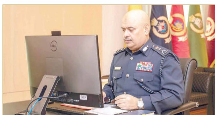
رئيس الأمن العام يترأس الاجتماع الطارئ الثالث للجنة الوطنية لإدارة الطوارئ المدنية

ترأس رئيس الأمن العام رئيس اللجنة الوطنية لإدارة الطوارئ المدنية الفريقي طارق الحسن، الاجتماع الطارئ الثالث للجنة، بحضور الأعضاء من ممثلي الوزارات والجهات المعنية. وأكد رئيس الأمن العام أن العمل الجاري من الجهات المعنية لمواجهة مشكلة رائحة الغاز المنتشرة في بعض مناطق المملكة، مشيراً إلى أن شركة بابكو بالتنسيق بين وزارة النفط والبيئة والإدارة العامة للدفاع المدني والجهات المساندة الأخرى، تتخذ