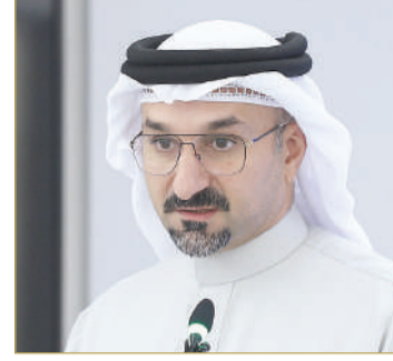
وزير الصناعة والتجارة

وأشار بحسب المنظمين، إلى أن تعزيز الابتكار والنمو الاقتصادي، يتطلب اتباع نهج متعدد الأوجه يتضمن ما يلي: "تشجيع ريادة الأعمال: رواد الأعمال هم المحركون للابتكار، ويمكن للحكومات إنشاء أنظمة بيئية مواتية وبيئة تمكينية لريادة الأعمال من خلال توفير الوصول إلى التمويل الذكي، وبناء القدرات، والاحتضان، والتواصل، والإرشاد، وتشجيع الشراكات والتعاون وتبادل المعرفة، فيعد التعاون بين رواد الأعمال والشركات الصغيرة والمتوسطة والحكومة والأوساط الأكاديمية والمجتمع المدني في