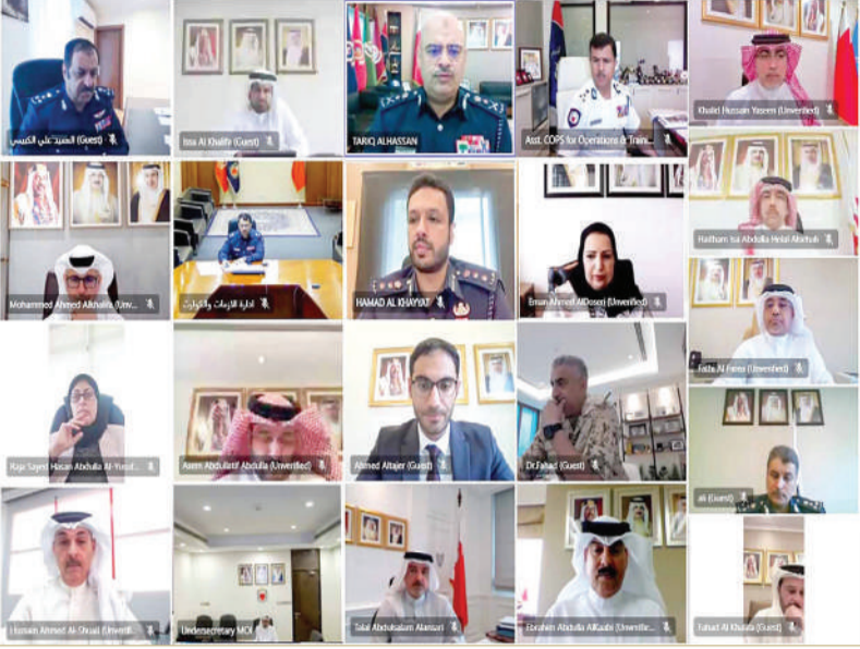
رئيس الأمن العام يتأسر الاجتماع الطارئ الثالث للجنة الوطنية لإدارة الطوارئ المدنية