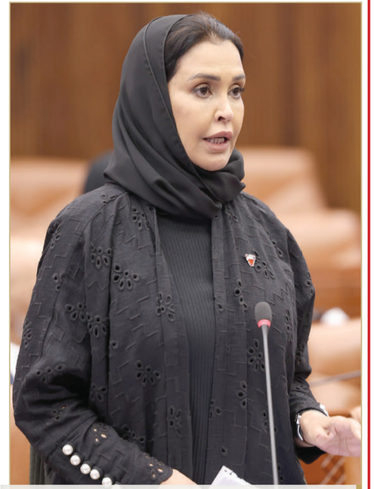
البلاد النائب الثاني لرئيس مجلس الشورى جهاد الفاضل

البلاد أكد الرئيس التنفيذي لهيئة تنظيم سوق العمل نبراس طالب، أن الهيئة وبالتعاون مع وزارة الخارجية، تدرس إبرام اتفاقيات حديثة؛ من أجل استقطاب عمالة منزلية من وجهات جديدة، عبر استقدام عمالة بتكاليف منخفضة والبحث عن دول أخرى توفر العمالة. وأوضح طالب في مداخلة بـ مجلس الشورى، أن قيمة تكاليف استقدام العمالة المنزلية، تشمل الرسوم الحكومية التي تصل لغاية 20%، إلى جانب هامش الربحية لمكاتب الاستقدام، بحسب المعلومات التي يتم تزويدها إلى هيئة تنظيم سوق العمل من قبل مكاتب استقدام العمالة، إضافة إلى تكاليف السفر والتنقلات والمواصلات وتكاليف المكتب المرسل، إذ إن الرسوم التي