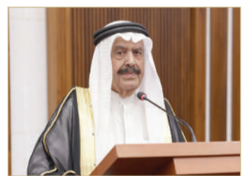
الشيخ أحمد بن محمد