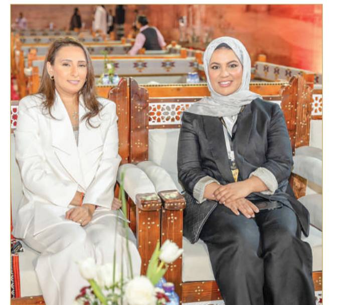
الرئيس التنفيذي لـ "تمكين"