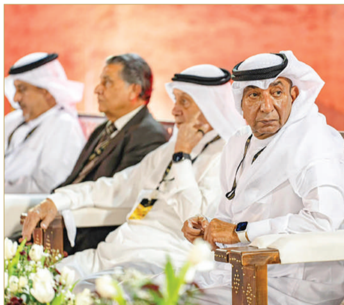
رئيس غرفة صناعة وتجارة البحرين