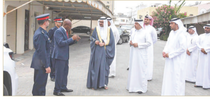
المنامة - وزارة الداخلية

تنفيذا لأوامر ولي العهد رئيس الوزراء صاحب السمو الملكي الأمير سلمان بن حمد آل خليفة، بحصر الأضرار الناتجة عن تجمع مياه الأمطار، قام محافظ الجنوبية سمو الشيخ خليفة بن علي آل خليفة، بتفقد المناطق السكنية والطرق إضافة إلى المرافق العامة؛ للاطلاع على الأضرار الناتجة عن سقوط الأمطار الغزيرة في نطاق الجنوبية، بحضور المدير العام لبلدية المنطقة الجنوبية عيسى البوعينين، ونائب المحافظ العميد حمد الخياط، والمسؤولين من المحافظة والجهات المعنية. وأكد سمو المحافظ، دور المحافظة في متابعة توجيهات وزير الداخلية الفريق أول الشيخ راشد بن عبدالله آل خليفة، والتمثلة في حصر البيوت المتضررة ورصد احتياجات الأهالي والمواطنين، حيث قامت المحافظة الجنوبية بإعداد تقرير شامل عن حجم الأضرار الواقعة