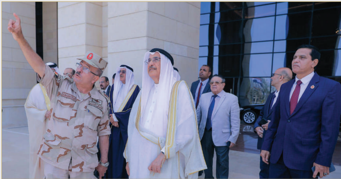
الشيخ خالد بن عبدالله لدى زيارته العاصمة الإدارية الجديدة بجمهورية مصر العربية الشقيقة

بعدها تفضل بالتوقيع في سجل كبار الزوار، ثم تجول في أرجاء المشروع، وتفقد والوفد المرافق الحي الحكومي ومبنى مجلس النواب وساحة الشعب والنصب التذكاري. من جانبه، أعرب خالد عباس، رئيس مجلس الإدارة والعضو المنتدب لشركة العاصمة الإدارية للتنمية العمرانية، عن سعادته بزيارة معالي نائب رئيس مجلس الوزراء إلى العاصمة الإدارية الجديدة، مشيداً بعقد العلاقات الثنائية بين مصر ومملكة البحرين، والقائمة على التآخي والتعاون المشترك.