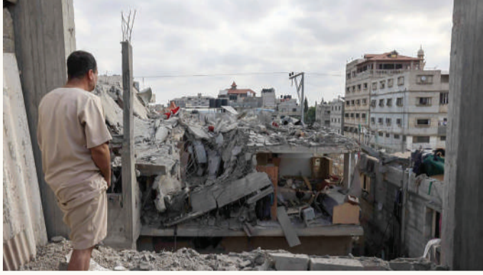
الغزيون يمئون النفس بهدنة

وشدد وزير الخارجية السعودية على حق الشعب الفلسطيني في إقامة دولته ووصفه بأنه "حق