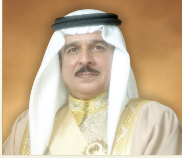
جلالة الملك المعظم

المنامة - بنا بعث ملك البلاد المعظم صاحب الجلالة الملك حمد بن عيسى آل خليفة، وولي العهد رئيس مجلس الوزراء صاحب السمو الملكي الأمير سلمان بن حمد آل خليفة، برقيتي تهنئة إلى ملك مملكة هولندا صاحب الجلالة الملك ويليم ألكساندر، بمناسبة ذكرى اليوم الوطني لبلاده. وأعرب جلالته الملك المعظم في برقيته عن أطيب تهانئه وتمنياته لجلالته بموفور الصحة والسعادة، ولشعب مملكة هولندا الصديق تحقيق المزيد من التطور والازدهار. كما بعث صاحب السمو الملكي ولي العهد رئيس مجلس الوزراء برقية تهنئة مماثلة إلى رئيس وزراء مملكة هولندا مارك روته.