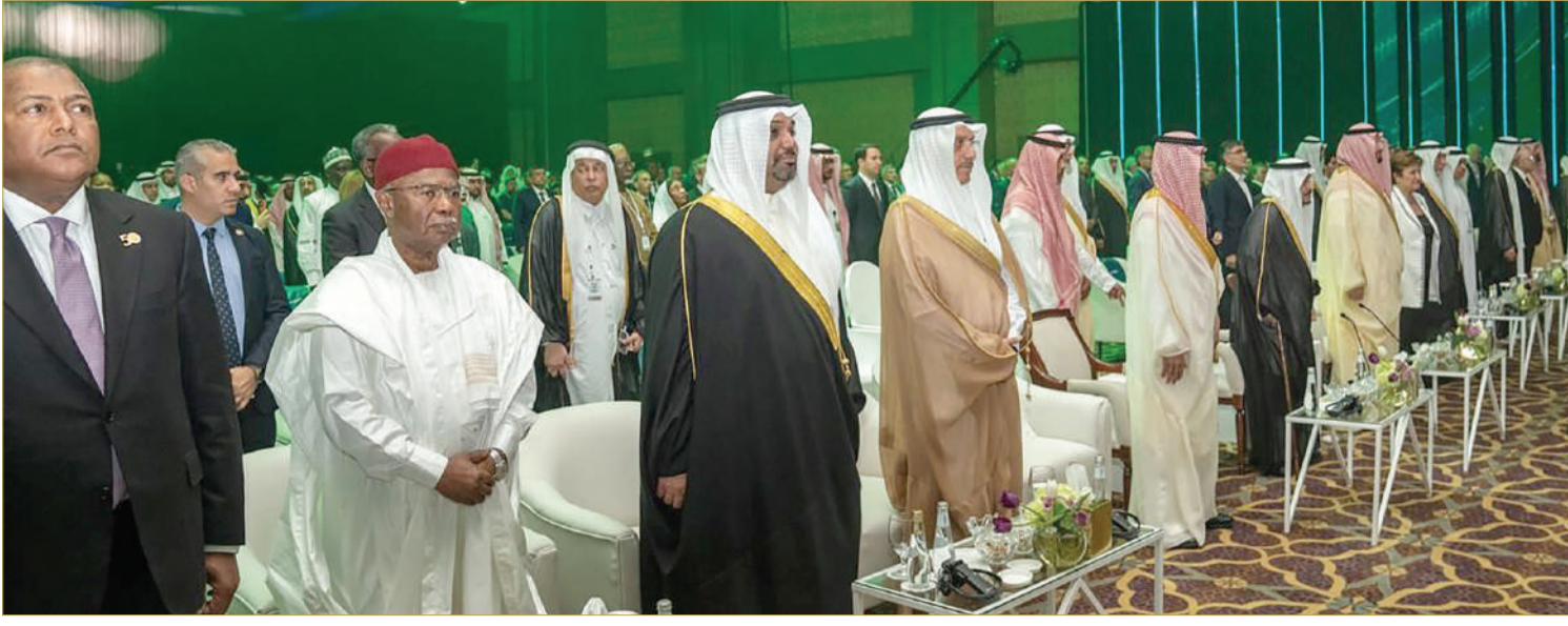
وزير المالية والاقتصاد الوطني يحضر حفل اليوبيل الذهبي للبنك الإسلامي للتنمية