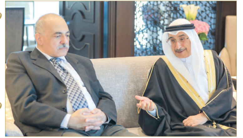
قصر القضيبي - مكتب نائب رئيس مجلس الوزراء

أشاد نائب رئيس مجلس الوزراء، الشيخ خالد بن عبدالله آل خليفة، بالعلاقات التاريخية البحرينية - المصرية، وما تشهده من تقدم وازدهار كأنموذج في الأخوة والتلاحم والعمل العربي المشترك في ظل القيادة الحكيمة لملك البلاد المعظم صاحب الجلالة الملك حمد بن عيسى آل خليفة، وأخيه رئيس جمهورية مصر العربية الشقيقة عبد الفتاح السيسي.