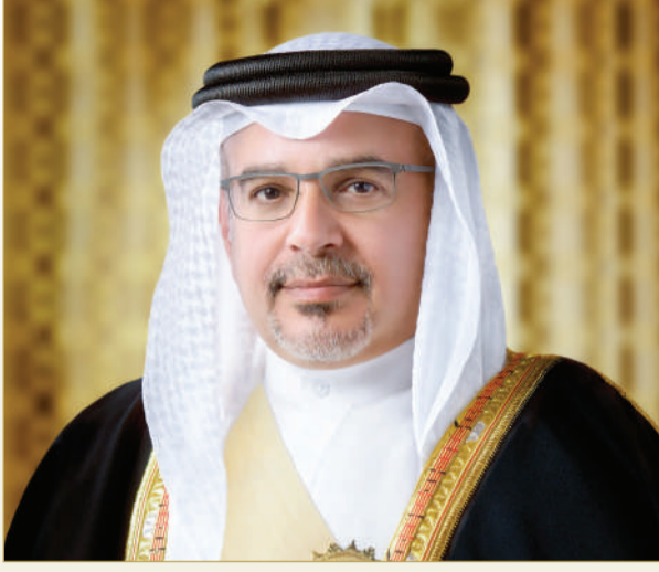
سمو ولي العهد رئيس مجلس الوزراء