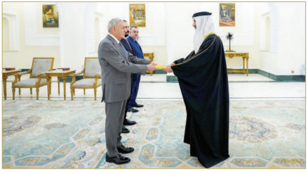
المنامة - وزارة الخارجية

تسلم عبد اللطيف رشيد، رئيس جمهورية العراق، في قصر السلام ببغداد أمس، أوراق اعتماد خالد المنصور، سفيراً لملكة البحرين لدى جمهورية العراق. ونقل خالد المنصور تحيات صاحب الجلالة الملك حمد بن عيسى آل خليفة ملك البلاد الفعظم، وصاحب السمو الملكي الأمير سلمان بن حمد آل خليفة، ولي العهد رئيس مجلس الوزراء، إلى فخامة الرئيس عبد اللطيف رشيد، رئيس جمهورية العراق الشقيقة، وتمنياتهما لفخامته بدوام الصحة والعافية، ولجمهورية العراق وشعبها الشقيق المزيد من التقدم والرفعة.