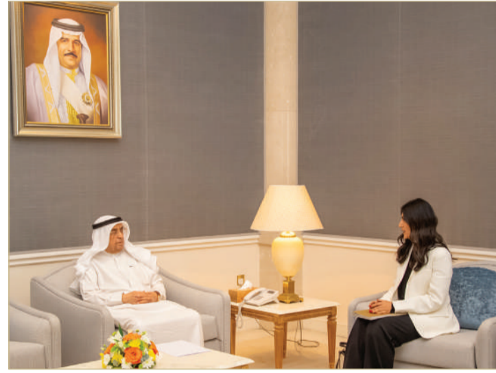
سمو الشيخ محمد بن مبارك يستقبل الرئيس التنفيذي لهيئة جودة التعليم والتدريب

عملياتها والارتقاء بجودة ما تقدمه لقطاع التعليم والتدريب، معربة عن شكرها لسموه على استقباليها، وتقديرها لما لاقته وتلقاه من دعم وتوجيه من سموه منذ فترة عملها ضمن فريق المجلس الأعلى لتطوير التعليم والتدريب.