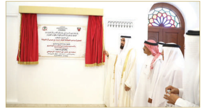
المنامة - الأوقاف السنينة

الاستراتيجية للحكومة برئاسة صاحب السمو الملكي ولي العهد رئيس مجلس الوزراء، والتي تعد جزءاً أساسياً من جهود الدولة لتعزيز القيم وتقوية الروابط في المجتمع، منها على أن التوسع في المشاريع الإسكانية يعكس التزام الوطن بتوفير البيئة الملائمة لأداء الواجبات الدينية، وتعزيز التواصل الاجتماعي بين أفراد المجتمع. وثنم رئيس مجلس الأوقاف السنينة الدعم السخي المقدم من المتبرع في تشييد المسجد، معبراً عن امتنانه لقيم الشراكة المجتمعية التي تعكسها هذه المبادرة.