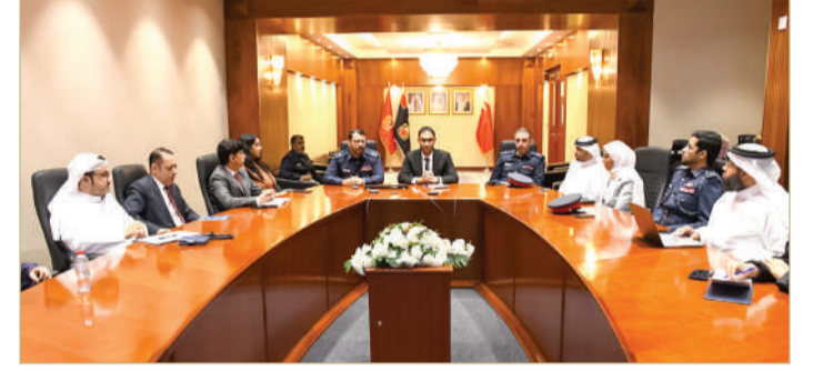
المنامة - وزارة الداخلية

تنفيذا لتوجيهات وزير الداخلية رئيس مجلس الدفاع المدني وبمتابعة رئيس الأمن العام رئيس اللجنة الوطنية لإدارة الطوارئ المدنية، عقد المكتب التنفيذي للجنة الوطنية لإدارة الطوارئ المدنية اجتماعا لبحث سبل التعاون والتنسيق للتعامل مع ما قد ينجم من تداعيات بسبب التقلبات الجوية والأمطار المتوقع هطولها على المملكة خلال الأيام المقبلة.