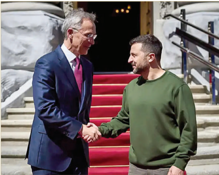
زيلينسكي وستولتنبيرغ في كييف

وأكد أن "المزيد من المساعدات في الطريق"، قائلاً إنه يتوقع إعلانات جديدة في هذا الاتجاه "قريباً". واعتبر أن دول الحلف فشلت في الوفاء بما تعدت به لأوكرانيا في الوقت المناسب، حيث تستغل روسيا إمكاناتها في ساحة المعركة قبل حصول القوات الأوكرانية على المزيد