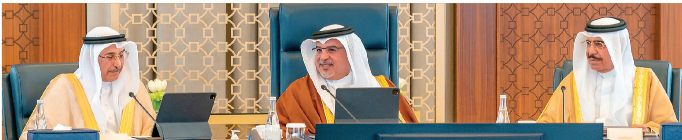
سمو ولي العهد رئيس مجلس الوزراء يترأس الاجتماع الاعتيادي الأسبوعي لمجلس الوزراء

♦ الشيخ خالد بن عبدالله قدم الكثير وله بصمات واضحة في مواقع العمل الوطني