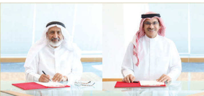
توقيع مذكرة التفاهم

أكد وزير التنمية الاجتماعية أسامة العصفور، الدور البارز الذي تضطلع به منظمات المجتمع المدني، ومساهماتها التنموية في إطار الشراكة المجتمعية على نحو يعزز النهوض بالمشاريع والخطط ذات الأهداف المستدامة.