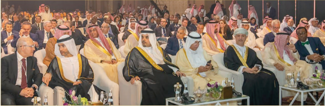
المنامة - وزارة المالية والاقتصاد الوطني

أكد وزير المالية والاقتصاد الوطني الشيخ سلمان بن خليفة آل خليفة الذي يظطلع به البنك الإسلامي للتنمية في رفد مسارات التنمية الاقتصادية للعديد من الدول نحو مزيد من النماء والازدهار، مشيراً إلى الحرص الذي توليه مملكة البحرين على تعزيز أوجه التعاون مع مختلف المؤسسات المالية والمستدامة، والبرامج التنموية المختلفة بما يساهم في تحقيق الأهداف المرجوة، ويعود بالخير والنماء لصالح الدول الأعضاء. جاء ذلك لدى مشاركته في الاحتفالية التي أقيمت تحت رعاية خادم الحرمين الشريفين الملك سلمان بن عبدالعزيز آل سعود وبحضور أمير منطقة الرياض صاحب السمو الملكي الأمير فيصل بن بندر بن عبدالعزيز آل سعود، بمناسبة اليوبيل الذهبي للبنك الإسلامي للتنمية والتي استضافتها العاصمة السعودية