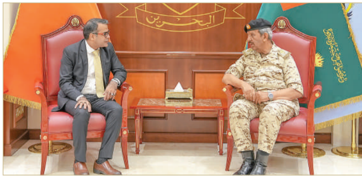
الرفاع - قوة الدفاع

استقبل القائد العام لقوة دفاع البحرين المشير الركن الشيخ خليفة بن أحمد آل خليفة، صباح أمس الأربعاء، سفير جمهورية باكستان الإسلامية الشقيقة ثاقب رؤوف، وذلك بمناسبة تعيينه سفيراً جديداً لبلاده لدى مملكة البحرين. وخلال اللقاء، رحب القائد العام لقوة دفاع البحرين بسفير جمهورية باكستان الإسلامية الشقيقة، حيث تم مناقشة عدد من المواضيع التي تعزز العلاقات الثنائية والتعاون والتنسيق المشترك القائم بين البلدين الشقيقين والتي تشهد تطوراً ونمواً على كافة الأصعدة،