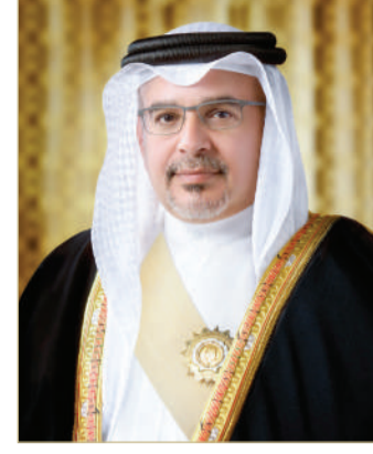
سمو ولي العهد رئيس الوزراء