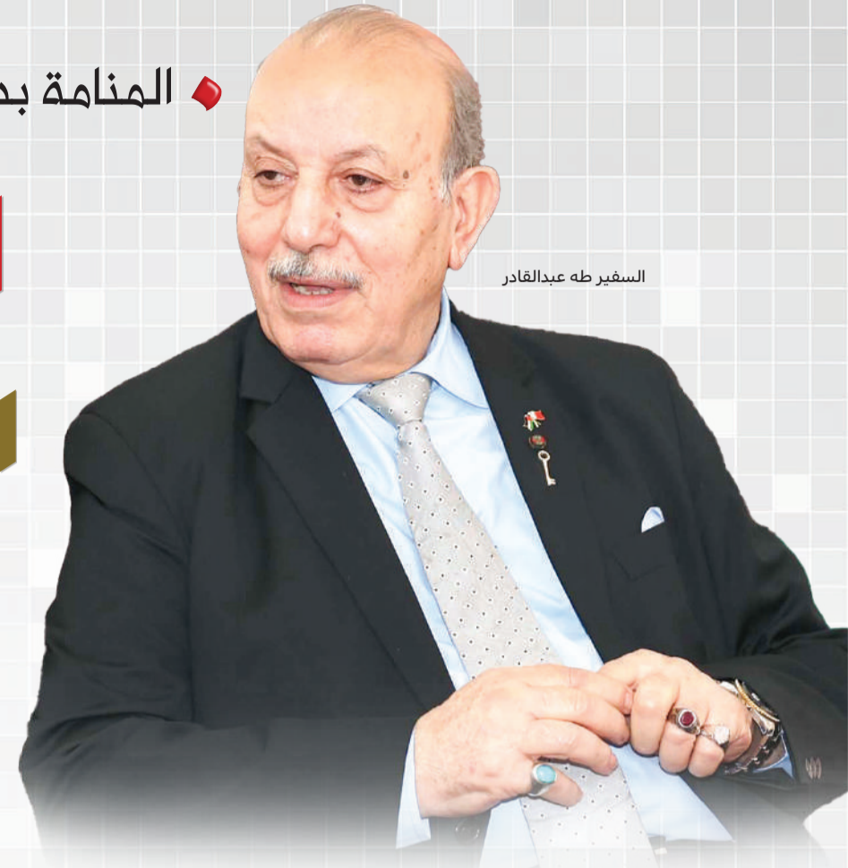
السفير طه عبدالقادر

يؤكد سفير دولة فلسطين لدى مملكة البحرين طه عبدالقادر أن استضافة المملكة للقمة العربية تشكل أهمية كبيرة من حيث مكان انعقادها وزمانها، فهي المرة الأولى التي تستضيف فيها القمة، وهو ما يعكس المكانة المتميزة للمملكة في المحيطين العربي والدولي، والدور الحكيم والتميز الذي تلعبه بقيادة جلالته الملك المعظم، من خلال علاقاته الأخوية مع ملوك ورؤساء الدول العربية والعالمية، انطلاقاً من إيمانه الثابت بأهمية العمل العربي المشترك في خدمة مصالح، وتطلعات الشعوب العربية، وحماية الأمن القومي العربي من كل التهديدات الخارجية، وفي جناب الحوار نقراً: