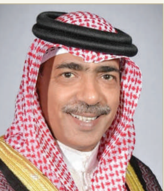
الشيخ علي بن محمد

للرياضة المدرسية وجهود اللجنة المنظمة العليا برئاسة سمو الشيخ خالد بن حمد آل خليفة واللجنة التنفيذية وكافة اللجان العاملة والدور الهام للاتحاد البحريني الرياضي للمدارس والجامعات والاتحادات الرياضية المشاركة. وأعرب الشيخ علي بن محمد آل خليفة عن ثقته الكبيرة بقدرة المملكة على تنظيم نسخة استثنائية نظراً لما تمتلكه من بنية تحتية ومنشآت ومرافق رياضية مؤهلة، والعديد من الخدمات والتسهيلات، بالإضافة إلى الخبرات البشرية والإثر المعرفي والثقافي.