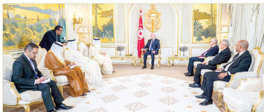
المنامة - وزارة الخارجية

على استقباله، ونقل إليه تحيات وتقدير صاحب الجلالة الملك المعظم وصاحب السمو الملكي ولي العهد رئيس مجلس الوزراء، وتمنياً لهما له بدوام الصحة والعافية، وللشعب التونسي الشقيق الاستقرار والنماء والازدهار، مشيداً بما يربط بين البلدين من علاقات أخوية وتعاون ثنائي متنامي في مختلف المجالات. وأطلع وزير الخارجية رئيس الجمهورية التونسية على الاستعدادات الجارية لانعقاد القمة العربية الثالثة