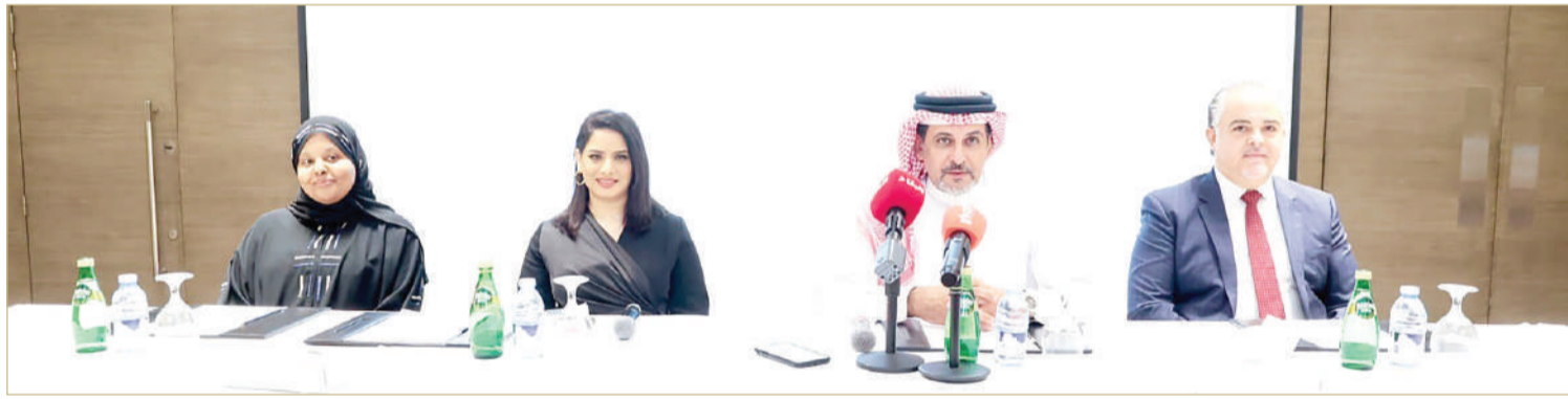
جانب من المؤتمر الصحافي

الاجتماعية للشركات التي يتم تنفيذها بشكل جيد على المجتمعات والبيئة وسمة الشركة، كما سيتم عرض قصص النجاح المهمة للمؤسسات التي تجسد التميز في مساعي المسؤولية الاجتماعية للشركات، كما يهدف المؤتمر إلى إقامة الشراكات بين الشركات والمنظمات غير الحكومية وتبادل الخبرات بينهم، كما تم تصميم هذا المؤتمر من أجل قادة الشركات والمديرين التنفيذيين، ومتخصصي المسؤولية الاجتماعية والاستدامة، والمسؤولين الحكوميين، المنظمات غير الحكومية ومنظمات المجتمع المدني، والأكاديميين والباحثين.