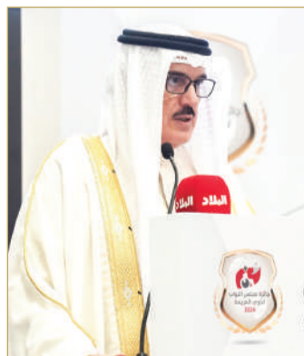
رئيس مجلس النواب يلقي كلمته

وأضاف أن مجلس النواب يضع على سلم أولوياته تطوير المنظومة التشريعية، وتفعيل الأدوات الرقابية، بما يضمن تنفيذ البرامج والمبادرات، للهوض بفئة ذوي العزيمة، وبما يتواءم مع ميثاق العمل الوطني، ودستور مملكة البحرين، مشيدا بما وصلت إليه مملكة البحرين، في ظل العهد الزاهر لجلالة الملك المعظم، من تقدم بارز في مختلف مستويات