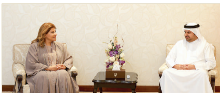
المنامة - وزارة شؤون مجلس الوزراء

استقبل وكيل وزارة شؤون مجلس الوزراء نائب رئيس اللجنة الوطنية لحقوق الإنسان، سمو الشيخ عيسى بن علي آل خليفة بمكتبه أمس، مساعد وزير خارجية الكويت لشؤون حقوق الإنسان السفيرة الشيخة جواهر إبراهيم الصباح، والوفد المرافق لها الذي يزور مملكة البحرين.