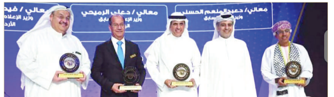
أم الحصم - معهد البحرين للتنمية السياسية

الحسني، ووزير الإعلام الأردني السابق فيصل الشبول، وأدار الجلسة رئيس تحرير جريدة الرأي الكويتية وليد الجاسم. وأضاف الرميحي أن السنوات العشر الأخيرة شهدت تطوراً كبيراً، حيث لا تستطيع المؤسسات الحكومية الاستمرار بالتحفظ في التعامل مع وسائل الإعلام، فالمسؤول أصبح مجبراً على أن يتعامل مع كافة وسائل الإعلام، ولكن الإشكال يكون في عملية قياس الأثر. وأردف رئيس مجلس الأمناء أن عملية تطور الوسائل الإعلامية مستمرة حول العالم، فيجب أن تكون لدينا إدارة متخصصة في قياس التغيير والتطوير الحاصل، وبشكل دوري لا يتجاوز 6 أشهر في كل مرحلة، مبيّناً أن الإعلام الحكومي أكثر جهة حريصة على الموثوقية.