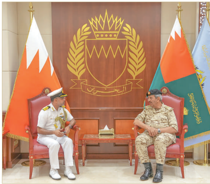
الرفاع - قوة الدفاع

استقبل القائد العام لقوة دفاع البحرين المشير الركن الشيخ خليفة بن أحمد آل خليفة، صباح أمس الأربعاء، الملحق العسكري بسفارة جمهورية الهند الصديقة لدى مملكة البحرين العقيد بحري سانديب سينغ بمناسبة تعيينه. وخلال اللقاء رحب القائد العام لقوة دفاع البحرين بالملحق العسكري الهندي الجديد، متمنياً له التوفيق والنجاح في أداء مهامه الجديدة الموكلة إليه، مشيداً بعلاقات الصداقة المتميزة التي تربط مملكة البحرين والجمهورية الهندية خصوصاً في المجال العسكري، كما تم بحث عدد من المواضيع ذات الاهتمام المشترك. حضر اللقاء عدد من كبار ضباط قوة دفاع البحرين.