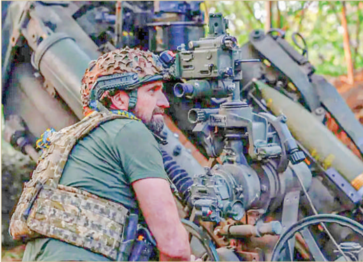
الجيش الأوكراني على جبهات القتال "أرشيفية"