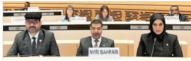
صاحبة السيف - المؤسسة الوطنية لحقوق الإنسان

اعتماد التقرير المالي للتحالف، تدقيق الحسابات الختامية، وعرض الميزانية المقترحة لعام 2024، وإقرار خطة العمل للعام نفسه. وفي ختام الاجتماع، نوقشت تجارب المؤسسات الوطنية لحقوق الإنسان في سياق المنتدى العالمي للاجئين بخصوص آليات حماية وتعزيز حقوق النازحين وعديمي الجنسية. المؤتمر شهد مشاركة أكثر من 100 مؤسسة وطنية من شبكات إقليمية متنوعة، تشمل منتدى آسيا والمحيط الهادئ، والشبكة الأفريقية، والأوروبية، والأمريكيتين، مما جعل هذا الاجتماع السنوي فرصة عالمية لتبادل الخبرات والمعلومات.