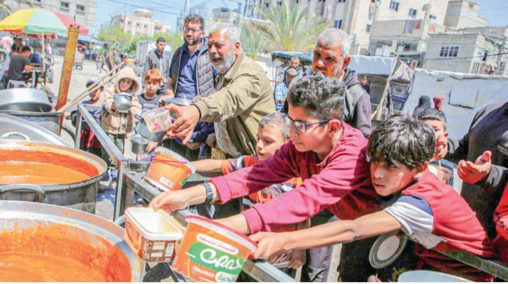
مركز لتوزيع المساعدات الغذائية شرق مدينة رفح

وبدأت إدارة بايدن في أبريل بمراجعة التحويلات المستقلة للمساعدات العسكرية، حيث بدأ أن حكومة نتنياهو تقترب من غزو رفح، رغم أشهر من معارضة البيت الأبيض. وقال المسؤول إن قرار إيقاف الشحنة مؤقتا تم اتخاذه الأسبوع الماضي ولم يتم اتخاذ قرار نهائي بعد بشأن المضي قدما في الشحنة في وقت لاحق. إلى ذلك، حذر مدير منظمة الصحة العالمية، الأربعاء، من أن كمية