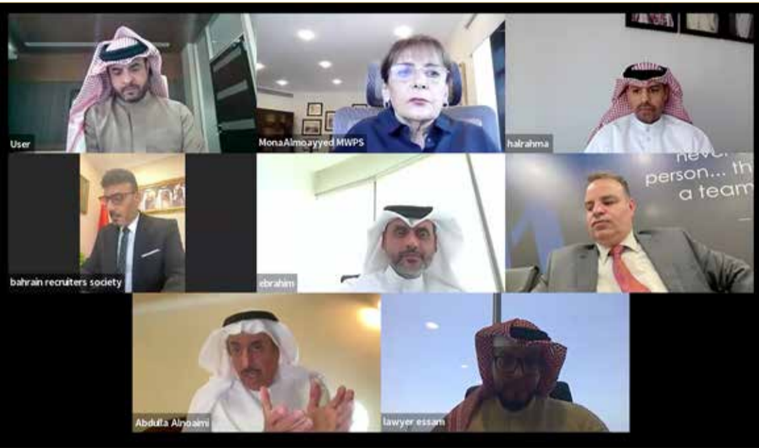
جانب من المشاركين بندوة صحيفة “البلاد”

الموجودة، ويهدف لتقليل من الخلافات، والحد من ترك العمل. وختمت “قائمة الهيئة بمبادرة التأمين الاختياري للعمالة المنزلية، والبوليصة تغطي مدة سنتين، وفي حال هروب العامل المنزلي ستقوم شركة التأمين بتعويض صاحب العمل بالمبلغ الكامل”.