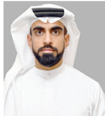
الشيخ خالد بن راشد

رفع المدير العام للإدارة العامة لتنفيذ الأحكام والعقوبات البديلة الشيخ خالد بن راشد آل خليفة، أسمى آيات التهاني والتبريكات إلى مقام عاهل البلاد المعظم صاحب الجلالة الملك حمد بن عيسى آل خليفة، وولي العهد رئيس مجلس الوزراء صاحب السمو الملكي الأمير سلمان بن حمد آل خليفة، بمناسبة عيد الأضحى المبارك، سائلاً المولى عز وجل أن يعيده على مملكة البحرين بالخير واليمن والبركات. وأشاد المدير العام للإدارة العامة لتنفيذ الأحكام والعقوبات البديلة، بإصدار جلالته الملك المعظم، مرسوما ملكياً بالعفو الخاص والإفراج عن عدد من النزلاء المحكومين في