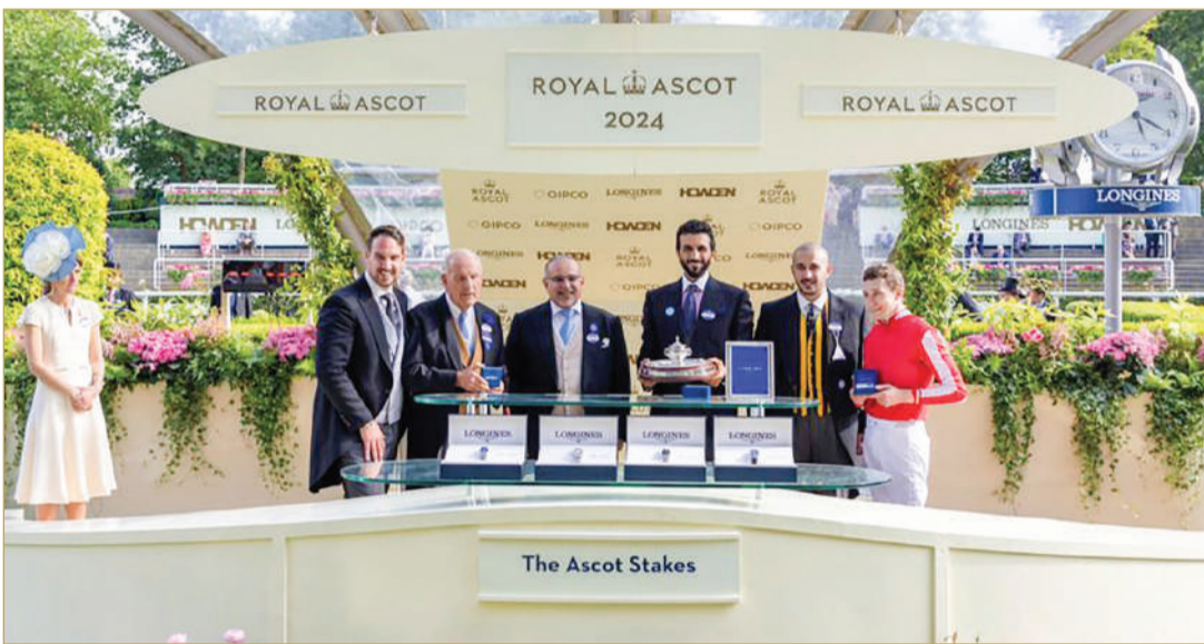
سمو ولي العهد رئيس الوزراء يتفضل بحضور مهرجان رويال أسكوت الملكي لسباقات الخيل في المملكة المتحدة

للفروسية وسباق الخيل سمو الشيخ عيسى بن سلمان بن حمد آل خليفة.