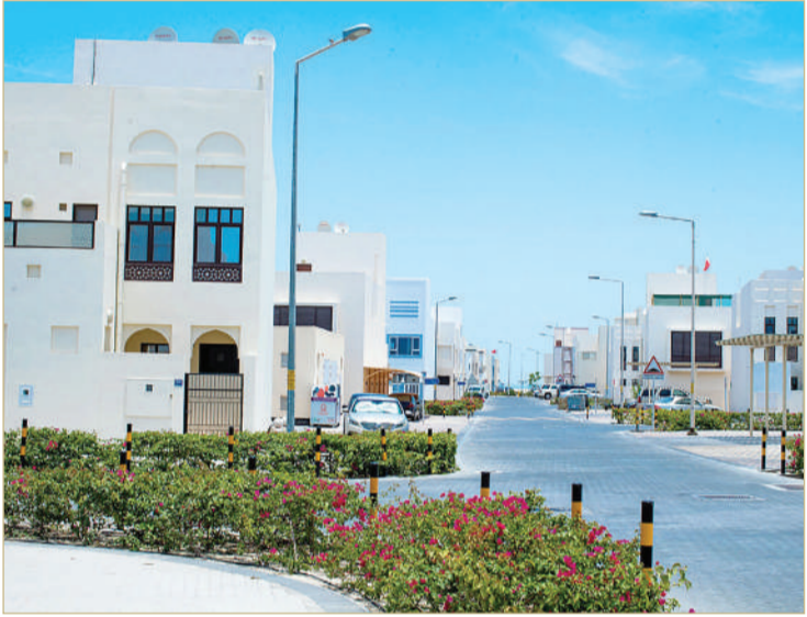
مدينة شرق الحد

المحرق، وتركيب الحاجز الأخضر لمنع عبور المشاة مقابل المبنى 1570 طريق 4336 بمنطقة عراد 243، وفتح المنفذ الواقع بين شارع 12 المؤدي إلى الطريق 1102 بمدينة الحد 111، وتوسعة منفذ الدخول إلى مدينة شرق الحد (إشارة) تقاطع شارع الحوض الجاف وشارع البسيطين 223، تطوير شارع الخليفة الواقع بين مجمعي 208 و210 بالمحرق. كما أحالت الوزارة توصيات عدة لـ "الأشغال" ومنها إعادة رصف الطريق 811 بالمحرق 208، إدخال الجزء المتبقي من شارع 1 ضمن عمليات تطوير الشوارع بمجمع 202 بمنطقة