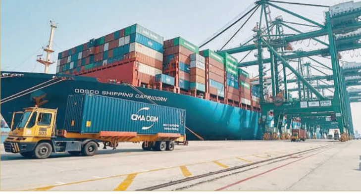
ميناء الملك عبدالعزيز بالدمام