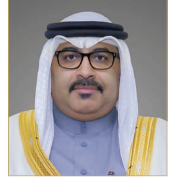
وزير التربية والتعليم

أفاد وزير التربية والتعليم محمد جمعة أنه تم استكمال إجراءات ترسية مشروع هدم وإعادة بناء سور مدرسة رقية الابتدائية للبنات بمنطقة قلالي. وأضاف "بحسب المتابعات مع جهات الاختصاص بوزارة الأشغال فإنه تم استكمال إجراءات ترسية مشروع هدم وإعادة بناء سور المدرسة ويتم حاليًا استكمال الإجراءات الإدارية والمالية من قبل وزارة