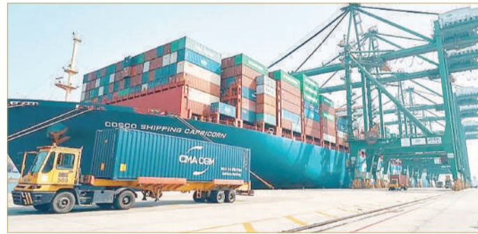
ميناء الملك عبدالعزيز بالدمام