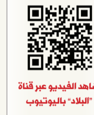
شاهد الفيديو عبر قناة "البلاد" باليوتيوب

ويرى أن الخبر مقصد سياحي لكل أهل المنطقة بما فيها دول الخليج، وأن الحراك بين الحكومة وبين القطاع الخاص، ودعم من صندوق التنمية الذي يدير التنمية بشكل احترافي، وسرعة في الإنجاز.