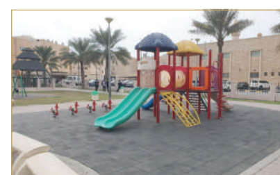
حديقة ابن الجزري