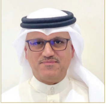
الشيخ محمد بن أحمد