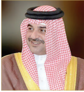
سمو الشيخ عبدالله بن حمد

القرم، والمشاركة في ندوات حوارية عن مشروع نبات القرم وأهميته في تخفيف آثار تغير المناخ، وذلك سعياً من المجلس الأعلى للبيئة لتعزيز الوعي والاهتمام البيئي لدى كافة فئات المجتمع. وأكد سموه أن المحميات الطبيعية المتنوعة، والتي تميزت بها مملكة البحرين تعكس الاهتمام الكبير الذي توليه في الحفاظ على الحياة الفطرية، وقد قام المجلس الأعلى للبيئة بتدشين مشتل نبات القرم الواقع في منطقة رأس سند ضمن محمية خليج توبلي، وذلك من أجل تكثيف الجهود الوطنية الرامية للمضي قدماً نحو زيادة الرقعة الخضراء بمضاعفة أشجار القرم إلى أربعة أضعاف بحلول عام 2035م، وذلك تماشياً مع التزام مملكة البحرين للوصول للحداد الكربوني الصفري للحفاظ على البيئة والحد من آثار تغير المناخ.