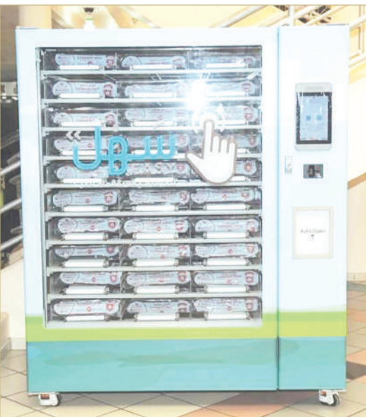
صورة لجهاز صرف أكياس القمامة

تعمل وزارة شؤون البلديات والزراعة حالياً على زيادة أعداد أجهزة صرف أكياس القمامة لضمان سهولة تحصيلها من قبل المواطنين والمقيمين. وأشار وكيل الوزارة لشؤون البلديات الشيخ محمد بن أحمد آل خليفة إلى أن مكائن توزيع أكياس القمامة في محافظة المحرق تتوافر في الأماكن التالية: مجمع السيف - عراد، مجمع لولو هايبر مارك - الحد، سوق المحرق المركزي، البريد - ديار المحرق. جاء ذلك، في رده على توصية مجلس المحرق البلدي بشأن طلب عرض خطة الوزارة على المجلس البلدي بخصوص مواقع مكائن توزيع أكياس القمامة لإبداء الرأي بشأنها بما يتناسب مع احتياجات محافظة المحرق. وأما عن طلب تغيير موقع جهاز صرف الأكياس في مجمع ذا فيلج الكائن بمنطقة الدبر، فأكد الوكيل إمكان التنسيق مباشرة مع الجهاز التنفيذي لتغيير الموقع بحسب رغبة المجلس البلدي.