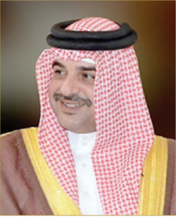
سمو الشيخ عبدالله بن حمد

أكد الممثل الشخصي لجلالة الملك المعظم رئيس المجلس الأعلى للبيئة سمو الشيخ عبدالله بن حمد آل خليفة حرص مملكة البحرين على دعم القضايا البيئية كافة، لاسيما المعنية بالتنوع البيولوجي، لما لها من أهمية بالغة في تحقيق أهداف التنمية المستدامة. وبمناسبة يوم الحياة الفطرية الخليجي الذي يصادف 30 من ديسمبر، أكد سمو الشيخ عبدالله بن حمد آل خليفة أن مملكة البحرين