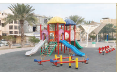
حديقة ابن الجزري