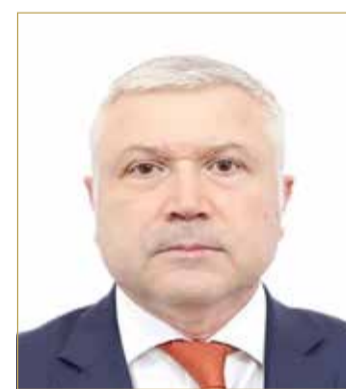
سفير أرمينيا لدى البحرين

في المنامة في 8 فبراير 2005، وقد سهلت هذه الاتفاقية المشاركة المستمرة بين الهيئات التشريعية، مما أكد على أهمية الدبلوماسية البرلمانية في العلاقات الثنائية. وفيما يتعلق بالزيارات رفيعة المستوى، ذكر أن البحرين استضافت العديد من المسؤولين الأرمين الرئيسيين، بما في ذلك الزيارات الأخيرة لرئيس الجمعية الوطنية آلين سيمونيان، في مارس 2023، ووزير الخارجية آارات ميرزويان، في نوفمبر 2023. وتابع "تُعقد اجتماعات رفيعة المستوى بين المسؤولين في بلدنا على منصات دولية مختلفة بشكل منتظم، حيث تعكس هذه الاجتماعات والزيارات تفانيًا مستمرًا في التعاون والمشاركة المتبادلة على المستويين الثنائي والمتعدد الأطراف". (اقرأ الموضوع كاملاً بالموقع الإلكتروني)