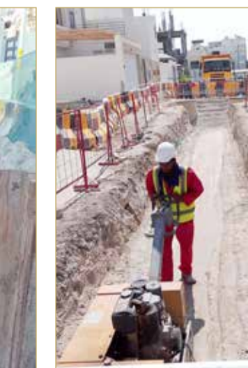
مشروع إنشاء شبكة الصرف الصحي لمجمع 1038 صد المرحلة الثالثة