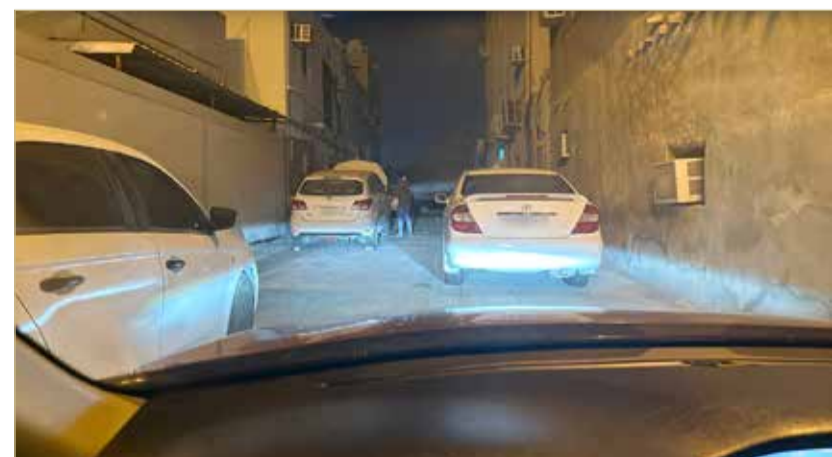
الصورة المرسله من صاحب الرسالة المنشورة