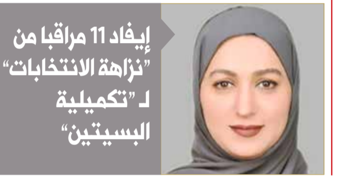
إيفاد 11 مراقبا من "نزاهة الانتخابات" لـ "تكميلية البسيطين"