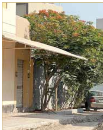
رصف الطبقة الأولى من الإسفلت لجميع طرق مجمع 1017 دمستان

وذكرت أنه تم أيضا طرح مناقصة إنشاء شبكة الصرف الصحي لجنوب مجمع 1033 المالكية في المنطقة المحصورة بين مقبرة صد باتجاه الشمال إلى دوار المالكية وقد تم فتح العطاءات، والان في مرحلة ترسية المناقصة، وسيتم إنشاء شبكة صرف صحي جديدة لخدمة 345 عقارا، متضمنا خطوطا رئيسية وفرعية بأقطار مختلفة، بالإضافة إلى بناء غرف تفتيش بأنواع متنوعة.