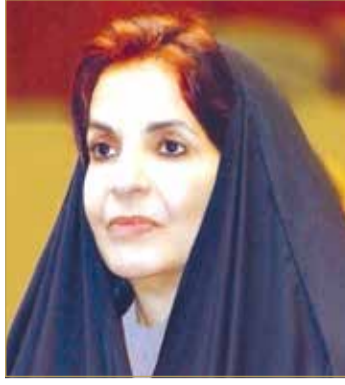
سمو قرينة ملك البلاد المعظم

وأكدت سمو الشيخة حصة بنت خليفة بن حمد آل خليفة أن المجلس الأعلى للمرأة أضاف إلى انطلاقة المرأة أبعادا أخرى متجددة، ويسعى إلى تجسيد