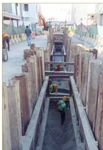
مشروع إنشاء شبكة الصرف الصحي المرحلة الثالثة لمجمع 1034 المالكية