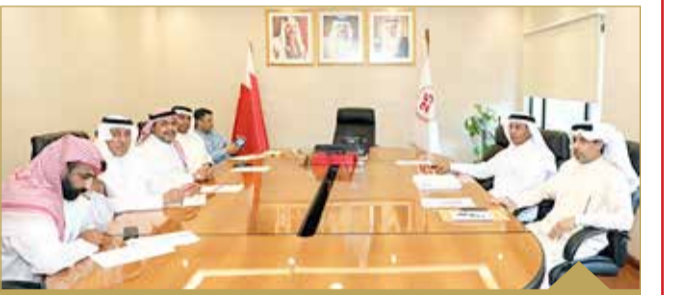
مدير عام الثروة البحرية يستقبل جمعية الميادين المحترفين: الحفاظ على المخزون السمكي والحد من التجاوزات