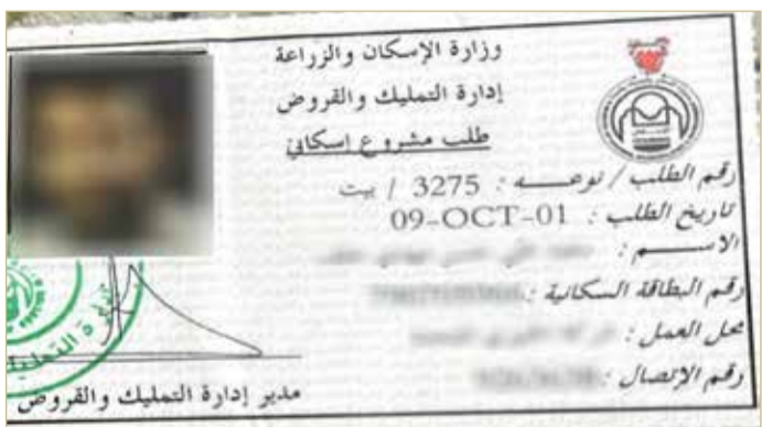
بطاقة الطلب الإسكاني