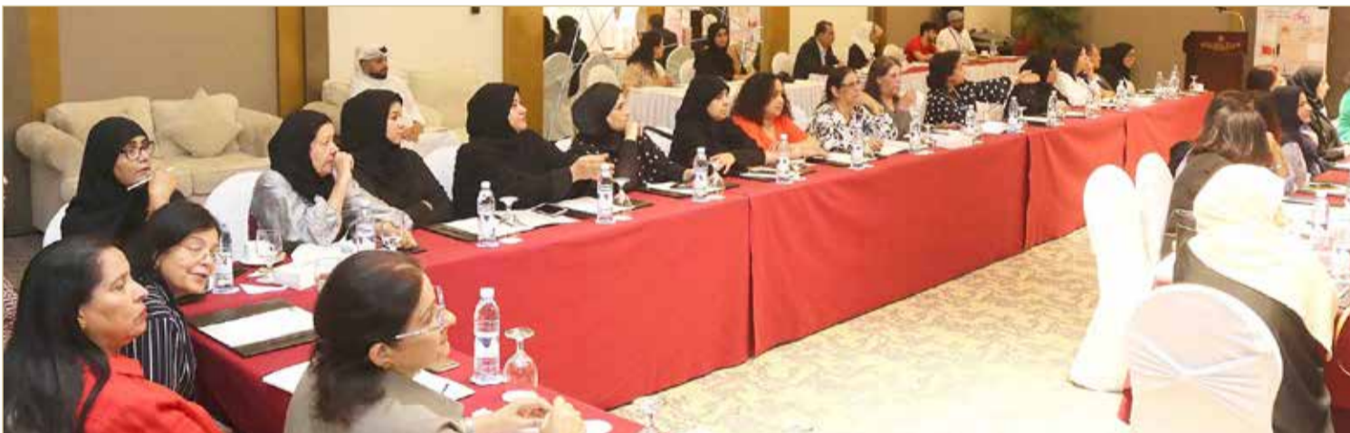
صورة أرشيفية لإحدى فعاليات الاتحاد النسائي

ذلك أنها تمس الاستقرار الأسري للمرأة والأسرة البحرينية.