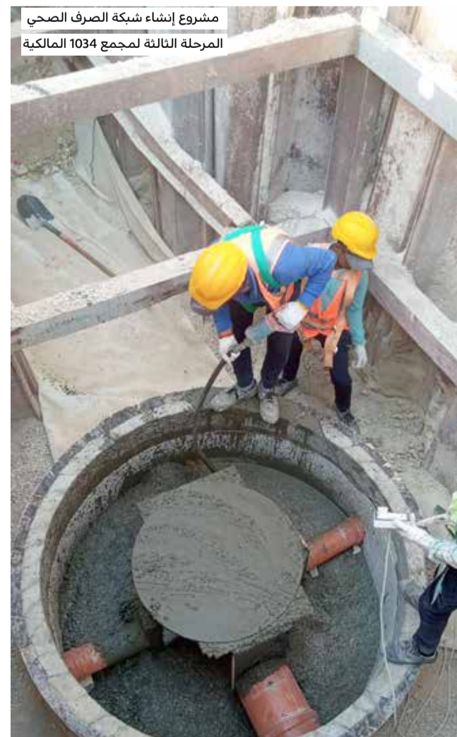
مشروع إنشاء شبكة الصرف الصحي المرحلة الثالثة لمجمع 1034 المالكية

الخدمات المقدمة تتطلب تصاريح عمل من عدة جهات ووزارات