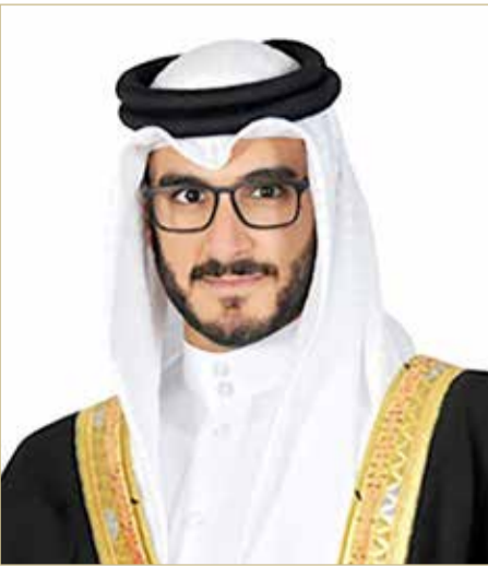
سمو الشيخ عيسى بن سلمان

وأشار سموه إلى أن هذا الإنجاز الرياضي المشرف الذي حققه فريق فيكتوربوس يضاف إلى سجل الإنجازات الرياضية البحرينية، ويسهم في تعزيز مكانة مملكة البحرين على خارطة رياضة