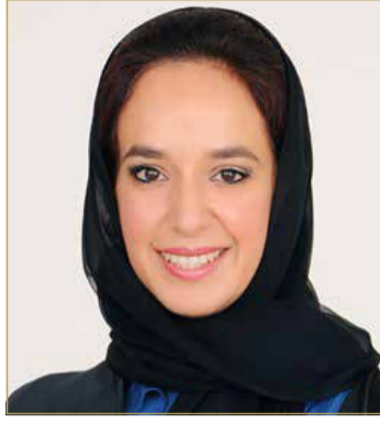
سمو الشيخة حصة بنت خليفة

أهدافها العليا في المشاركة الفاعلة في رسم ملامح وطننا العزيز بقيادة ملك البلاد المعظم صاحب الجلالة الملك حمد بن عيسى آل خليفة ملك مملكة البحرين ومؤازرة ولي العهد رئيس مجلس الوزراء صاحب السمو الملكي الأمير سلمان بن حمد آل خليفة. وقالت سمو الشيخة حصة بنت خليفة بن حمد آل خليفة في البرقية "إن ما