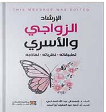
هذا الكتاب من سلسلة "البلاد" للدراسات والبحوث