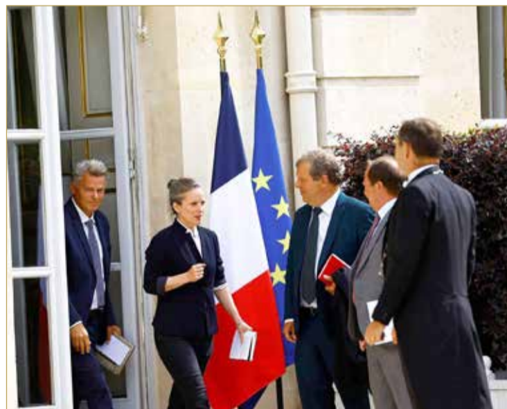
المرشحة لتولي منصب رئيس الحكومة الفرنسية لوسي كاستيه والأمين العام للحزب الشيوعي يغاندا قصر الإليزيه بعد الاجتماع مع الرئيس ماكرون أمس

أبدى تحالف اليسار في فرنسا، أمس، استعدادهم لإقامة ائتلافات- من أجل تشكيل حكومة، وذلك خلال أول لقاء عقده الرئيس إيمانويل ماكرون مع أبرز القوى السياسية في البلاد. واستقبل ماكرون في قصر الإليزيه الجبهة الشعبية الجديدة، وهي تحالف طرفي يضم قوى اليسار من اليسار راديكالي واشتراكيين ومدافعين عن البيئة وشيوعيين. وقالت مرشحة الجبهة لمنصب رئيس الوزراء لوسي كاستيه "يكفي إضاعة الوقت، مؤكدة أهمية احترام نتيجة الانتخابات، وإخراج البلاد من الشلل الذي تعاني منه". ورأت أن حلفاءها "مستعدون" للبحث عن "تسويات في ظل عدم التوصل إلى غالبية مطلقة".