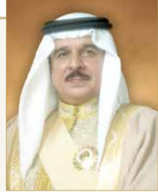
ملك البلاد المعظم