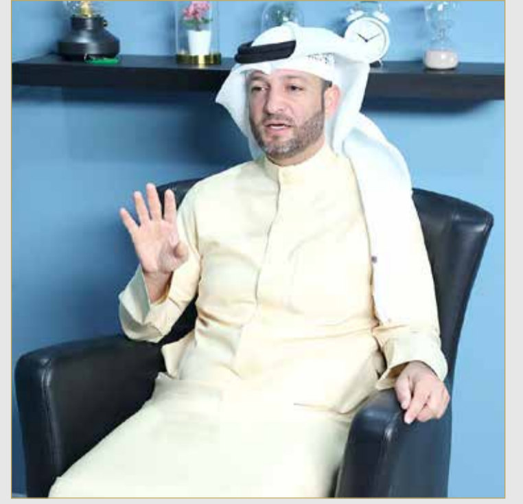
رئيس مجلس إدارة جمعية "التوحيدين" البحرينية