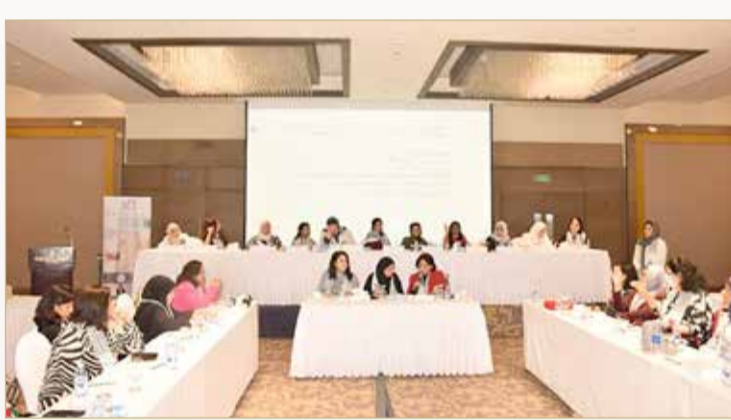
جانب من الجمعية العمومية الأخيرة للاتحاد النسائي

المرأة البحرينية اليوم وبمجهودات مضنية قامت بها وصلت لمراتب كبيرة، ودائما ما تلقى المرأة البحرينية - لدى حضورها المؤتمرات في الخارج وتقديم أوراق العمل المختلفة - الترحيب والإشادة بما وصلت إليه وبالتجارب المحلية الناجحة التي تحصلت عليها والتي تقدمها في هذه المؤتمرات، وكثير من الأوراق التي قدمتها استخدمت كنماذج ناجحة