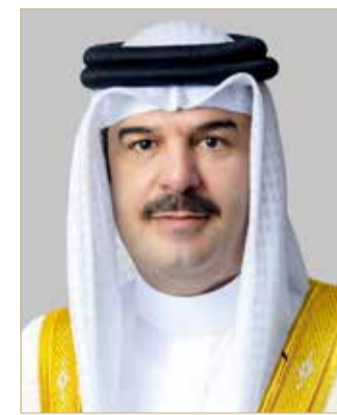
الشيخ دعيح بن سلمان

الإنجاز يعتبر استمراراً لمسيرة الإنجازات المتواصلة لرياضة الفروسية في البحرين