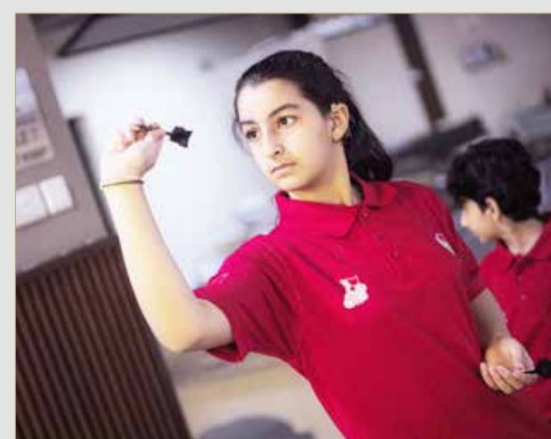
مشاركة ببطولة "الدارس" ضمن دورة ألعاب خالد بن حمد لجيل الذهب والتي تشهد مشاركة 16 اتحادا رياضيا، وتستهدف الفئة العمرية تحت 18 سنة. (10)