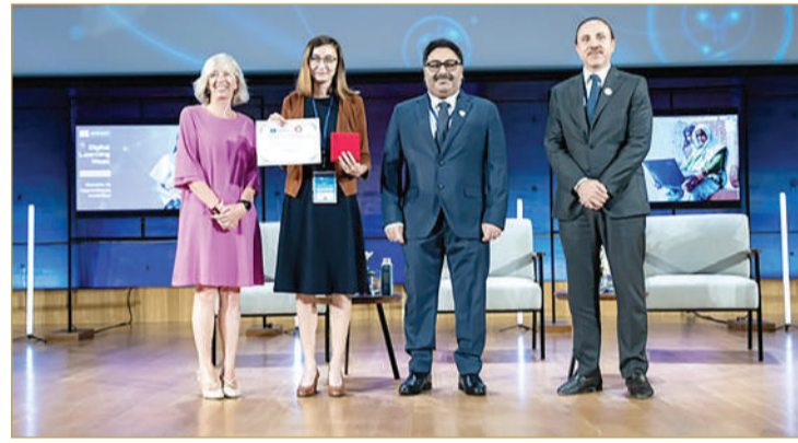
وزير التربية والتعليم يشارك في حفل تسليم جائزة اليونسكو

البحرين باليوبيل الفضي لتولى صاحب الجلالة ملك مملكة البحرين المعظم مقاليد الحكم، متمنية أن يمتد عمر الجائزة لسنوات قادمة نظراً لأهميتها.