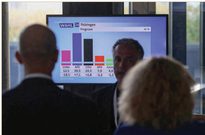
اليمن المتطرف الألماني يعجز لأول مرة في انتخابات إقليمية "أ ف ب"

يبرز اليمين المتطرف بوصفه لاعبا رئيسيا في ألمانيا بعد نتائجها القياسية في اقتراعين إقليميين في شرق البلاد، ما زاد من إضعاف ائتلاف يسار الوسط بزعامة أولاف شولتس قبل عام من الانتخابات البرلمانية.