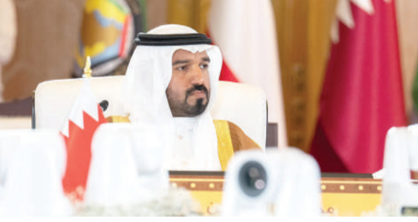
سمو الشيخ خليفة بن سلمان