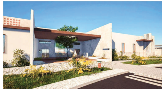
مجسم لما سيكون عليه مأوى الحيوانات عند اكتماله

مذكرة تفاهم، لتبادل الأفكار وتحديد أطر التعاون في مجالات الاهتمام بالحيوان، وتعزيز مستوى الوعي المجتمعي للرفق بالحيوان، ومسؤولية امتلاك الحيوانات والتعامل معها، إضافة إلى توفير منصة تطوعية لأفراد المجتمع المهتمين برعاية الحيوان. وأشارت ان الاتفاقية تضمنت تهيئة مستويات الكاثو، وربط نقاط التواصل والبلاغات عن الحيوانات الضالة في الأحياء، ويأتي توقيع الاتفاقية امتداداً لتعاون الأمانة مع مختلف القطاعات والجهات في رفع مستوى جودة الحياة، ودورها بالشراكة المجتمعية لرفع الوعي بالرفق بالحيوان.