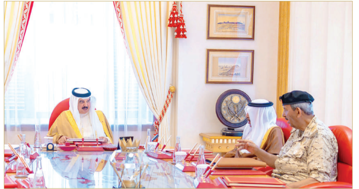
جلالة الملك المعظم القائد الأعلى للقوات المسلحة يستقبل القائد العام لقوة دفاع البحرين وعدد من كبار الضباط

◆ جلالتهم اطلع على الخطط المستقبلية لتطوير أسلحة ووحدات قوة الدفاع