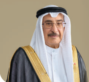
معالي الشيخ خالد بن عبدالله آل خليفة نائب رئيس مجلس الوزراء