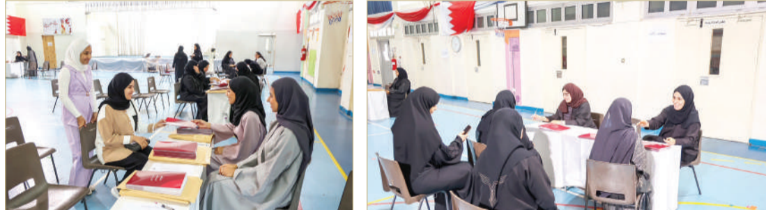
جانب اليوم التعريفي بمدرسة مدينة حمد الابتدائية للبنات