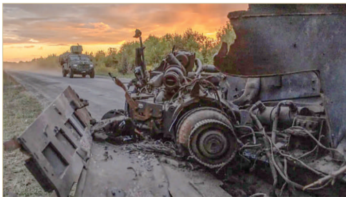
دبابة أوكرانية مدمرة في منطقة سومي داخل الأراضي الأوكرانية

تواصل الحرب الروسية على أوكرانيا، وفي آخر تطوراتها الميدانية، قصفت روسيا العاصمة الأوكرانية كييف بالصواريخ صباح الاثنين، فيما تسبب الحطام المتساقط في إصابة شخصين على الأقل واندلاع حرائق وإلحاق أضرار بالمنازل والبنية التحتية، بحسب ما قال مسؤولون. وذكرت الإدارة العسكرية للمدينة على تطبيق تيليجرام أن وحدات الدفاع الجوي الأوكرانية دمرت أكثر من عشرة صواريخ كروز ونحو عشرة صواريخ باليستية. ودوت صفارات الإنذار في أرجاء أوكرانيا لمدة ساعتين تقريبا قبل أن تعلن القوات الجوية أن السماء خالية من الصواريخ. فيما أعلنت وزارة الدفاع الروسية سيطرة قواتها على منطقة سكوتشني في شرق أوكرانيا.