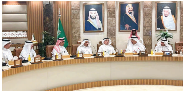
أمانة المنطقة الشرقية توقع مذكرة تفاهم مع ”ألفة“ لتعزيز الوعي المجتمعي في الرفق بالحيوان

وتجسد هذه المبادرة إيمان أرامكو السعودية بأهمية تحسين جودة الحياة، وتقليل مخاطر السلامة التي تهدد المجتمعات، كما تأتي استمراراً لدورها الرائد في مجال تعزيز الوعي بأهمية حماية التنوع الحيوي في المملكة وإشراك المجتمع في المبادرات ذات الصلة. وقالت أمانة المنطقة الشرقية، انها وقعت وشركة ألفة للرفق بالحيوان التي أطلقتها أرامكو السعودية،