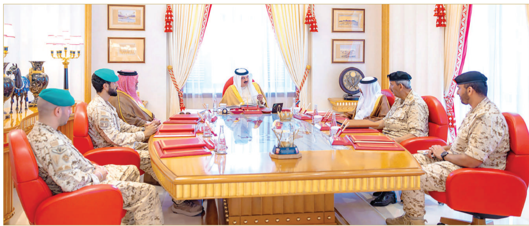
جلالة الملك المعظم القائد الأعلى للقوات المسلحة مستقبلا القائد العام لقوة دفاع البحرين