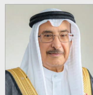
نائب رئيس مجلس الوزراء

وتابع المجلس تنفيذ توجيه ولي العهد رئيس مجلس الوزراء صاحب السمو الملكي الأمير سلمان بن حمد آل خليفة، بإقامة يوم تعريف