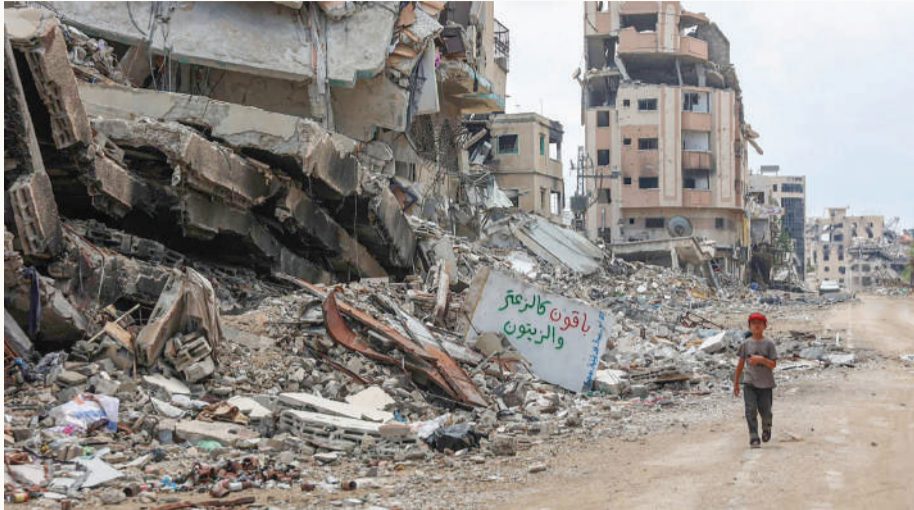
طفل فلسطيني يسير أمام أنقاض المباني في مدينة غزة

قال الرئيس الأمريكي جو بايدن، الاثنين، إن التوصل لاتفاق لإطلاق سراح المحتجزين لدى حركة حماس في غزة أصبح قريباً للغاية. لكن بايدن أكد أنه لا يعتقد أن رئيس الوزراء الإسرائيلي بنيامين نتنياهو يبذل ما يكفي من الجهد لضمان التوصل لاتفاق من هذا القبيل. وذكر قيادي في حماس لروبيرت أن "تصريحات بايدن تمثل اعترافاً أميركياً بمسؤولية نتنياهو عن فشل الاتفاق". وأضاف قيادي حماس أن "أي مقترح يتضمن وقف إطلاق النار الدائم والانسحاب الكامل ستعامل معه بجدية كبيرة".