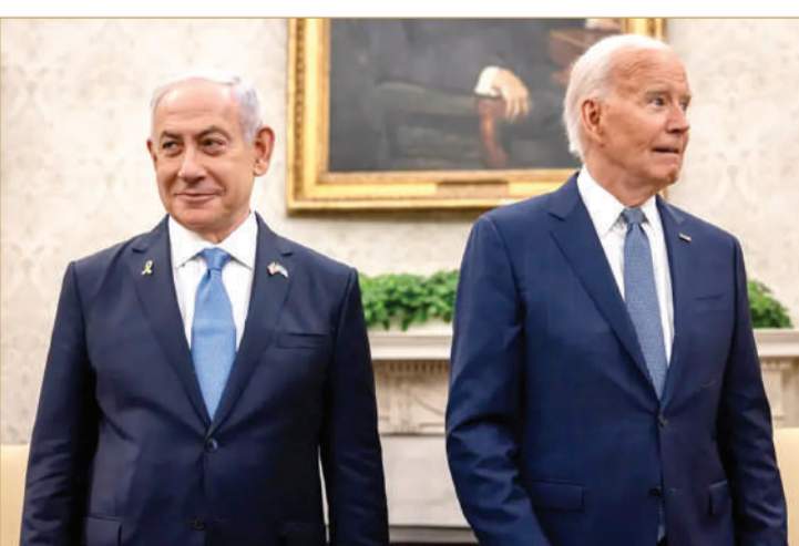
انتقاد بايدن لنتنياهو قد يفسر على أنه إشارة إلى خلافات بين الرجلين

يضغط على نتنياهو وليس على زعيم حماس يحيى السنوار، بشأن الجهود الرامية للتوصل لاتفاق في غزة. وأضافت المصادر أن تصريح بايدن