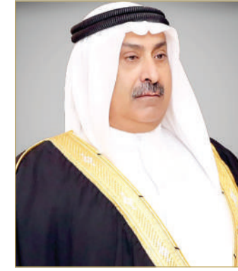
وكيل وزارة الداخلية

للموقوفين، والتأكد من سلامتهم والاطمئنان عليهم، والعمل على متابعة الإجراءات القانونية من قبل السلطات اليمنية الشقيقة.