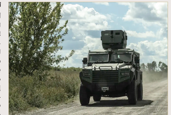
دبابة للجيش الأوكراني في منطقة كورسك

أف ب - وكالات أكد الرئيس الروسي فلاديمير بوتين الخميس، أنه في حال سمح الغربيون لأوكرانيا باستخدام صواريخ بعيدة المدى حصلت عليها كييف لضرب الأراضي الروسية، فإن ذلك يعني أن دول حلف شمال الأطلسي في حرب ضد روسيا. وقال بوتين في مقطع مصور نشره صحافي مقرب من الرئاسة الروسية على تلغرام إذا اتخذ هذا القرار، فإن ذلك سيعني على الأقل ضلوعا مباشرا لدول الناتو في الحرب في أوكرانيا. هذا الأمر سيغير طبيعة النزاع نفسها. هذا سيعني أن دول الناتو هي في حرب ضد روسيا. وتطالب