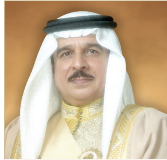
ملك البلاد المعظم