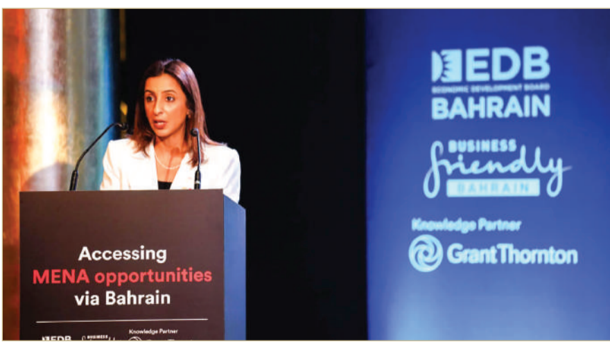
وزيرة التنمية المستدامة الرئيسية التنفيذي لمجلس التنمية الاقتصادية

وتستمر بيئة الأعمال المزدهرة في البحرين وما تتميز به من موقع استراتيجي وما تتبناه من سياسات حكومية داعمة في جذب استثمارات كبيرة من الشركات الهندية، فقد نما الرصيد التراكمي للاستثمارات المباشرة الهندية في البحرين بنسبة 36.6 %، إذ يبلغ متوسط مساهمة الاستثمارات الهندية 102 مليون دولار أميركي سنويًا بين عامي 2019 و2023. ليصل إجمالي الرصيد التراكمي للاستثمارات المباشرة إلى 1.52 مليار دولار أميركي في عام 2023.