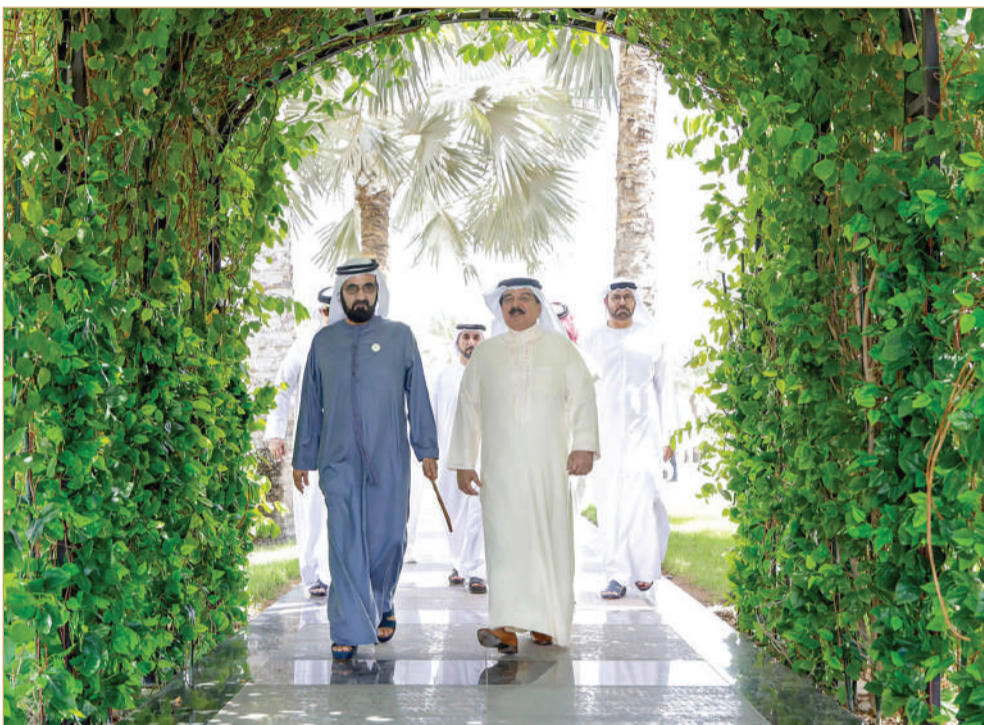
ملك البلاد المعظم يلتقي نائب رئيس دولة الإمارات العربية المتحدة الشقيقة رئيس مجلس الوزراء حاكم دبي

التقى ملك البلاد المعظم صاحب الجلالة الملك حمد بن عيسى آل خليفة، أمس الخميس، نائب رئيس دولة الإمارات العربية المتحدة الشقيقة رئيس مجلس الوزراء حاكم دبي صاحب السمو الشيخ محمد بن راشد آل مكتوم، وذلك في مقر إقامة جلالته الملك المعظم بأبوظبي، في إطار الزيارة التي يقوم بها جلالتهم إلى دولة الإمارات. وفي اللقاء، تبادل صاحب الجلالة الملك المعظم، وصاحب السمو الشيخ محمد بن راشد آل مكتوم، الأحاديث الودية عما يجمع مملكة البحرين وشقيقتها دولة الإمارات من علاقات أخوية متينة، وحرص مشترك على مواصلة ترسيخها لما فيه خير الشعبين الشقيقين. كما تطرق اللقاء إلى ما تشهده علاقات التعاون بين البلدين من تقدم مستمر على جميع المستويات، وأهمية تعزيز العمل المشترك بما يخدم أولويات التنمية في البلدين.