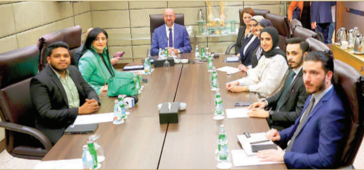
جانب من اللقاء الصحفي

دول الاتحاد الأوروبي ومملكة البحرين، لفت إلى أنها ستكون ضمن الموضوعات المدرجة على طاولة القمة الخليجية الأوروبية، موضحاً أن مثل هذه الاتفاقيات توفر فرص قوية لزيادة تعزيز التجارة والاستثمار بين أوروبا ودول مجلس التعاون الخليجي عموماً، والبحرين خصوصاً.