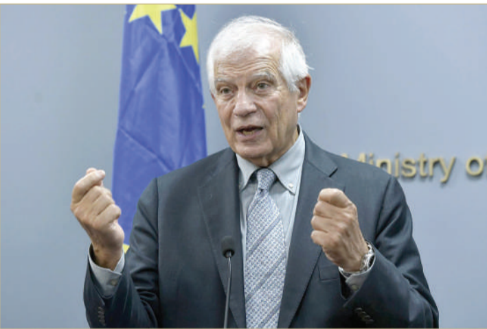
بوريل في مؤتمر صحفي