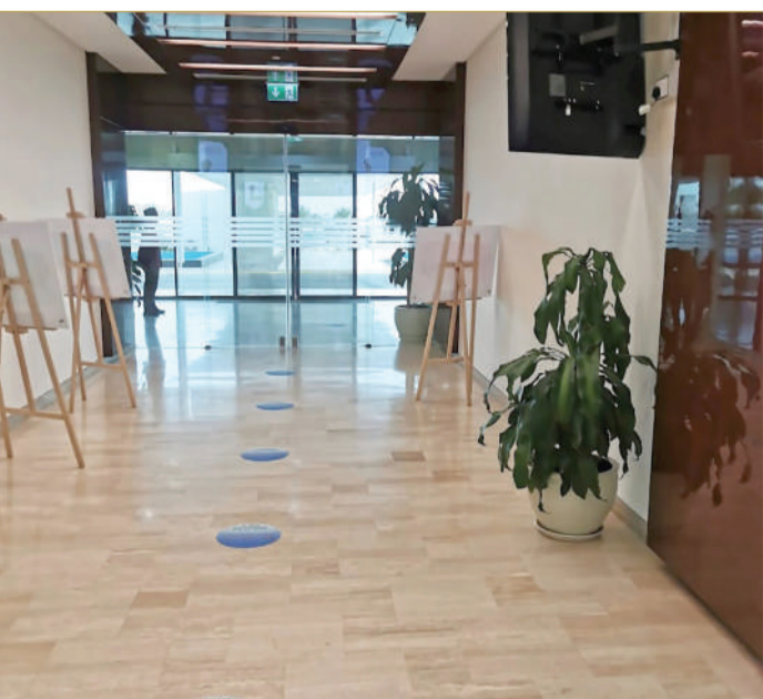
صورة من داخل المستشفى

مجهول، ما يشعرهم بالضيق جراء كثرة الانتزاعات. وأشارت إلى أن 3 أقسام بالمستشفى توقفت ألا وهي قسم الولادة، وقسم إدخال المرضى وقسم العمليات، في حين ما زالت 3 أقسام قيد العمل وهي العيادات الخارجية وعيادة علاج العقم والطوارئ.