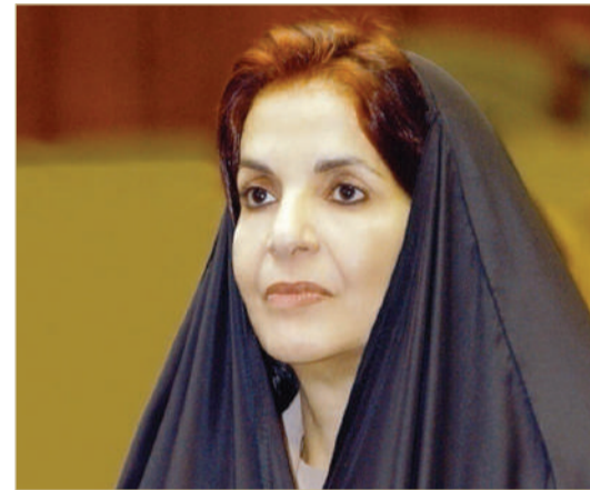
سمو قريبة عاهل البلاد المعظم