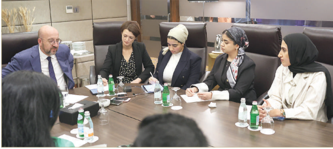
جانب من اللقاء الصحفي بحضور "البلاد"

ترأس رئيس مجلس أمناء المستشفيات الحكومية الشيخ هشام بن عبدالعزيز آل خليفة الاجتماع الدوري الرابع للمجلس للعام 2024م. وثمن توجيهات سمو ولي العهد رئيس مجلس الوزراء بشأن سرعة الانتهاء من قوائم الانتظار لعمليات زراعة القوقعة، مشيداً بجهود الفريق القائم على البرنامج في تصفير قوائم الانتظار لعمليات زراعة القوقعة الإلكترونية بمجمع السلمانية الطبي في أغسطس الماضي، ما أسهم في تعزيز مستوى كفاءة الرعاية الصحية المقدمة بالمملكة. واستعرض مجلس الأمناء الموضوعات المدرجة على جدول أعمال الاجتماع ومنها عرض الإنجازات المتحققة بالنصف الأول من العام الجاري، كتخصيص جناح خاص للنساء من مرضى فقر الدم المنجلي (السكرلر)، إضافة إلى مناقشة عدد من المشروعات التطويرية؛ بهدف تحسين التجربة العلاجية للمرضى في المستشفيات الحكومية، ومستجدات مشروعات تحسين الأداء، وخطة التدريب