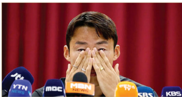
جون هو سون

الأمن العام الصينية إن الأشخاص 433 كانوا من بين 128 متورطا في تحقيق استمر عامين للكشف عن المراهات غير القانونية والتلاعب بنتائج المباريات في اللعبة المحلية. واتهم الاتحاد الصيني سون بالمشاركة في التلاعب بنتائج المباريات وتلقي الرشي.