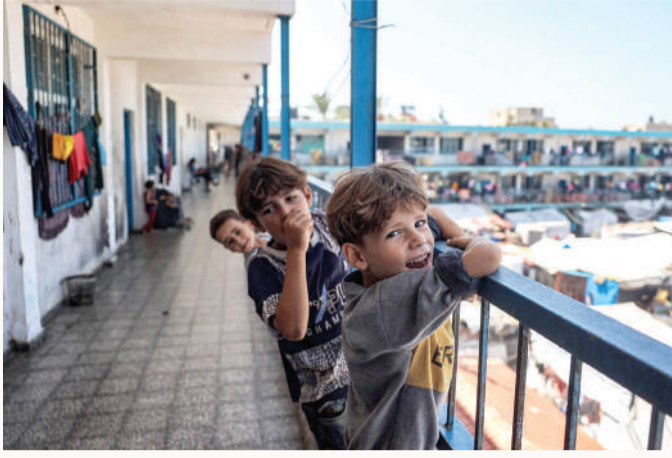
أطفال بمركز لـ "الأونروا" في غزة

◆ تنديد دولي بمقتل موظفين أمميين في غارة إسرائيلية بقطاع غزة