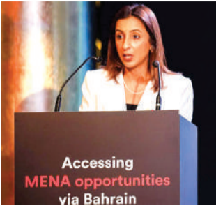
Accessing MENA opportunities via Bahrain

تمكن مجلس التنمية الاقتصادية بدعم من فريق البحرين من استقطاب استثمارات متوقعة بقيمة 16.65 مليون دولار لإقامة مقرات، وتوسعة 3 شركات هندية رائدة في قطاعات الصناعة والطاقة المتجددة وتكنولوجيا المعلومات والاتصالات، ضمن الزيارة التي يقوم بها وفد المجلس إلى مدن مومباي وبنغالور وتشيناي؛ بهدف تعزيز الروابط الاقتصادية مع الهند واجتذاب الاستثمارات المباشرة إلى البحرين؛ للمساهمة في خلق الوظائف.