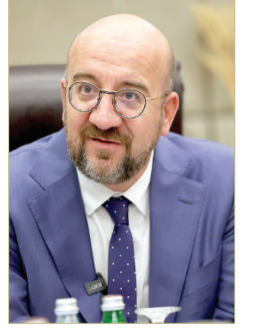
رئيس مجلس الاتحاد الأوروبي