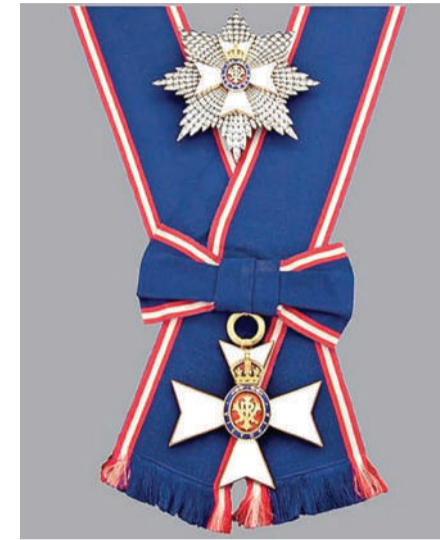
لندن - بنا

في إطار الزيارة التي يقوم بها ملك البلاد المعظم صاحب الجلالة الملك حمد بن عيسى آل خليفة، للمملكة المتحدة الصديقة، منح ملك المملكة المتحدة لبريطانيا العظمى وأيرلندا الشمالية صاحب الجلالة الملك تشارلز الثالث، صاحب الجلالة الملك المعظم، وسام فارس الصليب الأعظم الملكي الفيكتوري، الذي يعد من أعلى الأوسمة التي يمنحها ملك المملكة المتحدة، وذلك في احتفال جرى بقصر وندسور.