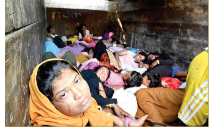
لاجئون من الروهينغا

يُسهم تغير المناخ في دفع عدد قياسي من الناس إلى الفرار من منازلهم حول العالم، كما يؤدي إلى تدهور ظروف النزوح التي تُعد بالفعل أشبه بحجيم، وفق ما أفادت به الأمم المتحدة، يوم الثلاثاء. وفي وقت تُجرى فيه محادثات المناخ في باكو، سلّطت المفوضية السامية للأمم المتحدة لشؤون اللاجئين الضوء على كيفية تأثير ارتفاع درجات الحرارة وأحوال الطقس الحادة في أعداد النازحين وظروفهم، داعية إلى الاستثمار بشكل أكبر وأفضل للحد من المخاطر. ويعيش عدد قياسي من الناس يبلغ 120 مليون نسمة بالفعل في حالة نزوح قسري؛ نتيجة الحروب والعنف والاضطهاد، معظمهم داخل بلدانهم، وفق ما أظهرت أرقام المفوضية. وتشير المفوضية، في الوقت ذاته، إلى بيانات صدرت أخيرا عن مركز مراقبة النزوح الداخلي أظهرت أن الكوارث المرتبطة بالطقس دفعت نحو 220 مليون شخص إلى النزوح داخل بلدانهم على مدى العقد الأخير وحده، وهو ما يعادل 60 ألف حالة نزوح تقريبا يوميا.