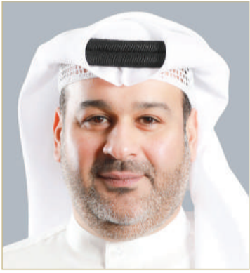
الشيخ حمد بن سلمان

بتجربة العميل في مختلف مراكز الخدمة بالوزارة، وتحسين تجاربه بمختلف القطاعات، عبر استخدام الوسائل التكنولوجية المناسبة لتقديم وإنجاز الخدمات وفق اتفاقية مستوى الخدمة المعتمدة لدى الوزارة، داعياً جميع المتعاملين مع مراكز خدمة العملاء بوزارة الصناعة والتجارة إلى الاستفادة من تطبيق "مواعيد"، لحجز وجدولة المواعيد بكل يسر وسهولة.