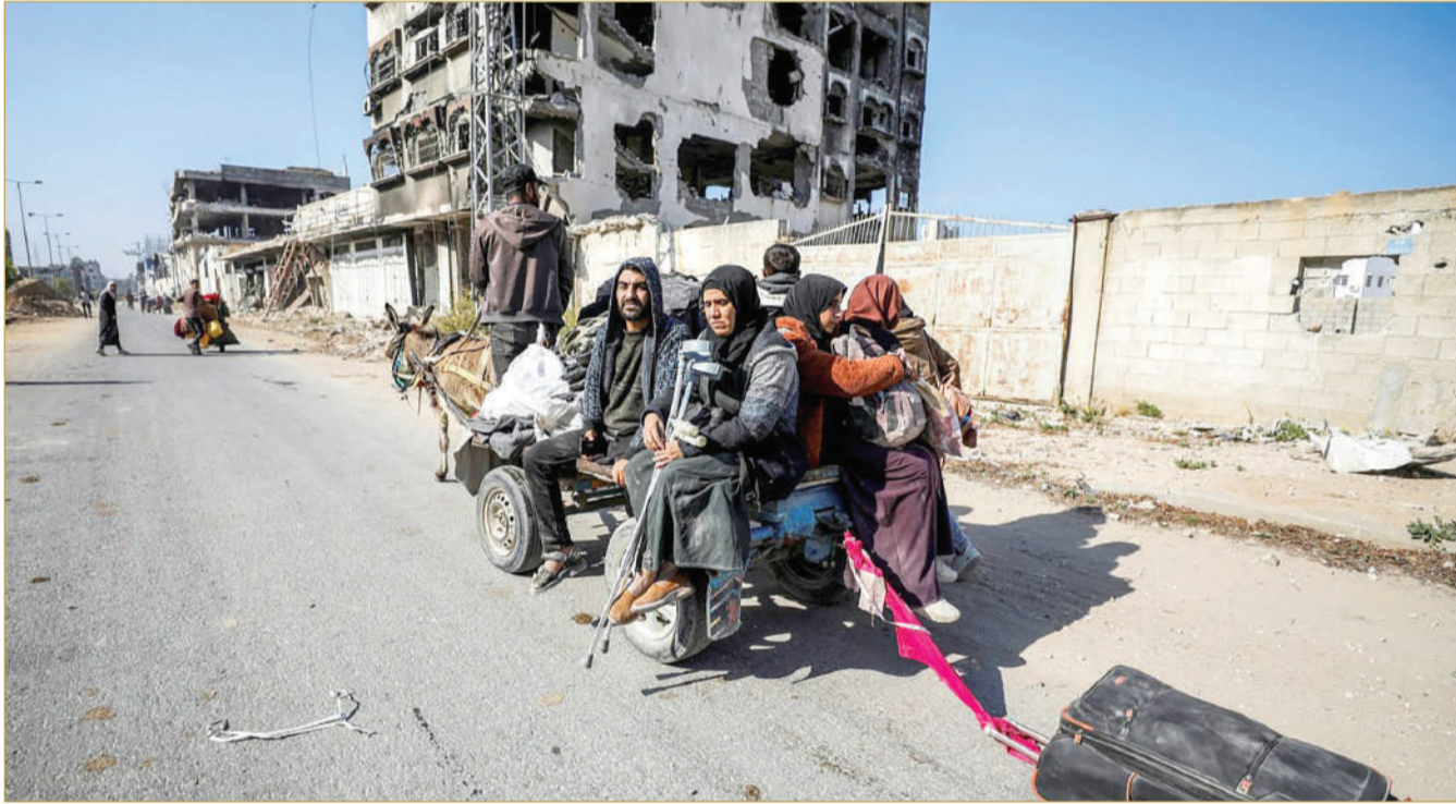
نازحون من شمال قطاع غزة إلى مدينة غزة الثلاثاء

وأضاف دوجاريك أنه على مدى الأيام الثلاثة الماضية، قامت فرق من "أوتشا" ومن وكالات الأمم المتحدة لحقوق الإنسان وإزالة الألغام ومجموعات إنسانية أخرى، بزيارة 9 مواقع في مدينة غزة لتقييم احتياجات مئات العائلات النازحة، التي يعود الكثير منها إلى شمال غزة. وقال خبراء في مجال الأمن الغذائي العالمي إن هناك احتمالا قويا بأن المجاعة باتت وشيكة في أجزاء من شمال قطاع غزة، حيث تواصل إسرائيل هجومها العسكري. واتهم المفوض العام لوكالة الأمم المتحدة لغوث وتشغيل اللاجئين الفلسطينيين "الأونروا" فيليب لازاريني، إسرائيل باستخدام الجوع سلاحا.