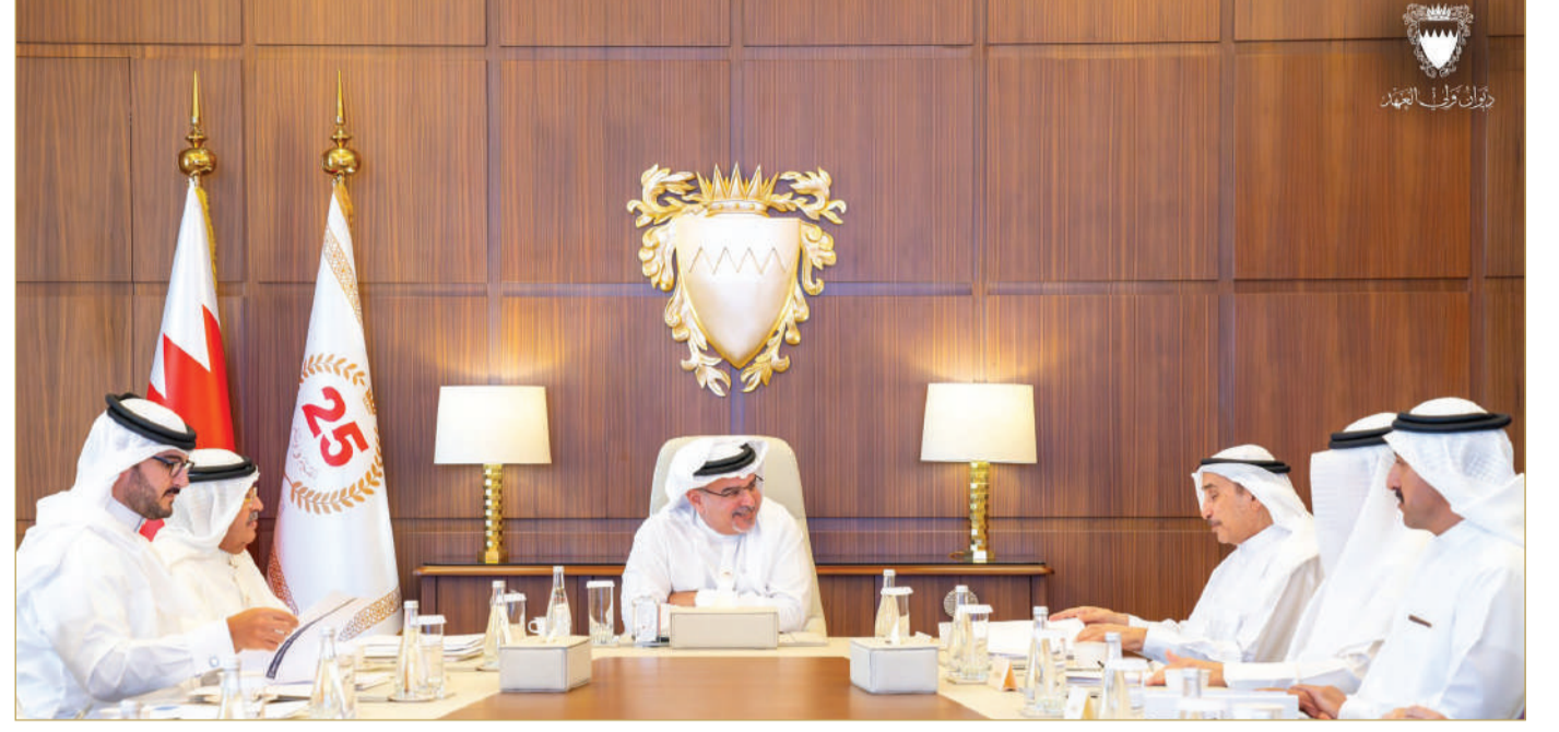
نائب جلالة الملك ولي العهد يرأس اجتماع اللجنة التنسيقية

”التنسيقية“ ناقشت مقترحات لتعزيز كفاءة قطاع الكهرباء والماء