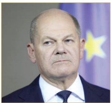
المستشار الألماني أولاف شولتس

ويأتي القرار بعد أسبوع من المشاحنات في برلين، بعد أن أقال شولتس وزير المالية في حكومته كريستيان ليندنر.