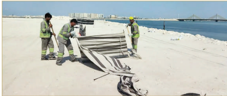
مخالفة الإشغالات غير المرخصة على سواحل العاصمة

وفي المحافظة الشمالية قامت بلدية المنطقة الشمالية بإزالة 114 سيارة، ما بين خردة ومهجورة، من منطقة الهمة الصناعية، التي تشهد اكتظاظا بسبب وجود السيارات المهجورة بالقرب من الكراجات وورش تصليح وسمكرة المركبات، ما يتسبب في إعاقة الحركة المرورية وإشغال الطرق العامة بصورة غير نظامية.