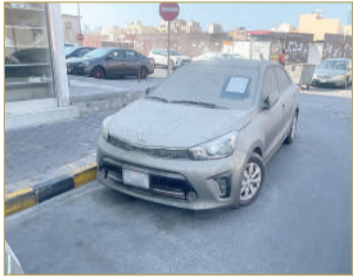
مخالفة السيارات المهجورة بالطرقات العامة