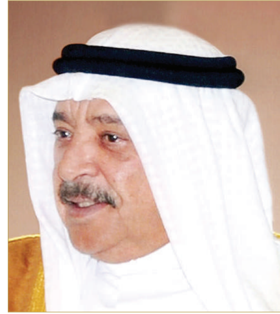
الشيخ خالد بن أحمد

كما أن البطولة على روزنامة موسم نادي البحرين للجولف بعد اختتام بطولة سمو رئيس الحرس الوطني مؤخراً. ويتقدم أعضاء نادي البحرين للجولف بخالص الشكر وعظيم الامتنان إلى وزير الديوان الملكي على رعايته المتجددة لهذه البطولة، الأمر الذي يسهم في الارتقاء برياضة الجولف العريقة في مملكة البحرين.