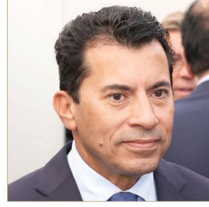
د. اشرف صبحي