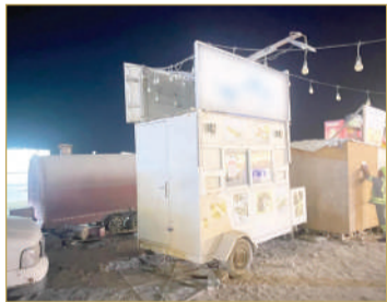
إخطار عربات الطعام المهجورة بساحل كراباد

كراباد، إضافة إلى القيام بإزالة فرشات الباعة الجائلين ومنصات البيع خارج الملك في شارع الشيخ حمد ووسط منطقة المنامة، وإزالة المخالفات في منطقة سوق جدحفص المركزية.