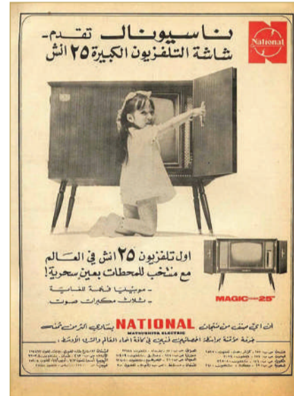
تلفزيون خشبي بأربع قنوات