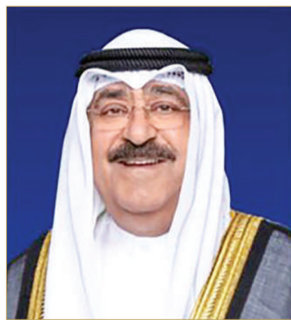
سمو أمير دولة الكويت

* الرئيس المؤسس رئيس مجلس أمناء الجامعة الأهلية