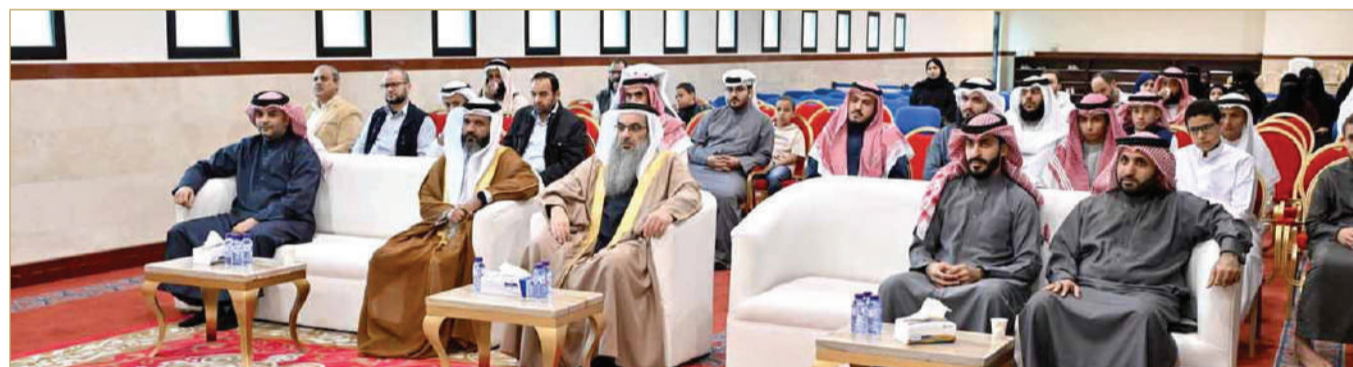
معهد القراءات يكرم الفائزين في الدورة الثانية من مسابقة متون