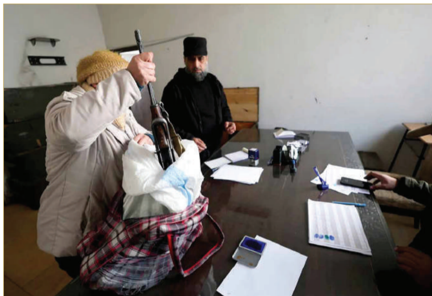
عضو سابق في القوات الأمنية التابعة لنظام بشار الأسد يسلم سلاحا لمقاتلي هيئة تحرير الشام

ومن المرجح أن يقع مثل هذا القرار على عاتق الإدارة القادمة للرئيس المنتخب دونالد ترامب وقد يستغرق تنفيذه شهورا أو أكثر، وفقا لصحيفة "واشنطن بوست".