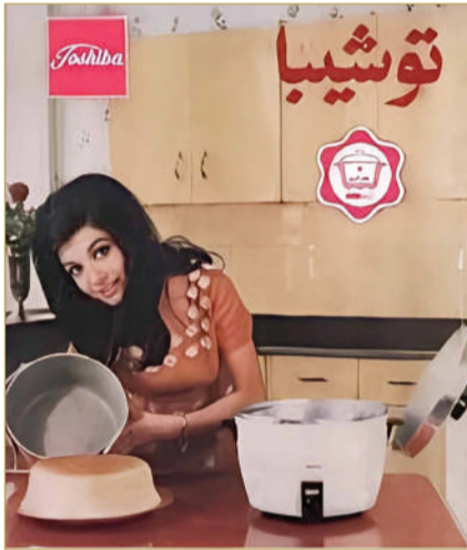
جهاز صنع الكعك

ومن باب المثال، كان قسم الإلكترونيات والأجهزة المنزلية التابع لشركة يوسف خليل المؤيد وأولاده في أربعينات القرن الماضي يضم جميع الأجهزة المنزلية من تلفزيونات وثلاجات وتدفئة وتهوية وتكييف، أما شركة متجر روبين (شارب) التي تأسست في العام 1958، وشركة خليفات التي تأسست في العام 1968، فتخصصت الأولى منهما في الأجهزة المنزلية ”ماركة شارب“، والثانية تخصصت في أجهزة المطابخ من ”ماركات“ عالمية مثل: بوش، بوجنول، ليجن روزيت، مينوتي ونولتي، ثم تطورت أعمال الشركات العاملة في هذا المجال وافتتحت لها فروعاً داخل وخارج مملكة البحرين.