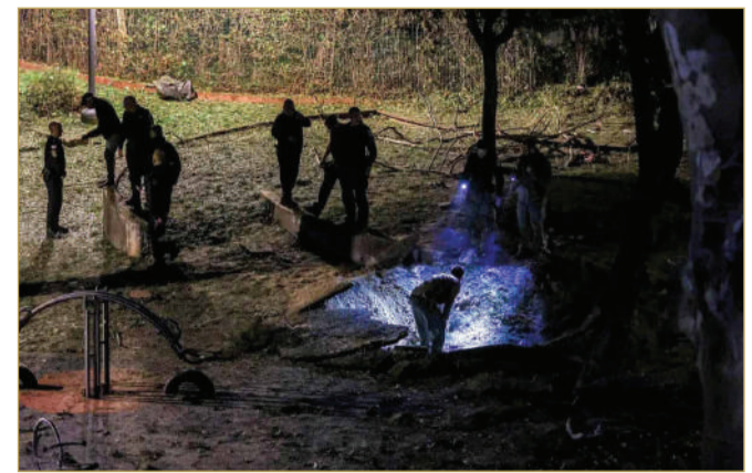
موقع سقوط الصاروخ الحوثي في إسرائيل

تستعد جماعة الحوثي في اليمن لأي رد محتمل من إسرائيل بعد الهجوم الذي شنته فجرا على وسط إسرائيل، وخلف إصابة 16 شخصا. وأفادت مصادر يمنية لـ"سكاي نيوز عربية" أن جماعة الحوثي رفعت حالة التأهب في مناطق سيطرتها، استعدادا لأي رد إسرائيلي محتمل على هجماتها الأخيرة. وأوضحت المصادر أن الجماعة المدعومة من إيران أصدرت توجيهات غير معلنة تقضي بتقييد حركة قياداتها وتمويهها، بينما انتقلت معظم القيادات البارزة إلى مواقع سكنية جديدة كإجراء احترازي. كما أشارت المصادر إلى أن القيادات الحوثية أصبحت تتعامل بحذر مع الهواتف الخلوية، حيث يتم استخدام وسطاء موثوقين لإدارة عمليات التواصل والنشر، ما أدى إلى تراجع ملحوظ في نشاطهم على منصات التواصل الاجتماعي. وكان الجيش الإسرائيلي أعلن السبت أن صاروخا أطلق من اليمن أصاب الأراضي الإسرائيلية قرب تل أبيب بعد فشل محاولات اعتراضه.