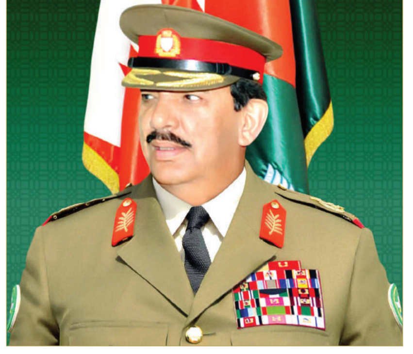
القائد العام لقوة دفاع البحرين