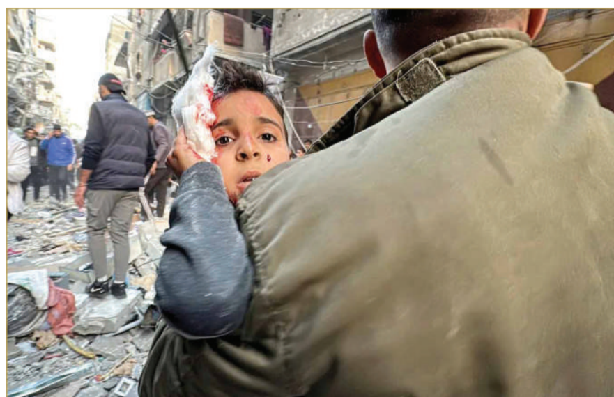
فلسطيني يحمل طفلاً مصاباً في غارة إسرائيلية على مخيم النصيرات وسط غزة

الإسرائيلية أفادت بأن نصفهم لقوا حتفهم. في حين تحتجز إسرائيل في سجونها آلاف الفلسطينيين منذ أعوام.