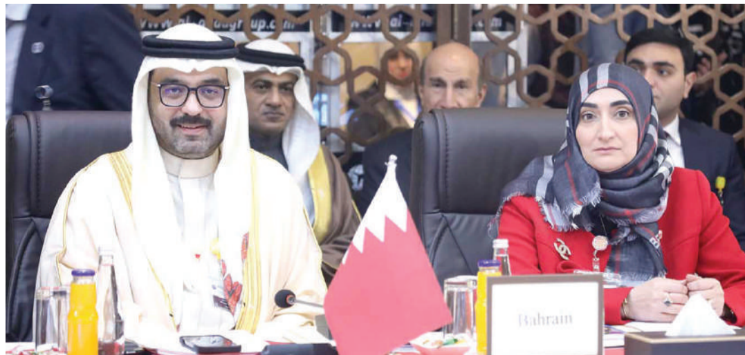
اجتماع اللجنة السياسية بالجمعية البرلمانية لآسيوية في العراق