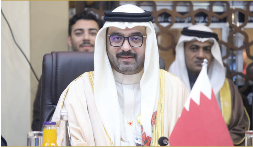
مشاركة السلوم في اجتماع الجمعية البرلمانية لآسيوية ببغداد

المقبلة. وأضاف: إن مواقف مملكة البحرين تجاه القضايا الإقليمية تقوم على مبادئ راسخة ورؤية واضحة تُترجم إلى خطوات عملية تؤكد التزامنا العميق بالسلام العادل والمستدام وأسس الشرعية الدولية، وتأتي في مقدمة هذه القضايا، القضية الفلسطينية، التي تمثل قضية العرب الأولى وتشكل جوهر الصراع في منطقة الشرق الأوسط، موضحاً أن مملكة البحرين تؤكد التزامها الكامل بدعم الحقوق المشروعة للشعب الفلسطيني، وفي مقدمتها حقه الأصلي في إقامة دولته المستقلة وعاصمتها القدس الشريف.