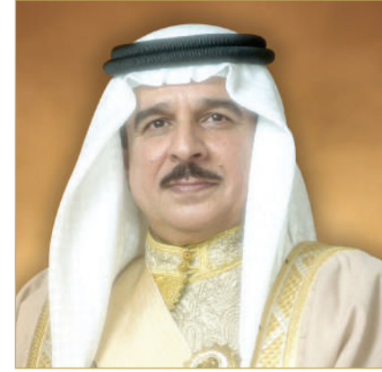
جلالة الملك المعظم

مارس 2022، تهدف إلى تعزيز التعاون بين البلدين في مجالات الدفاع والتجارة والعلوم والتكنولوجيا الناشئة. وأكدت نائبة الرئيس الدعم لمواصلة تعزيز الاتفاقية، مشيرة إلى انضمام المملكة المتحدة حديثاً إلى الاتفاقية، كدليل على إمكان أن تصبح نموذجاً للتكامل