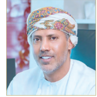
الشيخ خالد المعشني