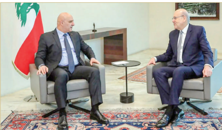
رئيس الجمهورية جوزيف عون أثناء اجتماعه مع رئيس الوزراء نجيب ميقاتي في بيروت "أرشيفية"

من جهته، أعلن دريان تبني مضامين خطاب قسّم عون، عاداً أنه بمثابة إعادة الروح إلى الكيان اللبناني الذي عانى من أزمتا وويلات، كما عانى الشعب اللبناني من دموع وآلام وجراح لا ينهيها مطلقاً إلا تنفيذ.