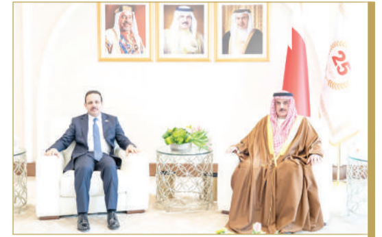
« رئيس "النواب": دعم تطوير التعاون البرلماني مع العراق »