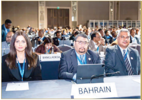
« وزير "الكهرباء": البحرين ملتزمة بالتحول المستدام للطاقة المتجددة »