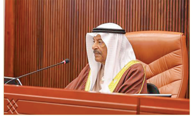
رئيس المجلس علي الصالح

ووافق مجلس الشورى، برئاسة رئيس المجلس علي الصالح، على مشروع قانون بالتصديق على الاتفاقية بين حكومة مملكة البحرين وحكومة دولة الإمارات العربية المتحدة، لإزالة الازدواج الضريبي في شأن الضرائب على الدخل ومنع التهرب والتجنب الضريبي. وقال الشوري د. علي الحداد إن الاتفاقية تهدف إلى توثيق التعاون بين البلدين في القطاعات الواعدة والاستفادة من الإمكانيات الاقتصادية الكبيرة المتوفرة في السوقين البحرينية والإماراتية، بما يفتح آفاقاً جديدة