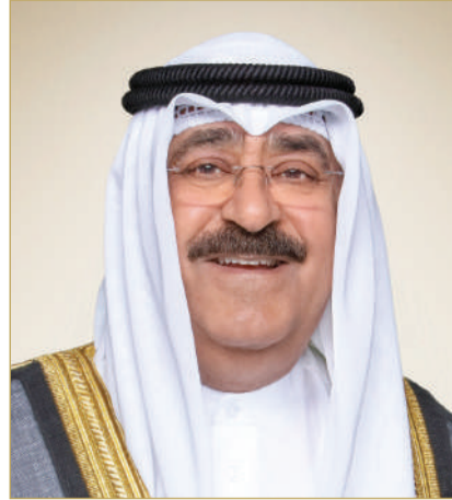
سمو أمير دولة الكويت

الله التقدير أن يديم على جلالة الملك المعظم موفور الصحة والسعادة، وأن يحقق لشعب