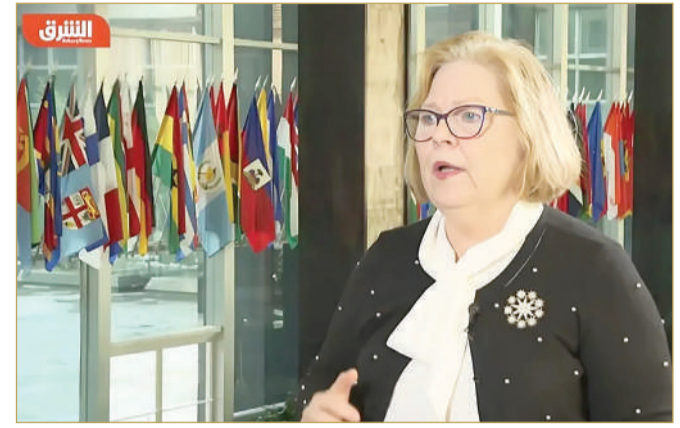
باربرا ليف، مساعدة وزير الخارجية الأميركية لشؤون الشرق الأوسط.

قالت مساعدة وزير الخارجية الأميركي لشؤون الشرق الأوسط باربرا ليف، إن المنطقة تشهد ما وصفته بتشكيل شرق أوسط جديد وسوريا جديدة، لكنها شددت على أن التهديدات ما تزال قائمة في سوريا بعد الإطاحة بنظام الرئيس السوري بشار الأسد. وأضافت باربرا ليف، في مقابلة خاصة مع "الشرق"، أنه سيتعين على إدارة الرئيس الأميركي المنتخب دونالد ترامب اتخاذ العديد من القرارات بشأن العقوبات المفروضة على سوريا. وفي 8 ديسمبر، سيطرت فصائل المعارضة المسلحة السورية على العاصمة دمشق، ما أجبر الأسد على الفرار بعد حرب دامت أكثر من 13 عاماً، لينتهي حكم عائلته الذي استمر عقوداً. وأشارت ليف إلى إجراء مناقشات مع الإدارة الجديدة في سوريا بشأن العقوبات، مضيئة أن هذه الأمور ستكون متروكة لإدارة ترامب كذلك، بالإضافة إلى مسألة بقاء القوات الأميركية في سوريا.