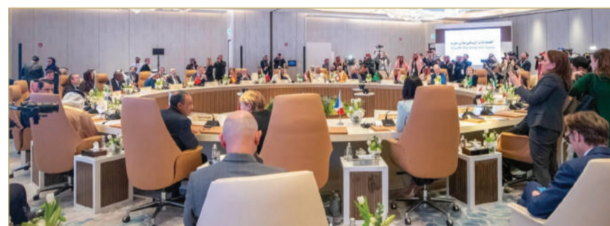
جانب من اجتماع الرياض بشأن سوريا الذي استضافته السعودية الأحد

السابق سيرقرل طموحات الشعب السوري في تحقيق التنمية وإعادة البناء وتحقيق الاستقرار، معرباً عن تقدير المملكة للدول التي أعلنت عن تقديم مساعدات إنسانية وإنمائية للشعب السوري. كما أشاد وزير الخارجية السعودي بخطوات الإدارة السورية الجديدة الإيجابية في مجال الحفاظ على مؤسسات الدولة، واتخاذ نهج الحوار مع الأطراف السورية، والتزامها بمكافحة الإرهاب، وإعلانها البدء بعملية سياسية تضم مختلف مكونات الشعب السوري، بما يكفل تحقيق استقرار سوريا وصيانة وحدة أراضيها، وألا تكون سوريا مصدر تهديد لأمن واستقرار دول المنطقة. وجدد إدانة السعودية لتوغل إسرائيل داخل المنطقة العازلة مع سوريا والمواقع المجاورة لها في جبل الشيخ، ومحافظة القنيطرة، معرباً عن رفض المملكة لهذا التوغل باعتباره احتلالاً وعدواناً ينتهك القانون الدولي واتفاق فض الاشتباك المبرم بين سوريا وإسرائيل في العام 1974، مطالباً بالانسحاب الفوري لقوات الاحتلال الإسرائيلي من الأراضي السورية المحتلة.