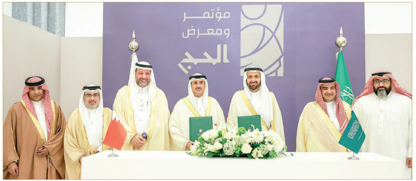
وزير العدل والشؤون الإسلامية وقع الاتفاقية مع وزير الحج والعمرة السعودي

تحت رعاية كريمة من خادم الحرمين الشريفين الملك سلمان بن عبدالعزيز آل سعود، الذي يعقد بمدينة جدة بالمملكة العربية السعودية الشقيقة، بمشاركة أكثر من 300 جهة محلية ودولية على مدى 4 أيام.