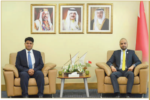
« تعزيز علاقات التعاون مع بنغلاديش »