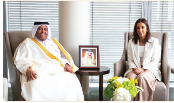
« وزيرة التنمية المستدامة تستقبل سفير دولة قطر »