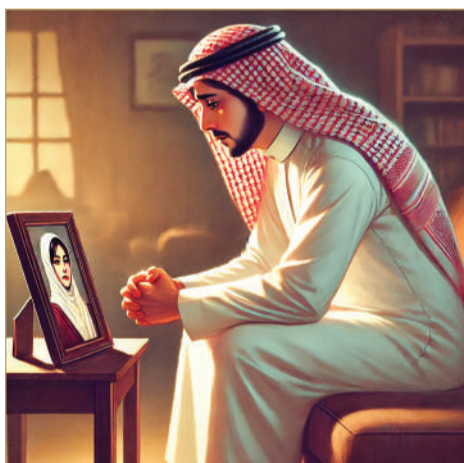
صورة تعبيرية بالذكاء الاصطناعي