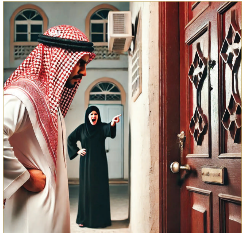
صورة بالذكاء الاصطناعي تظهر امرأة تقف أمام باب مغلق والجار أمامها غاضب

منها المحافظة، والبلدية، بالإضافة إلى وزير البلديات، دون الحصول على أي إنصاف أو حل مرض.