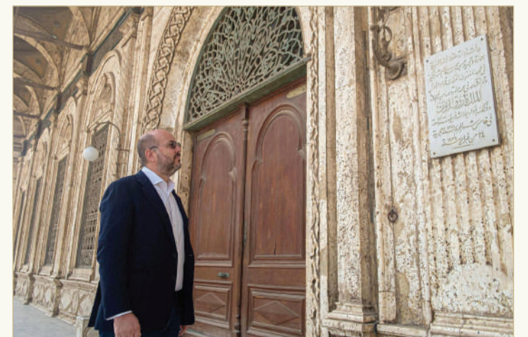
عاد وريث العرش السابق الأمير محمد علي نجل الملك فؤاد الثاني إلى القاهرة. وتخلّى عن حياة مريحة في باريس. وأكد أنه لا يطمح إلى أي دور سياسي.