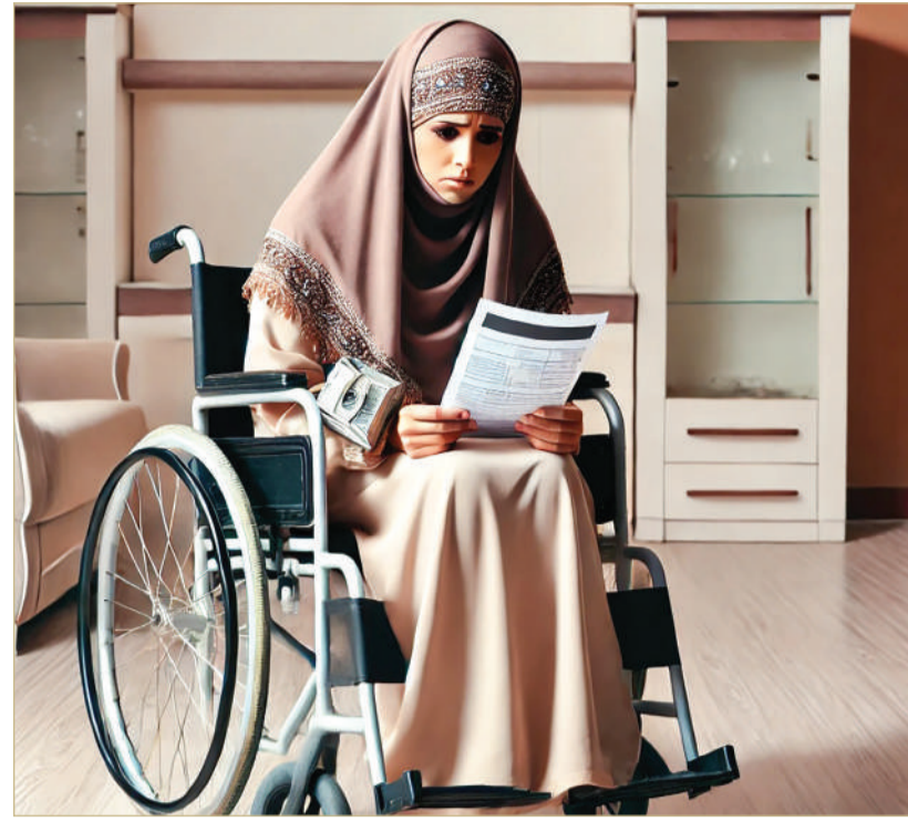
صورة تعبيرية بالذكاء الاصطناعي لامرأة تحمل أوراقاً ترمز لمبلغ دفعته لمكتب استقدام العمالة المنزلية

البلاد أنا امرأة مريضة ومقعدة وأحتاج إلى مساعدة. قمت بدفع مبلغ إلى أحد مكاتب استقدام العمالة المنزلية، فتم جلب عاملة لكنها لم تستمر سوى أسبوع واحد ثم هربت دون أي سبب. وبعد مرور عشرة أيام، تم توفير عاملة أخرى، إلا أن المكتب قام بخصم 50% من المبلغ الإجمالي الذي دفعته. أتساءل: ما ذنبي كي أحسر مالي بينما تهرب العاملات ويعملن بنظام