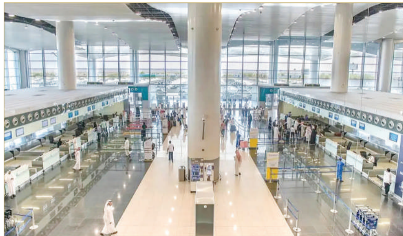
مطار الملك خالد الدولي بالرياض

وتستهدف تجويد الخدمات المُقدّمة للمسافرين، ورفع مستواها، وتحسين تجربة المسافر. وعلى مستوى شركات الطيران، احتلت الخطوط الجوية السعودية المركز الأول بين الناقلات الوطنية بنسبة التزام 86% في القدوم، و88% في المغادرة، كما حققت طيران "ناس" 71% في القدوم و75% في المغادرة، فيما سجلت "أديل" 80% في القدوم و83% في المغادرة. كما سلط التقرير الضوء على أبرز المسارات الجوية المحلية والدولية، حيث شهدت رحلة "أبها - جدة" التزاماً بنسبة 95% بالحركة الجوية المحلية، فيما احتلت رحلة "الدمام - دبي" المرتبة الأولى بين الرحلات الدولية بنسبة التزام 93%.