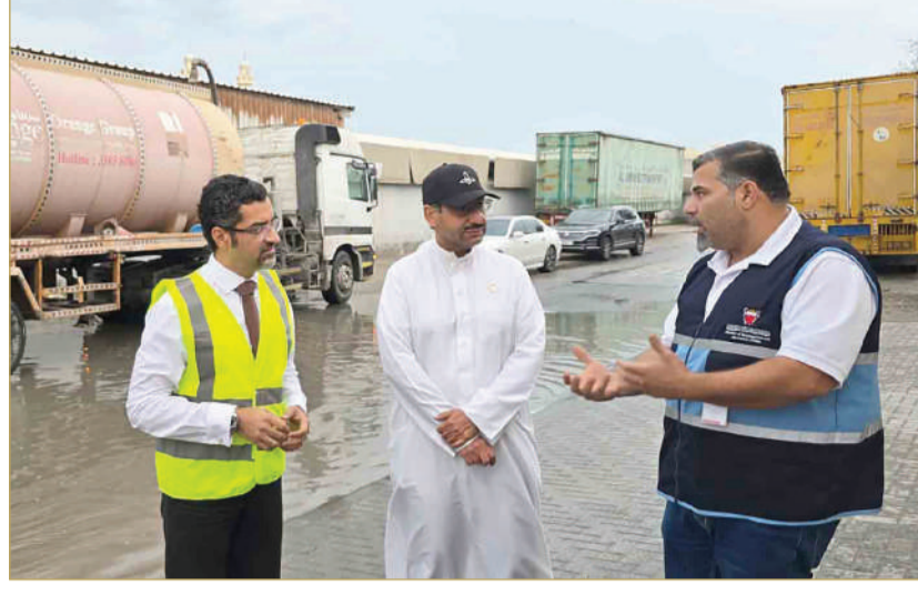
جانب من جولة الوزير التفقدية لعدد من المناطق في مختلف محافظات مملكة البحرين

ساخنًا لتبليغ عن تجمعات مياه الأمطار في الشوارع الداخلية، حيث يمكن التواصل على رقم 80008188.