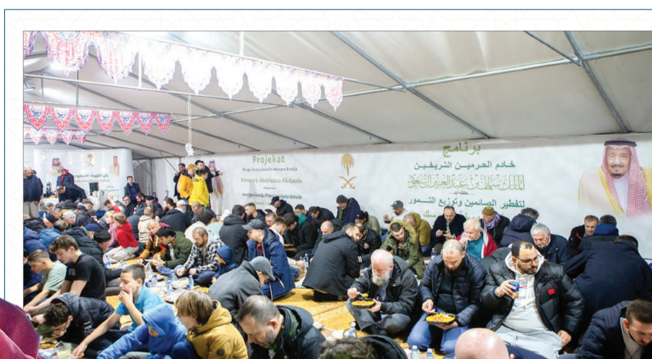
البوسنة: أقامت سفارة السعودية في البوسنة إفطارًا للصيام في مسجد الملك فهد بسراييفو، وهو أكبر مسجد في العاصمة البوسنية وأكبر مشروع عمراني في البلقان.