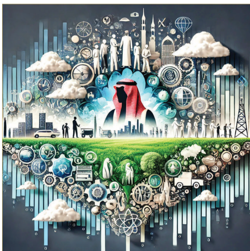
صورة تعبيرية تم توليدها بالذكاء الاصطناعي

كشف التقرير عن ارتفاع معدلات المشاركة المجتمعية في العمل غير الربحي، حيث مارس 23% من السعوديين أنشطة تطوعية، فيما قام 47% منهم بالتبرع خلال عام 2024. كما انعكس هذا التوجه على معدلات