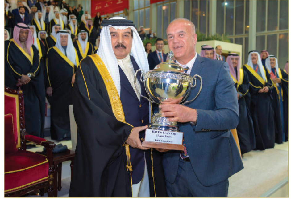
جلالة الملك المعظم يتفضل فيشمل برعايته الكريمة مهرجان كأس جلته لسباق الخيل

« شكر وتقدير للجهود الطبية التي يبذلها نادي راشد للفروسية وسباق الخيل والهيئة العليا للنادي « تعزيز مكانة البحرين على خريطة رياضة سباقات الخيل العالمية كوجهة رائدة و متميزة في تنظيم هذه السباقات « نجاحات عديدة حققها نادي راشد للفروسية وسباق الخيل العريق منذ انطلاقة