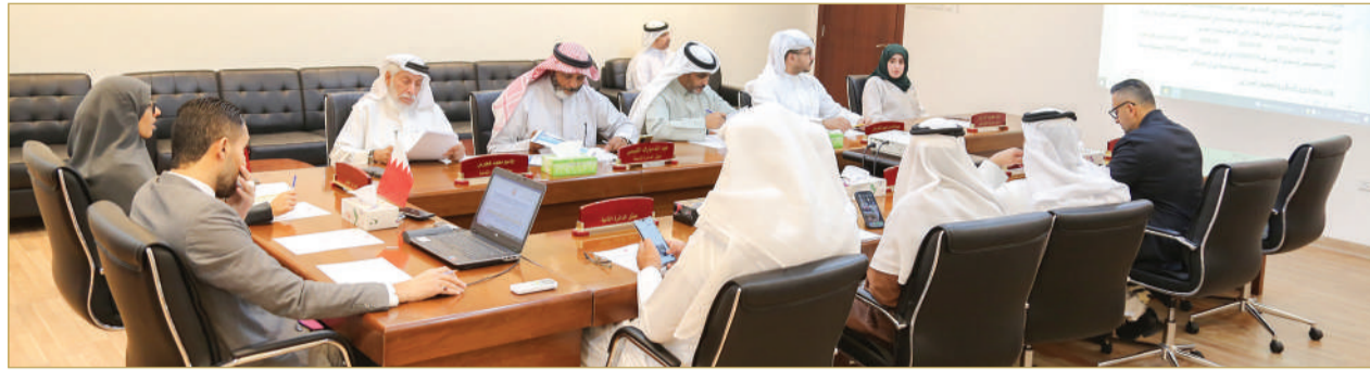
جانب من الجلسة

وقال إن الوزارة تعتزم دراسة خطة مستقبلية لتطوير الموقع وإنشاء سوق مستقبلي لتخدم أهالي المنطقة والمناطق المجاورة، في حال توافر الموازنات المخصصة لهذا الشأن، أو عبر الشراكة مع القطاع الخاص.