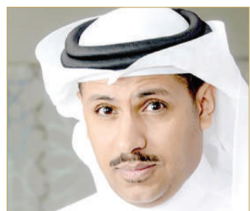
د. خالد الحيدان

إطار واجهة مستخدم متطورة. وأضاف الوكيل المساعد للبريد أن وزارة المواصلات والاتصالات ماضية في خطتها الشاملة لتطوير قطاع البريد، من خلال اهتمامها بتنمية الموارد البشرية، وتطوير الخدمات والبنية التحتية والأنظمة، ودعم التحول الرقمي، بما يتماشى مع توجهات الحكومة بشأن تحسين الخدمات وتعزيز مساهمتها في دعم التنمية المستدامة، بالتوافق مع رؤية البحرين الاقتصادية 2030.