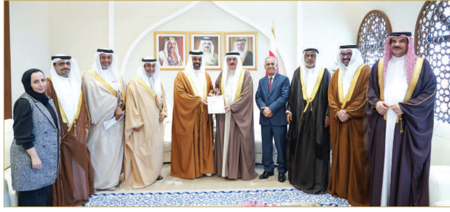
أثناء تسليم الميزانية

وأشاد رئيس المجلس النواب بجهود ولي العهد رئيس مجلس الوزراء صاحب السمو الملكي الأمير سلمان بن حمد آل خليفة، في دعم التعاون المثمر، وتطوير الأداء الحكومي، والعمل على تحقيق برنامج التوازن المالي، ودعم القطاع الخاص وتطويره. وأشار إلى حرص مجلس النواب على مناقشة مشروع قانون اعتماد الميزانية العامة للدولة للسنتين الماليتين 2025-2026، وفق الأطر القانونية والدستورية، وبما يراعي المصلحة العليا للوطن، ويلبي احتياجات المواطنين وتطلعاتهم.