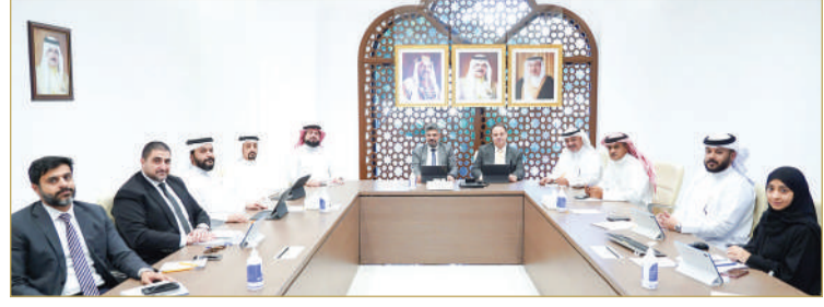
القضيبية - مجلس النواب

الإثبات في المواد المدنية والتجارية الصادر بالمرسوم بقانون رقم (14) لسنة 1996 “المعد بناء على الاقتراح بقانون المقدم من مجلس الشورى الموقر”. 2 - الاقتراح بقانون رقم ( ) لسنة بشأن تنظيم الذكاء الاصطناعي. 3 - الاقتراح بقانون بتعديل نص المادة (199) من قانون المرافعات المدنية والتجارية الصادر بالمرسوم بقانون رقم (12) لسنة 1971. (اقرأ الموضوع كاملاً بالموقع الإلكتروني).