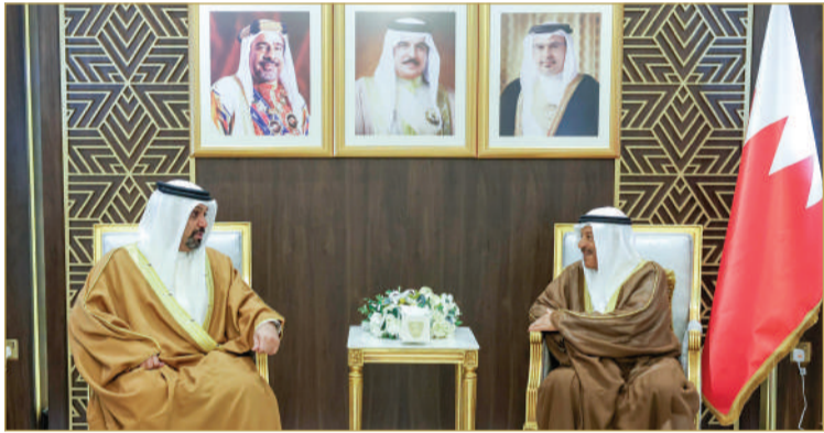
رئيس مجلس الشورى مستقبلاً وزير “المالية”

للدولة للسنتين الماليتين (2025 - 2026م). وأشاد رئيس مجلس الشورى بالمشاورات والحوارات البناءة التي شهدتها الاجتماعات المشتركة بين السلطتين التشريعية والتنفيذية، والتي أسهمت في تبادل وجهات النظر والآراء بشأن المبادئ والأسس التي يقوم عليها مشروع الميزانية العامة للدولة. (اقرأ الموضوع كاملاً بالموقع الإلكتروني).