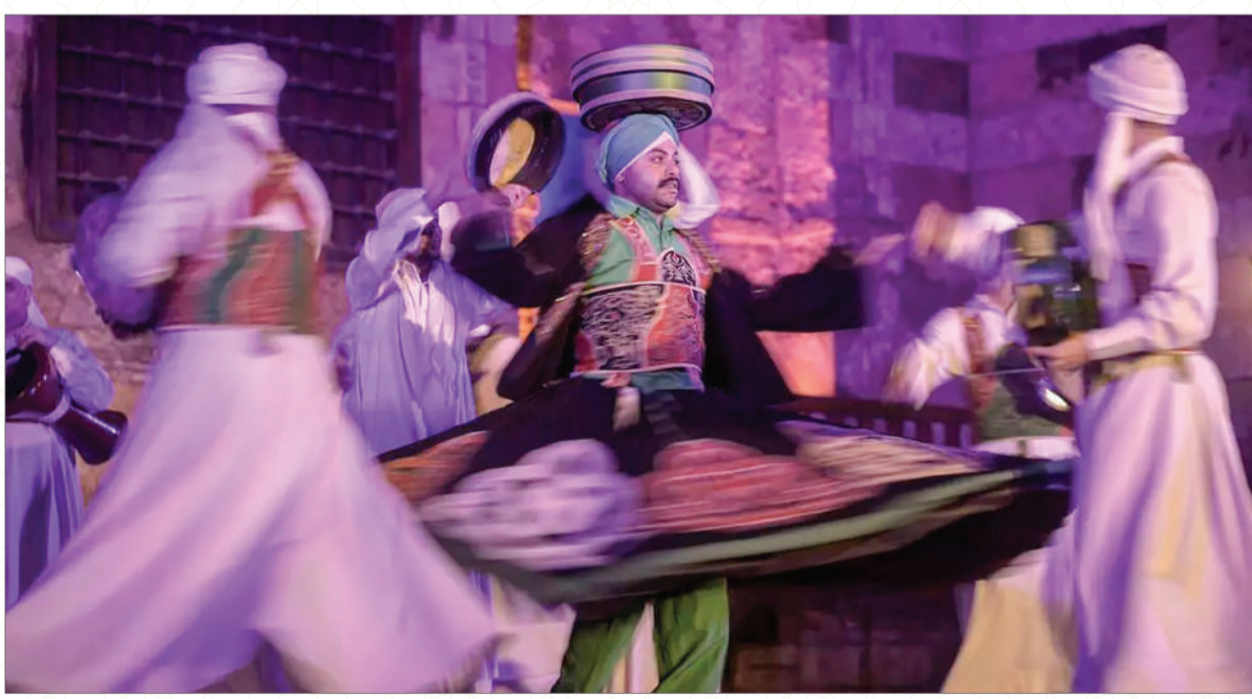
مصر: دراويش يدورون خلال عرض ديني لإحياء شهر رمضان المبارك في مجمع السلطان قنصوح الغوري في القاهرة.

وقالت إنها تزوجت في عمر صغير تقريباً 19 عامًا، موضحة أن الزواج كان على الطريقة التقليدية.