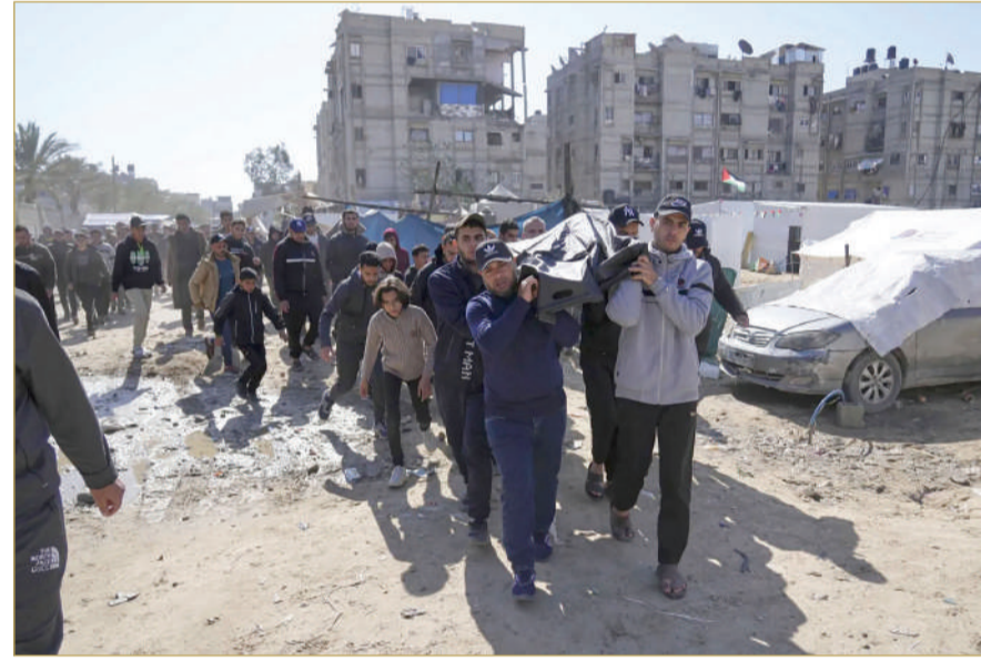
730 شهيدا منذ استئناف الضربات الإسرائيلية على غزة

فقد شدد وزير الخارجية الإسرائيلي الاثنين، على أن تل أبيب لن تدخل مساعدات لقطاع غزة المحاصر إذا كانت حماس ستستفيد منها. وأضاف في مؤتمر صحفي مشترك مع مفوضة السياسة الخارجية في الاتحاد الأوروبي كايا كالس، أنه يمكن وقف الحرب غداً إذا تخلت حماس عن سلاحها وأفرجت عن الرهائن. بدورها، شددت كالس على أنه يجب ألا يكون لحماس أي دور بغزة في المستقبل، مؤكدة ضرورة بذل مزيد من الجهد للعمل بشأن مستقبل قطاع غزة. وأعلنت وزارة الصحة في قطاع غزة، الاثنين، أن 730 فلسطينياً استشهدوا منذ استئناف الضربات الإسرائيلية، فجر الثلاثاء الماضي، على قطاع غزة، مؤكدة أن 61 شهيداً نُقلوا إلى المستشفيات خلال 24 ساعة، حتى