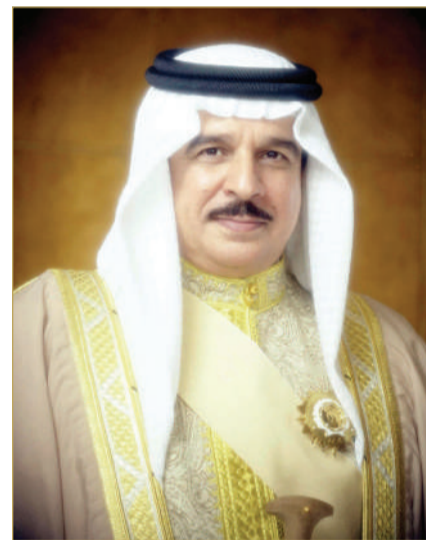
جلالة الملك المعظم

في إطار احتفال مملكة البحرين بيوم الشباب البحريني، هنأ ملك البلاد المعظم صاحب الجلالة الملك حمد بن عيسى آل خليفة، شباب مملكة البحرين في يومهم الوطني، مشيراً جلالته إلى أن تخصيص 25 مارس يوماً للشباب البحريني، الذي يعود لذكرى تأسيس جلالته للمجلس الأعلى للشباب والرياضة في العام 1975، هو تأكيد للدور الريادي الذي ينهض به شبابنا، ولجهودهم المتميزة التي تجعلهم ركيزة أساس في تنمية الوطن. وأضاف جلالته الملك المعظم أن شبابنا هم مصدر للفخر ومنبع للأمل وهم الثروة الوطنية الحقيقية، مؤكداً جلالته إيمانه أن الرهان على الشباب البحريني هو رهان مضمون، وتمكينهم وتأهيلهم هو أساس الأولويات الوطنية. وقال جلالته إن أهم المحطات التي وصل إليها الشباب البحريني في هذا العام، هو