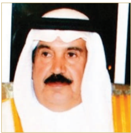
الشيخ دعيح بن سلمان

البحريني ودعمهم في تحقيق طموحاتهم. وأشاد النائب الثاني للمجلس الأعلى للشباب والرياضة بالدور البارز الذي يلعبه سمو الشيخ خالد بن حمد آل خليفة النائب الأول لرئيس المجلس الأعلى للشباب والرياضة رئيس الهيئة العامة للرياضة، في تطوير الشباب البحريني من خلال مبادراته المتنوعة وخاصة في المجال الرياضي، مؤكداً أن هذه المبادرات أسهمت في رفع مستوى قدرات الشباب، مما جعل الشباب البحريني يحقق العديد من الإنجازات المشرفة على المستويات المحلية والإقليمية والدولية.