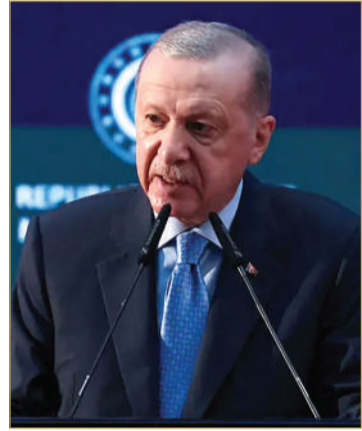
رجب طيب اردوغان

إسطنبول عملية أمنية استهدفت مجموعة من المشاركين في الاحتجاجات التي اندلعت عقب توقيف عدد من الأشخاص، من بينهم إمام أوغلو، ضمن تحقيقات تتعلق بتشكيل وقيادة منظمة إجرامية. كما أوضحت المصادر الأمنية أن 99 شخصاً يُشتبه في خرقهم قانون التجمعات والمظاهرات رقم 2911، وقد أوقف 71 منهم، فيما تستمر عمليات البحث عن 28 مشتبهاً آخرين. وبدأت النيابة العامة باتخاذ الإجراءات القانونية بحق الموقوفين. تأتي هذه التطورات في وقت تتواصل فيه التظاهرات، لاسيما في محيط مبنى بلدية إسطنبول في منطقة سرايخان، حيث نُظمت فعاليات احتجاجية واسعة شارك فيها المئات دعماً لإمام أوغلو، ورفضاً لما وصفوه بتسييس العدالة. لكن الحكومة تنفي الاتهامات بأن التحقيقات ذات دوافع سياسية، وتقول إن القضاء مستقل.