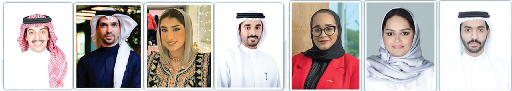
المنامة - بنا

أكد عدد من رؤساء وأعضاء هيئات ومراكز تمكين الشباب ما يحظى به الشباب في مملكة البحرين من رعاية واهتمام، في ظل العهد الزاهر لملك البلاد المعظم صاحب الجلالة الملك حمد بن عيسى آل خليفة، انطلاقاً من رؤى ملك البلاد المعظم النوعية التي تساهم في تمكين الشباب البحريني وتعزيز دورهم في مسيرة التنمية الشاملة.