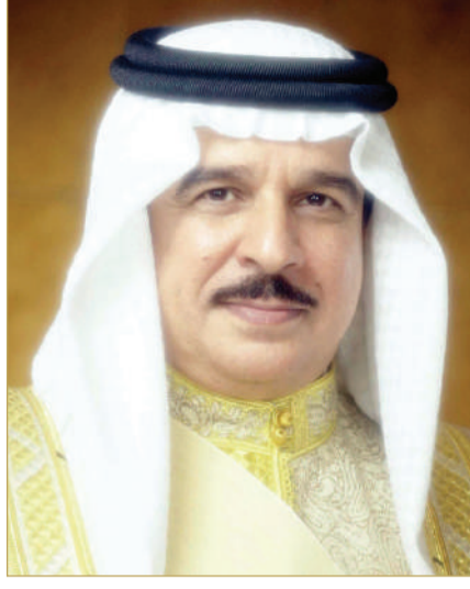
جلالة الملك المعظم

بعث ملك البلاد المعظم صاحب الجلالة الملك حمد بن عيسى آل خليفة، وولي العهد رئيس مجلس الوزراء صاحب السمو الملكي الأمير سلمان بن حمد آل خليفة، برقيتي تهنئة إلى رئيس جمهورية اليونان كونستانتينوس تاسولاس؛ بمناسبة ذكرى استقلال بلاده. وأعرب جلالتهم وسموهم في البرقيتين عن أطيب تهنئتهما وتمنياتها له موفور الصحة والسعادة، ولشعب جمهورية اليونان الصديق مزيداً من التقدم والازدهار. كما بعث صاحب السمو الملكي ولي العهد رئيس مجلس الوزراء، برقية تهنئة مماثلة إلى رئيس وزراء جمهورية اليونان كيرياكوس ميتسوتاكيس.