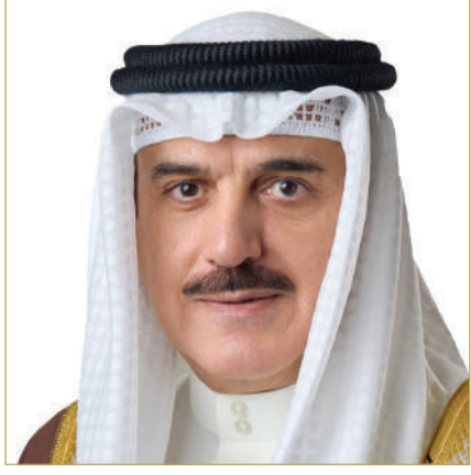
رئيس مجلس النواب

تطوير المنظومة التعليمية الدراسية والجامعية، وتوفير فرص العمل النوعية، وتأهيل الشباب لسوق العمل، وتلبية احتياجاتهم، وتحقيق الأهداف والتطلعات المنشودة، من أجل جيل المستقبل القادم. وأشار إلى أن مملكة البحرين تعتز وتفخر بسواعد أبنائها، وإسهاماتهم في تطوير العمل بروح "فريق البحرين" الذي يضع مصلحة الوطن فوق كل اعتبار، والاعتزاز بالهوية الوطنية، والمشاركة الإيجابية في صنع القرار الوطني، وتعزيز مبادرات مملكة البحرين في تحقيق أهداف التنمية المستدامة.