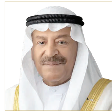
رئيس مجلس الشورى

الأهداف التنموية. وثنم رئيس مجلس الشورى، الجهود المميزة التي يبذلها سمو الشيخ ناصر بن حمد آل خليفة ممثل جلالة الملك للأعمال الإنسانية وشؤون الشباب رئيس المجلس الأعلى للشباب والرياضة، وسمو الشيخ خالد بن حمد آل خليفة النائب الأول لرئيس المجلس الأعلى للشباب والرياضة رئيس الهيئة العامة للرياضة رئيس اللجنة الأولمبية البحرينية، واهتمام سموها بتطوير وتنمية مهارات الشباب وتشجيعهم على العطاء والمثابرة، مما نتج عنه تحقيق الريادة والتميز المشهود له، على المستويين الوطني والعالمي، ترجمة للتوجهات الملكية السامية لحضرة صاحب الجلالة الملك المعظم حفظه الله ورعاها، التي تعتبر ركيزة أساسية لتحفيز الشباب وحثهم على حصد الإنجازات والنجاحات، ورفع اسم الوطن عالياً في المحافل الإقليمية والدولية. وأثنى رئيس مجلس الشورى على دور سمو الشيخ ناصر بن حمد آل خليفة، وسمو الشيخ خالد بن حمد آل خليفة، في متابعة شؤون الشباب وتشجيعهم على الإبداع والابتكار، وتحفيزهم على التألق المتواصل لرفع راية الوطن في المحافل كافة، مشيداً بالإنجازات المشهودة التي يحققها الشباب البحريني على الأصعدة كافة، في ظل العهد الزاهر والرؤية الملكية السامية لجلالة الملك المعظم، مثنياً مساندة سموها للبرامج الطموحة، ووضع المبادرات المتقدمة والمتميزة لاكتشاف المواهب الشبابية، والنهوض بالشباب البحريني في جميع المجالات.