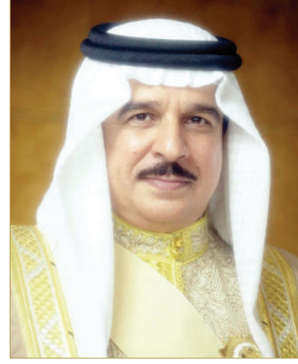
ملك البلاد المعظم