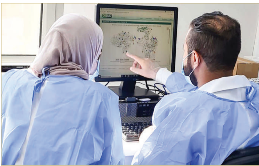
تسجيل التسلسل المتكامل للجينوم البشري لأول مرة في البحرين العام 2022

ومن المهم الإشارة إلى أن وزارة الصحة عملت بالتعاون مع هيئة المعلومات والحكومة الإلكترونية على تنفيذ استراتيجية حكومية البحرين للذكاء الاصطناعي في القطاع الصحي، بهدف تعزيز فعالية النظام الصحي والابتكار في تقديم الرعاية، وشملت الاستراتيجية تعزيز بحوث الذكاء الاصطناعي في المجال الطبي، وتطوير إرشادات التوريد، بالإضافة إلى تعزيز القدرات في مجالات الرعاية الصحية، إدارة الأزمات، والأمن السيبراني. من أبرز الأمثلة على هذه الجهود هو تطبيق "BeAware Bahrain"، الذي دمج الذكاء الاصطناعي، وإنترنت الأشياء (IoT)، لدعم إدارة الكوارث والأوبئة عبر التتبع، وبهذه المبادرات تواصل وزارة الصحة العمل على تعزيز كفاءة الرعاية الصحية في المملكة، ما يسهم في تقديم خدمات طبية مبتكرة وفعالة.