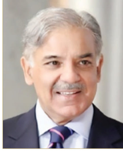
رئيس وزراء باكستان

شارك وزير الخارجية د.عبداللطيف الزباني، في الجلسة الحوارية التي نظمتها مؤسسة Heritage Foun- dation الأميركية، في مقرها في