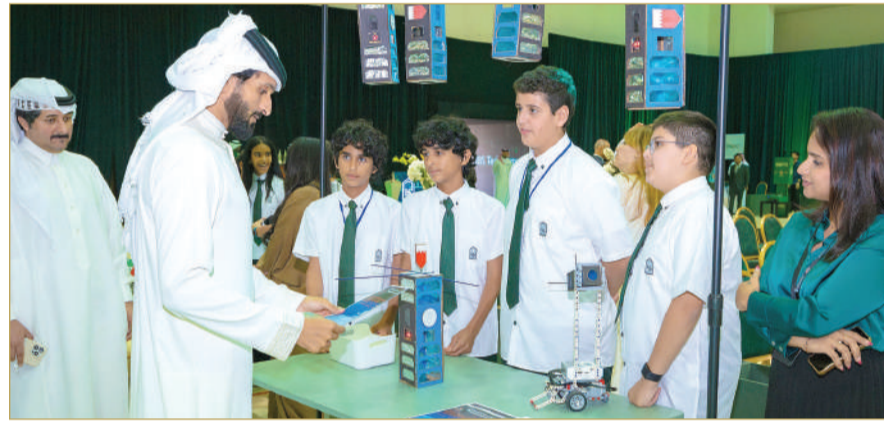
مبتكرة في مجال الذكاء الاصطناعي، الروبوتات، الواقع الافتراضي، الرسوم المتحركة، والتطبيقات الرقمية. وبهذه المناسبة، أعربت د. الشبيخة مي بنت سليمان

كذلك أعربت عن خالص امتنانها لجميع الطلبة وأولياء الأمور والمعلمين والضيوف الذين ساهموا بحضورهم وتفاعلهم في نجاح هذه القمة. وتوجهت ببالغ الشكر والتقدير إلى المتحدثين المتميزين على مشاركتهم القيمة وآرائهم الثرية التي أسهمت في إثراء النقاشات، وطرحت رؤى طموحة لمستقبل التعليم في العصر الرقمي.