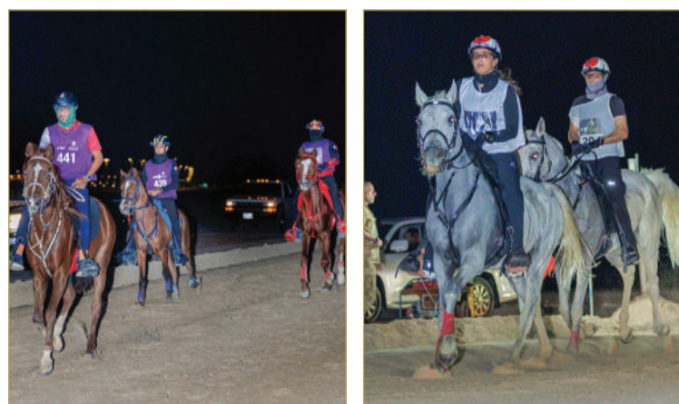
الاتحاد الملكي البحريني للفروسية وسباقات القدرة - المركز الإعلامي

من أجل المشاركة في البطولات الخارجية المقبلة، خصوصاً من جانب الفريق الملكي للقدرة الذي تنتظره مشاركات حافلة في الموسم الأوروبي وبطولات العالم. وحرص الاتحاد الملكي البحريني للفروسية وسباقات القدرة، على تهيئة الأجواء المثالية للفرسان المشاركين والإسطبلات المشاركة من أجل تحقيق الأهداف المرجوة. وحظي موسم سباقات القدرة بدعم من "بابكو إنرجيز" وبنك السلام راعيي ماسيين، وشركة "بناء" راعيا بلاتينيا، و "STC" و "GFH" راعيي ذهبيين، وشركة المنيوم البحريني "البا" راعيا فضيا، ومجلس التنمية الاقتصادية و "بحرين مريتا" راعيي برونزين.