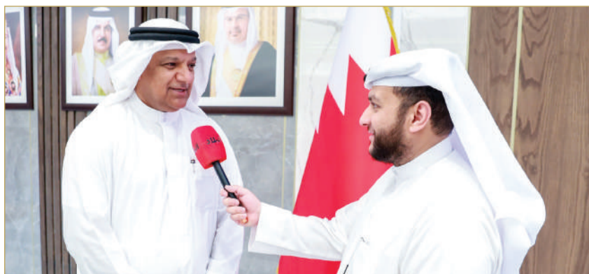
هجرس مصراحي لـ "البلاد"

وقال إن معظم الناس يزورون تايلند من أجل السياحة، ولكن هناك أيضا فرص في القطاع الطبي والمستشفيات التايلندية لها سمعة كبيرة، مبينا أنه يسعى منذ 20 عاما لإنشاء مستشفى تايلندي كبير في مملكة البحرين. وتابع "مثل هذا المستشفى سيخدم البحرين والمنطقة، وأنا طرحت على السفراء المتعاقبين منذ 20 عاما تقريبا، وهذه الفكرة ستضيف قيمة كبيرة للعلاقة بين البلدين".