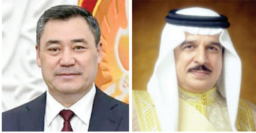
رئيس الجمهورية القيرغيزية الشقيقة

أعلن الديوان الملكي أن رئيس الجمهورية القيرغيزية الشقيقة صاير جباروف، سيصل إلى البلاد اليوم الاثنين، الموافق 21 أبريل الجاري، في زيارة لمملكة البحرين، يجري فيها مباحثات مع ملك البلاد المعظم صاحب الجلالة الملك حمد بن عيسى آل خليفة، تتناول العلاقات الثنائية الوطيدة بين البلدين الشقيقين، بالإضافة إلى التطورات الإقليمية والدولية. واغتنم الديوان الملكي هذه المناسبة ليرحب بضيف البلاد الكريم والوفد المرافق، متمنيا له طيب الإقامة في مملكة البحرين.