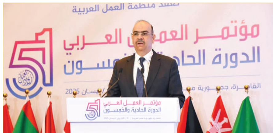
وزير العمل بالوكالة يلقي كلمة مملكة البحرين في المؤتمر

جاء ذلك في كلمة مملكة البحرين التي ألقاها وزير الشؤون القانونية وزير العمل بالوكالة، أمام أعمال الدورة الـ 51 لمؤتمر العمل العربي المتعددة بجمهورية مصر العربية الشقيقة في الفترة من 19 - 26 أبريل 2025. وتطرق الوزير خلف إلى إطلاق مملكة البحرين الخطة الوطنية لسوق العمل للأعوام 2023 - 2026، التي ترسم الاستراتيجية والسياسة العامة بشأن توظيف الموارد البشرية الوطنية في الأعوام الأربعة المقبلة، مشيراً إلى أن هذه الاستراتيجية تهدف إلى تطوير سوق العمل