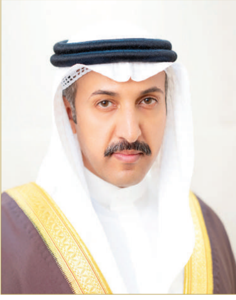
وزير المواصلات والاتصالات

أصدرت دليلا شاملا يضم إجراءات دخول وخروج السفن الزائرة للمياه البحرينية بالتنسيق مع الجهات المعنية كافة، خصوصا وزارة الداخلية. وتابع بأن الدليل يتضمن إرشادات وإجراءات للسفن قبل الوصول للمياه البحرينية، وضوابط لالتزامها طوال فترة إبحارها بالتشريعات والأنظمة الوطنية، ومن أهمها: تشغيل جهاز التعرف الأوتوماتيكي، وضمان صلاحية السفينة، والإبلاغ الفوري عن أي حادث، والتزام مالك السفينة باستكمال إجراءات الحصول على التصاريح، وتأشيرات دخول الركاب وطاقم السفينة.