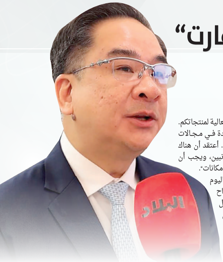
السفير التايلندي لدى البحرين

حضور مجموعة بارزة من مستثمري العقارات من منطقة بتايا للبحرين البحرين بوابة مهمة إلى أسواق دول مجلس التعاون الخليجي