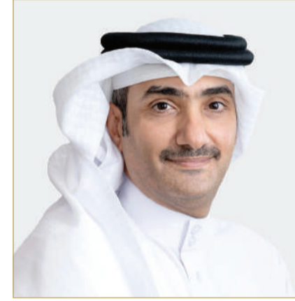
الشيخ عبدالله بن خليفة

الأعمال، والمساهمة في تحقيق التنوع الاقتصادي في المملكة عبر الاستفادة من الخبرات والموارد الخاصة لكل منهما ضمن "فريق البحرين"؛ للمساهمة في خلق بيئة مؤاتية للشركات الناشئة لتزدهر وتنمو وتساهم في تعزيز النمو الاقتصادي الوطني. يذكر أن أكثر من 100 رائد عمل استفادوا من المعسكر التدريبي الخاص بتعلم إستراتيجيات الاستثمار ونمو الأعمال وتطوير المشروعات، هذا إلى جانب تأهل 82 رائد عمل للعرض النهائي منذ إطلاق مبادرة "ستارت أب البحرين". ويقدم صندوق العمل "تمكين" حزمة من البرامج الهادفة لدعم المؤسسات المتعددة وتعزيز القطاع الخاص ليكون المحرك الرئيس للنمو الاقتصادي في المملكة، هذا إلى جانب برامج التوظيف والتطور الوظيفي للكوادر الوطنية بهدف جعل المواطن البحريني الخيار الأمثل للتوظيف.