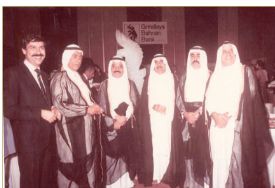
تميز بعلاقات مع المسؤولين في كل القطاعات