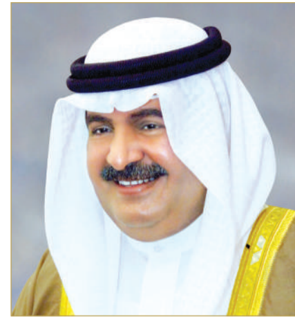
سمو الشيخ علي بن خليفة

local@albiladpress.com @albiladpress @albiladnews