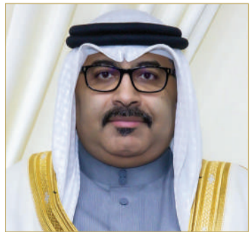
وزير التربية والتعليم

البحرين، وتحسين جودة الخدمات المقدمة من مختلف قطاعاتها للطلاب والطالبات.