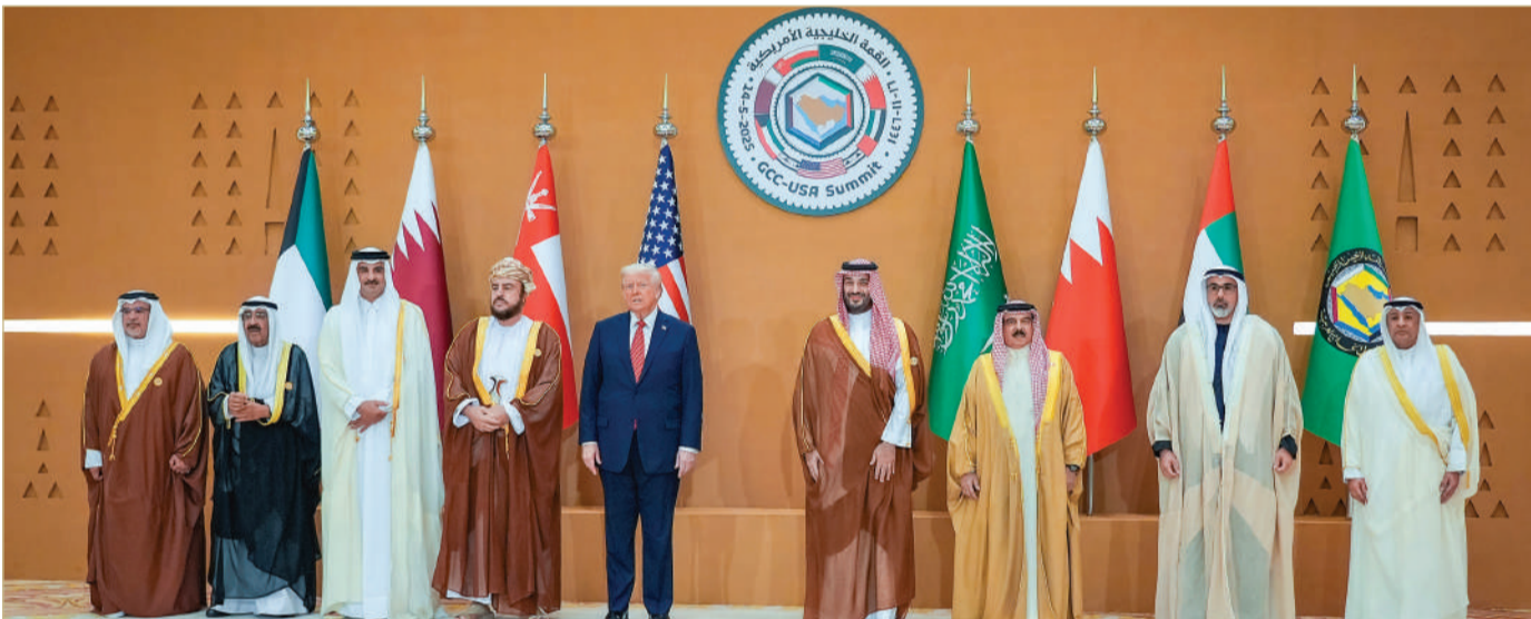
جلالة الملك المعظم شارك في أعمال القمة الخليجية الأمريكية في العاصمة السعودية الرياض بحضور سمو ولي العهد رئيس الوزراء