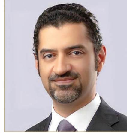
وزير شؤون البلديات والزراعة