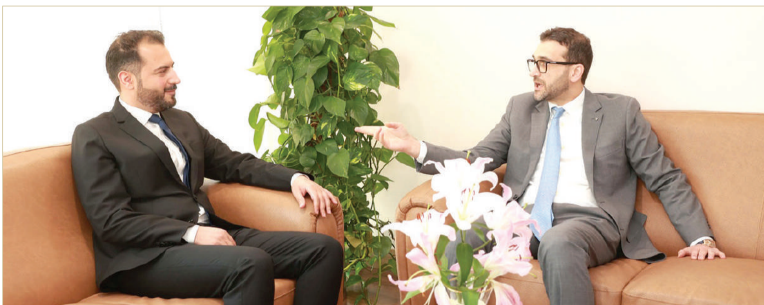
رئيس التسويق والاتصالات ورئيس الاستدامة في بنك السلام متحدًا لـ "البلاد"

« ما الذي دفع بنك السلام إلى إعطاء أولوية للاستدامة في استراتيجيته المؤسسية؟