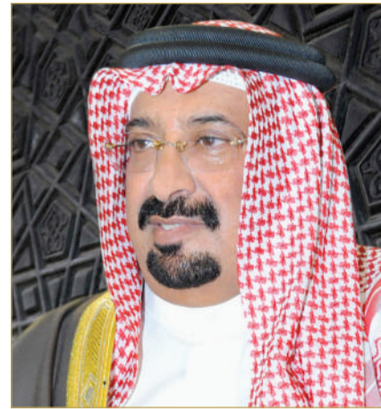
معالي الشيخ أحمد بن علي بن عبدالله

هناً مستشار صاحب سمو الملكي ولي العهد رئيس مجلس الوزراء سمو الشيخ علي بن خليفة آل خليفة، رئيس مجلس إدارة نادي المحرق الشيخ أحمد بن علي بن عبدالله آل خليفة، بمناسبة تتويج فريق النادي بطلاً لكأس خليفة بن سلمان لكرة السلة لعام 2025، وذلك عقب فوزه في المباراة النهائية على نظيره نادي الفنامه. ونوه سموه بما تشهده الرياضة البحرينية من تطور ملحوظ في مختلف الألعاب الجماعية والفردية،