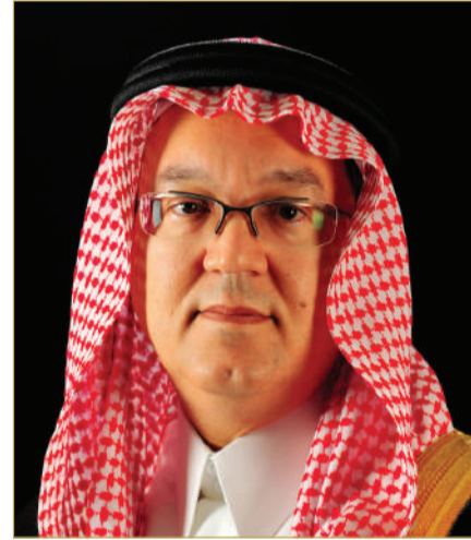
الأمير عمرو الفيصل

النمو في الأعمال المصرفية الإسلامية الأساسية في البحرين وباكستان، بالإضافة إلى العمل على تعزيز قيمة