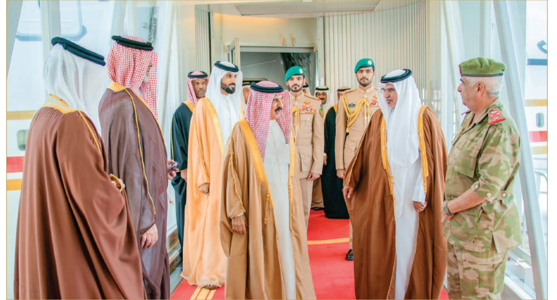
جلالة الملك المعظم يعود إلى أرض الوطن قادماً من الرياض بعد ترؤس جلالاته وفد مملكة البحرين في أعمال القمة الخليجية الأميركية