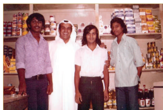
مع عدد من موظفيه في السبعينات