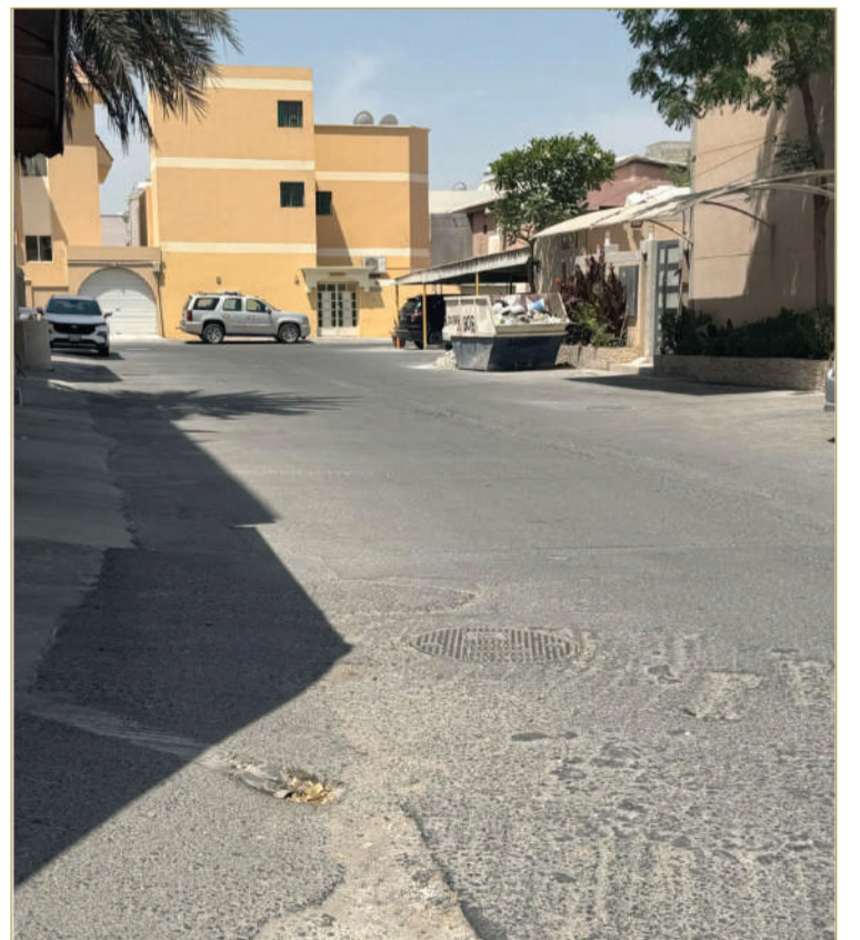
تطوير شامل لمجمع 919

وأرصفة بالطوب الأرصي، وتحديث الإنارة، وتطوير الشوارع القديمة، ووضع قنوات للخدمات الفنية، وتوفير العلامات المرورية والإرشادية. وأكد العبد الله أن المقترح يعكس الحرص على تقديم خدمات عالية الجودة للأهالي، وتحقيق رؤية البحرين 2030 في تطوير البنية التحتية وشبكة الطرق.