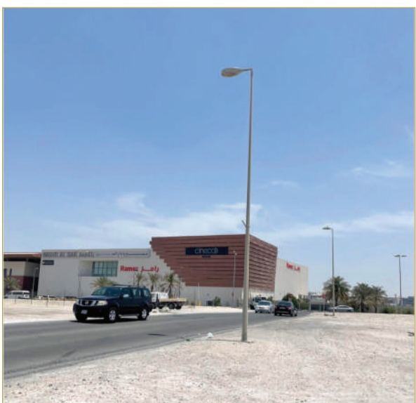
انشاء رصيف وادي السيل