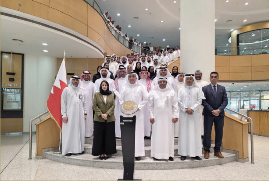
التميز في تقديم الخدمات نهج راسخ. والمقترحات التطويرية من مركز رئيس لإطلاق المبادرات

فرصة تحفيزية لمواصلة التحسين الشامل، حيث جرى استثمارها لتطوير تصميم منظومة العمل المؤسسي، وتعزيز مختلف المسارات الداخلية، علاوة على مركز خدمة العملاء الذي يُعد الواجهة الأساسية للجهاز. وثقن الحمر توجيهات ولي العهد رئيس مجلس الوزراء صاحب السمو الملكي الأمير سلمان بن حمد آل خليفة، التي شكلت مصدر إلهام مستمر في ترسيخ ثقافة التميز في الخدمة الحكومية، والدافع الأهم نحو تطوير الأداء وتعزيز تجربة المتعاملين في مختلف القنوات، مشيرًا إلى أن تكريم الجهاز بهذه الجائزة جاء نتيجة جهود متكاملة، بذلها فريق مركز خدمة العملاء، الذي قدّم نموذجًا يُحتذى به في العمل بروح الفريق الواحد