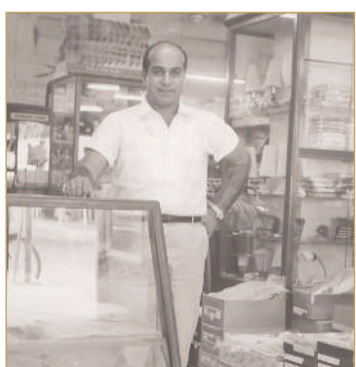
صورة تعود إلى أواخر الستينيات في متجره

راحلون وبصماتهم باقية البلاد سعيد محمد سعيد