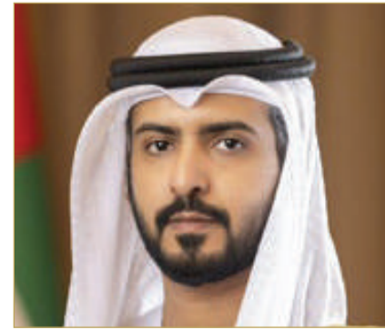
سفير دولة الإمارات

وأشاد بجهود حكومة مملكة البحرين الشقيقة في توفير البيئة الاستثمارية الجاذبة التي تكفل تعزيز الاستثمارات المشتركة، وإيلاء اهتمام متزايد بدعم المستثمر الإماراتي وتسهيل إجراءات تسجيل الشركات الإماراتية وبدء أنشطتها في المملكة، مما يعزز جاذبية البحرين كوجهة استثمارية رائدة في المنطقة. وأكد أن افتتاح المركز بالتزامن مع بدء دخول اتفاقية حماية وتشجيع الاستثمار بين البلدين، حيز التنفيذ خلال شهر مايو الحالي، يشكل خطوة إضافية تمهد لإقامة المزيد من المشروعات الاستثمارية في القطاعات المختلفة بمملكة البحرين الشقيقة، معربًا عن خالص التهاني والتبريكات بهذه المبادرة المتميزة التي سيكون له مردود كبير في دعم النشاط الاستثماري والتجاري وتعزيز النمو الاقتصادي المستدام للبلدين والشعبين الشقيقين.