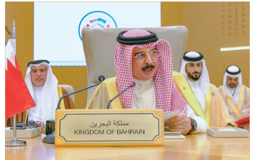
جلالة الملك المعظم يشارك في أعمال القمة الخليجية الأمريكية في العاصمة السعودية الرياض