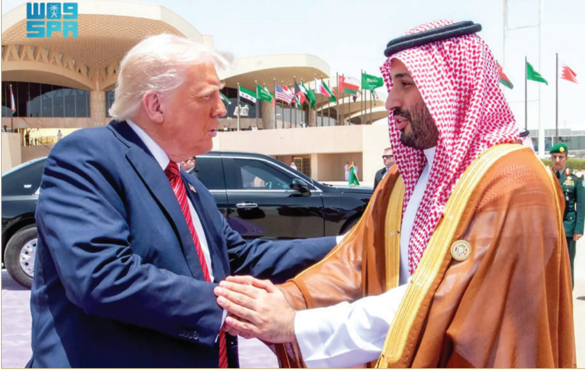
ترامب وصف زيارته إلى السعودية بالرائعة وقال لقادة دول الخليج: أنتم محل إعجاب العالم

اتفاقيات حكومية ضخمة تزيد قيمتها عن 300 مليار دولار، جرى الإعلان عنها في المباحثات بين الأمير محمد بن سلمان وترامب. وأضاف: منطقة الشرق الأوسط، وعلى رأسها السعودية، تشهد