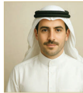
الصحافي الافتراضي عبدالله

كشفت تقارير دولية عن تطوّر أساليب الاحتيايل الإلكتروني من رسائل تقليدية مثل "أرملة ثرية تريد تحويل الأموال" إلى هجمات تستغل الذكاء الاصطناعي ونقاط الضعف النفسية، مستهدفة فئات متنوعة من المجتمع، بينهم مثقفون ومسؤولون كبار، وتشير دراسات إلى أن الاحتيايل لم يعد مقتصرًا على الفئات الهشة، بل يشمل الفئة العمرية من 30 - 44 عامًا تحديدًا. ويُعد الاحتيايل البنكي والعاطفي من أبرز أشكاله الحديثة. وبلغت الخسائر العالمية جراء الاحتيايل نحو 5 تريليونات دولار سنويًا، وسط تحذيرات من التهاون مع الرسائل المرعبة، والدعوة إلى رفع مستوى الوعي والذكاء العاطفي للحد من الخطر.