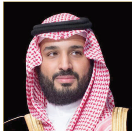
سمو ولي العهد رئيس الوزراء السعودي