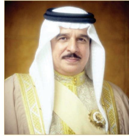
جلالة الملك المعظم

بعث ملك البلاد المعظم صاحب الجلالة الملك حمد بن عيسى آل خليفة، وولي العهد رئيس مجلس الوزراء صاحب السمو الملكي الأمير سلمان بن حمد آل خليفة، برقيتي تهنئة إلى عاهل المملكة العربية السعودية الشقيقة خادم الحرمين الشريفين الملك سلمان بن عبدالعزيز آل سعود؛ بمناسبة النجاح الكبير والتنظيم الدقيق والمميز لموسم حج هذا العام 1446 هـ. وأعرب جلالته الملك المعظم في البرقية، عن أخلص تهانيه بالنجاح الذي تحقق بفضل من المولى تعالى والجهود الكبيرة والرعاية الكريمة التي يبذلها خادم الحرمين الشريفين، وحكومته الرشيدة التي وفرت جُلَّ جهودها وطاقاتها على مدار الساعة بتنظيم شعبية الحج وإنجاحها وخدمة حجاج بيت الله الحرام والسهر على راحتهم؛ ما أسهم في تأدية مناسك حجهم بكل يسر وسهولة وأمان وطمأنينة في أجواء مفعمة بالسكينة والإيمان، مشيدًا بما هيأته المملكة العربية السعودية الشقيقة من إمكانات، وما تم استحداثه من خدمات مميزة