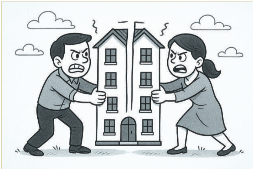
صورة تعبيرية تم توليدها بالذكاء الاصطناعي

ادعاءاتها بإفادات شهود، أكدوا أن المدعى عليه استخدم حيلة المذهب الديني المختلف كذريعة لتعطيل إجراءات إسقاط القرض، وأنه وعد المدعية بإعادة حصتها بعد إتمام العملية، ثم تهرب من ذلك لاحقاً وطلقها. وأكدت المحكمة أن نية التبرع لم تكن قائمة، وأن الهبة لم تتم بقصد صحيح، بل شابهة التدليس والخداع، ما يجعلها باطلة من الأساس. وبناءً على ذلك، قضت المحكمة الشرعية بإلغاء عقد الهبة، وإلزام جهاز المساحة والتسجيل العقاري بإعادة تسجيل العقار بالمناصفة بين الطرفين، إضافة إلى تسليم المدعية وثيقة ملكية لحصتها البالغة 50%، كما ألزمت المحكمة المدعى عليه بسداد المصاريف القضائية ومبلغ 100 دينار مقابل أتعاب المحاماة. كما أيدت محكمة الاستئناف الشرعية هذا الحكم وقضت برفض الاستئناف المرفوع من المستأنف.