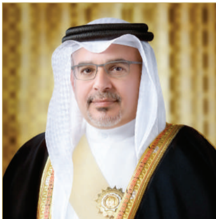
سمو ولي العهد رئيس الوزراء