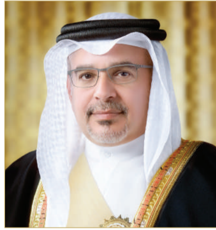
سمو ولي العهد رئيس الوزراء