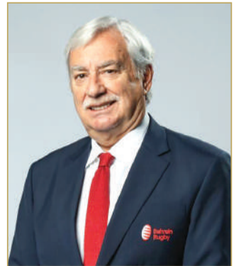
جان كريستوف فرانسو أبيل دوران

في أول حوار صحفي حصري له منذ توليه رئاسة الاتحاد البحريني لرجبي كرة القدم، تحدث جان كريستوف فرانسو أبيل دوران، بصراحة ووضوح لـ "البلاد"، كاشفاً عن رؤى استراتيجية طموحة تهدف إلى ترسيخ مكانة البحرين على خريطة الرجبي الآسيوية والدولية. من بناء قاعدة شعبية تنطلق