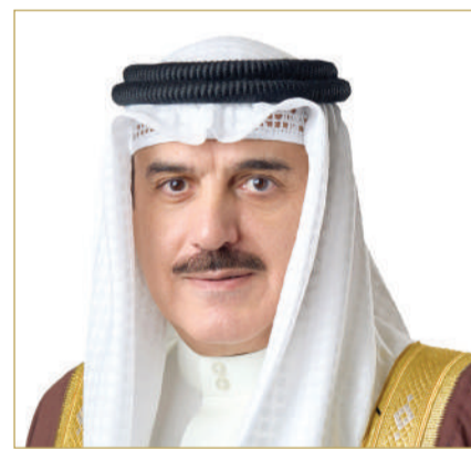
رئيس مجلس النواب

الوزراء صاحب السمو الملكي الأمير سلمان بن حمد آل خليفة، على التوجيهات الملكية السامية، والمتابعة الحكومية في تقديم جميع التسهيلات لخدمة حجاج مملكة البحرين، مشيداً بجهود اللجنة العليا لشؤون الحج والعمرة، وبعثة مملكة البحرين للحج، والحملات البحرينية، وحجاج مملكة البحرين؛ لتعاونهم مع الجهات المعنية، والوعي المتميز، والالتزام التام بالتعليمات والقوانين الخاصة بموسم الحج. وهنا رئيس مجلس النواب، رئيس مجلس الشورى بالمملكة العربية السعودية الشقيقة د. عبدالله آل الشيخ؛ بمناسبة نجاح موسم الحج، الذي تحقق بفضل من الله تعالى وتوفيقه، وجهود جميع الجهات السعودية المعنية، داعياً الله العلي القدير أن يحفظ المملكة العربية السعودية وشعبها الشقيق، وأن ينعم عليها بنعمة الأمن والأمان، ومزيد من التقدم والازدهار، في ظل قيادتها الحكيمة.