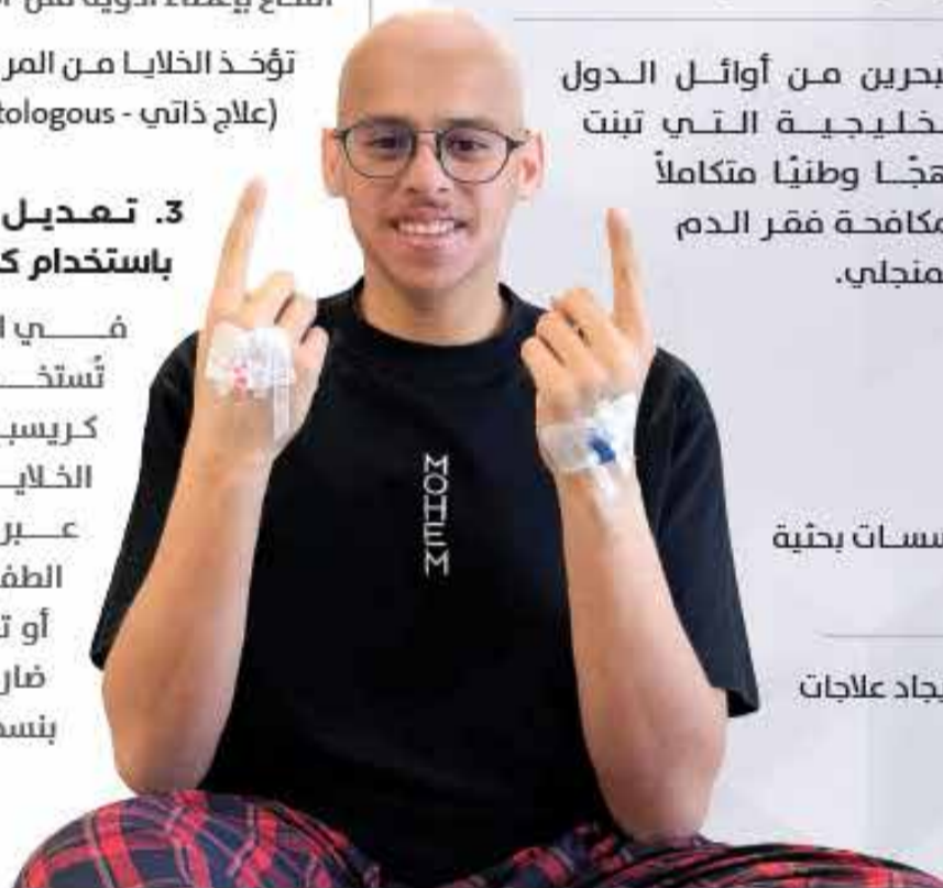
البلاد | إنفوجرافيك: إسماعيل السقاي

في المختبر، تُستخدم تقنية كريسير لتعديل الخلايا الجذعية عبر تصحيح الطفرة الجينية أو تعطيل جين ضار واستبداله بنسخة سليمة.