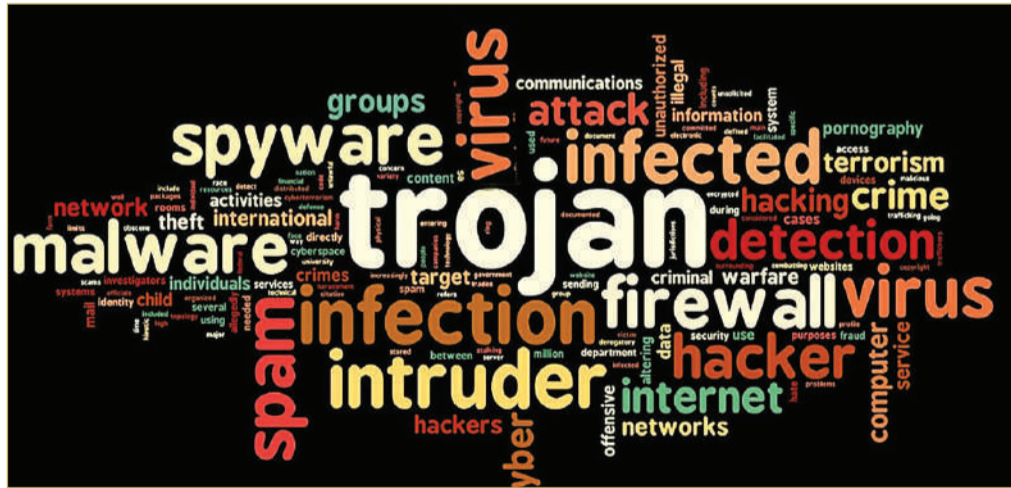
إنتاج نصف مليون برمجية خبيثة جديدة يوميا في العالم