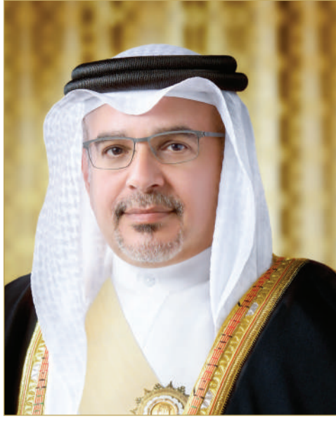
سمو ولي العهد رئيس الوزراء

بعث ملك البلاد المعظم صاحب الجلالة الملك حمد بن عيسى آل خليفة، وولي العهد رئيس مجلس الوزراء صاحب السمو الملكي الأمير سلمان بن حمد آل خليفة، برقيتي تهنئة إلى رئيس الجمهورية البرتغالية د. مارسيلو ريبيلو دي سوزا؛ بمناسبة ذكرى اليوم الوطني لبلاده. وأعرب جلالة الملك المعظم في البرقية عن أطيب تهانیه وتمنياته له موفور الصحة والسعادة، ولشعب الجمهورية البرتغالية الصديق مزيداً من التقدم والازدهار. كما بعث صاحب السمو الملكي ولي العهد رئيس مجلس الوزراء برقية تهنئة مماثلة إلى رئيس وزراء الجمهورية البرتغالية لوييس مونتينغرو.