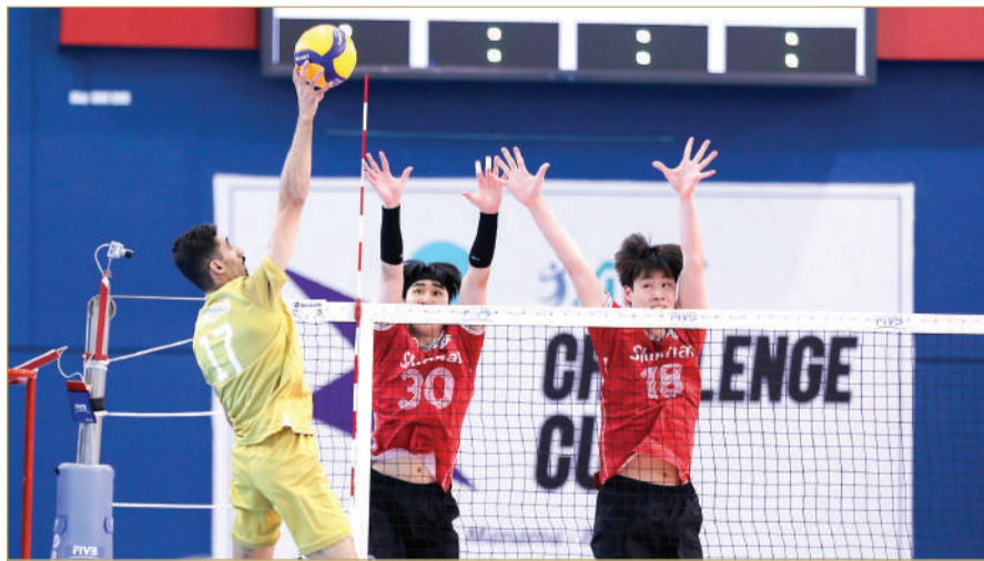
جانب من استضافة المملكة للنسخة الأخيرة من البطولة

صالات عيسى بن راشد الرياضية في الرفاع كمقر رسمي لاستضافة مباريات البطولة، التي تنطلق منافساتها في الفترة من 17 لغاية 24 يونيو الجاري، تحت رعاية كريمة من سمو الشيخ خالد بن حمد آل خليفة. وستحتضن الصالة الرئيسية أربع مباريات ضمن مرحلة المجموعات. وفي إطار الاستعدادات التنظيمية، وضعت لجنة الملاعب برئاسة علي الشيخ، خطة متكاملة لتجهيز الصالة الرئيسية وصالات التدريبات بما يتوافق مع المعايير والاشتراطات الدولية المعتمدة من الاتحاد الآسيوي، إذ تم إعداد خطة شاملة لتجهيز الصالة من جميع الجوانب الفنية واللوجستية، قبل وصول الوفود الرسمية والمنتخبات المشاركة. وفي سياق متصل، تم اعتماد أربع صالات رئيسية لاستضافة تدريبات المنتخبات في فترة البطولة، وهي: صالة النادي الأهلي، صالة نادي النصر، صالة نادي داركلوب، وصالة نادي الشباب. وقد نفذت لجنة الملاعب سلسلة من الزيارات التفقدية لهذه الصالات للوقوف على جهوزيتها، والتأكد من توافر جميع المعدات والتجهيزات الفنية اللازمة لتوفير بيئة تدريب مثالية تواكب الحدث القاري الكبير. وتأتي هذه الاستعدادات المتكاملة في إطار حرص الاتحاد البحريني لكرة الطائرة واللجنة المنظمة على تقديم نسخة تنظيمية متميزة تعكس مكانة البحرين وخبرتها الطويلة في استضافة البطولات القارية والدولية. (اقرأ الموضوع كاملاً بالموقع الإلكتروني).