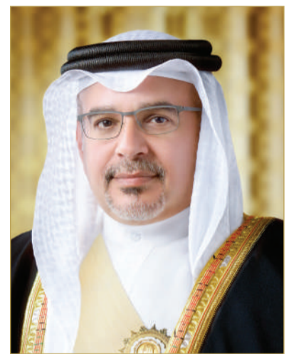
سمو ولي العهد رئيس الوزراء

"المتحف الصغير" و "حزاوي يدّتي" .. جسر بين دفتي الزمن... السادة: