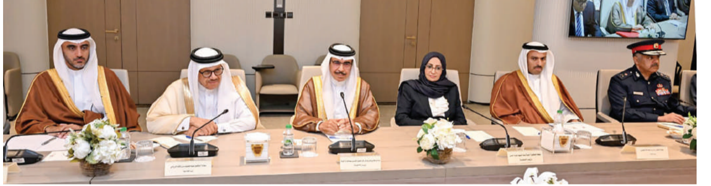
الوزراء يوضحون الجهود التي تقوم بها الوزارات المعنية وإجراءاتها في الظروف الطارئة