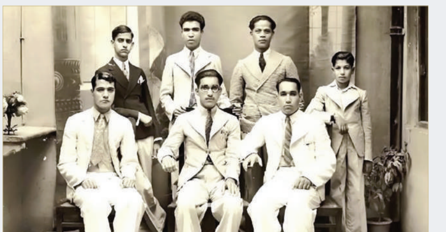
لقطة تذكارية مع زملاء الدراسة الجامعية