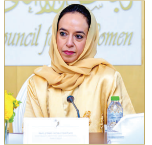
سمو الشيخة حصة بنت خليفة