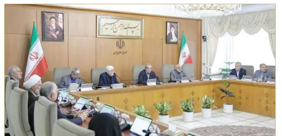
اجتماع للحكومة الإيرانية برئاسة مسعود بزشكيان في مقر الرئاسة

قال الرئيس الإيراني مسعود بزشكيان، في اجتماع مجلس الوزراء الأربعاء، إنه باللحمة الوطنية والوحدة نستطيع تجاوز أي أزمة. ونقلت وكالة "مهرا" للأنباء عن الرئيس بزشكيان قوله في اجتماع مجلس الوزراء: إذا كان الشعب معنا، فلن نُعرض أي مشكلة البلاد للخطر، وبالتالي، من الضروري أن