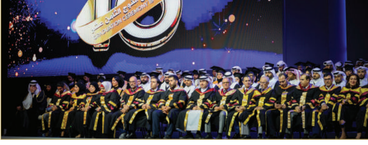
جامعة العلوم التطبيقية تحتفل بتخريج الفوج الثامن عشر من طلبتها 05