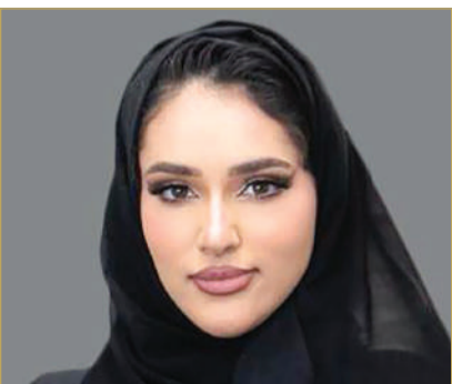
الشيخة جواهر آل خليفة