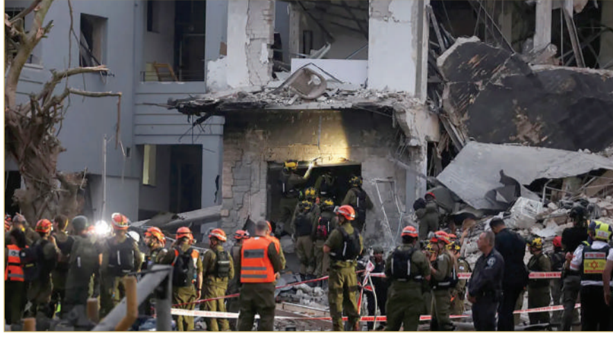
رجال إنقاذ في موقع تعرض لقصف

وقال مصدر مطلع، بحسب ما نقلت "رويترز"، إن ترامب وفريقه يدرسون عددا من الخيارات، بما في ذلك مشاركة إسرائيل في توجيه ضربات لمواقع نووية إيرانية. وأظهرت بيانات تتبع الرحلات الجوية، أن ما لا يقل عن 30 طائرة عسكرية أميركية قد نقلت من قواعد في الولايات المتحدة إلى أوروبا خلال الأيام الثلاثة الماضية. ووفقا لموقع "فلايت رادار24"، فإن الطائرات المعنية كلها طائرات صهريجية عسكرية أميركية، تستخدم لتزويد المقاتلات والقاذفات بالوقود توقفت 7 منها من طراز كي سي 135 في قواعد جوية أميركية في إسبانيا واسكتلندا وبريطانيا.