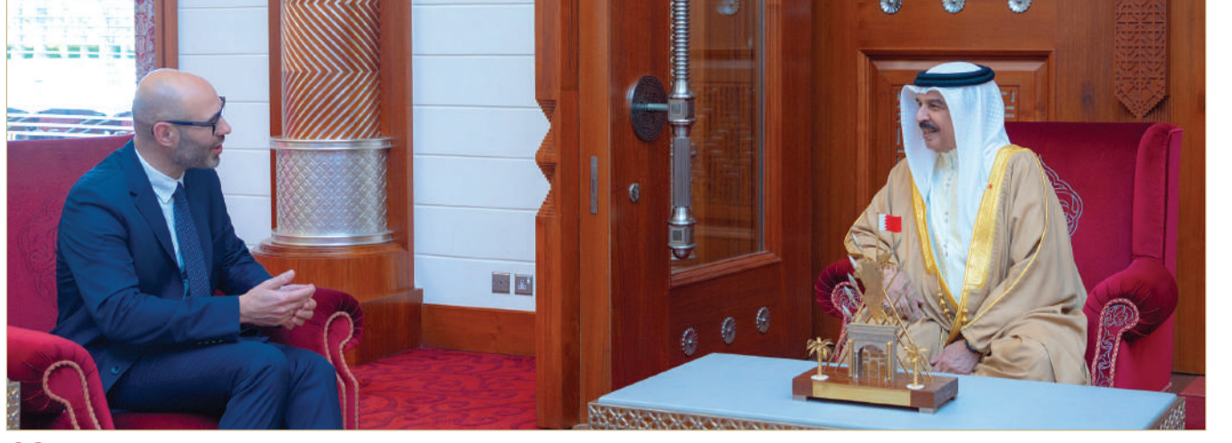
02 جلالة الملك المعظم يستقبل الأمين العام للمحكمة الدائمة للتحكيم

تصفح في العدد الإلكتروني سبورت - مسافات - منطلقات - بلدي الجنوبية - برلمانيات