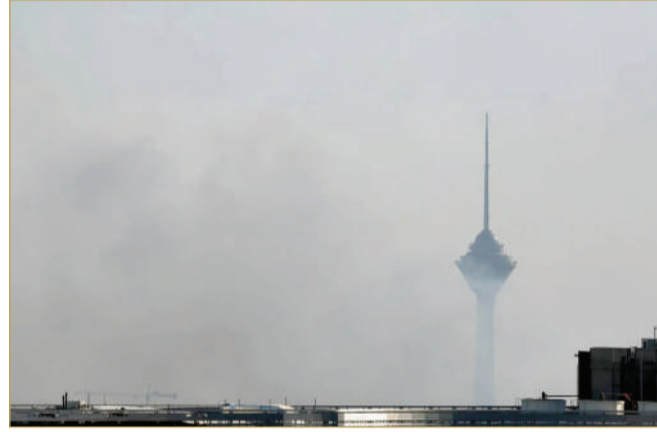
تصاعد الدخان قرب برج ميلاد في طهران

التطلعات والمصالح المشتركة، بالإضافة إلى بحث آخر التطورات ومستجدات الأوضاع التي تشهدها المنطقة.