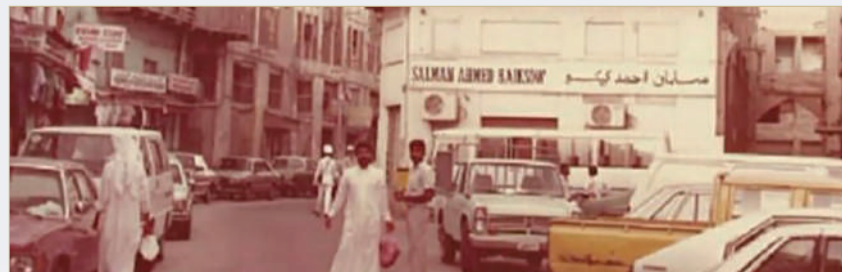
مكتب الشركة بالمنامة في الستينات