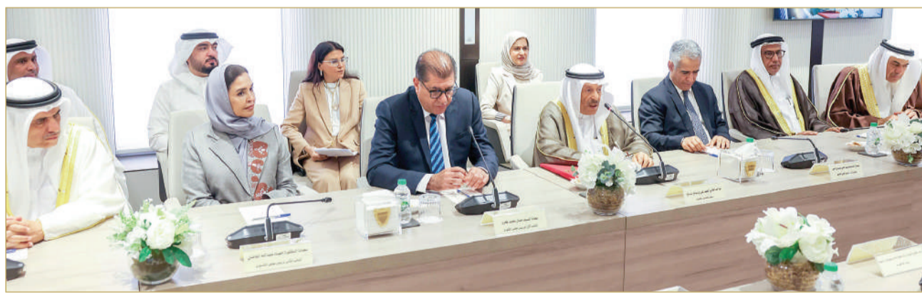
لقاء مشترك بين السلطين التشريعية والتنفيذية

واللحمة الوطنية، منوهاً بدور المؤسسات المجتمعية في نشر الوعي بين أفراد المجتمع، مؤكداً أن التحديات الأمنية والتطورات الإقليمية تتطلب تماسكاً وطنياً وتعاضداً مجتمعياً يجسد روح الانتماء الوطني، ووعياً عالياً بالمسؤوليات والواجبات الوطنية. من جهته، أكد وزير الداخلية رئيس مجلس الدفاع المدني الفريق أول الشيخ راشد بن عبدالله آل خليفة، أن الاجتماع، يجسد التعاون البناء بين السلطين التشريعية والتنفيذية، ويهدف إلى إطلاع أعضاء لجنتي الشؤون الخارجية والدفاع والأمن الوطني بمجلسي النواب والشورى على الإجراءات التي تم اتخاذها لمواجهة حالات الطوارئ ورفع الجهوية لإدارة الطوارئ المدنية، في ظل متابعتنا لمستجدات الأوضاع الإقليمية. وأشاد وزير الداخلية بحكمة السياسة الملكية لملك البلاد المعظم صاحب الجلالة الملك حمد بن عيسى آل خليفة، التي كان لها الفضل في ال