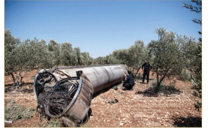
بقايا صاروخ باليستي إيراني سقط في شمال إسرائيل

« نزوح من طهران وصمت في تل أبيب.. حرب الصواريخ تدخل منعطفًا أخطر