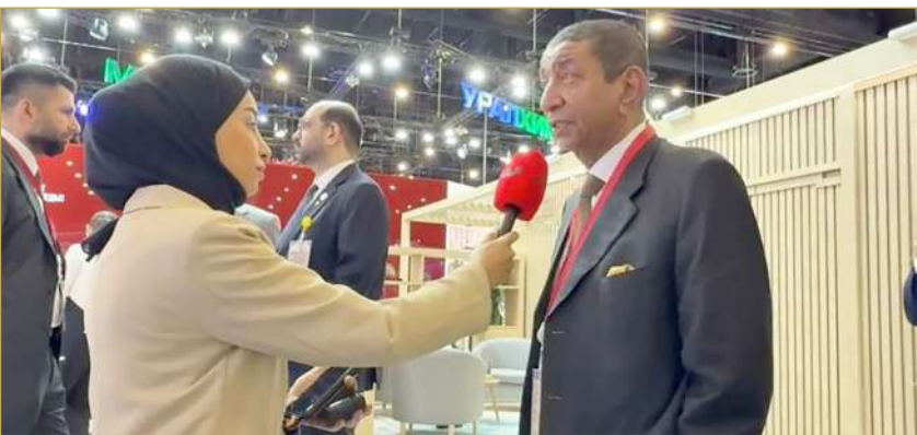
ناس مصرحاً لـ "البلاد"

لأسواق العالمية بصورة تنافسية. وأوضح أن هذه الفكرة طُرحت على الجانب الروسي، وقد لاقَتْ قبولاً مبدئياً. وأشار إلى أن الجانب الروسي أبدى اهتماماً بالفكرة، معرباً عن أمه في أن تتطور إلى تعاون فعلي يُثمر عن شراكات استراتيجية تعزز من دور البحرين كمركز إقليمي للتجارة والتوزيع. واختتم حديثه بالتأكيد على أهمية استثمار هذه الفرص لتوسيع العلاقات الاقتصادية بين البلدين.