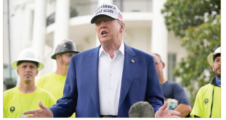
الرئيس الأمريكي في البيت الأبيض

وفي حديثه للصحافيين من الحديقة الجنوبية للبيت الأبيض، أشار ترامب إلى أن إيران تمر بمشكلات كثيرة