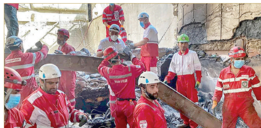
رجال إنقاذ في موقع تعرض لقصف إسرائيلي في طهران