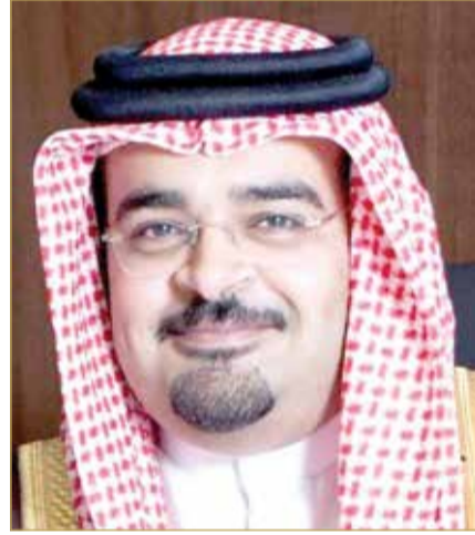
الشيخ حمد بن محمد

ولفت الشيخ حمد إلى أنه يتم حالياً تجهيز الفلل بأحدث التطبيقات التكنولوجية لجعلها فللاً ذكية، مثل توفير تقنية الألياف البصرية والدعم التقني. كما تتميز الفلل بخاصية التزويد الذكي التي تتيح للملاك إمكانية التحكم في مجموعة من المساحات القابلة للتعديل في كل فيلا، مثل تركيب مصعد عند الحاجة، وإضافة محطات شحن للسيارات الكهربائية، وتركيب ألواح الطاقة الشمسية. وأشار الشيخ حمد إلى أن الشركة نجحت في تحقيق معدلات مبيعات ممتازة في القسام