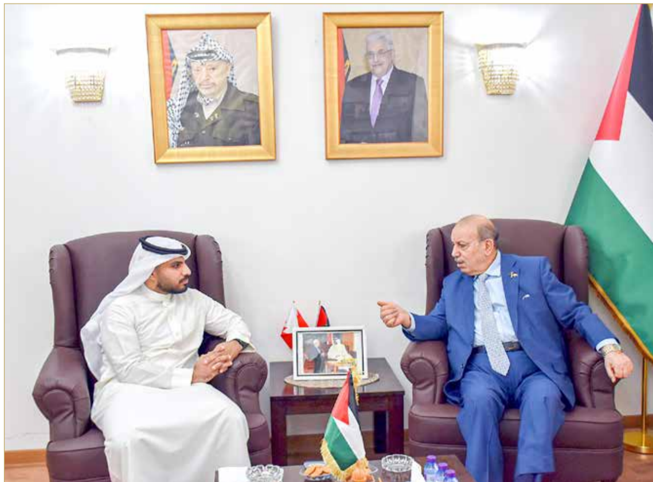
السفير الفلسطيني متحدًا لـ "البلاد"

رسالتني الأخيرة لأهل البحرين، قيادة وشعبا: هذا الوطن جوهرة نادرة، فحافظوا عليه كما تحافظون على نور أعينكم. أنتم نموذج فريد في العالم العربي، من حيث الانفتاح، والتسامح، والمحبة. بلادكم تضع فلسطين في القلب، ونحن نضع البحرين في قلب فلسطين. وهذا الوطن يستحق الوفاء. حافظوا عليه، وكونوا له كما كان لكم. أنتم شعب محب، مضياف، كريم في الروح قبل اليد. أتمنى أن تبقى البحرين منارة في المنطقة، وأن يلتقي ذات يوم في القدس، عاصمة فلسطين الأبدية، ونصلي فيها جميعا. كما قال الشاعر: يرونها بعيدة.. ونراها قريبة.. وإنا لصادقون.