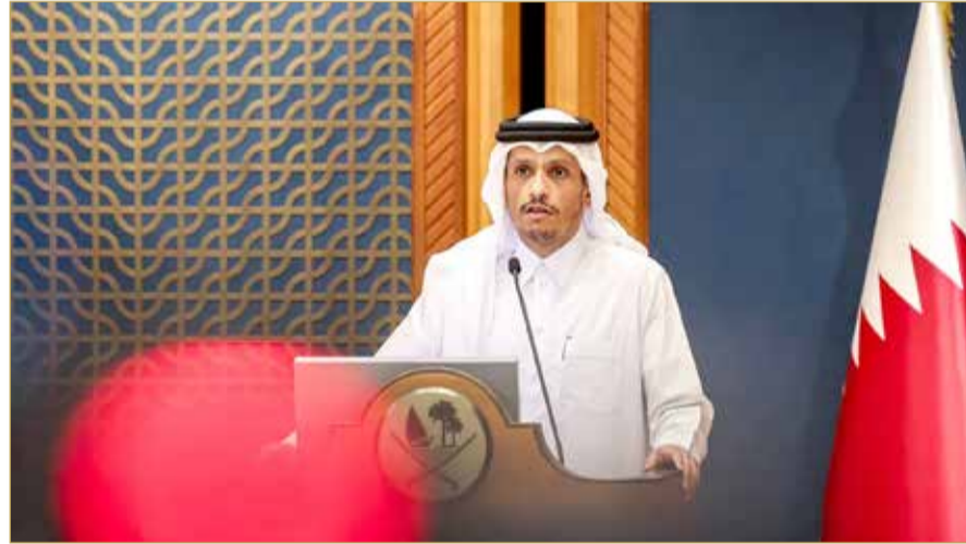
رئيس مجلس الوزراء وزير الخارجية القطري

حظي إعلان الرئيس الأميركي دونالد ترامب، التوصل إلى وقف إطلاق نار شامل بين إيران وإسرائيل بترحيب واسع من دول المنطقة والمجتمع الدولي. السعودية أعربت عن أملها في التزام الأطراف بالهدنة واعتماد الحوار، فيما وصفت مصر الاتفاق بأنه "تطور جوهري" وأكدت أن حل القضية الفلسطينية يبقى مفتاح الاستقرار. الأردن شدد على ضرورة الحل السياسي وتنفيذ حل الدولتين، وقطر رأت في الاتفاق فرصة لتغليب الدبلوماسية، مجددة التزامها بمبدأ حسن الجوار. الإمارات بدورها عدت الاتفاق خطوة نحو خفض التصعيد، مشيدة