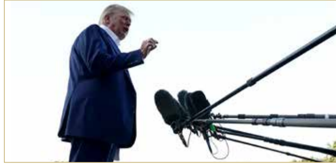
دونالد ترامب يتحدث لصحافيين في حديقة البيت الأبيض

إسرائيل وإيران انتهكتا وقف إطلاق النار الذي أعلنه قبل ساعات، مضيها أنه غير راض عن أي من البلدين، خصوصا إسرائيل. وفي حديث للصحافيين قبل مغادرته لحضور قمة حلف شمال الأطلسي في لاهاي، قال ترامب إن