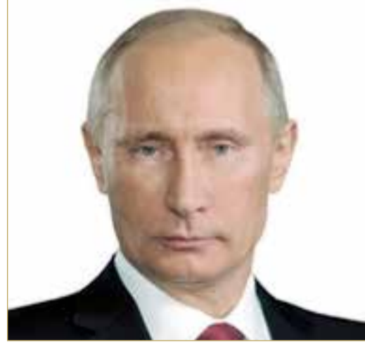
رئيس جمهورية روسيا