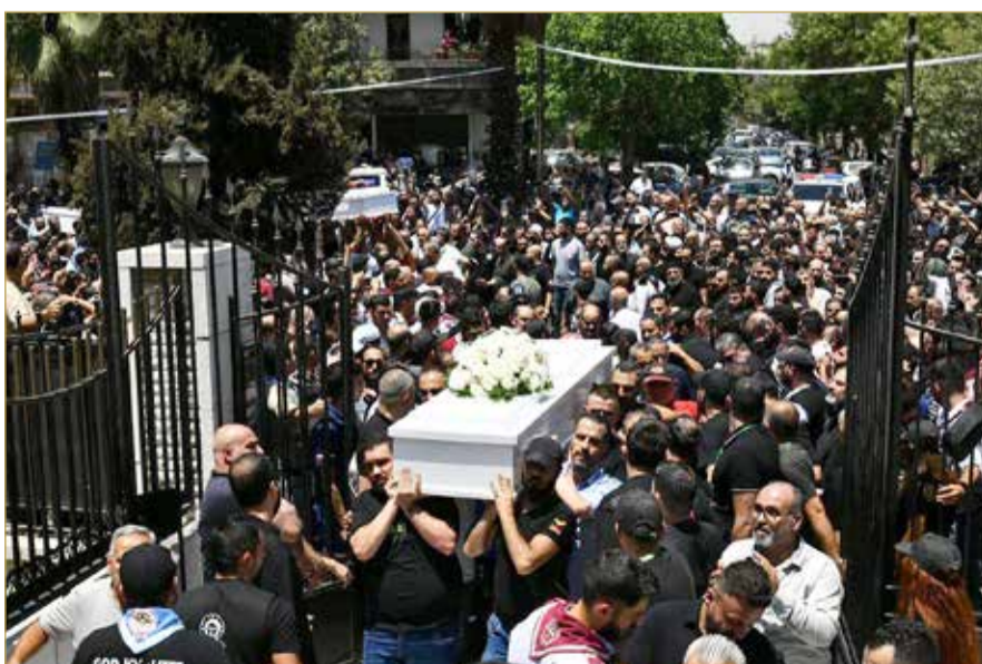
تشيع ضحايا تفجير كنيسة مار إلياس بدمشق

وكالات ما يهدد استقرار البلاد، غداة نسب الهجوم إلى عنصر تابع لتنظيم "داعش". وتقع كنيسة مار إلياس إلى جانب عدد من الكنائس في حي دويلعة الذي يعد معظم سكانه من أتباع الديانة المسيحية. وهذا أول تفجير يطل دوراً للعبادة إسلامية ومسيحية منذ سقوط نظام بشار الأسد في 8 ديسمبر الماضي.