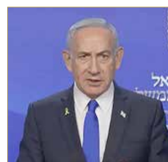
رئيس الوزراء الإسرائيلي

أن الخطر ما يزال قائما، على رغم إعلان الحكومة موافقتها على مقترح الرئيس الأميركي لوقف إطلاق النار مع إيران بعد 12 يوما من التصعيد بين العدوين الدوليين. وقال المتحدث باسم الجيش الإسرائيلي إيفي ديفرين، في تصريح صحفي متلفز: وجه رئيس الأركان الجيش بأكمله للحفاظ على مستوى عال من التأهب والاستعداد للرد بقوة على أي خرق لوقف إطلاق النار. وأضاف: أريد التأكيد، لا يوجد أي تغيير في تعليمات قيادة الجبهة الداخلية، يجب التزام التعليمات، الخطر ما يزال قائما.