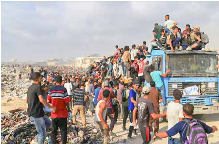
فلسطينيون يتجمعون على شاحنة تحمل مساعدات غذائية في غزة

وكالات العودة في مخيم النصيرات، وذلك إثر إطلاق الجيش الإسرائيلي النار والقصف المدفعي باتجاه آلاف المواطنين الذين كانوا ينتظرون المساعدات قرب مركز المساعدات الأميركية بين نتساريم وجسر وادي غزة وسط القطاع. ومنذ مطلع مارس تمنع إسرائيل دخول المساعدات الإنسانية إلى قطاع غزة؛ ما يؤدي إلى نقص حاد في الأغذية والأدوية وغيرها من السلع الأساسية. وفي أواخر مايو رُفِع الحصار جزئياً. وبحسب مكتب الأمم المتحدة لحقوق الإنسان، فإن الجيش الإسرائيلي قتل أكثر من