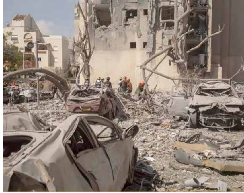
جانب من الدمار جراء القصف الإيراني على جنوب إسرائيل أمس ”د.ب.أ“

ترحيب بحريني باتفاق وقف إطلاق النار بين إيران وإسرائيل