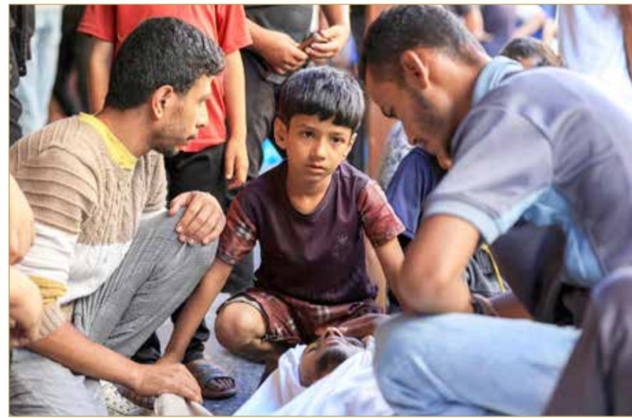
فلسطينيون ينهون أقاربهم في مستشفى الأهلي العربي المعمداني بمدينة غزة "رويتزر"

وقال المصدر: هناك ضغوط كبيرة تتعرض لها حماس من قبل بعض الأطراف بشأن تقديم تنازلات أكبر، خاصة فيما يتعلق بنزع السلاح أو خروج قيادات الحركة، لكن هذا الأمر غير مطروح للنقاش. واجتمعت المصادر على أن الحركة حالياً ستنتظر