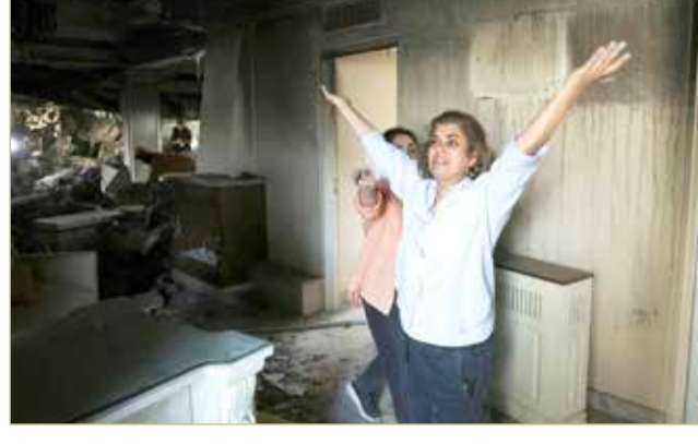
إيرانيان تعبران عن صدمتهما أثناء تفقدتهما الأضرار داخل منزلهما في طهران "إبأ"