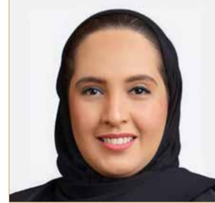
وزيرة الإسكان والتخطيط العمراني

لها قبل عرضها على اللجنة. وتمتع اللجنة في سبيل أداء مهامها بعدد من الصلاحيات، منها طلب المعلومات أو البيانات أو التقارير من الإدارات المعنية في الوزارة، واستدعاء من تراه مناسباً لسماع أقواله، إضافة إلى الاستعانة بذوي الخبرة من خارج اللجنة لمناقشة الحالات المطروحة، دون أن يكون لهم صوت معدود في التوصيات. (اقرأ الموضوع كاملاً بالموقع الإلكتروني)