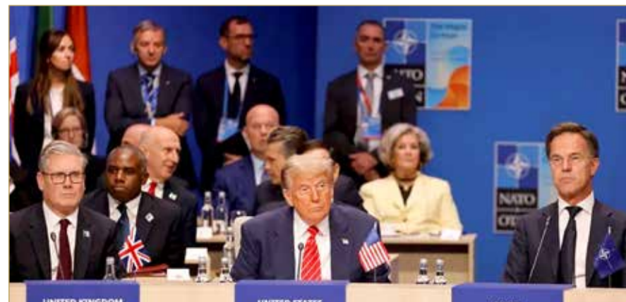
رئيس الوزراء البريطاني كير ستارمر والرئيس الأميركي دونالد ترامب والأمين العام لحلف الناتو مارك روثه خلال قمة الحلف في لاهاي

وتنص المادة الخامسة من ميثاق حلف الناتو على أن أي هجوم، أو عدوان مسلح ضد طرف منهم "أطراف الناتو"، يعتبر عدواناً عليهم جميعاً، وبناء عليه، فإنهم متفقون على حق الدفاع الذاتي عن أنفسهم، المعترف به في المادة 51 من ميثاق الأمم المتحدة، بشكل فردي أو جماعي، وتقديم المساعدة والعون