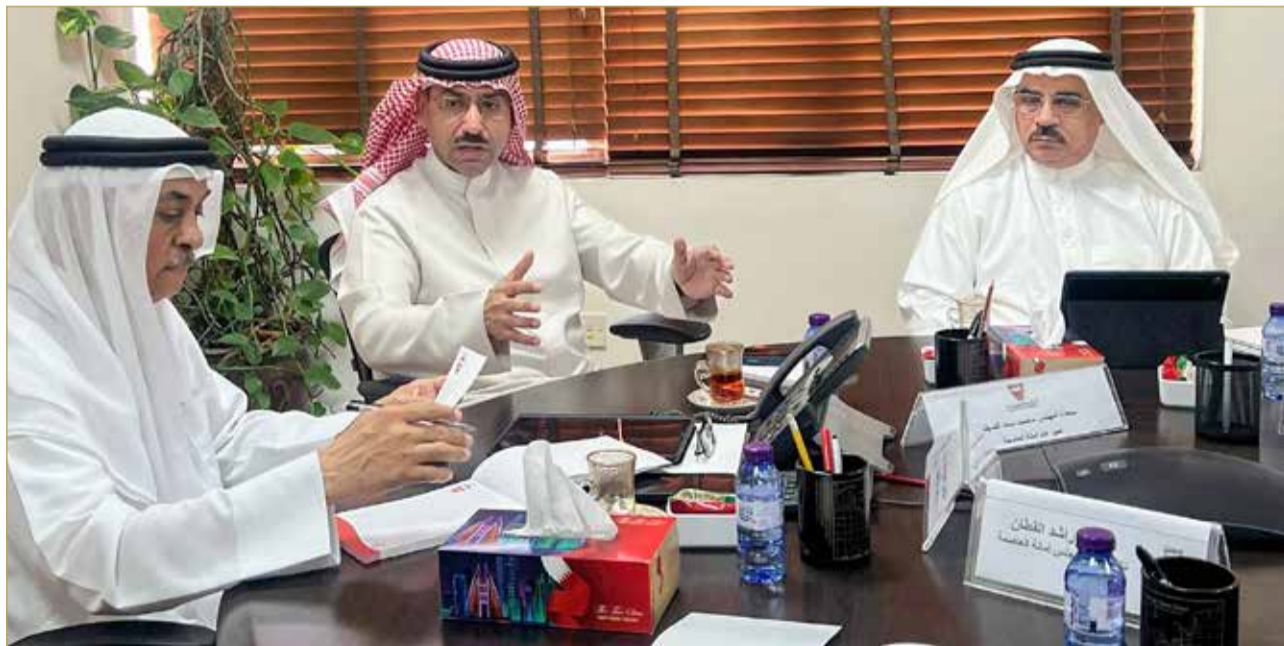
جانب من جلسة مجلس أمانة العاصمة أمس

وأشار إلى أهداف الملتقى، وهي: تعزيز الاستدامة الاقتصادية عبر استثمار الأراضي والممتلكات البلدية، وتحفيز الشراكة بين القطاعين، وتمكين القطاع الخاص من قيادة مشروعات تنموية، وضمان العدالة والتوازن في توزيع المشروعات.