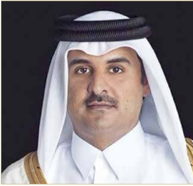
سمو أمير دولة قطر