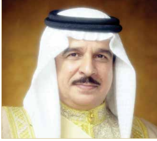
جلالة الملك المعظم

أسمى آيات التهاني والتبريكات بهذه المناسبة، داعياً المولى عز وجل أن يديم على جلالة الملك المعظم موفور الصحة والسعادة وطول العمر، وأن يحفظ جلالته عزاً وذخراً وسنداً للوطن وكافة أبنائه، وأن يعيد هذه المناسبة على جلالته ووطننا العزيز وأبنائه الكرام، وعلى الأمتين العربية والإسلامية وهي ترفل بالخير واليمن والبركات.