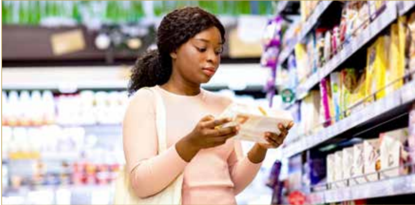
امرأة بريطانية واختلاف الأسعار في المحلات

وكشفت بيانات إضافية من مكتب الإحصاءات الوطنية مؤخرًا عن قفزة قدرها 1.8 مليار جنيه إسترليني في "المساهمات