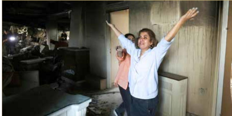
إيرانيتان تعبران عن صدمتهما أثناء تفقدتهما الأضرار داخل منزلهما في طهران "ب.أ"

المتبقية من اليورانيوم المخضب. دول كفرنسا وقطر وسلطنة عمان لعبت دورا في الوساطة، إذ نقلت باريس الشروط الأميركية لطهران قبل دخول الهدنة حيز التنفيذ. وفي حين تحدثت واشنطن عن رغبة في الاستقرار، توعدت طهران من يثبت تعاونه مع إسرائيل، معلنة تنفيذ إعدامات واعتقالات طالت مئات الأشخاص. وبينما تشغل إيران بإعادة ترتيب المشهد الداخلي، خصوصا مع تصاعد الحديث عن خلافة المرشد، تسعى الأطراف الفاعلة إلى تثبيت وقف إطلاق النار وتحويله إلى مسار دبلوماسي دائم.