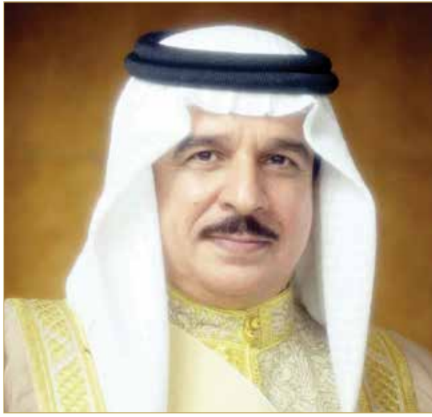
جلالة الملك المعظم

قيادة سموه الحكيم. وأشاد جلالته، في هذه المناسبة، بأواصر العلاقات الأخوية الوطيدة التي تجمع بين مملكة البحرين ودولة قطر، مؤكداً جلالته مواصلة تنمية وتطوير هذه العلاقات في ظل الشراكة الثنائية التي تجمعهما. وبعث ولي العهد رئيس مجلس الوزراء صاحب السمو الملكي الأمير سلمان بن حمد آل خليفة، برقية تهنئة إلى أمير دولة قطر بمناسبة ذكرى تولي سموه مقاليد الحكم في دولة قطر. وأعرب جلالته في البرقية عن أطيح تهنائه وتمنياته لسموه موفور الصحة والسعادة، ولشعب دولة قطر الشقيق تحقيق مزيد من التقدم والازدهار في ظل