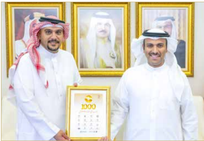
المنامة - بنا

الملك حمد بن عيسى آل خليفة، وتوجيهات ولي العهد رئيس مجلس الوزراء صاحب السمو الملكي الأمير سلمان بن حمد آل خليفة، الرامية إلى تعزيز التحول الرقمي والاستثمار في العنصر البشري وإعداده لمواكبة التطورات التقنية المتسارعة. (اقرأ الموضوع كاملاً بالموقع الإلكتروني)