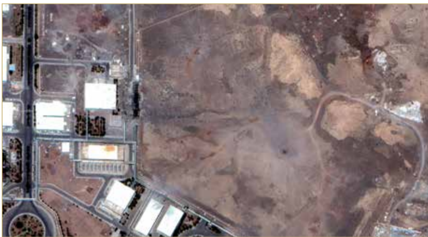
آثار الضربة الأميركية على منشأة نطنز

حسمت إيران أمر ما جرى في منشآتها النووية، وسط تقييمات استخباراتية جديدة باحتمال أن تكون الضربات الأميركية على مواقع نووية إيرانية لم تؤد إلى القضاء على البرنامج النووي الإيراني، وتشديد الرئيس الأميركي دونالد ترامب ومساعديه على عدم دقة هذه المعلومات. فقد أفاد منشور جديد لمراسل بوكالة أسوشيتد برس، نقلا عن وزارة الخارجية الإيرانية، بأن المنشآت النووية تضررت بشدة. وأضاف، الأربعاء، نقلا عن المتحدث باسم الخارجية الإيرانية قوله إن المنشآت النووية "تضررت بشدة" بسبب الضربات الأميركية.