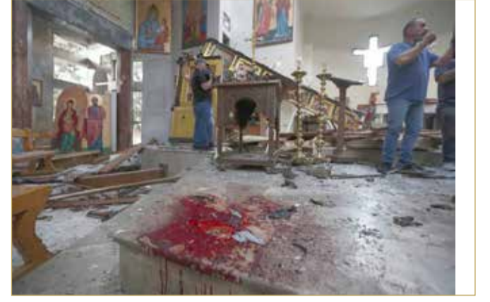
دماء ودمار داخل كنيسة "مار إلياس" بدمشق

أعدت العملية الانتحارية التي استهدفت كنيسة مار إلياس في حي الدويلعة في دمشق، الجدل حول نشاط "داعش" داخل الأراضي السورية. ورغم اللفظ الذي أثاره إعلان "سرايا أنصار السنة" تبنيها العملية، تتفق مصادر متقاطعة على أن الجماعات المتطرفة، على اختلاف توجهاتها، تنخرط الآن في محاولات حثيثة لتقويض حكومة الرئيس السوري أحمد الشرع، بدوافع وأساليب مختلفة. ويكشف قائد في الجيش السوري الجديد عن جانب خطر من محاولات تنظيم "داعش" لتنفيذ عمل عسكري واسع ومفاجئ على دمشق، بالتزامن مع خطط لتغلغل عناصر من البادية إلى المدن، بينما تندفع جماعات أخرى دعوية لشن هجمات تحت طائلة الغضب والتوتر من السلطات السورية.