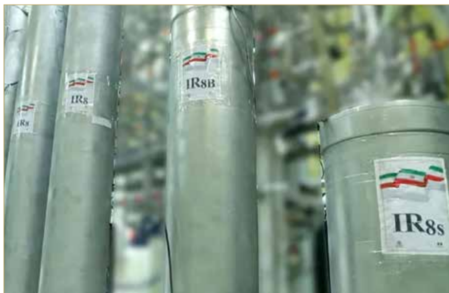
أجهزة طرد مركزي في منشأة نطنز للطاقة النووية في إيران

بممن بخس"، مضيفا "لذلك، فإن منظمة الطاقة الذرية الإيرانية ستقوم بتعليق التعاون مع الوكالة حتى يتم ضمان أمن منشآتنا النووية، وسيقدم البرنامج النووي السلمي الإيراني بوتيرة أسرع". وقال المدير العام للوكالة رافائيل جروسي، الأربعاء، إنه يسعى إلى عودة المفتشين إلى المواقع الإيرانية، بما في ذلك المحطات التي تولت تخصيب اليورانيوم حتى شنت إسرائيل هجماتها في 13 يونيو. وأضاف جروسي أن "الأولوية القصوى" لمفتشيه هي العودة إلى المنشآت النووية الإيرانية لتقييم أثر الضربات العسكرية على برنامج طهران النووي. وردا على سؤال بشأن إمكان إجراء عمليات تفتيش على المواقع النووية الإيرانية، أوضح جروسي "هناك أنقاض وربما تكون هناك ذخائر غير منفجرة وهذه ليست عمليات تفتيش عادية".