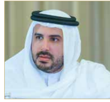
سمو الشيخ محمد بن سلمان

عدد من كبار المسؤولين، إذ أطلع سموه على إيجاز عن الخطط الموسومة للعام الجاري ومسارات تنفيذها، مؤكداً الأهمية التي يمثلها العمل بروح الفريق الواحد في مختلف المشروعات والخطط لتحقيق النجاحات المنشودة، مشيداً في هذا الصدد بجهود جميع