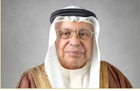
رئيس الأوقاف الجعفرية

رفع رئيس الأوقاف الجعفرية يوسف الصالح أسمى آيات الشكر والتقدير والاعتزاز إلى المقام السامي لملك البلاد المعظم صاحب الجلالة الملك حمد بن عيسى آل خليفة، بمناسبة صدور الأمر الملكي بصرف المكرمة الملكية السامية للمآتم والحسينيات للعام الهجري 1447هـ الموافق 2025 م. وثنى رئيس الأوقاف الجعفرية المكرمة السامية والعادة الحميدة لجلالة الملك المعظم بمشاركة شعبه الوفي في مناسبة عاشوراء الخالدة، مؤكداً أن هذه المكرمة تعزز ما توارث عليه وحرص عليه الأجداد والآباء من رعاية خاصة لمناسبة عاشوراء والتي تعكس الترابط والتعايش والانسجام الذي تمتاز به مملكة البحرين منذ الأزل. كما رفع رئيس الأوقاف الجعفرية فائق الشكر والتقدير إلى ولي العهد رئيس مجلس الوزراء صاحب السمو الملكي الأمير سلمان بن حمد آل خليفة على التوجيهات الكريمة لسموه إلى الوزارات والجهات المعنية بمتابعة احتياجات المناطق خلال موسم عاشوراء وتيسير كافة المتطلبات التي تكفل