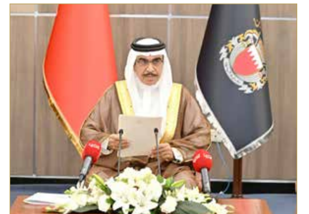
وزير الداخلية يلقي كلمته في اللقاء السنوي برؤساء ومسؤولي المآتم

« المآتم في البحرين موجودة منذ مئات السنين حتى قبل وجودها في إيران « أنتم وبسبب الظروف الإقليمية أمام مسؤولية ضبط فعاليات "عاشوراء" « البحرين ليست وطن الغالب والمغلوب بل وطن العيش المشترك » 07