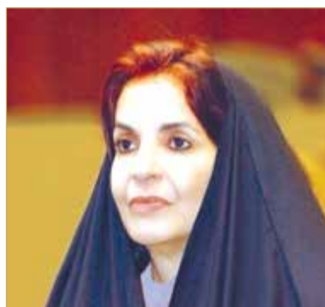
سمو الأميرة سبيكة بنت إبراهيم

وأكدت قرينة ملك البلاد المعظم أن هذا الإنجاز