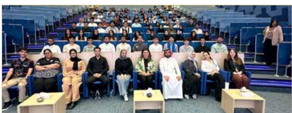
برنامج ولي العهد للمنتسبين العالمية يبدأ بتدريب الطلبة المرشحين لبعثات 2026

مختلف المدارس الحكومية والخاصة، لتعريفهم بتفاصيل الدورات التدريبية التي ستقدم لهم في فترة الصيف والسنة الدراسية المقبلة. (اقرأ الموضوع كاملا بالموقع الإلكتروني)