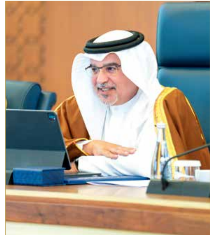
سمو ولي العهد رئيس الوزراء يترأس الاجتماع الاعتيادي الأسبوعي لمجلس الوزراء