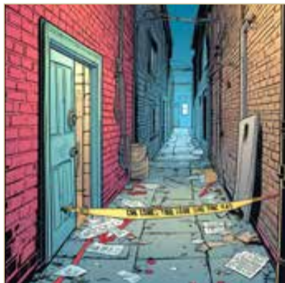
عليه غيابيا، استنادًا إلى المادة (1/201) من قانون الإجراءات الجنائية.