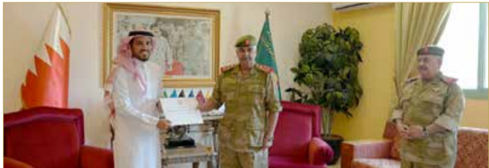
سمو رئيس الحرس الوطني يقدم دعم منتسبي الحرس الوطني السنوي للمؤسسة الملكية للأعمال الإنسانية

على الدور الرائد للحرس الوطني على الصعيدين الإنساني والمجتمعي، ومساهمته في العديد من الأعمال التنموية في المجتمع البحريني، معربا عن شكره وتقديره للفريق أول ركن سمو الشيخ محمد بن عيسى آل خليفة رئيس الحرس الوطني لجهوده الميمونة في دعم أنشطة وبرامج المؤسسة الملكية، مشيدا باهتمام مدير أركان الحرس الوطني الفريق الركن الشيخ عبدالعزيز بن سعود آل خليفة، بتعزيز جهود الشراكة المجتمعية لمنتسبي الحرس الوطني مع أفراد المجتمع، ما يسهم في نشر ثقافة الخير والعطاء في مملكة البحرين.