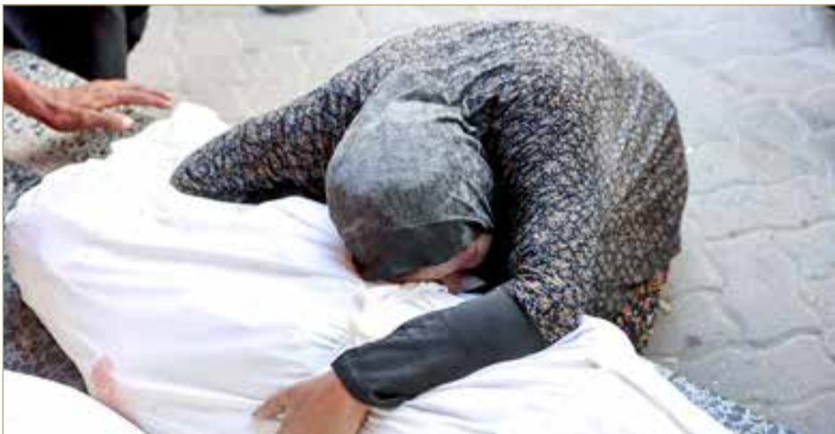
فلسطينية تحتضن جثمان أحد أقرانها استشهد في غارة إسرائيلية