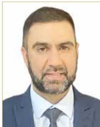
البروفيسور عمر العوضي