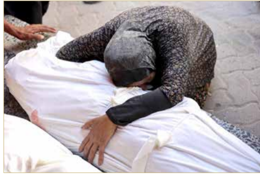
فلسطينية تحضن جثمان أحد أقربائها استشهد في غارة إسرائيلية

المستمرة في القطاع الفلسطيني منذ 20 شهراً، وذلك لإجراء محادثات بشأن وقف النار في غزة وحول إيران. وفي السياق، أوضح المتحدث باسم الحكومة الإسرائيلية، الاثنين، أن رئيس الوزراء بنيامين نتنياهو يعمل على إنهاء العملية العسكرية في غزة من خلال استعادة الرهائن أولاً وهزيمة حركة حماس في أقرب وقت ممكن. وقال ديفيد بنسور في مؤتمر صحفي قد أوضح رئيس الوزراء أنه يجب أولاً إخراج الرهائن، وحل مسألة غزة، وهزيمة حماس، مؤكداً أن كلا الهدفين سيتم تحقيقهما. كما تابع بنسور بالقول إن النصر الذي حققته إسرائيل في حربها مع إيران قد فتح فرصاً للسلام في المنطقة بأكملها.