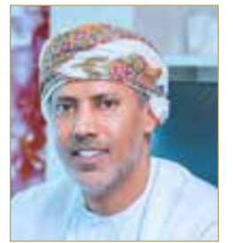
الشيخ خالد المعشني