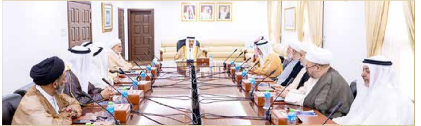
الشيخ عبدالرحمن بن محمد يترأس اجتماع "الأعلى الإسلامي"

التسامح والتعايش، داعيًا المشاركين في موسم عاشوراء إلى أن يتحملوا مسؤوليتهم في إنجاح الموسم، وأن يبدأوا حرصهم المعهود؛ للحفاظ على قدسية الشعائر، وترسيخ مضمونها الإنسانية، بعيدًا عن أي استغلال أو تسييس.