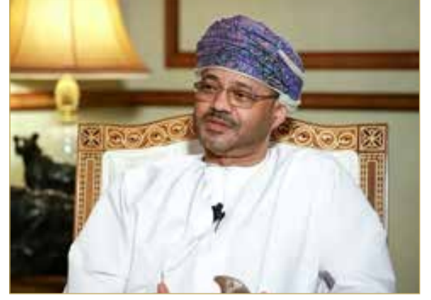
وزير الخارجية العماني

وكشف البوسعيدي عن أن عُمان مستمرة في جهود الوساطة الهادفة إلى المحافظة على وقف إطلاق النار بين إسرائيل وإيران، وتخفيف حدة التوتر، والدفع بجهود استئناف المفاوضات بين طهران وواشنطن حفاظًا على الأمن والاستقرار الإقليمي. وأكد التزام السلطنة بالمساعي السلمية لحل الأزمات الإقليمية والدولية عبر الحوار والدبلوماسية. ودعا البوسعيدي طهران وواشنطن إلى تقديم نوايا حقيقية تهدد لتقريب وجهات النظر؛ حتى تعود المفاوضات إلى مسارها.