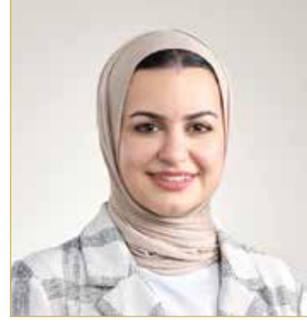
وزيرة شؤون الشباب

وأكدت وزيرة أن الوزارة تواصل العمل مع شركائها في القطاعين العام والخاص لتطوير هذه المبادرة وتعزيز أثرها، بما يسهم في بناء جيل شبابي قيادي قادر على الإبداع والمنافسة، والمساهمة بفعالية في تحقيق أهداف رؤية البحرين الاقتصادية والاجتماعية.