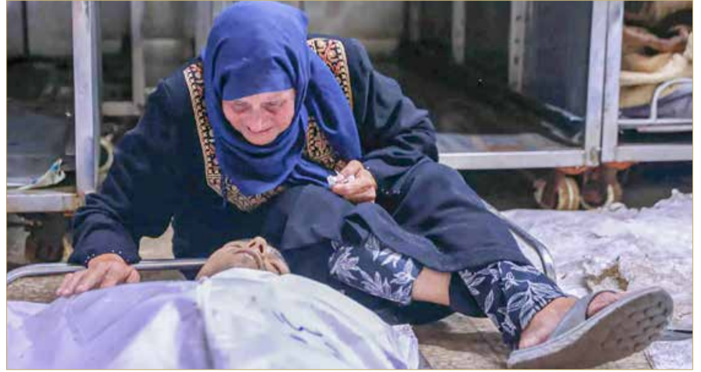
امرأة فلسطينية تنعى قريبها الذي استشهد في غارة إسرائيلية بشاطئ غزة