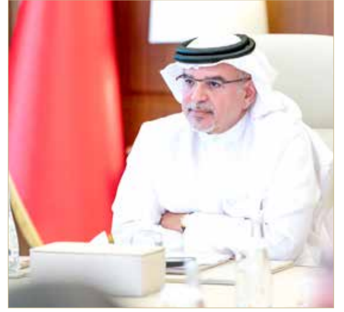
سمو ولي العهد رئيس الوزراء يترأس اجتماع اللجنة التنسيقية