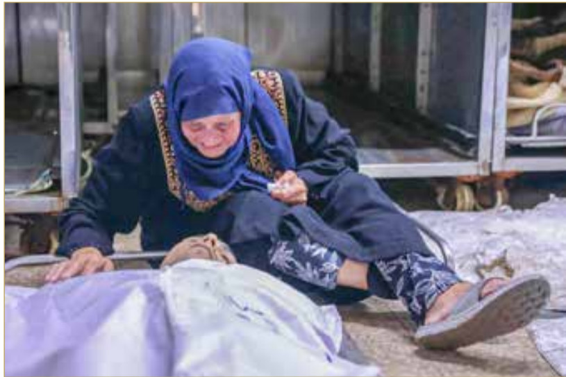
امرأة فلسطينية تنعى قريبها الذي استشهد في غارة إسرائيلية بشاطئ غزة

ترامب يأمل التوصل إلى هدنة الأسبوع المقبل