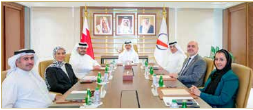
الاجتماع الثاني لمجلس إدارة وكالة البحرين للفضاء

وقد أثنى رئيس المجلس الشيخ خالد بن علي بن جابر آل خليفة، على جميع الإنجازات التي حققتها الوكالة في الفترة الماضية بالتعاون مع الأمانة العامة لمجلس الدفاع الأعلى، كما أكد ضرورة استمرار تكريس الجهود المبذولة لتحقيق أفضل النتائج، وتشجيع السعي الدؤوب لتوجيه تلك النتائج لتصب في دعم مكانة مملكة البحرين في قطاع الفضاء لتحقيق الطموحات المنشودة.