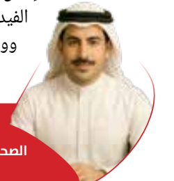
البلاد الصحافي الافتراضي "عبدالله"