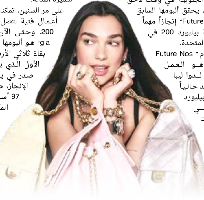
البلاد | طارق البَحَار

على مر السنين، تمكنت ليبا من دفع أربعة أعمال فنية لتصل إلى قائمة بيلبوردر 200. وحتى الآن، "Future Nostalgia" هو ألبومها الوحيد الذي حقق بقاءً ثلاثي الأرقام. ويقترب ألبومها الأول الذي يحمل اسمها، والذي صدر في يونيو 2017، من هذا الإنجاز، حيث سجل حتى الآن 97 أسبوعاً على القائمة المكونة من 200 مركز، على الرغم من أن المشروع لا يظهر بانتظام، ويصعب التنبؤ بما إذا كان سيصل إلى هذا الرقم التاريخي.