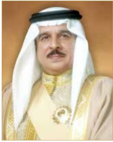
ملك البلاد المعظم

ولي العهد رئيس مجلس الوزراء برقية تهنئة ماثلة إلى الوزير الأول