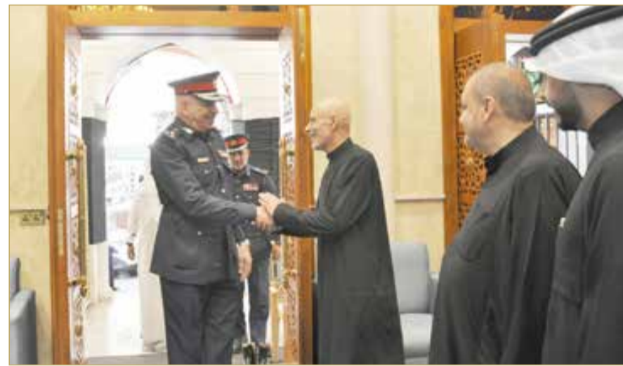
المدير العام لمديرية شرطة العاصمة يزور عدداً من المآتم لمتابعة تقديم الخدمات