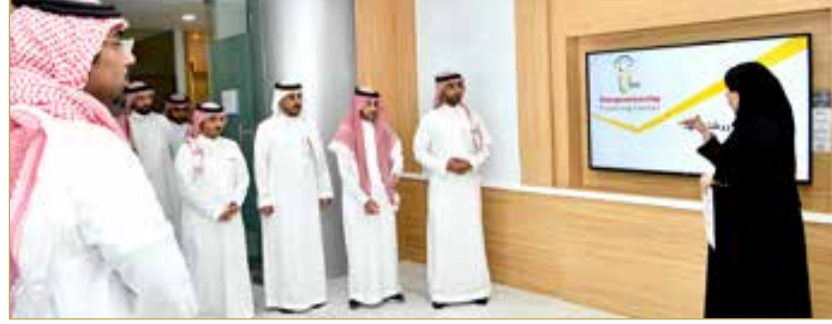
جولة في جمعية البحرين لتنمية حاضنات الأعمال

مجلس الأعمال السعودي البحريني في تسهيل التعاون مع القطاعات الاقتصادية البحرينية. واختتم حديثه بالقول إن مثل هذه الزيارات تسهم في تطوير أداء مؤسسات قطاع الأعمال الشبابية، وتمكين رواد الأعمال من تبادل الخبرات والتفاعل مع التجارب الاقتصادية في المنطقة.