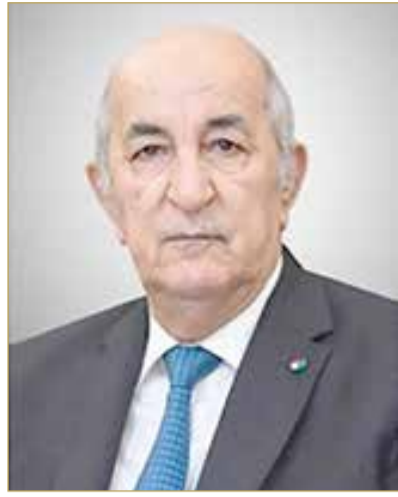
رئيس الجمهورية الجزائرية

وأعرب جلالتهم وسموه في البرقيتين عن أطيب تهنئتهما وتمنيتهما لرئيس الجمهورية الجزائرية موفور الصحة والسعادة، ولشعب الجمهورية الجزائرية الديمقراطية الشعبية الشقيقة تحقيق مزيد من التقدم