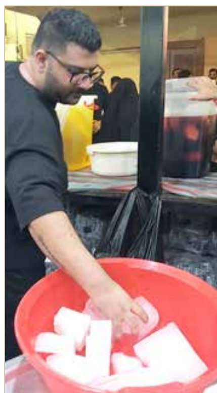
شاب يقدم المشروبات الباردة في العاصمة

بمختلف نكهاته، حيث يستلهمون من عاشوراء مبادئ البذل الكريم، وفي بعض المناطق، تبقى المضائف مفتوحة 24 ساعة بلا انقطاع، مستعينة بمصانع وموردي الثلج، الذين يلبون الطلب المتزايد على قوالب ومكعبات الثلج من مختلف الأحجام.