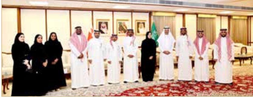
شباب أعمال الشرقية مع السفير السديري