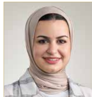
وزيرة شؤون الشباب

ولي العهد رئيس مجلس الوزراء صاحب السمو الملكي الأمير سلمان بن حمد آل خليفة، حيث تعمل جميع الجهات بالمملكة على تهيئة البيئة الحاضنة لإطلاق طاقات الشباب، وتمكينهم من المشاركة الفعالة في بناء الوطن. (اقرأ الموضوع كاملاً بالموقع الإلكتروني)