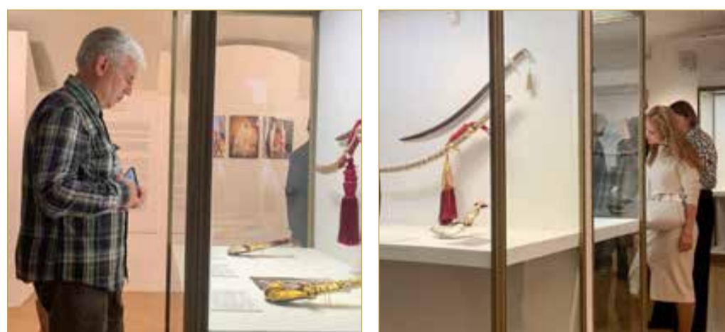
السيوف والخناجر البحرينية في متحف الأرميتاج

« هل هناك خطة لتفعيل التعاون الثقافي بين مملكة البحرين وجمهورية روسيا الاتحادية عبر اتفاقيات أو مشروعات مشتركة مقبلة؟