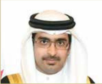
سمو محافظ الجنوبية

عن مجموع الشكاوى والمقترحات والطلبات الواردة عبر قنوات المحافظة المباشرة والإلكترونية، إذ بلغ مجموع الاستفسارات والطلبات لمنتصف العام مع نهاية شهر يونيو 2025، حدود 1209 استفسارات وطلبات في المجالات الأمنية والخدماتية والاجتماعية.