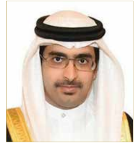
سمو الشيخ خليفة بن علي