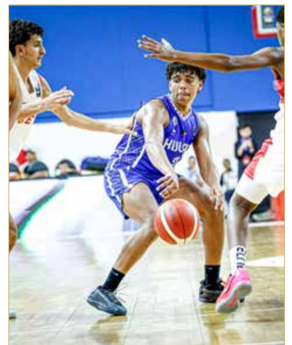
من لقاء الكويت وإمارات

الرئاسة محسومة وصراع 13 مترشحاً على انتخابات المقاعد الـ 9