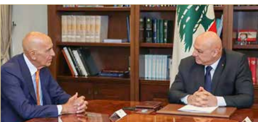
توم براك وجوزيف عون

العديد من القضايا. نحن نعمل على خطة تحتاج إلى حوار جدي، وقد حققنا تقدماً كبيراً وأنا راضٍ عنه، لكن لا بد من التطرق إلى كل التفاصيل للوصول إلى حل فعلي".