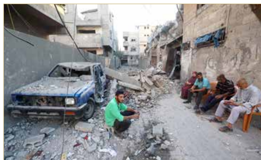
فلسطينيون يجلسون بجوار منزل مهدم وسيارة مدمرة جراء القصف وسط قطاع غزة