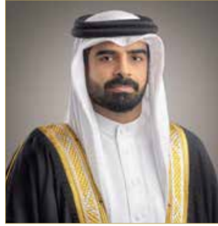
سمو الشيخ سلمان بن محمد

وأشاد حاجي بالمستويات الفنية الكبيرة التي ظهر