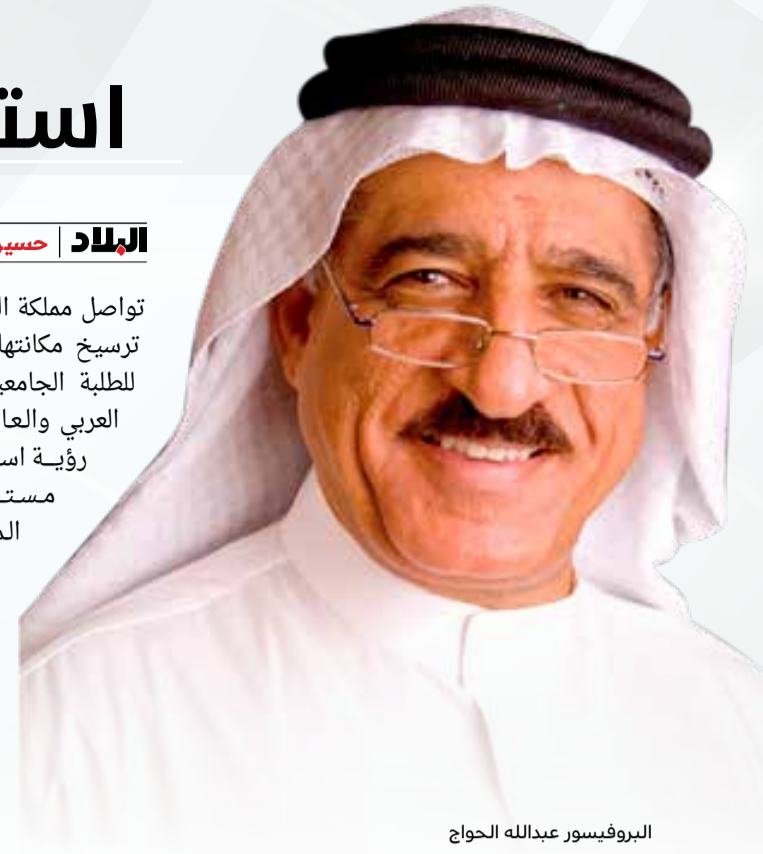
البروفيسور عبدالله الحواج

تواصل مملكة البحرين خطواتها المتسارعة نحو ترسيخ مكانتها كمركز إقليمي مرموق جاذب للطلبة الجامعيين من دول الخليج والوطن العربي والعالم في التعليم العالي، في ظل رؤية استراتيجية واضحة وطموحة ومستفيدة من بيئتها الأكاديمية المتطورة والاستثمار الحكومي المتزايد في اقتصاد المعرفة. وتأتي هذه الجهود في إطار مساعٍ وطنية لتحويل المملكة إلى "بوسطن الخليج"، بما يعكس التزام القيادة بتعزيز دور التعليم كركيزة للتنمية المستدامة. وفي تصريح خاص لصحيفة "البلاد"، أكد رئيس مجلس