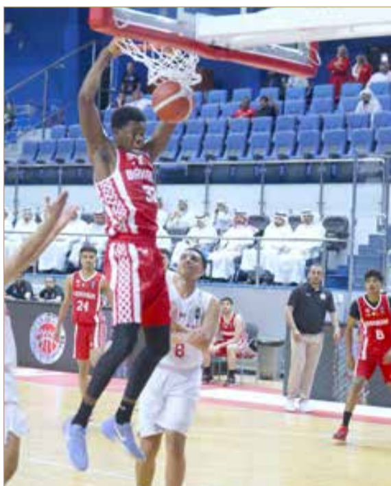
من لقاء منتخبنا أمام عمان

وتقام مساء اليوم الثلاثاء مواجهتان ضمن الجولة الثانية من البطولة، إذ يلتقي، في الخامسة مساءً، المنتخب السعودي نظيره الإماراتي في أول ظهور لـ "الأخضر" في المنافسات، فيما يخوض منتخبنا الوطني مواجهة من العيار الثقيل أمام المنتخب الكويتي في الساعة 7:30 مساءً. ويسعى "الأحمر" الناشئ إلى مواصلة عروضه القوية وتحقيق فوزه الثاني تواليًا، والانفراد بصدارة الترتيب العام، مدعومًا بالمعنويات المرتفعة عقب الانطلاقة المثالية والانتصار الكبير على عمان، في حين يتطلع "الأحمر" الكويتي لتعزيز حظوظه وتحقيق انتصار جديد يبقيه في قلب المنافسة على بطاقة التأهل الآسيوي.