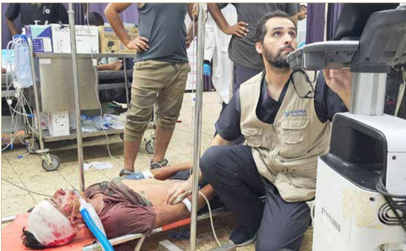
فلسطيني أصيب أثناء محاولته الحصول على مساعدة غذائية

وأضاف المسؤول: "قد يتم التوصل إلى اتفاق حتى في غضون يوم واحد، الخلافات ليست بتلك الأهمية، فالأمر كله يعتمد على مدى تعنت الطرفين ومدى الضغط الذي سيمارسه الرئيس الأميركي".