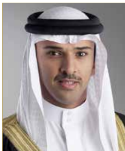
الشيخ علي بن خليفة

وبحسب النظام الأساسي للاتحاد، سيتم انتخاب 9 أعضاء فقط من بين المرشحين الـ 13، بعد استبعاد اسم الشيخ علي بن خليفة الذي تمت تزكيته رئيسًا