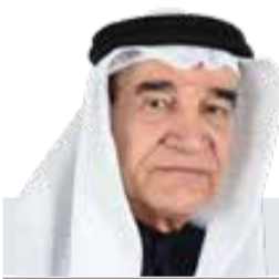
* د. منصور سرحان

أكد محافظ الجنوبية سمو الشيخ خليفة بن علي آل خليفة، أن المحافظة مستمرة بجهودها المبذولة في تعزيز التواصل والتفاعل الدائم وسرعة الاستجابة مع جميع الأهالي؛ بهدف ترسيخ مبدأ الشراكة المجتمعية، وذلك تنفيذاً للتوجيهات السديدة من لدن ملك البلاد المعظم صاحب الجلالة الملك حمد بن عيسى آل خليفة، وبالدعم اللامحدود من قبل ولي العهد رئيس مجلس الوزراء صاحب السمو الملكي الأمير سلمان بن حمد آل خليفة، في إطار التحول الإلكتروني للخدمات والتعاملات المقدمة للمواطنين والمقيمين، بما يضمن تقديمها بأساليب حديثة وميسرة للجميع. وأوضح سمو المحافظ، أن المحافظة الجنوبية