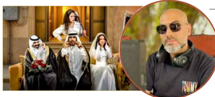
المخرج حسين الحلبي وفريق العمل الجديد

تستعد منصة "شاهد" لعرض المسلسل الخليجي الكوميدي "حمود وأبوه" من إخراج البحريني حسين الحلبي، وذلك ابتداء من يوم غد (11 يوليو)، ضمن فئة الأعمال القصيرة المؤلفة من عشر حلقات فقط. ويقدم الحلبي عبر هذا العمل تجربة درامية تمزج بين الطرافة والبعد الإنساني، في قالب اجتماعي خفيف، يتناول العلاقة المتقلبة والمرحة بين "حمود" ووالده، التي تتأرجح بين الجدية والعبث بروح ساخرة وواقعية. ويُعد "حمود وأبوه" خطوة جديدة في مسيرة حسين الحلبي، الذي يواصل تقديم أعمال تعكس بصمته الإخراجية الخاصة، المتوازنة بين الكوميديا الخفيفة والدراما الاجتماعية الهادفة، وسط توقعات بتفاعل واسع مع العمل عند انطلاقه على المنصة.