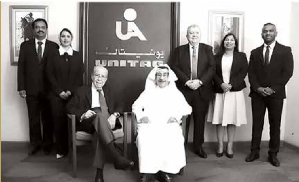
المسؤولون التنفيذيون في الشركة