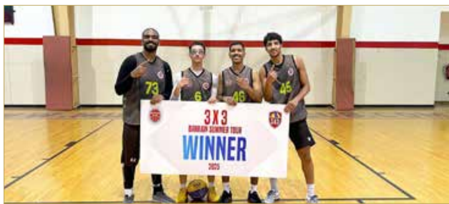
“المحرق” بطلا للجولة السادسة

قوة المنافسة وتنوع مستويات الفرق المشاركة. وتتيح هذه الجولات للفرق جمع النقاط المؤهلة للجولة النهائية الكبرى "Quest Final"، المقرر إقامتها في الأول من أغسطس المقبل، والتي ستحدد البطل الأول لنسخة البطولة الافتتاحية. كما أن الجولة النهائية "Quest" تمنح البحرين مقعداً للمشاركة في إحدى محطات الجولة العالمية لكرة السلة 3x3 فئة "الماسترز" المرموقة؛ ما يمنح فرصة مثالية للفرق الفائزة بتمثيل مملكة البحرين في استحقاق عالمي رسمي.