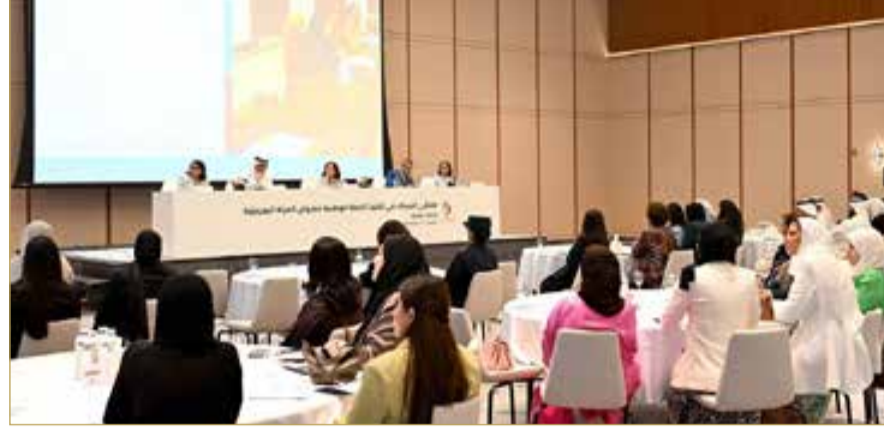
الرفاع - المجلس الأعلى للمرأة

بناءً على اعتماد المجلس الأعلى للمرأة برئاسة قرينة عاهل البلاد المعظم رئيسة المجلس الأعلى للمرأة صاحبة السمو الملكي الأميرة سبيكة بنت إبراهيم آل خليفة، لخطة الوطنية لنهوض المرأة البحرينية 2025 - 2026، التي ارتكزت في إعدادها على أسس والتقدم والسعي نحو الريادة، متضمنة أربعة مجالات رئيسية والتي تعتبر أولوية العمل لعامي 2025 - 2026، وهي (استقرار الأسرة، صنع واتخاذ القرار، المشاركة الاقتصادية، جودة الحياة)، وتتوزع مبادرات كل مجال على خمسة محاور هي (السياسات، الموازنات المستجيبة لاحتياجات المرأة، التوعية والتدريب، التدقيق والرقابة، المتابعة والتقييم).