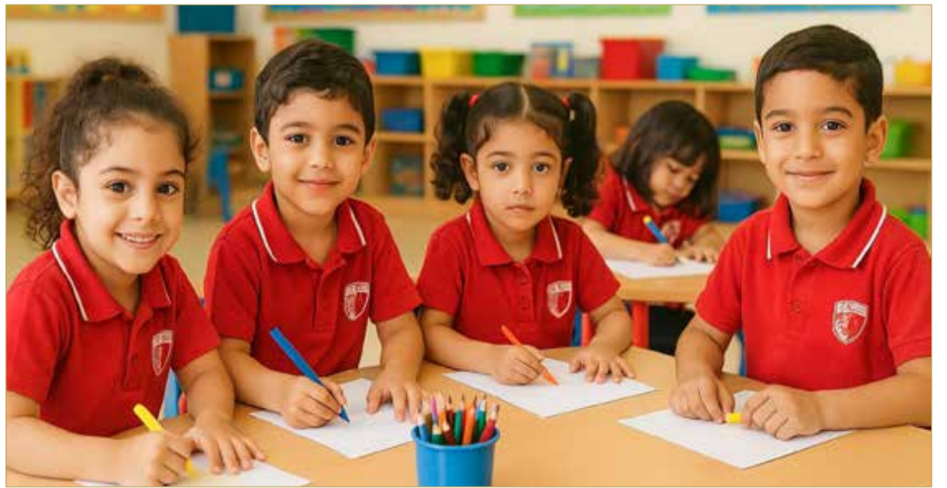
صورة تعبيرية مولدة بالذكاء الاصطناعي