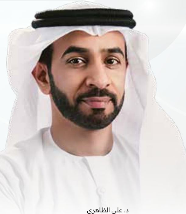
د. علي الظاهري

قال النائب الأول لرئيس مجلس إدارة غرفة تجارة وصناعة أبوظبي د. علي الظاهري، إن عدد الشركات البحرينية المسجلة في غرفة تجارة وصناعة أبوظبي بلغ 267 شركة، وهو ما عده انعكاشاً حقيقياً لمثانة العلاقات الاقتصادية بين البلدين، وفرصة لتوسيع أفق التعاون التجاري والاستثماري، لاسيما في ظل توجهات البلدين نحو شراكات استراتيجية تشمل قطاعات متعددة. وأشار الظاهري في كلمة له أمام رجال أعمال من البلدين، إلى أن إمارة أبوظبي