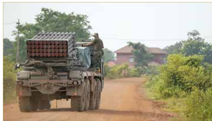
جندي كمبودي يقف على منصة إطلاق صواريخ متعددة

وأضاف: "من قبيل المصادفة، نحن نتفاوض في الوقت ذاته على اتفاقات تجارية مع كلا البلدين، لكننا لا نرغب في إبرام أي صفقة مع أي منهما إذا كانا في حالة حرب، وقد أبلغتهم بذلك صراحة". وأوضح الرئيس الأميركي أنه "سيتم إجراء الاتصال مع تايلندا خلال لحظات. أما المكالمات مع كمبوديا فقد انتهت، لكن من المتوقع أن أتواصل مجدداً بشأن وقف الحرب ووقف إطلاق النار بناءً على ما ستقوله تايلندا". وتابع: "أحاول تبسيط وضع معقد كثير من الأرواح تُزهِق في هذه الحرب، لكنها تذكرني كثيراً بالنزاع بين باكستان والهند، والذي نجحنا في إنهائه بطريقة ناجحة".