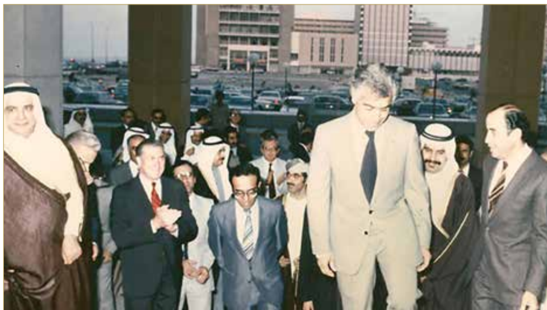
صورة تعود إلى 29 نوفمبر 1980 حيث افتتح وزير التجارة الأسبق المرحوم حبيب قاسم فندق الراجسي