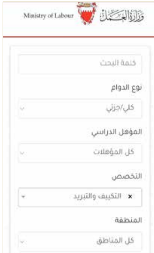
معرض الوظائف الإلكتروني

براتب 250 دينار، بالمحافظة الجنوبية أخصائي إنترنت وسائط متعددة (ملتيميا)، بمؤهل بكالوريوس، وبدوام كلي، براتب 500 دينار، بمحافظة العاصمة. وكانت وزارة العمل قد أكدت أن معرض التوظيف الإلكتروني هو الطريقة الوحيدة حالياً للترشيح للوظائف، مما يبرز أهمية المنصة الرقمية في تسهيل الإجراءات. للاستفادة من هذه الخدمة، يجب على الباحث عن عمل أن يكون مسجلاً في النظام الإلكتروني للتوظيف التابع للوزارة. ويتم الدخول إلى صفحة الخدمات الإلكترونية عبر "المفتاح الإلكتروني"، مما يضمن سرية وأمان البيانات. ولا تفرض الوزارة أي رسوم على هذه الخدمة، وتستغرق عملية الترشيح والتقديم يوم عمل واحد. وبعد تقديم طلب الترشيح، تتولى الشركات التواصل مع المتقدمين لإفادتهم بالقبول أو الرفض، وفي حال التوظيف، يتم تحديث الحالة في النظام. وتتاح للشركات أيضاً إمكانية إجراء مقابلات جماعية كخيار إضافي.