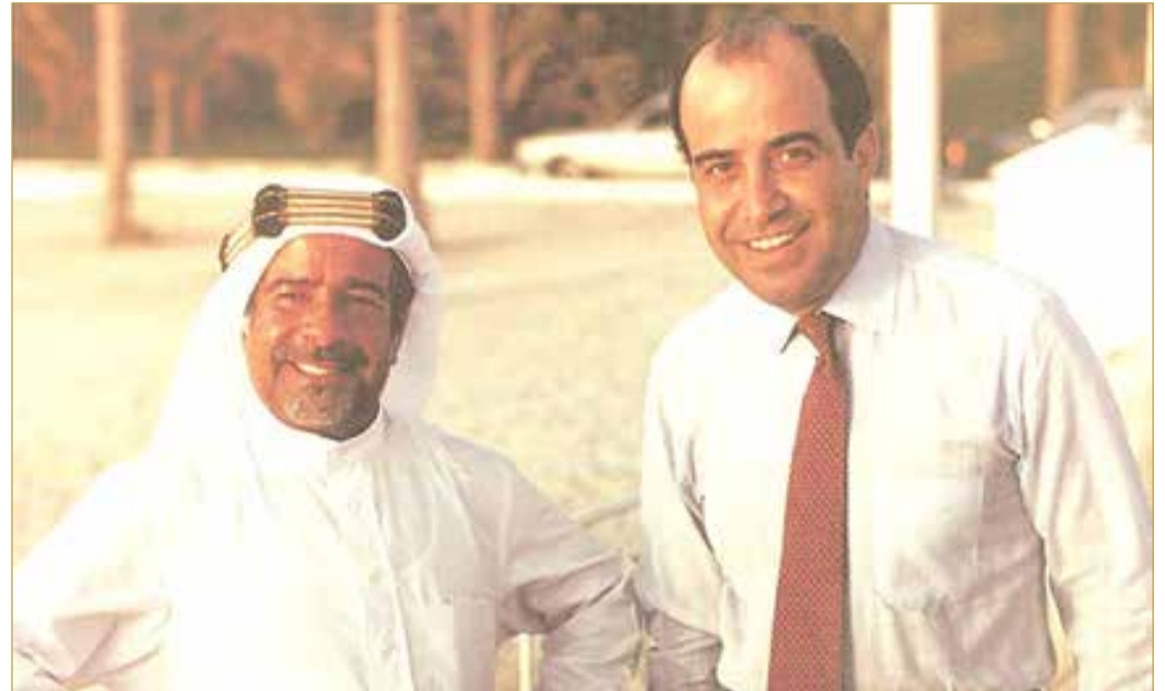
سمو الأمير الراحل الشيخ عيسى بن سلمان آل خليفة طيب الله ثراه مع رئيس "يونيتاك" جميل وفا