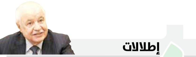
* د. طلال أبوغزالة maltamimi@tagglobal

العملاء، وتشغيل الشبكات، والموارد البشرية، والابتكار الرقمي، وذلك للتعرف على مختلف جوانب العمل وتنمية المهارات الشخصية