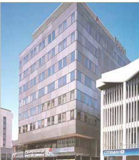
مبنى المجموعة بالعام 1978