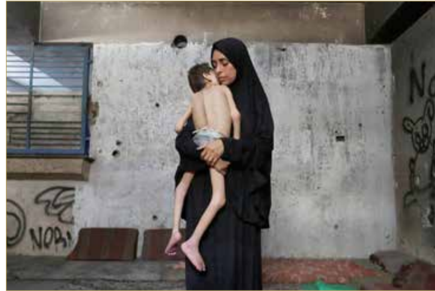
أونروا: الناس في غزة ليسوا أمواتا ولا أحياء إنهم جثث تتحرك

وأضاف نائب وزير الخارجية، في تصريحات نقلتها وكالة "مهر" الإيرانية، أن "بعض الدول على تواصل مع إيران والولايات المتحدة.. وكما تعلمون، كنا نتفاوض بوساطة غمان". وأشار إلى أنه "لم يتم تحديد موعد ومكان المحادثات المقبلة بعد، وإسطنبول هي خيارنا المفضل، وكذلك خيار الدول الأوروبية الثلاث". وكانت إيران قالت إنها ستواصل المحادثات النووية مع القوى الأوروبية بعد ما وصفته بأنه