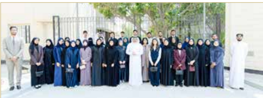
وزير التربية والتعليم يستقبل أعدادا من المتفوقين

وزير التربية والتعليم يستقبل أعدادا من المتفوقين % منهم على الرغبة الأولى أو الثانية. مالية لأصحاب المعدلات من 90 % إلى ولفت إلى توفير 2300 منحة دراسية 94.9 %.