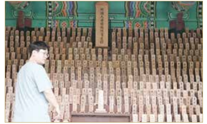
قاعة تذكارية في هاتشيون تضم 1160 لوحا بأسماء كوريين قضاوا في قصف هيروشيما