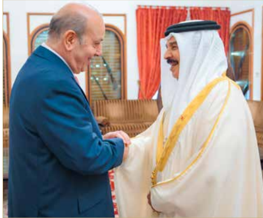
جلالة الملك المعظم يستقبل سفير دولة فلسطين لدى المملكة

بنامة - بنا استقبل ملك البلاد المعظم صاحب الجلالة الملك حمد بن عيسى آل خليفة، في قصر الصافية أمس، سفير دولة فلسطين الشقيقة لدى المملكة طه عبدالقادر. واستعرض جلالته مع السفير الفلسطيني أواخر العلاقات الأخوية الوثيقة بين مملكة البحرين ودولة فلسطين الشقيقة، مشيداً بما وصلت إليه العلاقات الراسخة من تقدم وتطور. وأكد جلالته موقف البحرين الثابت والداعم للقضية الفلسطينية والمؤيد لجميع المساعي والجهود الرامية للتوصل إلى حل سلمي ودائم. وأعرب جلالته عن تقديره لما يبذله السفير من جهود طيبة لتوثيق وتطوير العلاقات البحرينية الفلسطينية والدفع بها إلى آفاق أرحب. وتفضل صاحب الجلالة الملك المعظم، بمنح السفير الفلسطيني وسام البحرين من الدرجة الأولى؛ تقديراً لإسهاماته في توطيد علاقات التعاون الوثيقة بين المملكة ودولة فلسطين.