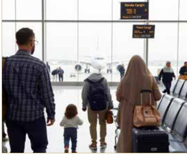
صورة تعبيرية مولدة بالذكاء الاصطناعي

ضمن حملتها التوعوية السنوية “أمنكم الله”، دعت وزارة الخارجية المواطنين إلى اتخاذ عدد من الإجراءات المهمة قبل السفر؛ لضمان سلامة رحلاتهم وتفاذي أي عراقيل قد تواجههم في التنقل بين الدول. وشددت الوزارة على أهمية التأكد من صلاحية جواز السفر، بحيث لا تقل عن ستة أشهر من تاريخ السفر، وذلك وفقاً لمتطلبات العديد من الدول التي لا تسمح بدخول المسافرين الذين تقل صلاحية جوازاتهم عن هذه المدة. كما أوصت الوزارة بضرورة التعرف على إجراءات الحصول على التأشيرة عبر متابعة ما تنشره السفارات من معلومات محدثة على مواقعها الإلكترونية أو عبر الصحافة المحلية.