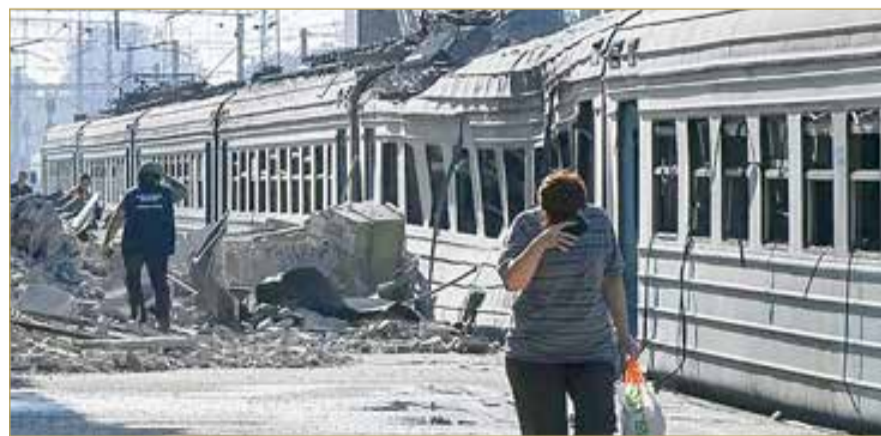
محطة قطار تضررت جراء ضربة بطائرة مسيرة في بلدة لوزوفا بمنطقة خاركييف

وقال مصدران إن الزعيم الروسي لا يريد إغضاب ترامب، ويذكر أنه قد يهدر فرصة لتحسين العلاقات مع واشنطن والغرب، لكن أهدافه الحربية لها الأولوية. وقال أحد