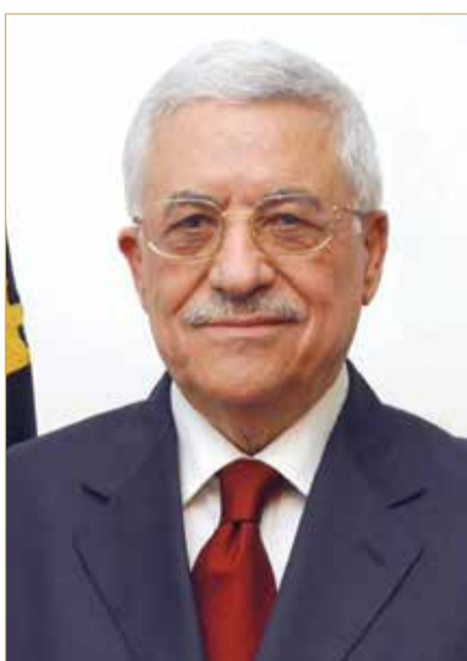
رئيس دولة فلسطين الشقيقة

العلاقات الثنائية الوطيدة بين مملكة البحرين ودولة فلسطين وسبل دعمها وتعزيزها في مختلف المجالات، بالإضافة إلى بحث المستجدات في المنطقة والتطورات المتعلقة بالقضية الفلسطينية. وفي هذا السياق، أكد جلالته الملك المعظم موقف البحرين الثابت والداعم للقضية الفلسطينية والمؤيد لجميع المساعي والجهود الرامية للتوصل إلى حل سلمي ودائم. من جانبه، ثمن الرئيس الفلسطيني مواقف مملكة البحرين المشرفة، بقيادة جلالته الملك المعظم، الداعمة لقضية الشعب الفلسطيني.