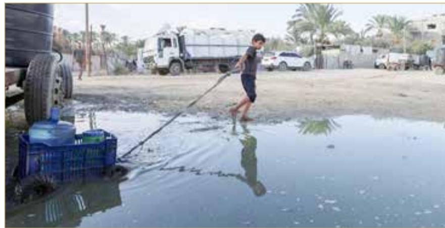
صبي فلسطيني يجر وعاء ملؤه بالماء من مركز توزيع في دير البلح وسط غزة الثلاثاء

وشدّدت على أن تعقيدات الوضع الأمني أدت إلى تفاقم صعوبة الوصول إلى الخدمات الصحية؛ إذ إن ما يقارب 90% من غزة تخضع حاليا لأوامر إخلاء، أو جرى تصنيفها مناطق عسكرية مغلقة؛ ما يقيد حركة المرضى والعاملين الصحيين والمساعدات الإنسانية تقييدا شديدا.