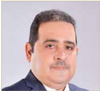
الوكيل المساعد للعلاقات العمالية

الحاروي والتعرض لأشعة الشمس المباشرة وقت الظهيرة؛ لتكريس الصحة والسلامة المهنية في مواقع العمل. ولقت الوكيل المساعد للعلاقات العمالية بوزارة العمل، إلى أن مملكة البحرين ماضية في تطبيق أفضل ممارسات واشتراطات الصحة والسلامة المهنية؛ كونها أهم الأدوات التي تسهم في حماية العمال من الإصابات المهنية خلال هذه الفترة من العام، التي تشهد ارتفاعا في درجات الحرارة والرطوبة.