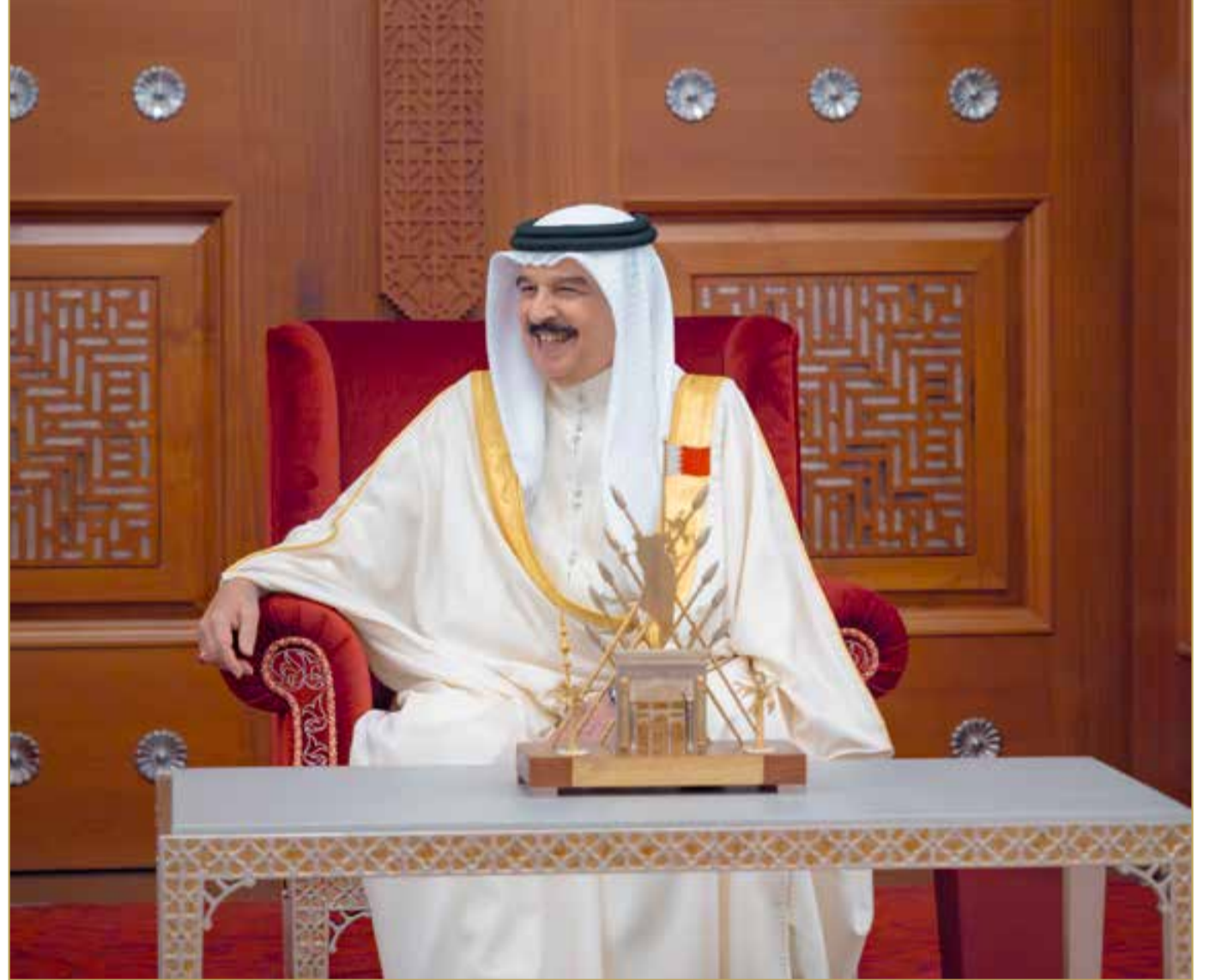
المنامة - بنا

مفوضين. وهنأ صاحب الجلالة الملك المعظم، السفراء بمناسبة تعيينهم في مناصبهم، معرباً عن تمنياته لهم التوفيق في أداء مهامهم الدبلوماسية الجديدة وتحمل هذه المسؤولية الوطنية، وأبلغهم جلالتهم نقل تحياته إلى أصحاب الجلالة والرفعة رؤساء الدول المعينين لديها، وأطيب تمنياته لشعوبهم الصديقة مزيداً من التقدم والازدهار، كما وجههم جلالتهم إلى مواصلة الجهود لتعزيز وترسيخ علاقات التعاون الوثيقة التي تجمع المملكة مع هذه الدول، إلى جانب العمل على رعاية شؤون المواطنين البحرينيين في تلك الدول والاهتمام بمصالحهم وتلبية احتياجاتهم.