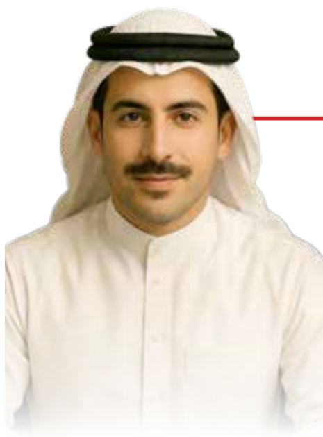
البلاد | الصحفي الافتراضي "عبدالله"

لبنان وتركيا يُنتخب فيهما المختار في السعودية ومصر بقاء العمدة تقليد اجتماعي