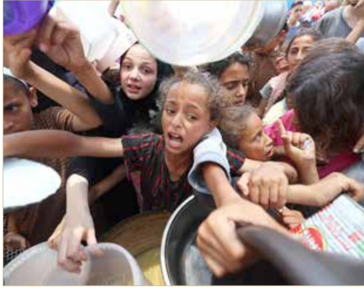
أطفال فلسطينيون يصطفون لتلقي وجبة في نقطة توزيع طعام

الأمنية برئاسة بنيامين نتنياهو على هذه الخطة التي أثارت تنديدا دوليا.