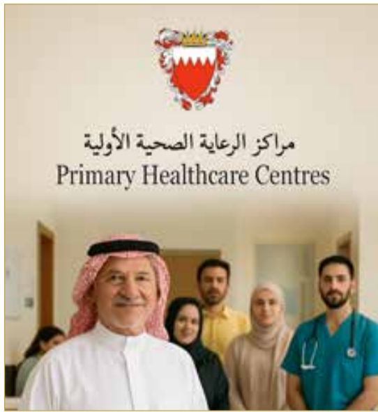
صورة مولدة بالذكاء الاصطناعي

« فحوصات وقائية للكشف المبكر عن الأمراض المزمنة والسرطان »