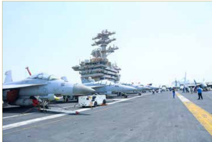
حاملة الطائرات الأميركية العاملة بالطاقة النووية "يو إس إس نيميتز"

رسالة التزام وردع؛ لضمان الاستقرار في المنطقة، ولا أظن أنني بحاجة لتذكيركم بجميع الأحداث التي شهدتها منطقة الخليج وكذلك البحر الأحمر في السنوات الأخيرة.