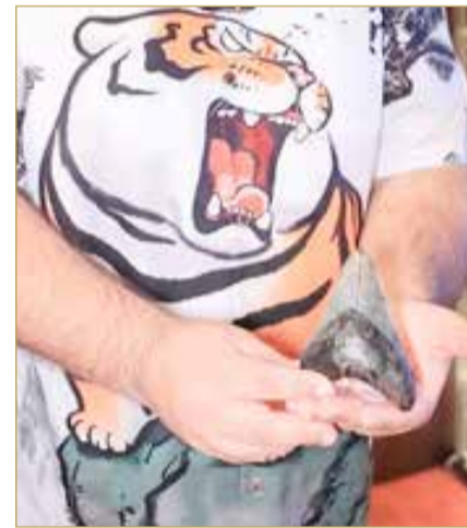
ضرس قرش الميجالودون

البلاد | حسن عبدالرسول | تصوير: خليل إبراهيم