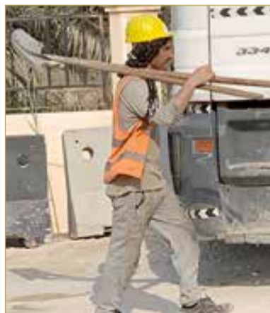
رفشان.. شيلان استعدادًا للحفر