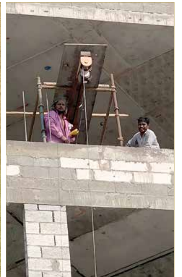
إبتسامه صباحية حلوة