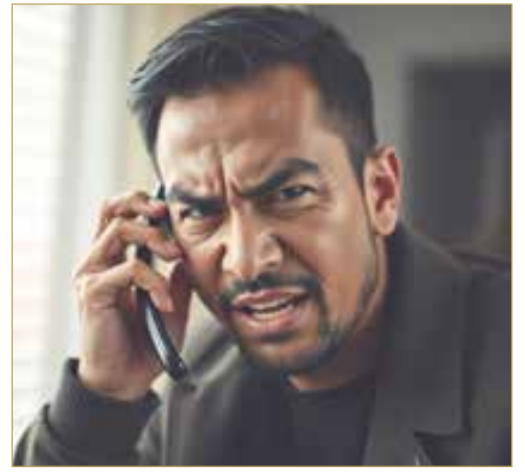
صورة تعبيرية مولدة بالذكاء الاصطناعي

بمفرده، بل بالاشتراك مع متهم ثانٍ، فيما كان العقل المدبر الحقيقي يقيم خارج البحرين. ووجهت النيابة العامة إلى المتهمين تهمة واضحة، أهمها الاشتراك بطريقي الاتفاق والمساعدة مع المجهول في استخدام التوقيع الإلكتروني الخاص بالمجني عليه لغاية غير مشروعة، هي الاستيلاء على المبلغ المذكور في القضية.