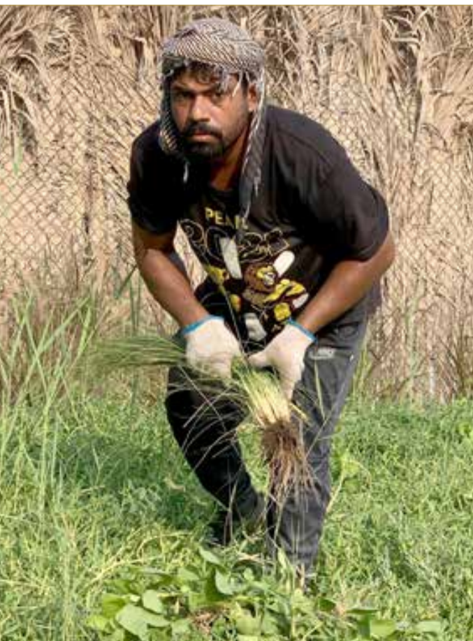
معذور.. قواك الله