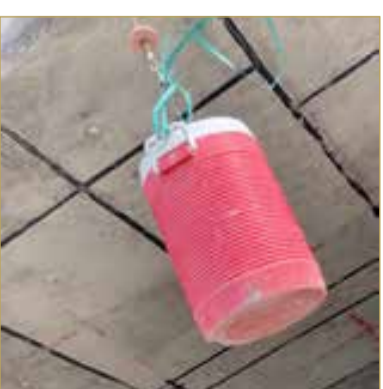
العزيزة الباردة في طريقها إلى الأعلى