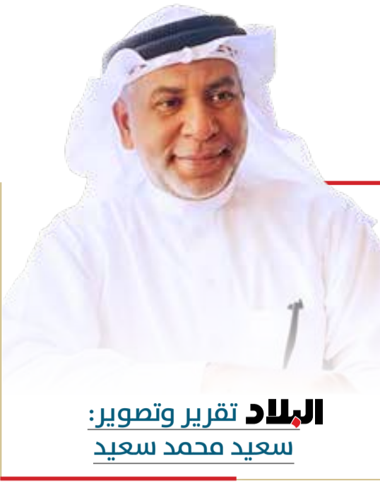
البلاد تقرير وتصوير: سعيد محمد سعيد