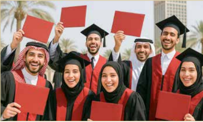
صورة رمزية أنتجت عبر الذكاء الاصطناعي

الطالبة الحاصلون على معدلات بين 90 و 94.9% % فقد حُصصت لهم منح دراسية في مختلف التخصصات. ولا تقتصر البعثات والمنح على ما تقدمه وزارة التربية والتعليم فقط، بل هناك جهات مانحة أخرى؛ من أبرزها برنامج ولي العهد للمنح الدراسية العالمية، الذي يهدف إلى توفير الفرص للشباب المتفوقين للدراسة في أرقى الجامعات والمؤسسات التعليمية الدولية، إضافة إلى تقديم منح خاصة بالتطوير الوظيفي من خلال برامج الدعم والتدريب. (اقرأ الموضوع كاملاً بالموقع الإلكتروني)