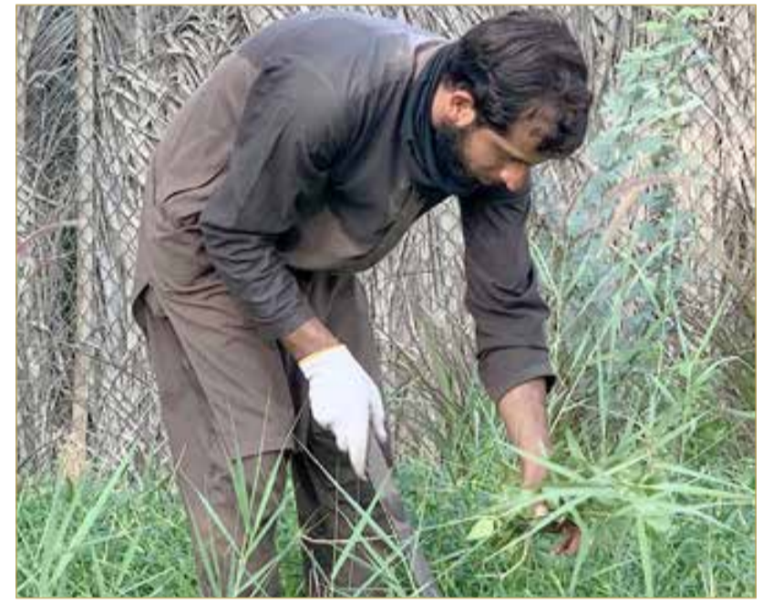
الرطوبة لا تحتمل لكنها لقمة العيش

كاميرا صحيفة "البلاد" تجولت في عدد من مواقع العمل مع شروق الشمس، ورصدت مشاهد مؤثرة، حيث العرق يتصبب من ملابس العمال، والوجوه تملأها ملامح الإجهاد، لكن العزيمة والإصرار لا تغيب عن نظراتهم.. رجال يعملون بصمت في ظروف