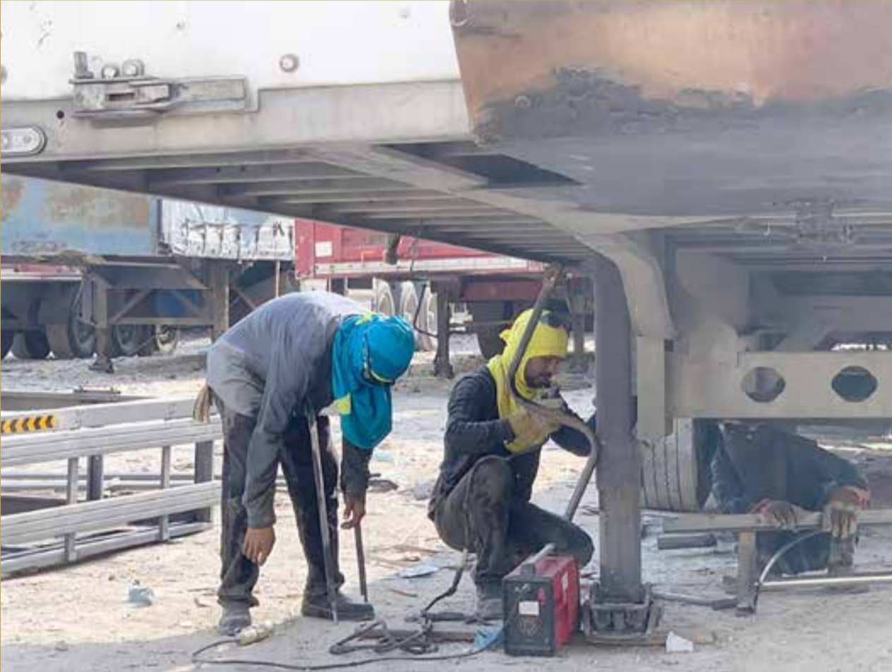
حديد ولحام وحر ورطوبة.. عساکم على القوة