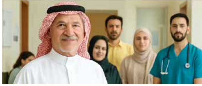
صورة مولدة بالذكاء الاصطناعي