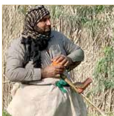
جاهزون بكامل العدة والعتاد