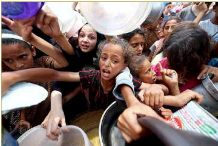
أطفال فلسطينيون يصطفون لتلقي وجبة ساخنة بالنصيرات

والاستقرار بالمنطقة". وجدد المجلس دعمه للجهود المستمرة للوساطة المشتركة المصرية القطرية في سبيل وقف إطلاق النار والعدوان الإسرائيلي على الشعب الفلسطيني. كما جدد الدعوة "لحماية الشعب الفلسطيني من الإبادة والتهمير والتطهير العرقي، ومنع تصفية قضيته المركزية، بموجب قرارات الشرعية الدولية والقانون الدولي والاتفاقيات الدولية والإقليمية ذات الصلة". (اقرأ الموضوع كاملا بالموقع الإلكتروني).