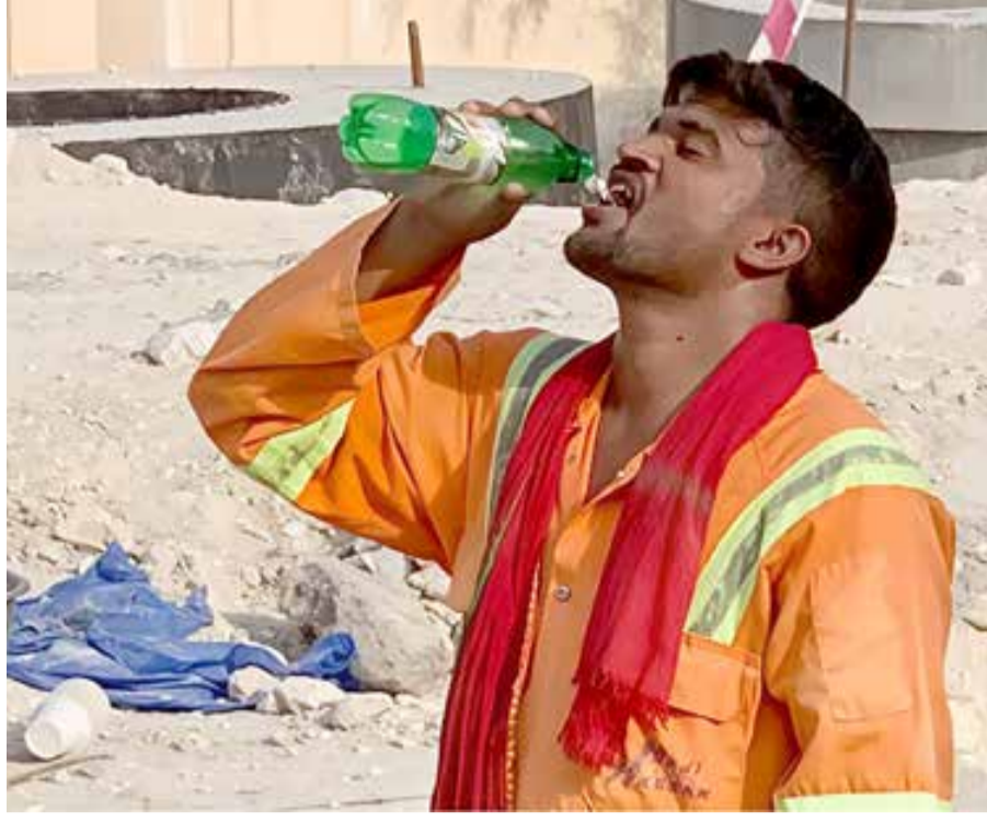
لحظة انتعاش بشرية هنيئة