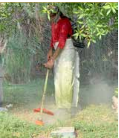
جز العشب وتنسيق المسطح الأخضر

وعلى الرغم من ارتفاع درجات الحرارة والرطوبة، يبدأ العمال يومهم منذ ساعات الفجر الأولى، مستفيدين من الساعات المسموح بها للعمل قبل دخول وقت الحظر ظهرًا، والممتد من الساعة 12 ظهرًا وحتى 4 عصرًا، تنفيذاً لقرار وزارة العمل الذي يُطبق سنويًا في فصل الصيف حرصًا على صحة وسلامة العاملين في المهن الشاقة والمعرضة