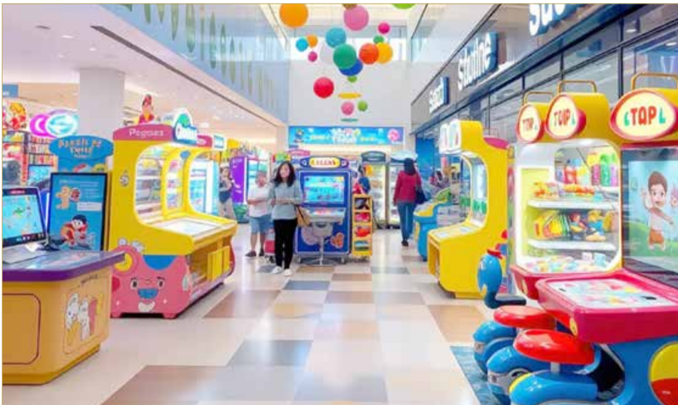
صورة تعبيرية مولدة بالذكاء الاصطناعي

المستهلك. كما يبدو أن هناك اتفاقاً ضمناً بين المحلات لتخصيص يوم واحد في الأسبوع لتقديم عروض وخصومات، وهو ما يحاول من خلاله أولياء الأمور الاستفادة من تلك التخفيضات لتخفيف الأعباء المالية، مع العلم أن هذه العروض لا تُغيّر جوهرياً من ارتفاع الأسعار. وبالنظر إلى تكلفة لعبة إلكترونية واحدة بسيطة داخل المجمعات التجارية، فإن سعرها بين 700 فلس إلى 3 دنانير، أما بالنسبة لألعاب "الترامبولين" والأنشطة الأخرى مثل التسلق والقفز واللعب بالرمل والمدن المصغرة للمهن والوظائف، فإن الأسعار فيها تبدأ من دينارين وتصل إلى أكثر من 10 دنانير لبعض الألعاب للطفل الواحد، وهو ما يجعل زيارة طفل واحد لمحلات الألعاب في المجمع تكلف في المتوسط حوالي 5 إلى 7 دنانير. بالمقابل، في المحلات المفتوحة أو المنتشرة على السواحل، تتراوح تكلفة الألعاب بين 300 فلس إلى دينار ونصف للعبة الواحدة، ما يجعل تكلفة اللعب للطفل الواحد أقل بكثير مقارنة بالمجمعات، لكنها تأتي مع مخاوف بشأن معايير السلامة.