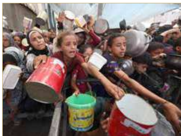
غزة بين رماد الحرب وملاحم الهدنة

وفي القاهرة، يواصل الوسطاء المصريون والقطريون اتصالات مكثفة، فيما أكد وزير الخارجية المصري بدر عبدالعاطي رفض بلاده أي محاولات لتجهيز الفلسطينيين، مشيراً إلى أن مصر قادرة على إدخال كميات ضخمة من المساعدات متى ما أزال إسرائيل القيود. من جانبه، أعلن رئيس الوزراء الفلسطيني محمد مصطفى، من أمام معبر رفح، تشكيل لجنة مؤقتة لإدارة غزة قريباً.