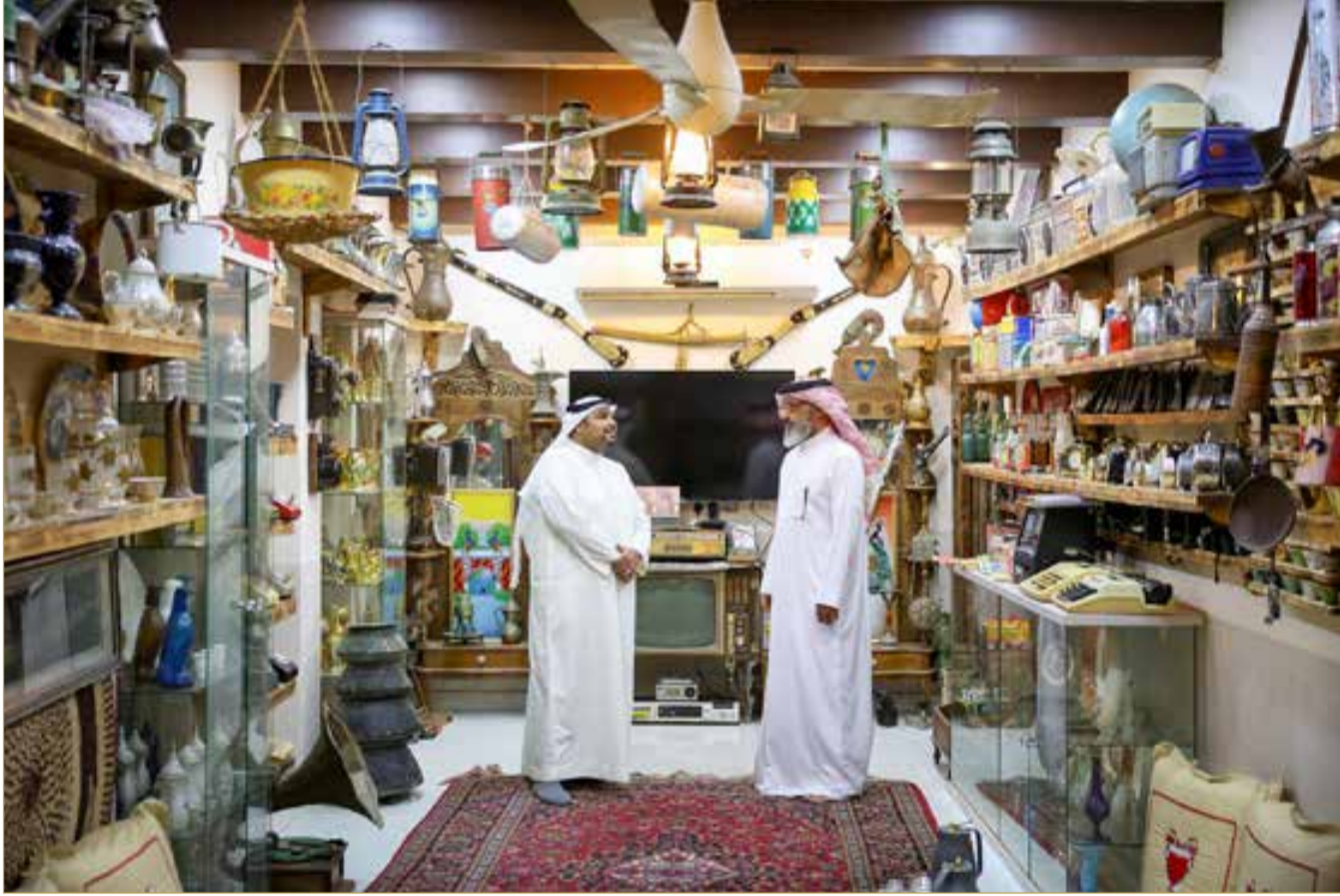
"البلاد" في متحف الزمن الجميل

البلاد | حسن عبدالرسول | تصوير: سيد علي حسن