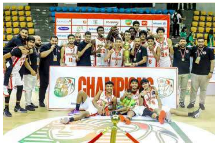
جانب من تتويج منتخبنا الوطني للناشئين بلقب البطولة العربية

اللاعب البحريني المخلص، ونجحوا في رفع راية المملكة في محفل عربي كبير، لافتاً إلى أن هذا اللقب سيمثل حافزاً إضافياً لمضاعفة الجهود في تطوير الفئات العمرية وصناعة مزيد من الأبطال في المستقبل، لا سيما في البطولة الآسيوية القادمة التي ستقام في مغوليا خلال شهر سبتمبر المقبل. وأكد عبدالصمد أن الهدف التالي أصبح بلوغ نهائيات كأس العالم لكرة السلة للناشئين عقب التتويج بالبطولتين الخليجية والعربية على التوالي، مؤكداً أن الاتحاد البحريني لكرة السلة يضع كافة إمكانياته لدعم المنتخب في مشاركته الآسيوية وحلم الوصول لكأس العالم.