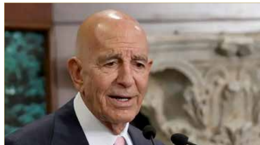
الموفد الأميركي توم براك

وقالات أكد المبعوث الأميركي إلى لبنان، توماس باراك، الاثنين، سعي واشنطن لتنفيذ بنود اتفاق وقف إطلاق النار بين لبنان وإسرائيل، وليس إبرام اتفاق جديد، مشيراً إلى أن بيروت قامت بدورها في الاتفاق، وأنه سيطالب إسرائيل بالوفاء بالتزاماتها وتنفيذ مبدأ "خطوة مقابل خطوة". وأوضح المبعوث الأميركي، أن الخطوة التالية لتنفيذ وقف إطلاق النار، ستكون "وضع خطة اقتصادية لازدهار والتعافي وإعادة إعمار لبنان في جميع مناطقه المتضررة من الحرب، وليس بالضرورة الجنوب فقط". وشدد باراك، خلال مؤتمر صحفي، عقب اجتماعه بالرئيس اللبناني، جوزاف عون، في بيروت، على أن نزع سلاح "حزب الله"، هو قرار لبناني لم تتدخل واشنطن في إقراره، مؤكداً أنه "يصب في صالح الطائفة الشيعية وليس ضدهم". وأضاف: "الشبيعة هم لبنانيون ونحن نتحدث عن قرار لبناني يتطلب تعاوناً من إسرائيل، لأن الأساس هو منفعة لبنان وجنوبه". وبشأن رفض "حزب الله" لتسليم السلاح وحصره بيد الدولة، اعتبر المبعوث الأميركي، أن الجماعة "تفتق الفرصة"، لافتاً إلى أن "العملية تبدأ بنقاش" ويجب أن يبحث "حزب الله" خياراته المتاحة،