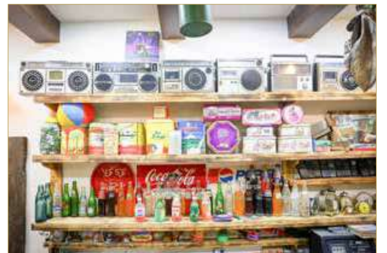
مسجلات وزجاجات المشروبات الغازية القديمة