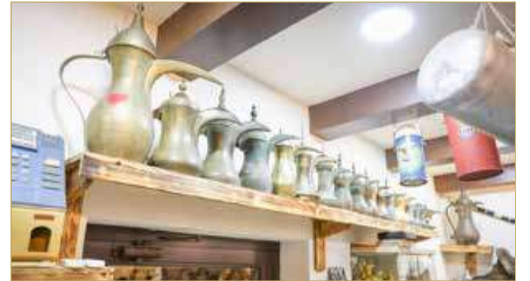
دلال القهوة التي تعود لأزمان مختلفة