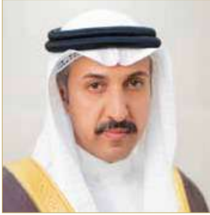
وزير المواصلات والاتصالات

وأفاد أن مركز الملك حمد العالمي للتعايش والتسامح يواصل تقديم إسهامات نوعية في مسارات ومجالات إنسانية عديدة من خلال مواصلة تعزيز التعليم والتدريب، والاستمرار في الاستثمار ببناء القدرات، كما يستلهم من الرؤية الملكية السامية أن العمل الإنساني واجب نلتزم به، وقيمة نؤمن بها، وقاسم مشترك يجمعنا سوياً، لنقدم أملاً جديداً وأثراً عميقاً في مسيرتنا البناءة نحو عالم يسوده التعاون والوفاق.