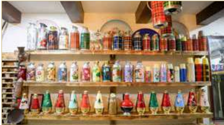
دلال نادرة قديمة