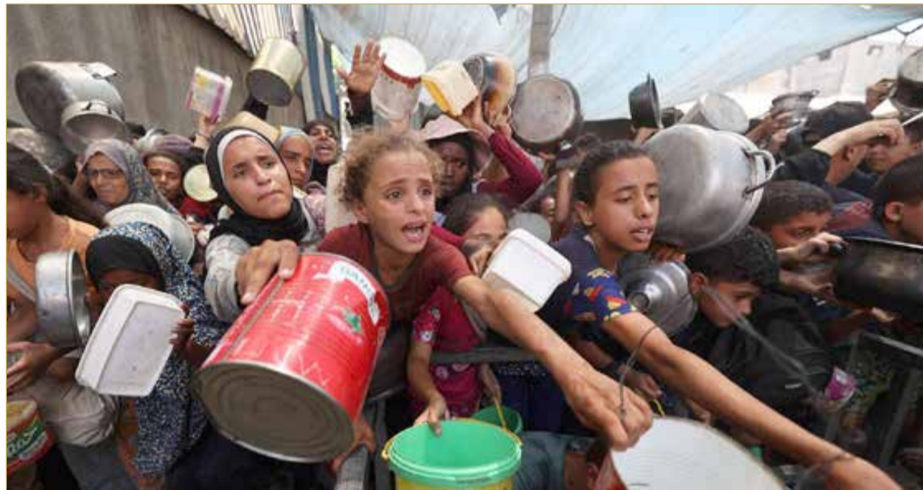
غزة بين رماد الحرب وملامح الهدنة

مخططات تهجير الفلسطينيين. وأضاف "يجب وقف الحرب الإسرائيلية على قطاع غزة فوراً". ورأى مصطفى أن "معبر رفح يجب أن يكون بوابة لحياة الشعب الفلسطيني، ونرفض استمرار إسرائيل في منع دخول شاحنات المساعدات لغزة". كما طالب بتكثيف الجهود الدولية في ملف إدخال المساعدات قائلاً: "نحتاج إلى تحرك دولي أكثر فاعلية وضغط على إسرائيل لإدخال المساعدات لغزة". وأخيراً أضاف رئيس الوزراء الفلسطيني: "نواصل العمل مع مصر لإقامة مؤتمر إعادة إعمار غزة في القاهرة". من جانبه، لفت وزير الخارجية المصري إلى أهمية دور السلطة الفلسطينية داخل قطاع غزة، قائلاً: "يجب تمكين السلطة الفلسطينية من أداء دورها في القطاع". وحول مخططات تهجير الفلسطينيين، قال عبد العاطي: "نرفض رفضاً قاطعاً أي محاولات لتهجير الفلسطينيين من أرضهم"، مضيفاً: "نرفض التصريحات الإسرائيلية حول ما يسمى إسرائيل الكبرى"، والتي وصفها بـ "الأوهام الإسرائيلية". وقال إن "مصر تستطيع إغراق قطاع غزة بالمساعدات الغذائية والطبية اللازمة، مع توفير كل ما يحتاج إليه أهالي القطاع، بشرط إزالة إسرائيل للعقبات التي تفرزها على الجانب الفلسطيني من معبر رفح وغيرها من المعابر". وفي سياق متصل، أكد أن مصر تواصل جهودها في مفاوضات وقف إطلاق النار بغزة، وأن وفوداً فلسطينية وقطرية موجودة في مصر لهذا الغرض.