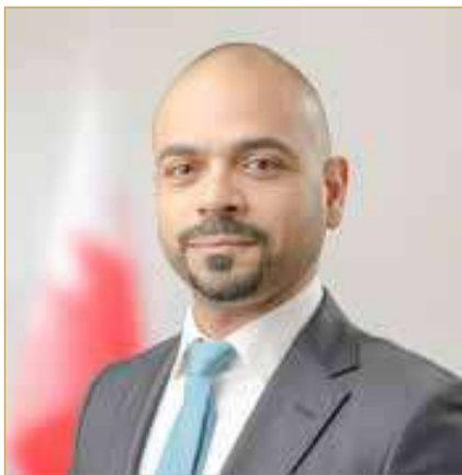
وزير التنمية الاجتماعية

ونوه وزير التنمية الاجتماعية إلى أن الوزارة تتبنى استراتيجية شاملة تركز على ترسيخ مبدأ الشراكة المجتمعية، وتشجيع الابتكار في المبادرات الإنسانية، إلى جانب توظيف الموارد بكفاءة لضمان استدامة الأثر الإيجابي، فضلاً عن مواصلة تطوير الأطر القانونية والتنظيمية التي تكفل الحوكمة والشفافية في العمل الأهلي، بما يواكب أفضل الممارسات العالمية ويتماشى مع الأهداف التنموية.