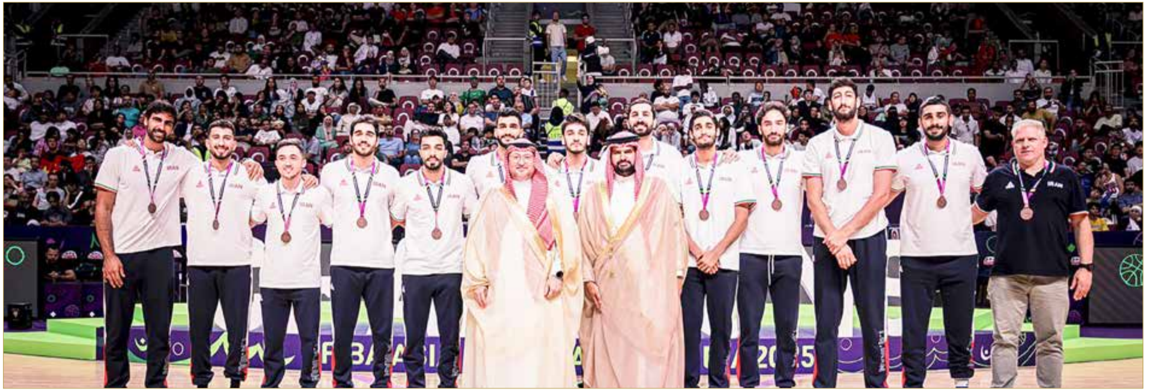
سمو الشيخ عيسى بن علي خلال حضوره المباراة النهائية لكأس آسيا لكرة السلة

سموه ثمن الجهود الكبيرة التي بذلتها المملكة العربية السعودية في استضافة وتنظيم البطولة