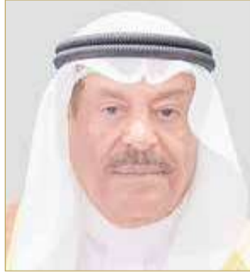
رئيس مجلس الشورى

وأشار الصالح بما قدمته المملكة من نموذج متميز في المبادرات الإنسانية والمساعدات الطبية والإغاثية، لا سيما إلى قطاع غزة، تنفيذاً للتوجيهات الملكية السامية. وأوضح أن هذه الإنجازات تعزز مكانة البحرين الإقليمية والدولية كنموذج يحتذى به في العمل الإنساني والخيري، مشيداً بما تقوم به الحكومة الموقرة، برئاسة ولي العهد رئيس مجلس الوزراء صاحب السمو الملكي الأمير سلمان بن حمد آل خليفة، من جهود وطنية متميزة في تعزيز مسيرة العمل الإنساني والخيري، من خلال البرامج والخطط المتميزة، والمبادرات الرائدة والسبّاقة التي تنفذها مملكة البحرين؛ لدعم الفئات المحتاجة داخل البحرين