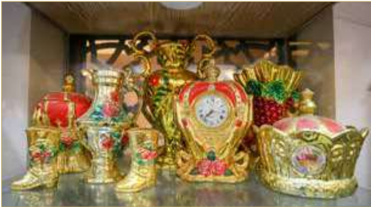
تحف ذهبية نادرة

كما خصص خالد غرفة متكاملة تُعرف بـ "غرفة العروس"، وتضم سريراً قديماً جداً، وصندوق