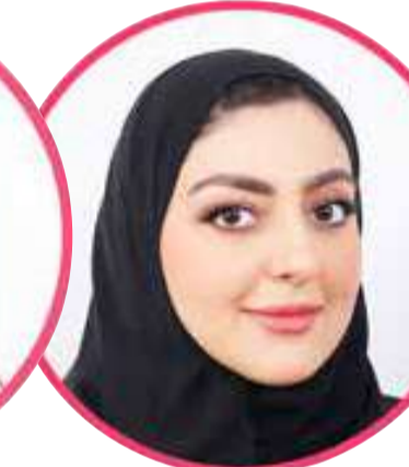
يقين مال الله