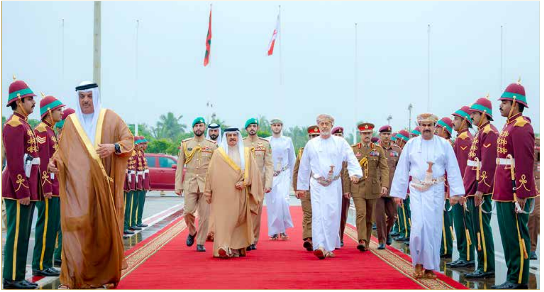
جلالة الملك المعظم يغادر مدينة صلالة بسلطنة عمان

بعث ملك البلاد المعظم صاحب الجلالة الملك حمد بن عيسى آل خليفة، برقية تهنئة إلى رئيسة جمهورية مولدوفا مايا ساندو؛ بمناسبة ذكرى استقلال بلادها. وأعرب جلالتة في البرقية عن أطيب تهانيه وتمنياته لفخامتها موفور الصحة والسعادة، ولشعب جمهورية مولدوفا والصدق مزيداً من التقدم والازدهار.