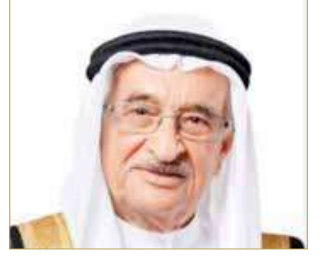
الشيخ محمد بن عبدالله