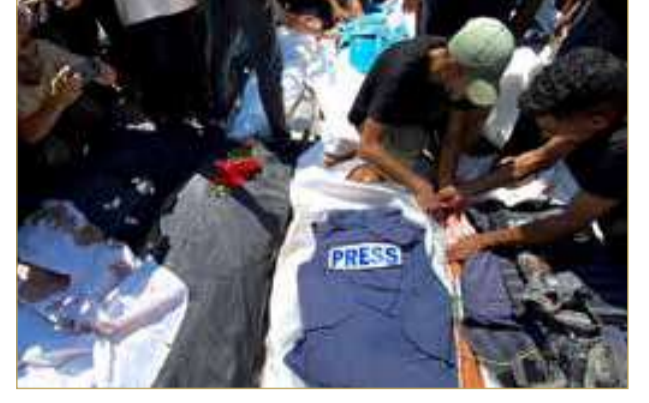
قتل 20 شخصا في الغارة على مجمع ناصر الطبي منهم صحفيون

وإذعى البيان أنه قتل 6 فلسطينيين ممن ينتمون لحركة “حماس”، في الهجوم، إلا أن المصادر أكدت لـ “الشرق الأوسط”، أن 3 على الأقل منهم قتلوا في أحداث مختلفة الأيام الماضية، بل إن أحدهم قُتل أمس الأول (الاثنين) في هجوم آخر لا علاقة له بمجمع ناصر.