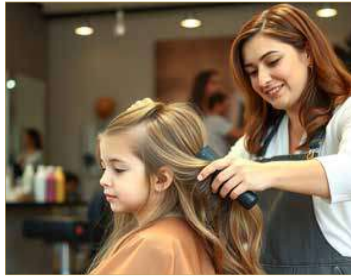
صورة تعبيرية مولدة بالذكاء الاصطناعي

مع اقتراب موسم العودة للمدارس، لا يقتصر الانتعاش التجاري على المكتبات ومحلات القرطاسية والملابس المدرسية فحسب، بل يمتد ليشمل قطاع الصالونات النسائية الذي يشهد حركة متزايدة مع استعداد الأمهات والمعلمات والطالبات لبداية عام دراسي جديد.