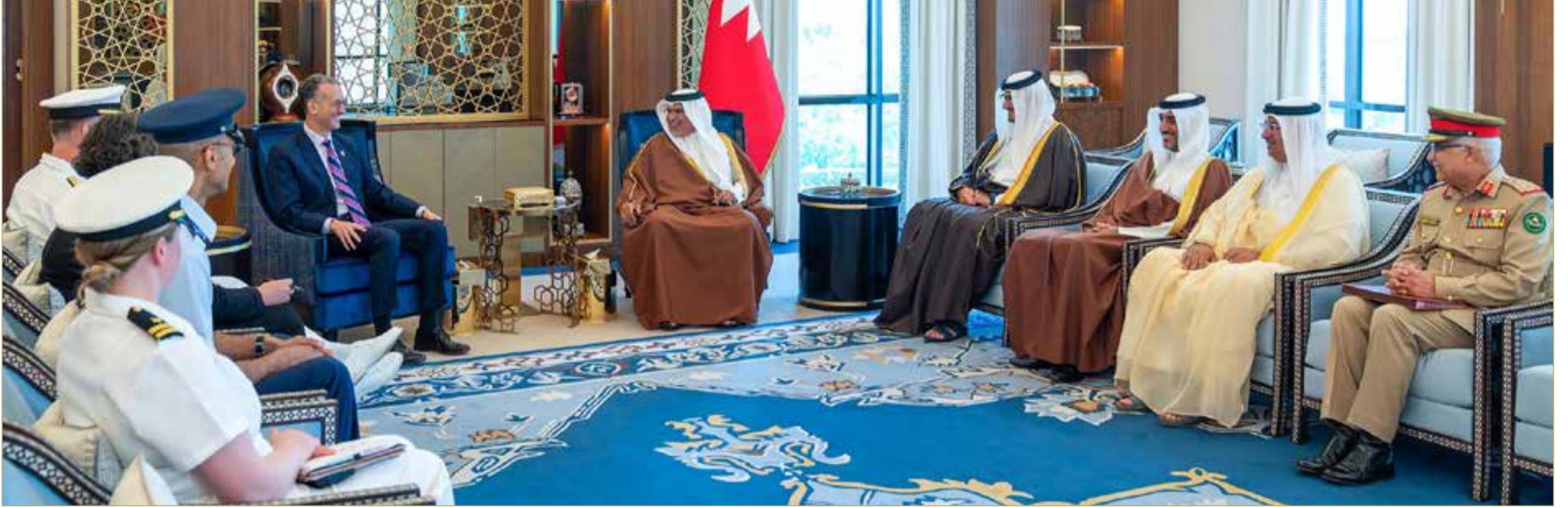
نائب جلالة الملك ولي العهد مستقبلاً السفير الأميركي وقائد القوات البحرية بالقيادة المركزية الأميركية قائد الأسطول الخامس