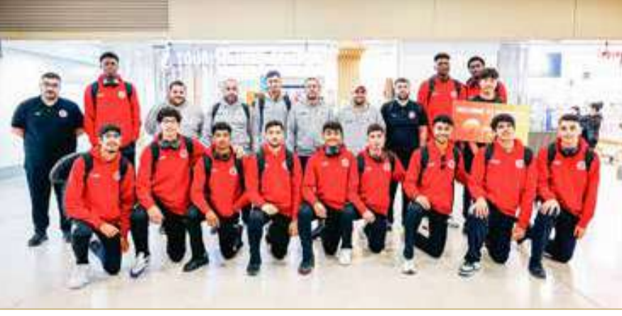
منتخبنا الوطني لكرة السلة للناشئين

تدريبين صباحية ومسائية أيضًا، فيما سيخوض منتخبنا يوم الخميس الموافق 28 أغسطس مباراة ودية أمام منتخب منغوليا، على أن يواصل تحضيراته في اليومين التاليين (29 و30 أغسطس) قبل انطلاق المنافسات القارية. ويستهل منتخبنا مشواره في البطولة وبواجهة قوية أمام حامل اللقب منتخب