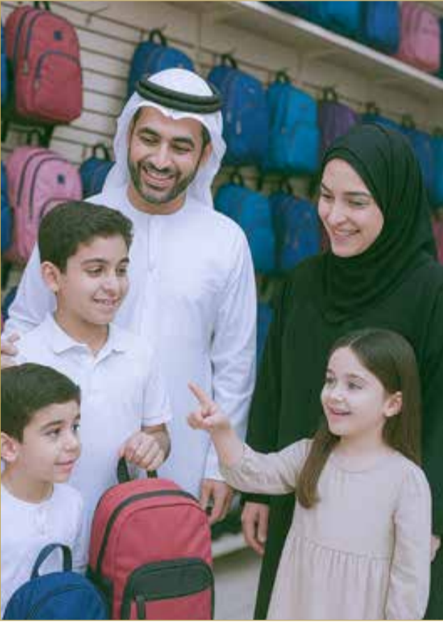
صورة مولدة باستخدام الذكاء الاصطناعي