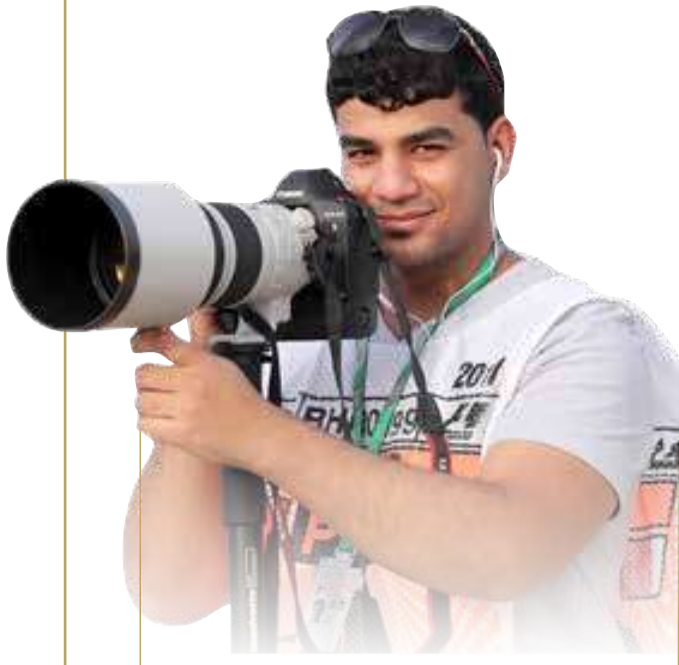
البلاد تصوير: أيمن يعقوب