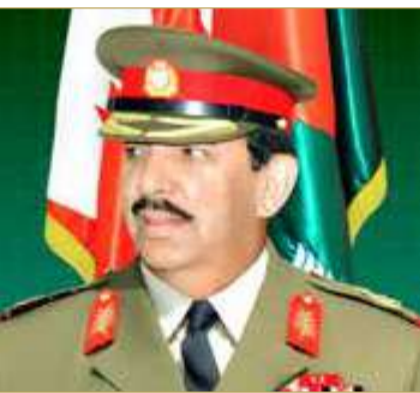
القائد العام لقوة دفاع البحرين

الوزراء صاحب السمو الملكي الأمير سلمان بن حمد آل خليفة، تستمر قوة دفاع البحرين في عملية التطوير والتحديث لجميع أسلحتها ووحداتها، وذلك عبر تزويدها بالمنظومات العسكرية المتقدمة، ومدتها بالمعدات القتالية المتطورة، وتعزيزها بالإمكانات التدريبية والإدارية الحديثة، وذلك حفاظاً على استدامة المستوى العالي للجهوزية القتالية والإدارية، التي دائما تحقّقها أسلحة ووحدات قوة دفاع البحرين بفضل جهود وعطاء وإنجاز رجالها المخلصين.