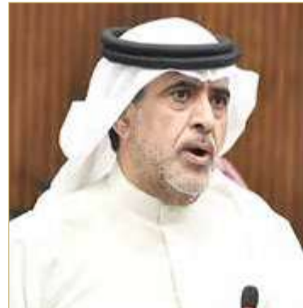
النائب خالد بو عنق

وأشاد النائب بما ورد في المقال، مؤكداً أنه يعكس واقعا مؤلماً يعاني منه العديد من الأسر البحرينية، ويستحق الوقوف أمامه بمسؤولية تشريعية وإنسانية، لما له من أثر بالغ على استقرار الأسرة البحرينية وسلامة الأطفال النفسية والاجتماعية. وفي هذا السياق، قال النائب بو عنق أنه سينتقد بمقتضى بقانون جديد إلى مجلس النواب، يهدف إلى تجريم تحريض الأطفال على رفض زيارة