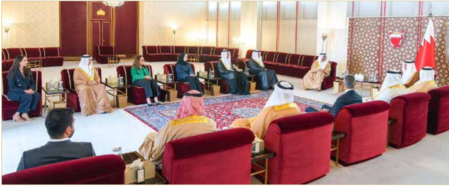
نائب جلالة الملك ولي العهد يستقبل رئيس مجلس إدارة شركة بورصة البحرين وأعضاء مجلس الإدارة الجديد