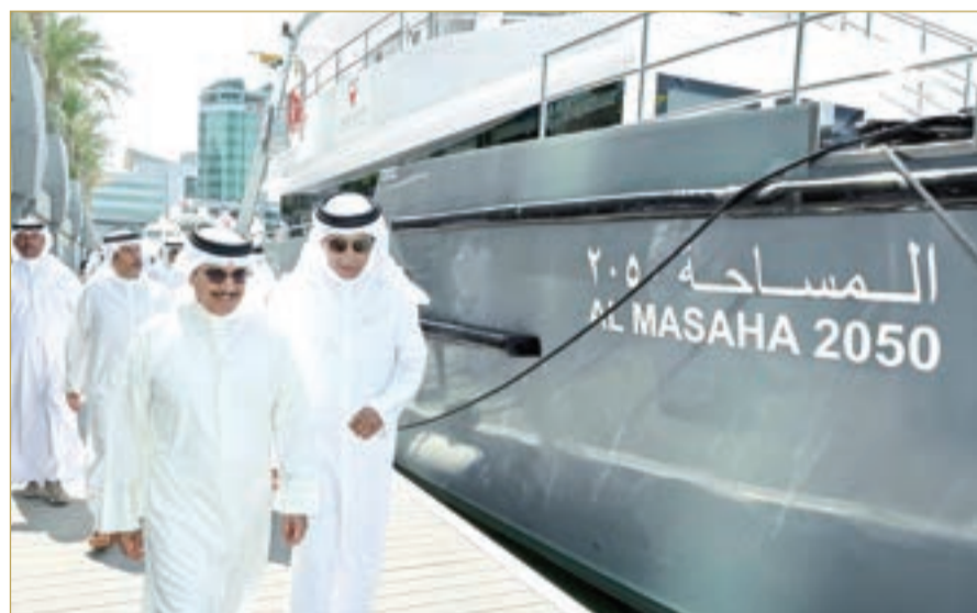
وزير الداخلية يدشن سفينة الأبحاث المتقدمة "المساحة 2050"

وأشار إلى أن تدشين سفينة الأبحاث أحدث الأنظمة والتقنيات الحديثة "المساحة 2050" يأتي في إطار استخدام المدعومة بالذكاء الاصطناعي.