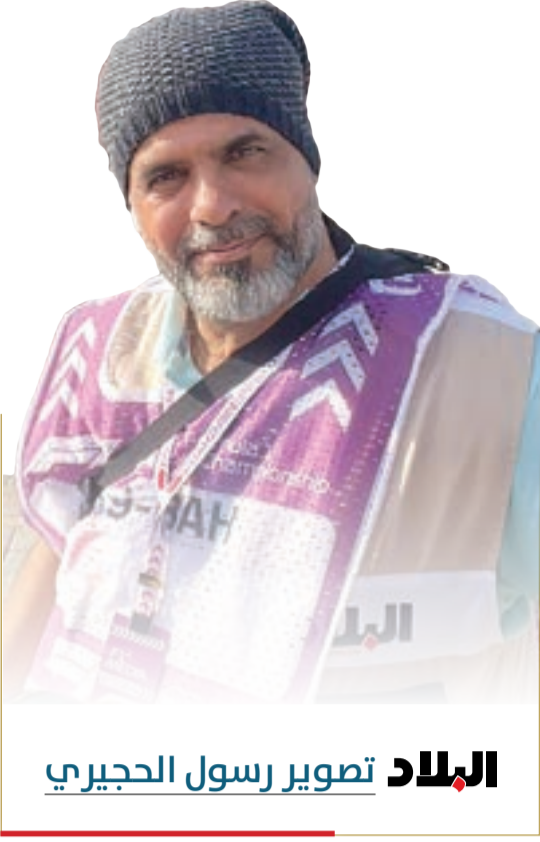
البلاد تصوير رسول الحجيري