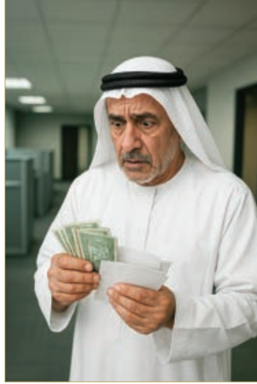
صورة تعبيرية مولدة بالذكاء الاصطناعي

توريد العمال)، ما يدل على وقوع استخدام غير مشروع لأموال المركز، مع تلاعب واضح بهدف تحقيق منافع شخصية خارج الإطار القانوني والمالي السليم. وكانت النيابة العامة قد اتهمت المتهم الأول بأنه أثناء شغله وظيفته عامة قام بالاستيلاء بغير حق على 192 ألفاً و351 ديناراً و242 فلساً مملوكة لوزارة التنمية الاجتماعية، عبر إصدار شيكات باسم أشخاص حسني النية ثم الاستيلاء على المبالغ لنفسه، كما اختلس التبرعات النقدية والعينية التي جمعها المركز، واستخدمها لمصلحته الشخصية، وارتكب جريمة غسل أموال بإضفاء طابع الشرعية على جزء من المبالغ لعرقلة وصول السلطات إلى الحقيقة. فضلاً عن قيامه بالاشتراك بطريقتي الاتفاق والمساعدة مع المتهم الثاني (مالك شركة توريد العمال) في ارتكاب تزوير في محررات خاصة، وهي عقود توريد عمال النظافة وإيصالات الاستلام الصادرة من الشركة، إذ تم تحريف الحقيقة فيها.