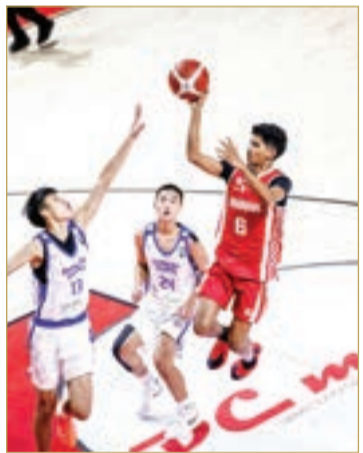
من لقاء منتخبنا أمام تايبيه

احتتم منتخبنا الوطني لكرة السلة للناشئين مشاركته في بطولة كأس آسيا 2025 بالعاصمة المنغولية أولان باتور، محققاً المركز الثامن على مستوى القارة، وذلك بعد خسارته أمام منتخب الصين تايبيه بنتيجة 103-105 في المباراة التي أقيمت أمس (الأحد) على صالة ”إم بانك أرينا“ ضمن لقاءات تحديد المراكز. وقدم الأحمر الناشئين خلال مشواره في البطولة عروضاً مميزة أثبتت من خلالها حضوره القوي، وتمكن من بلوغ دور الثمانية كأحد أفضل المنتخبات الآسيوية، ليضع اسمه بين كبار القارة من بين 44 منتخباً مشاركاً، ويُنْهَى غياباً استمر 12 عاماً عن ربع النهائي منذ نسخة 2013. وسجل منتخبنا، بطل الخليج والعرب، 3 انتصارات مقابل 4 هزائم، إلا أنه كان نداءً قوياً لمنافسيه ونجح في فرض أسلوبه على مباريات حاسمة، مؤكداً تطور كرة