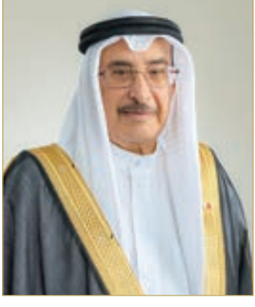
نائب رئيس مجلس الوزراء

المرفق به في الجريدة الرسمية، ويُعمل بها من اليوم التالي لتاريخ نشرهما.