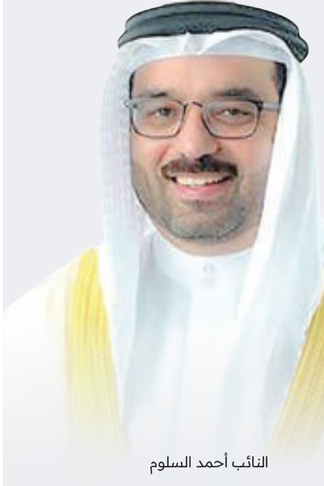
النائب أحمد السلوم

”انضمام لجنة الأمم المتحدة الاقتصادية والاجتماعية لغرب آسيا (الإسكوا) للجنة العليا يمثل إضافة نوعية كبيرة، فهذا يعزز من مصداقية الجائزة على المستوى الدولي، ويمنحها بعدا إقليميا يواكب أفضل الممارسات العالمية، كما يتيح الاستفادة من خبرات المنظمة في مجالات التنمية المستدامة، ويمكن من ربط مبادرات الشركات البحرينية بأهداف التنمية المستدامة للأمم المتحدة، وبذلك تتعزز مكانة البحرين كدولة رائدة في دعم العمل المؤسسي المسؤول في المنطقة“.