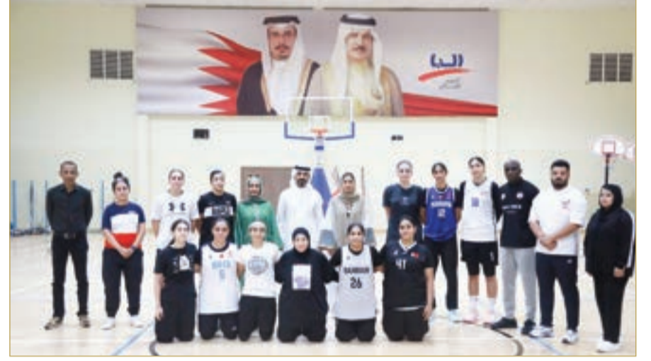
فريق الحالة للسيدات المشاركة في ”عربية السلة“