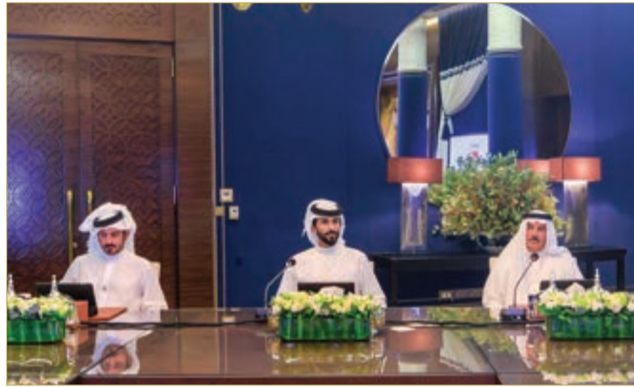
سمو الشيخ ناصر بن حمد يترأس اجتماع المجلس الأعلى للشباب والرياضة