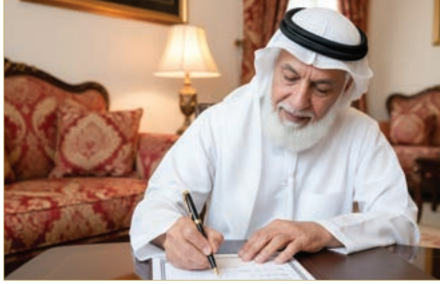
صورة مولدة بالذكاء الاصطناعي

في إطار حرص مملكة البحرين على تنظيم الحياة الأسرية وضمان الحقوق الشرعية للمواطنين، كشفت وزارة العدل والشؤون الإسلامية والأوقاف عن وجود نحو 168 مآذونا شرعيا مرخصا في المملكة، موزعين بين الطائفتين السنية والجعفرية. وبحسب القوائم الرسمية المنشورة على موقع الوزارة، فإن عدد المآذونين الشرعيين من الطائفة السنية يبلغ نحو 59 مآذونا، في حين يبلغ عدد المآذونين من الطائفة الجعفرية نحو 109 مآذونين. وتغطي هذه الكوادر الشرعية مختلف مناطق المملكة، بما يضمن سهولة الوصول إليهم من قبل المواطنين والمقيمين على حد سواء. ويُعد المآذون الشرعي ركيزة أساسية في توثيق عقود الزواج الشرعي، حيث يقوم بدور الوسيط القانوني والديني الذي يضمن توافق الأطراف واحترام الضوابط الشرعية. كما تساهم هذه الكوادر في تعزيز الاستقرار الأسري من خلال تقديم النصح والإرشاد قبل إتمام الزواج.