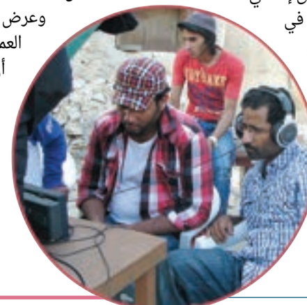
مع المخرج علي العلي في موقع تصوير شوية أمل

يتقن قيادة النص نحو عمق إنساني، ويتمتع بدقة صارمة في اختيار أي عمل يقدم عليه. كل لقطة لديه لها مواصفات خاصة تترتب عليها بنية المشهد، ويمتلك أسلوباً عجبياً يثير فضول المتلقي، أو يولد التعاطف مع الشخصيات، أو يعقق