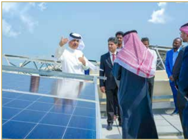
تركيب أنظمة الطاقة الشمسية في محطة مدينة خليفة لتوزيع المياه

عالمياً، تتصدر الصين قائمة الدول المستثمرة بحصة بلغت 44% من الإجمالي العالمي، تليها أوروبا بنسبة 21% والولايات المتحدة بنسبة 15%. كما تواصل الصين السيطرة على سلاسل القيمة الصناعية من تصنيع الألواح الشمسية والبطاريات، بينما تتقدم ألمانيا وإسبانيا في مجال توربينات الرياح، وتدفق الولايات المتحدة بقوة نحو مشروعات الهيدروجين الأخضر والتخزين. بذلك تبرز مشروعات المملكة في الطاقة المتجددة جزءاً من توجه عالمي متسارع يعيد رسم ملامح الاقتصاد، حيث لم تعد الطاقة المتجددة خياراً ثانوياً، بل ركيزة أساسية للتنمية، ورافعة للتنافسية، وضمانة لمستقبل أكثر استدامة.