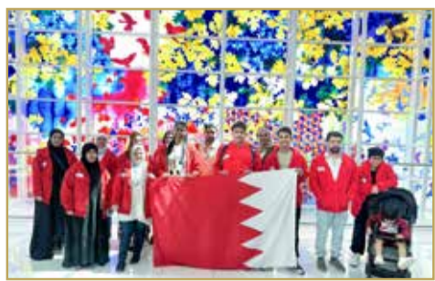
فريق ذوي الهمم (مايكرو آرآرت)

وبالنسبة للجنة التحكيم، فقد أشادت بالمستوى الفني للوفد البحريني، مؤكدة أن مشاركتهم هذا العام تفوّقت حتى على الأعوام السابقة، ما منح البحرين حضوراً مشرفاً بين 53 دولة، كما حرص الفريق البحريني على حضور ورش عمل وندوات، عززت خبراتهم الفنية وفتحت أمامهم آفاقاً جديدة للتبادل الثقافي والإبداعي، وهو حدث برهنت فيه البحرين على أن ذوي الهمم ليسوا متلقين للدعم فقط، بل صنّاع إنجازات قادرين على منافسة العالم، وأن الاستثمار في قدراتهم الفنية والمعرفية هو استثمار في قوة الوطن ورسالته الإنسانية.