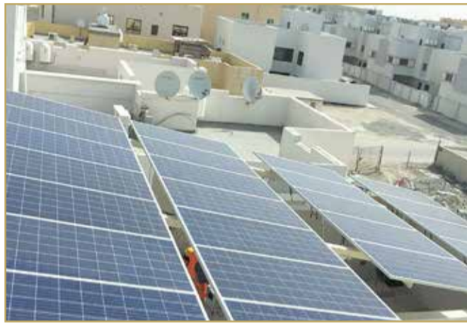
أحد نماذج المنزل المنتج للطاقة الشمسية

المبادرات البحرينية تأتي في إطار التزامات وطنية بيئية واضحة، إذ أعلنت المملكة في أكتوبر 2021 التزامها بالوصول إلى الحياد الكربوني بحلول 2060، مع هدف مرحلي بخفض الانبعاثات 30% بحلول 2035. وعلى المستوى الاقتصادي، تسهم هذه المشروعات في خلق فرص عمل جديدة وتنويع مصادر الدخل الوطني، فضلاً عن تخفيف الضغط على الشبكة الكهربائية في ذروة الصيف. ولا يمكن قراءة التجربة البحرينية بمعزل عن السياق الخليجي، فالسعودية أعلنت هي الأخرى هدف الحياد الكربوني في 2060، بينما حددت الإمارات 2050 موعداً لذلك، وأطلقت جميع دول مجلس التعاون مشروعات للطاقة النظيفة. هذا التوجه المشترك يعزز موقع البحرين ضمن شبكة خليجية أوسع، مع اهتمام خاص بزيادة