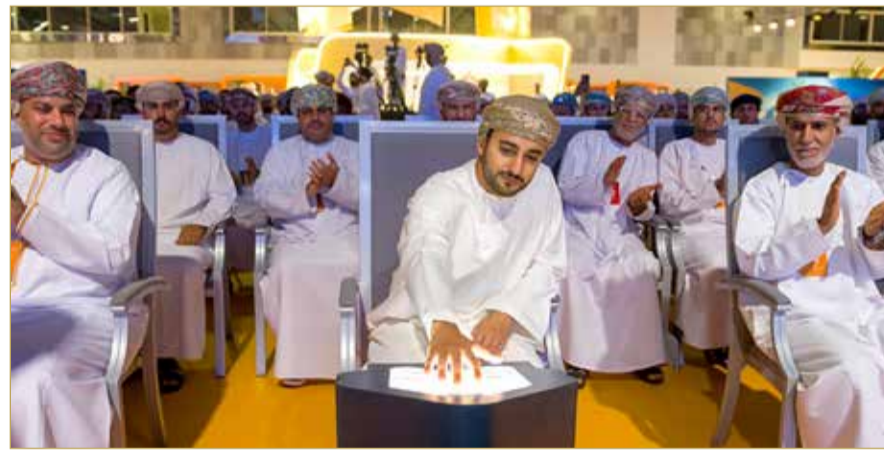
رعى صاحب السمو السيد ذي يزن بن هيثم آل سعيد وزير الثقافة والرياضة والشباب الملتقى في العام الماضي

ولفت إلى أن الملتقى يسهم في دعم مستهدفات رؤية عمان 2040، خصوصاً في محاور الشراكة