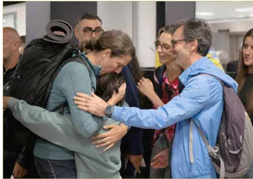
عضو البرلمان الأوروبي أناليزا كورادو تعود لإيطاليا بعد مشاركتها في أسطول الصمود العالمي