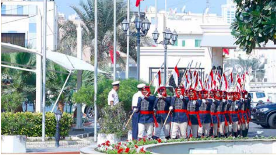
صورة أرشيفية من حرم المجلسين في يوم انعقاد الجلسة الإجرائية الأولى

« توافق على التجديد للسلوم في "المالية" وبوعنق في "المرافق" »