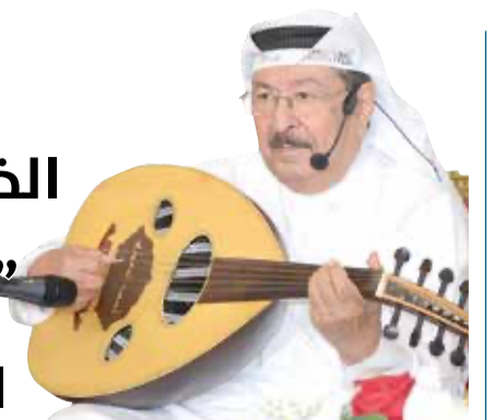
الفنان أحمد الجبري