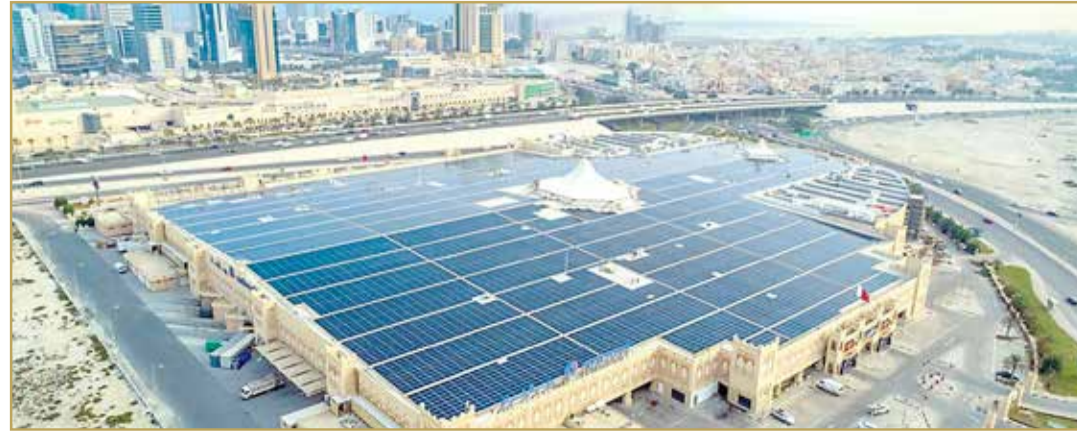
أحد مشروعات الطاقة الشمسية على الأسطح

«تربليونا دولار حجم الاستثمار العالمي في الطاقة المتجددة في 2024