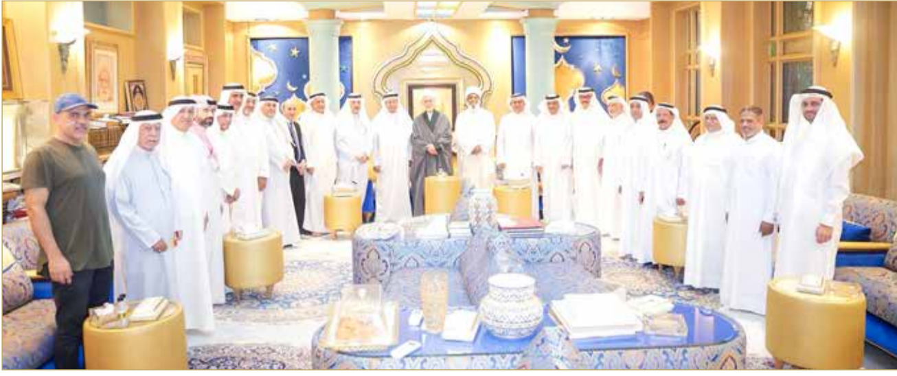
لقطة تذكارية من اللقاء