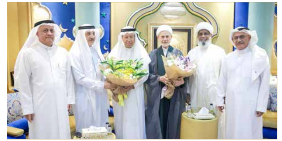
تقديم باقات الزهور