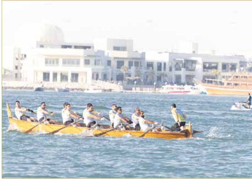
جانب من سباق الأسبوع الماضي

ويُقام موسم ناصر بن حمد لرياضات الموروث البحري بتنظيم من اللجنة البحرينية لرياضات الموروث الشعبي، بهدف إحياء الموروث البحري الذي اشتهرت به البحرين منذ القدم وجعل منها مركزًا إقليميًا هامًا في صيد اللؤلؤ. وتتضمن فعاليات هذه النسخة مسابقات متنوعة أبرزها مسابقة السباحة في المياه المفتوحة (سباح الموروث) لفئات عمرية مختلفة، ومسابقة الهير (استخراج المحار) التي تضم أشواطًا تحمل أسماء سمو الشيخ ناصر بن حمد آل خليفة، وسمو الشيخ خالد بن حمد آل خليفة، بالإضافة إلى مسابقة صيد الأسماك (الحداق) وسباقات التجديف الشعبي الشهيرة، إلى جانب مسابقة كتم النفس التي تستعرض مهارات الغوص التقليدي، ومسابقة النهام الجديدة هذا العام، والتي تشهد دعوة مفتوحة للمشاركين من دول الخليج لإبراز فن الصوت البحري الأصيل، وتقام داخل استوديوهات وزارة الإعلام.