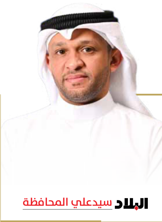
البلاد سيدعلي المحافظة

في أغسطس 2025، أعلنت هيئة الكهرباء والماء، عن بدء العمل لإنشاء أول محطة لإنتاج الكهرباء باستخدام الطاقة الشمسية في مملكة البحرين، بقدرة إنتاجية تصل إلى نحو 150 ميغاواط، وذلك بالشراكة مع القطاع الخاص. هذا المشروع لم يكن حدثاً منفصلاً، بل جزءاً من مسار بدأ منذ 2017 عندما اعتمد مجلس الوزراء «الخطة الوطنية للعمل في الطاقة المتجددة»، بالتعاون مع برنامج الأمم المتحدة الإنمائي، محددًا أهدافاً أولية لتغطية 5% من الطلب على الكهرباء من مصادر متجددة بحلول 2025، ترتفع إلى 20% بحلول 2035، بما يقدر بنحو 710 ميغاوات. منذ ذلك الحين، فتحت لائحة «صافي القياس» التي أطلقتها هيئة الكهرباء والماء الباب أمام الأفراد والمؤسسات لت تركيب أنظمة شمسية وربطها بالشبكة الوطنية، فتحوّلت أسطح المنازل والمباني التجارية والصناعية إلى وحدات إنتاج صغيرة.