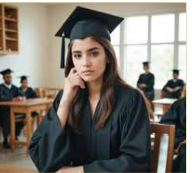
صورة تعبيرية مولدة بالذكاء الاصطناعي

وأوضحت أنها سجلت في نظام التعطل بوزارة العمل من أجل الحصول على إعانة مادية، إلا