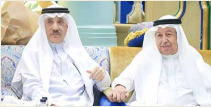
الشعلة وحميدان يتبادلان الحديث مع الحضور

البلاد | سعيد محمد سعيد | تصوير: عبدالرسول الجبري