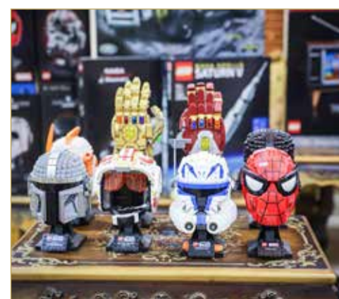
مجسمات من "الليغو"