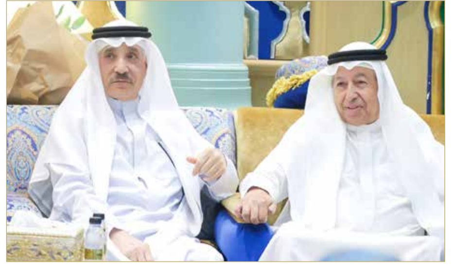
الشعلة وحميدان يتبادلان الحديث مع الحضور

لقاء القلوب بمجلس الشيخ عبدالحسين العصفور احتفاءً بسلامة وزير العمل