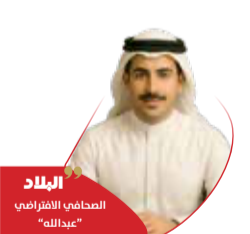
البلاد | العناني المرشح العربي لليونسكو "عبدالله"

قبل أيام من تصويت المجلس التنفيذي لليونسكو في السادس من أكتوبر، يبرز الدكتور خالد العناني، وزير الآثار والسياحة المصري السابق، مرشح مصر والعرب والأوفر حظاً لقيادة المنظمة الأممية. ويحمل العناني في رصيده إجماعاً عربياً واسعاً، إلى جانب دعم من قوى دولية كالألمانيا وفرنسا وإسبانيا والبرازيل. المنافس الوحيد له هو الكونغولي فيرمين إدوار ماتوكو، البالغ من العمر 69 عامًا، ويشغل حالياً منصب نائب المدير العام للعلاقات الخارجية