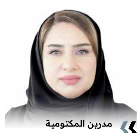
« مدرين المکتومية

” معاً نتقدم“ يفتح آفاقاً جديدة للتكامل بين القطاعين العام والخاص