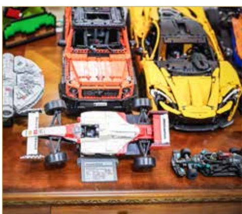
مجسمات سيارات من مكعبات "الليغو"