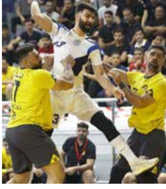
وفي مباريات أخرى أقيمت أمس أيضا، فاز فريق الاتحاد على الاتفاق (25/35)، وبذلك صار رصيد الاتحاد

كسب فريق النجمة مواجهة غريمه التقليدي الأهلي في ”ديربي“ كرة اليد البحرينية بنتيجة (25/26) في المباراة التي أقيمت بينهما مساء الجمعة ضمن الجولة السادسة من دوري خالد بن حمد وسط حضور جماهيري كبير. وأنهى النجمة الشوط الأول متأخرا (13/12)، وبذلك حقق النجمة فوزه السادس تواليا ورفع رصيده إلى (18 نقطة) في صدارة الترتيب، والأهلي تلقى الخسارة الثانية وصار رصيده (14 نقطة).