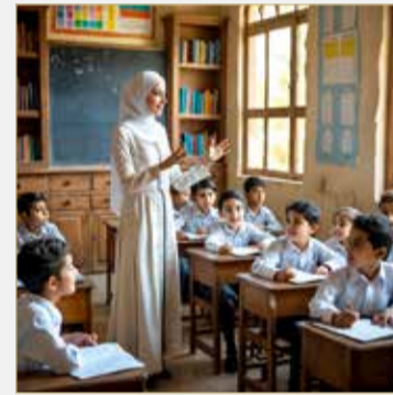
صورة تعبيرية مولدة بالذكاء الاصطناعي

وتابعت المعلمة بأنها برفقة مجموعة من المعلّمت الأخرى، فوجئت باستبعاد دفعة خريجات الدبلوم العالي من استحقاق الترقية، على الرغم من الجهود المبذولة طوال العام الدراسي، وعلى رغم تأكيد