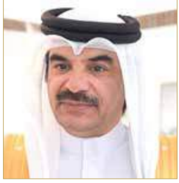
محمد إبراهيم السيسى البوعيين

وأضاف أن الأمانة العامة لمجلس النواب لديها حزمة من البرامج الخاصة بالذكاء الاصطناعي والتحول الرقمي دعماً للعمل البرلماني التشريعي والرقابي، واستكمالاً للمشاريع الإلكترونية النيابية، التي تم تقديمها خلال الفصل التشريعي السادس، وما حظيت به من إشادة وتقدير من الاتحاد البرلماني الدولي والمجالس التشريعية، وساهمت في دعم عمل المجلس ولجانه، في سبيل تحقيق المزيد من الإنجازات البرلمانية في ظل المسيرة التنموية الشاملة. (اقرأ الموضوع كاملاً بالموقع الإلكتروني)