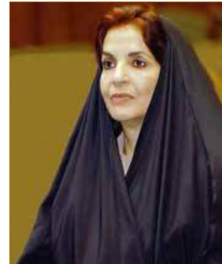
سمو قرينة عاهل البلاد المعظم رئيسة المجلس الأعلى للمرأة

وأكدت صاحبة السمو الملكي رئيسة المجلس الأعلى للمرأة في الوقت ذاته، استمرار عزم المجلس نحو تحقيق مزيد من الإنجازات في مسيرة البناء الوطني بالتعاون مع السلطة التشريعية، وتكثيف العمل المشترك لما فيه مصلحة المرأة البحرينية.