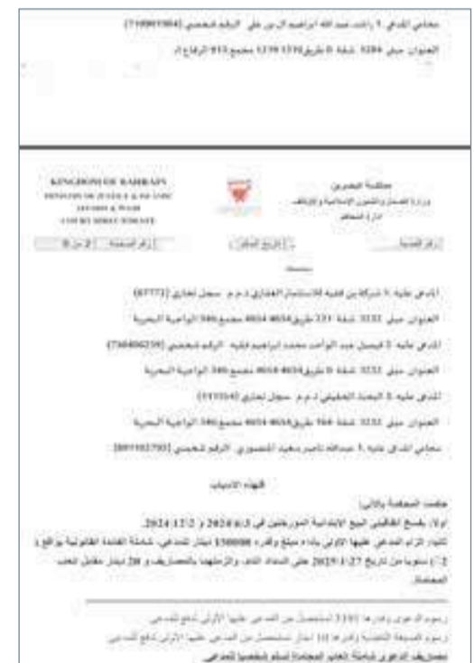
قضية مكتسية ضد بن فقيه العقارية