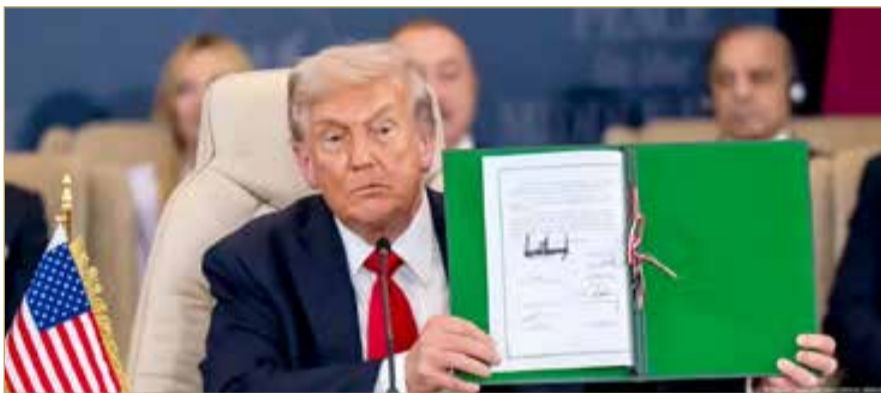
الرئيس الأميركي يعرض وثيقة اتفاق إنهاء حرب غزة بعد التوقيع عليها مع الوسطاء،

وتوقيع وثيقة شرم الشيخ، يدخل ملف غزة مرحلة جديدة تتضمن ترتيبات أمنية وإنسانية وسياسية متوازنة بضمانات دولية لاستدامة وقف النار، وتمويل ضخم لبدء الإعمار وتهيئة بيئة سلام تُعيد الأمل لشعب أهنكتته الحرب.