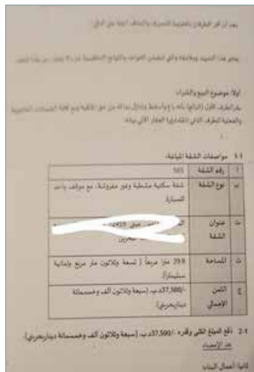
تفاصيل شقة البيستين