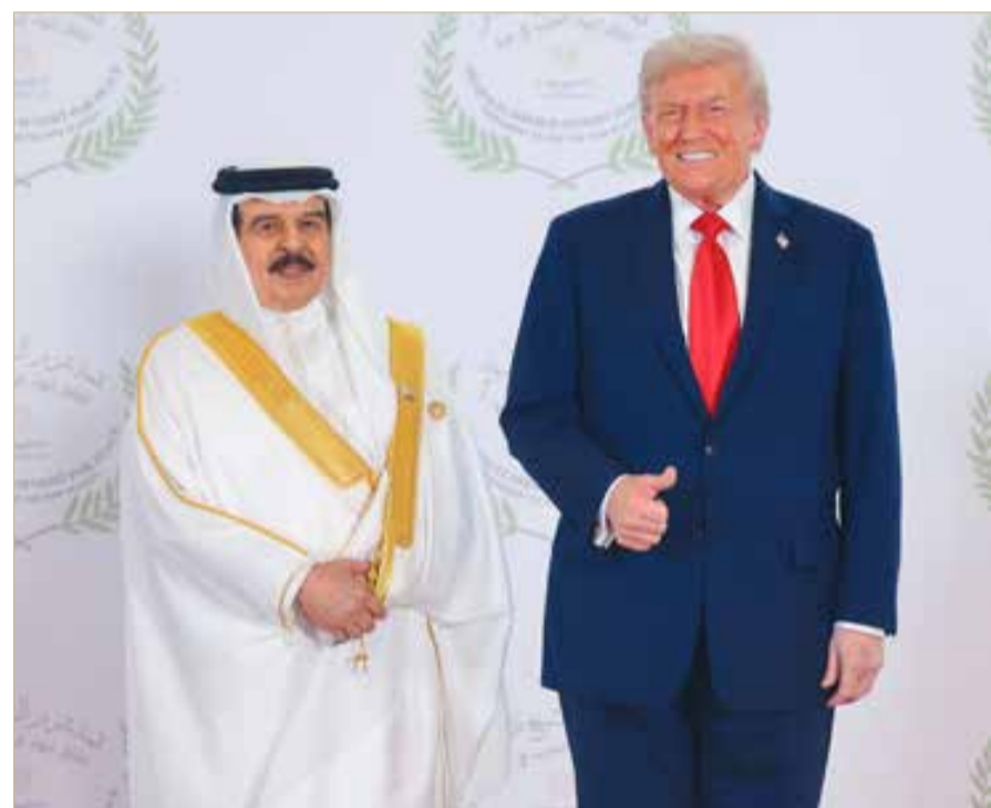
جلالة الملك المعظم يلتقي الرئيس الأمريكي

شارك ملك البلاد المعظم صاحب الجلالة الملك حمد بن عيسى آل خليفة، أمس، في قمة شرم الشيخ للسلام بمناسبة اتفاق إنهاء الحرب في غزة، وذلك بمشاركة قادة ورؤساء الدول الشقيقة والصديقة ورؤساء الحكومات، والتي عقدت في مدينة شرم الشيخ بجمهورية مصر العربية الشقيقة. ولدى وصول جلالة الملك المعظم إلى قاعة انعقاد القمة، كان في استقبال جلالته رئيس جمهورية مصر العربية الشقيقة عبدالفتاح السيسي، الذي رحب بجلالته، شاكرًا له تلبية الدعوة للمشاركة في هذه القمة. بعدها شهد صاحب الجلالة ملك البلاد المعظم، وقادة الدول المشاركة في القمة، توقيع الوثيقة الشاملة بشأن اتفاق غزة، والتي وقع عليها كل من رئيس