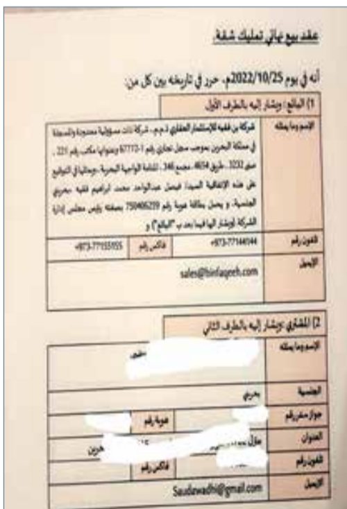
عقد بيع شركة البيستين للمستثمر