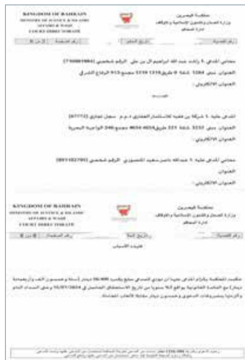
قضية مكتسية ضد بن فقيه العقارية