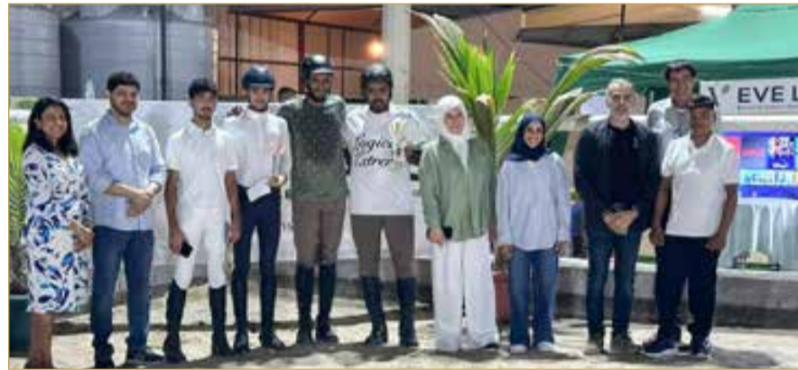
جانب من تتويج الفائزين

أسدل الستار مساء يوم الجمعة الماضي على منافسات المسابقة التدريبية الأولى لقفز الحواجز التي أقيمت برعاية مختبرات "Eve Labs"، وذلك بمركز الأمل للفروسية، إذ جمعت عدداً كبيراً من الفرسان والفارسات وشهدت حضوراً جماهيرياً مميزاً.