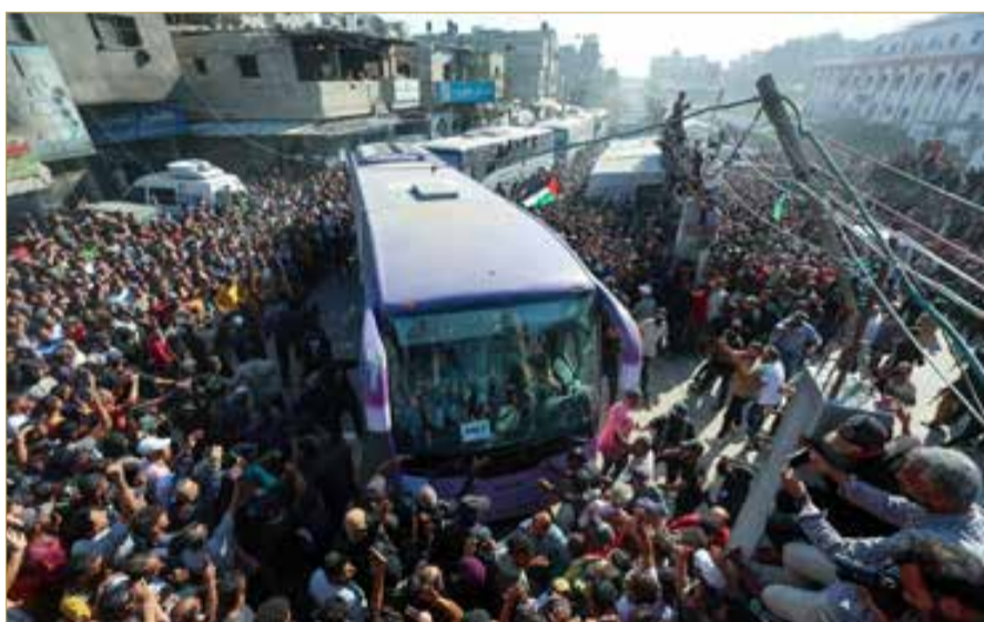
تجمع في مستشفى ناصر في خان يونس جنوب قطاع غزة للترحيب بالفلسطينيين المفرج عنهم