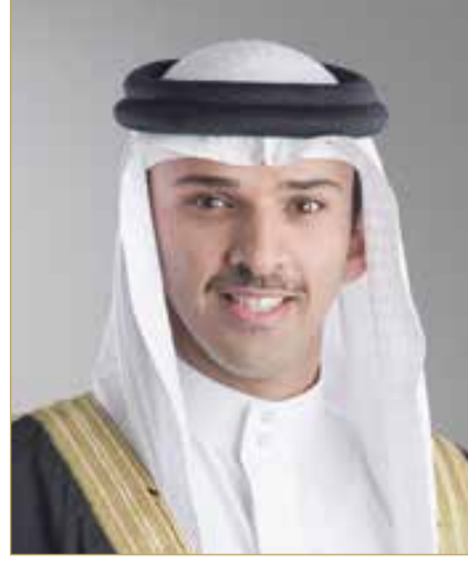
الشيخ علي بن خليفة بن أحمد آل خليفة

الاتحاد البحريني لكرة القدم، بقيادة سعادة الشيخ علي بن خليفة بن أحمد آل خليفة،