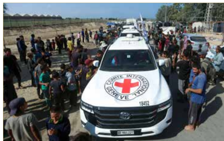
مركبات تابعة للصليب الأحمر تنقل المحتجزين الإسرائيليين بعد إطلاق سراحهم