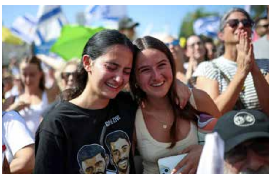
إسرائيليات بميدان الرهائن في تل أبيب يتفاععن مع أخبار الإفراج عن الرهائن الأحياء

وأعلنت حكومة غزة، الاثنين، بدء وصول أولى حافلات الأسرى الفلسطينيين المحررين إلى خان يونس، جنوبي قطاع غزة.