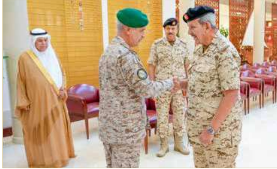
وتكامل الدفاعي المشترك. حضر الاجتماع عدد من كبار ضباط قوة دفاع البحرين.

تقوم به كل من القيادة العسكرية الموحدة بدول مجلس التعاون لدول الخليج العربية وقوات درع الجزيرة، في تعزيز وتطوير التعاون