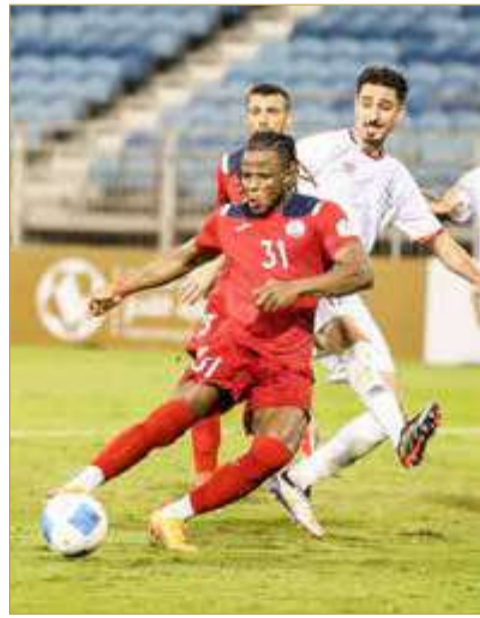
لقاء سترة وزاخو العراقي

البطولة، بعد خسارته في الجولة الأولى أمام العين الإماراتي الذي واصل صدارة المجموعة برصيد (6 نقاط) بعد تفوقه على القادسية الكويتي (0/1).