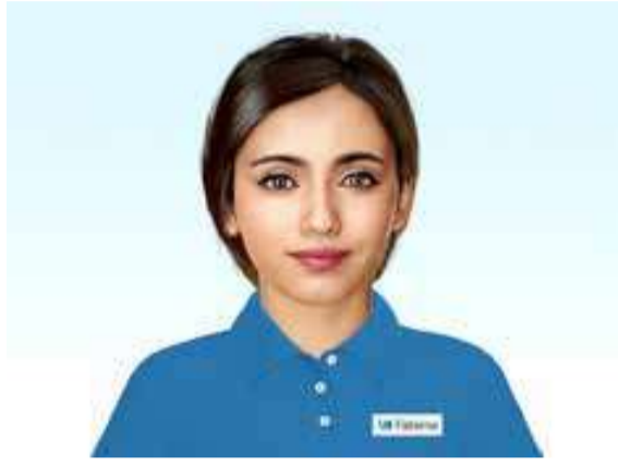
موظفة بنك ABC المدعومة بالذكاء الاصطناعي "فاطمة"

منطقة الشرق الأوسط وشمال أفريقيا. تؤكد هذه الجائزة التزامنا بتعزيز قدرات 'فاطمة' وتجربة استخدامات جديدة لدعم موظفينا وتحسين تجارب عملائنا من الشركات والأفراد على حد سواء.