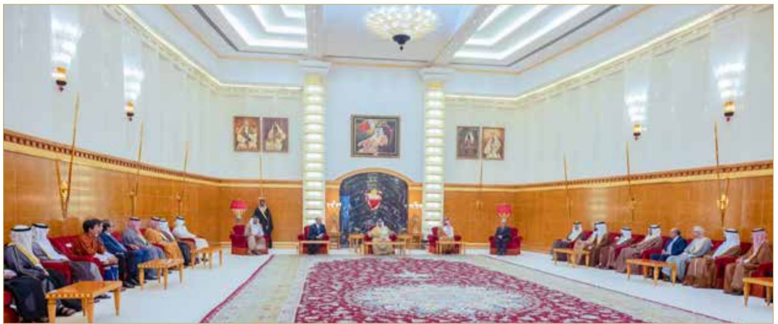
الملك المعظم مستقبلاً، بحضور سمو الممثل الشخصي لجلالته، كبار المدعوين ورؤساء الوفود المشاركة في دورة الألعاب الآسيوية للشباب في نسختها الثالثة

الدور المهم للرياضة في مد جسور التواصل وتعزيز قيم المحبة والتعايش والتسامح بين جميع ثقافات العالم، مؤكداً جلالته أن تجمع الشباب من مختلف دول قارة آسيا على أرض مملكة البحرين، والتنافس الودي فيما بينهم، هو الفوز الحقيقي الذي من أجله تم تنظيم هذه الدورة.