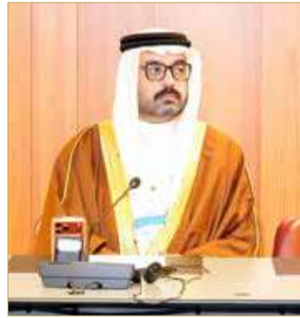
النائب أحمد السجوم يؤكد أهمية تضافر الجهود البرلمانية والتعاون المستمر لضمان حق التعليم للأطفال في بيئة آمنة ومستقرة