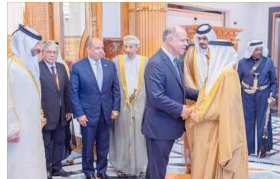
المنامة - بنا

استقبل ملك البلاد المعظم صاحب الجلالة الملك حمد بن عيسى آل خليفة، بحضور الممثل الشخصي لجلالة الملك المعظم سمو الشيخ عبدالله بن حمد آل خليفة، أمس في قصر الصخير، كبار المدعويين ورؤساء الوفود المشاركة في دورة الألعاب الآسيوية للشباب في نسختها الثالثة التي تستضيفها مملكة البحرين برعاية سامية من جلالة الملك المعظم، وذلك للسلام على جلالته.