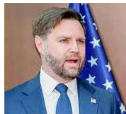
جاي دي فانس

هذا، ومن المقرر أن يصل وزير الخارجية الأميركي ماركو روبيو إلى إسرائيل الخميس، في زيارة تستمر يومين، طبقاً لما قاله مسؤول أميركي لصحيفة "تايمز أوف إسرائيل". وأضاف المسؤول أنه سيتم الإعلان رسمياً عن الزيارة في وقت لاحق وستركز على دعم التنفيذ الناجح لخطة واشنطن لوقف إطلاق النار في غزة. وستكون هذه الزيارة الرابعة التي يقوم بها روبيو إلى إسرائيل، منذ توليه منصبه في يناير.