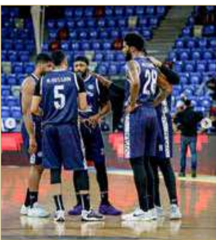
لقطة لفريق النجمة لكرة السلة

والعودة إلى ممارسة نشاطه الطبيعي ضمن إطار اللعبة وتحت مظلة القوانين الدولية المنظمة لكرة السلة.