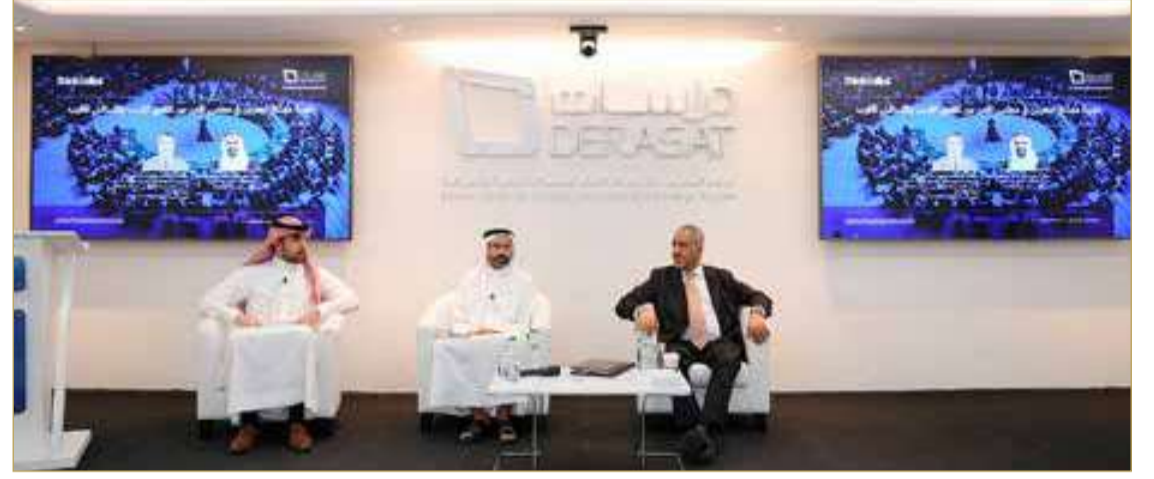
”دراسات“ يناقش تجربة البحرين في مجلس الأمن

الجماعي، وتوظيف عضويتها ل طرح رؤى جديدة تُسهم في تحقيق الأمن والسلم الدوليين، مؤكداً أن العضوية تمثل فرصة سانحة لتأكيد الحضور البحريني في صياغة القرارات الدولية المؤثرة، وإبراز الرؤية الوطنية التي تقوم على التوازن والانفتاح البناء.