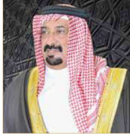
الشيخ أحمد بن علي

اليومية، والتي تتضمن خدمات البث والترفيه السلس، وتغطية داخلية أقوى وخدمة إنترنت متنقلة أكثر تطوراً، بما يتماشى مع رؤية الحكومة لبناء اقتصاد رقمي قوي وتعزيز استعداد المملكة للتقنيات المستقبلية ودعم جهود الاستدامة في المملكة.“ وأضاف رئيس مجلس إدارة زين البحرين: ”كما وصلت Bede توسيع نطاق خدماتها، وعززت دورها كجهة داعمة للخدمات المالية في المملكة لتشمل جميع سكان مملكة البحرين. ومع هذه الخطوة الجديدة، أصبح الآن بإمكان المقيمين غير البحرينيين المتأهلين بتقديم طلب للحصول على تمويل عبر التطبيق بكل سهولة وبساطة. وتعكس هذه الخدمة الجديدة التزام الشركة المستمر في توسيع نطاق الحلول المالية المبتكرة والمتوافقة مع الشريعة الإسلامية التي تركز على الشفافية والمرونة وتمكن فئات مختلفة بالمملكة.“ بالإضافة إلى ذلك، واصلت زين الأعمال تمكين الشركات من خلال توفير حلول متطورة، حيث وقعت عدة اتفاقيات جديدة مع مؤسسات رائدة وتعليمية لدعم مسيرة التحول الرقمي. كما قامت الشركة بتعزيز عروضها التأمينية من خلال إطلاق نسخة جديدة من خدمة زين الشاملة لتأمين السيارات بالشراكة مع شركة التكافل الدولية، حيث باستطاعة العملاء بتأمين