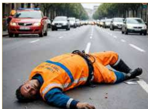
صورة تعبيرية مولدة بالذكاء الاصطناعي

كان يدفعها المجنبي عليه، لتندفع العربة بقوة نحو جسده وتقتذف به خارج الطريق إلى منطقة ترابية قريبة، حيث استقر هناك مصاباً بإصابات بالغة. وأضاف التقرير أن الحادث تسبب في تلفيات واضحة بالمركبة والعربة، بينما نُقل المجنبي عليه إلى المستشفى وهو في حالة حرجة، إلا أن محاولات الأطباء لإنقاذه في غرفة الإنعاش باءت بالفشل، لتنتهي الحادثة بوفاته متأثراً بجراحه. وكانت النيابة العامة قد اتهمت المتهمه بتسببها بخطفها في موت المجنبي عليه أثناء قيادتها المركبة دون بذل أقصى درجة عناية، فضلاً عن عدم التزامها بالحيطه والحذر والانتباه للطريق، وتسببها بإحداث تلفيات بمتلكات الغير، وقيادة المركبة دون الالتزام بالحذر والاحتياط، وبشهادة تسجيل منتهية الصلاحية، علاوة على الانشغال أثناء القيادة بغير الطريق مما أدى إلى التأثير في الحادث، والقيادة بصورة تعرض المشاة الذين يسرون على جوانب الطريق للخطر.