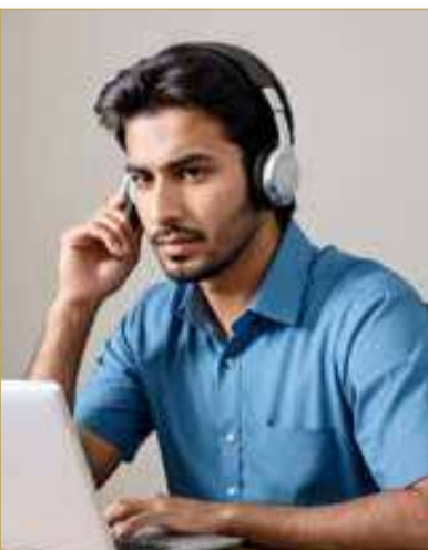
صورة تعبيرية مولدة بالذكاء الاصطناعي

” الجاني خدعها بمهارة إلكترونية وسحب أموالها