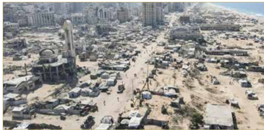
"الأغذية العالمي": تدفق الغذاء إلى غزة ما يزال أقل بكثير من المستهدف