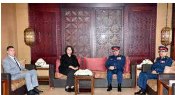
المنامة - وزارة الداخلية

تعزيز التنسيق الأمني مع الولايات المتحدة