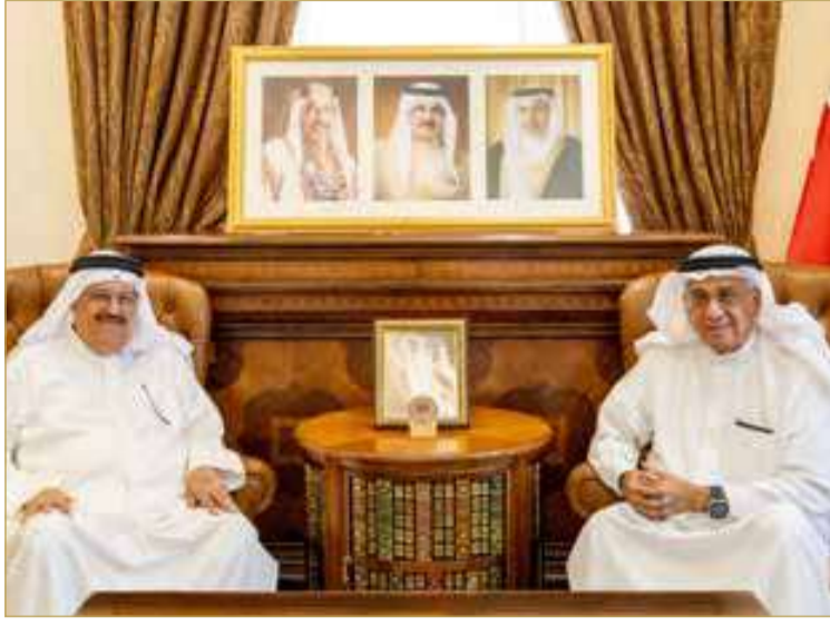
مستشار جلالة الملك لشؤون الإعلام يستقبل السفير خليل الذواودي

كفاءة وإخلاص، طوال فترة عمله بجامعة الدول العربية، في دعم أوامر التعاون وخدمة مسيرة العمل العربي المشترك، متمنياً له دوام التوفيق. من جانبه، أعرب السفير خليل الذواودي عن شكره وتقديره لمستشار جلالة الملك لشؤون الإعلام، مشيداً بما يواصل بذله من جهود وطنية مخصصة في خدمة المملكة وشعبها الكريم، وتعزيز مسيرتها التنموية الشاملة تحت القيادة الحكيمة لصاحب الجلالة ملك البلاد المعظم.