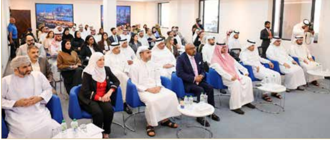
جانب من حضور نخب عسكرية ودبلوماسية وأكاديمية