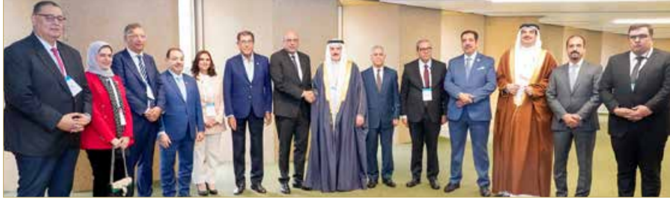
رئيس مجلس النواب: العلاقات البحرينية المغربية تتميز بعمق تاريخي

جاء ذلك خلال لقاء رئيس مجلس النواب، رئيس مجلس المستشارين بالمملكة المغربية الشقيقة، محمد ولد الرشيد، على هامش أعمال الجمعية