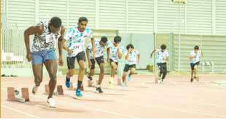
لقطة أرشيفية من استعدادات ألعاب القوى