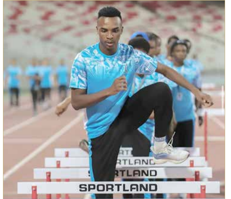
لقطة أرشيفية من استعدادات ألعاب القوى

ويمثل حضور منتخب البحرين في هذه المنافسات فرصة لإبراز تطور رياضة الفنون القتالية في المملكة، وتحقيق نتائج مشرفة