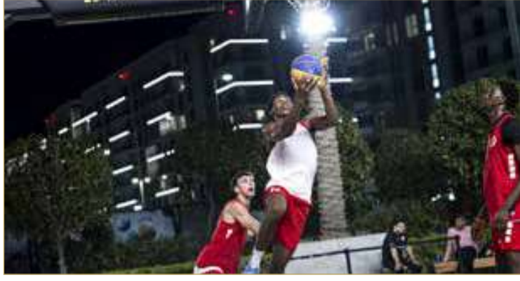
جانب من تدريبات منتخب كرة السلة 3x3