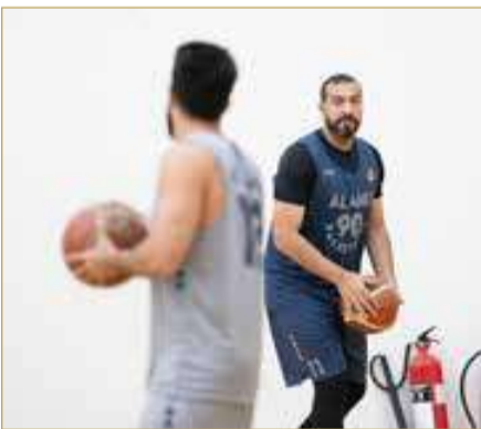
من تدريبات فريق الأهلي

والانسجام بين اللاعبين قبل بداية الموسم الرسمي. وتأتي هذه الخطوة ضمن خطة الجهازين الفني والإداري بالنادي لتوفير أفضل بيئة إعداد ممكنة لضمان انطلاقته قوية في منافسات الدوري البحريني لكرة السلة.