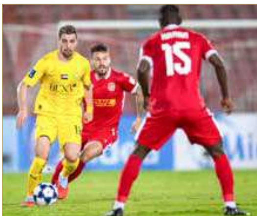
لقاء المحرق والوصل

وبهذه النتيجة، رفع الخالدية رصيده إلى 5 نقاط في صدارة المجموعة، فيما وصل أندية أسييا 2 بالمرتبة الثالثة، خلف الأهلي القطري (3 نقاط) وأركانداغ التركماني (نقطتين) بعدما تعادلا في مواجهتهما المباشرة.