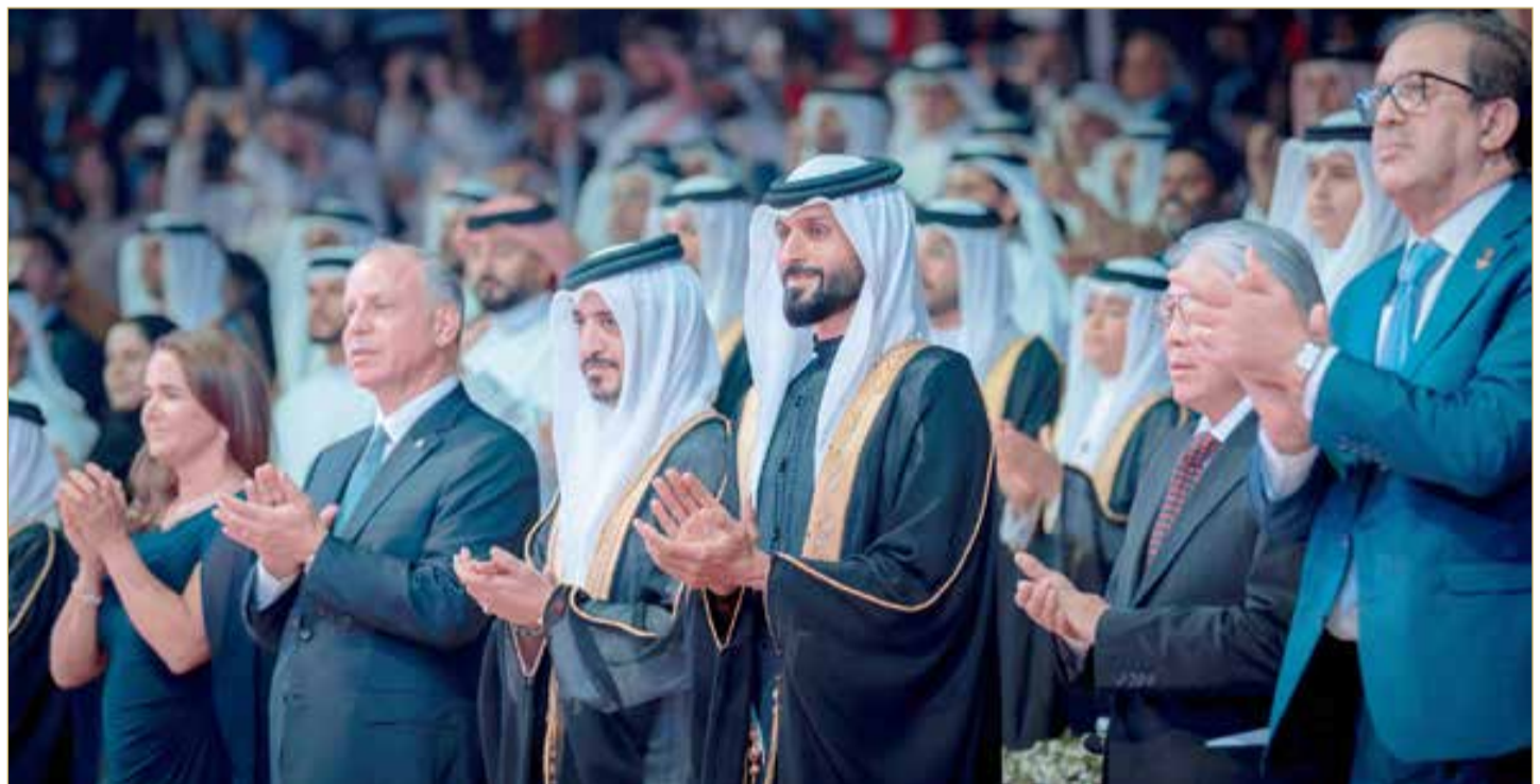
جلالة الملك المعظم ينيب سمو الشيخ ناصر بن حمد لافتتاح دورة الألعاب الآسيوية الثالثة للشباب

أناب ملك البلاد المعظم صاحب الجلالة الملك حمد بن عيسى آل خليفة، ممثل جلالته الملك للأعمال الإنسانية وشؤون الشباب رئيس المجلس الأعلى للشباب والرياضة سمو الشيخ ناصر بن حمد آل خليفة، لحضور الافتتاح الرسمي لدورة الألعاب الآسيوية الثالثة للشباب، التي تستضيفها مملكة البحرين من 22 إلى 31 أكتوبر الجاري، بمشاركة 45 دولة آسيوية، في أكبر حدث رياضي شبابي على مستوى القارة. كما شهد حفل الافتتاح الذي أقيم بمركز البحرين العالمي للمعارض، حضور النائب الأول لرئيس المجلس الأعلى للشباب والرياضة رئيس الهيئة العامة للرياضة رئيس اللجنة الأولمبية البحرينية سمو الشيخ خالد بن حمد آل خليفة، والنائب الأول لرئيس