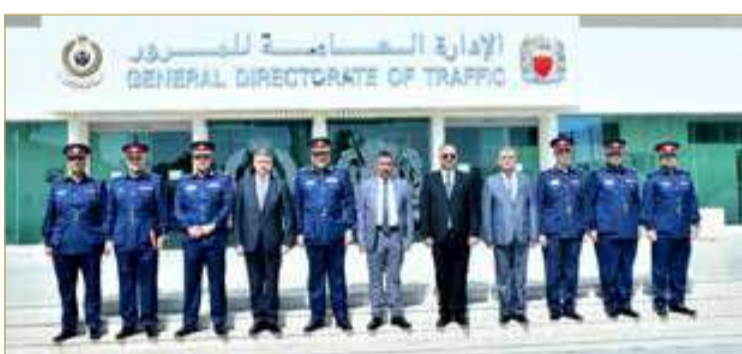
المنامة - وزارة الداخلية

تعزيز التعاون المروري بين البحرين والعراق