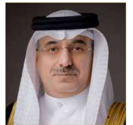
د. محمد العسيري

شارك الدكتور محمد العسيري، الرئيس التنفيذي لوكالة البحرين للفضاء، في جلسات مبادرة ”مصنع الابتكار بالذكاء الاصطناعي لأجل المناخ 2025“ التي نظمتها الاتحاد الدولي للاتصالات (ITU) بالشراكة مع أكثر من 50 منظمة دولية. تمثلت المبادرة في جلستين قدم خلالها عدد من الشركات الناشئة من مختلف دول العالم حلولاً مبتكرة تستخدم الذكاء الاصطناعي لمواجهة التحديات البيئية والمناخية، بمشاركة خبراء وقضاة دوليين بارزين. وأكد العسيري خلال مشاركته أن ”هذه المبادرة تمثل فرصة استثنائية