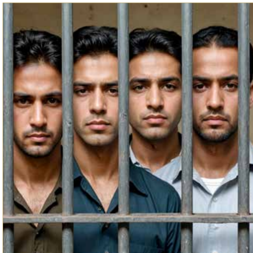
صورة تعبيرية مولدة بالذكاء الاصطناعي

وكانت النيابة العامة قد اتهمت المتهمين الأول والثاني بأنهما حال كونهما مشتركين في عصابة دولية لتهريب المواد المخدرة والمؤثرات العقلية، ويعملان لحسابها ويتعاونان معها، حازا وأحرزا وباعا بقصد الاتجار المواد المخدرة والمؤثرات العقلية، فضلاً عن اتهام الثالث والرابع بالاتجار، وإسناد تهمة التعاطي إلى جميع المتهمين. ومن جانبها حددت المحكمة الكبرى الجنائية الأولى جلسة 28 أكتوبر الجاري للنظر في القضية.