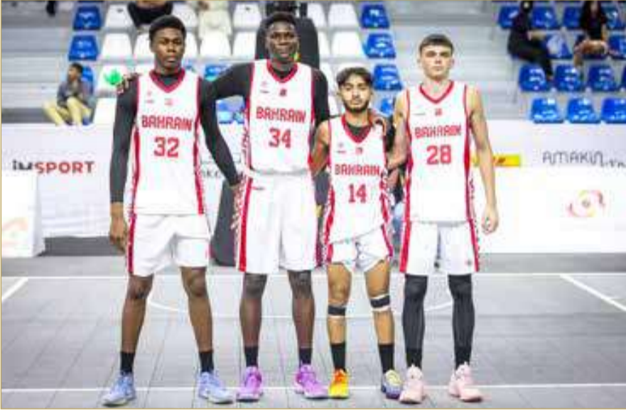
منتخب كرة السلة 3×3