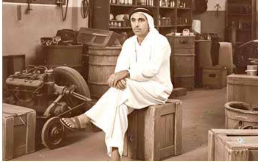
صورة مولدة بالذكاء الاصطناعي للراحل في مخزن المعادن