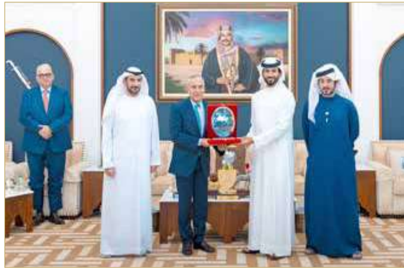
سمو الشيخ ناصر بن حمد في لقاء مع رئيس الاتحاد الدولي للفروسية

المشاركة له في ألمانيا بالعام 2006، وتقديرًا لجهوده سموه البارزة في دعم وتطوير رياضات الفروسية على المستويين الإقليمي والدولي. جاء ذلك لدى استقبال سموه، بحضور رئيس الهيئة العامة للرياضة رئيس اللجنة الأولمبية البحرينية سمو الشيخ خالد بن حمد آل خليفة، رئيس الاتحاد الدولي لسموه الحافلة بالإنجازات في مشاركات سموه ببطولات العالم منذ أول