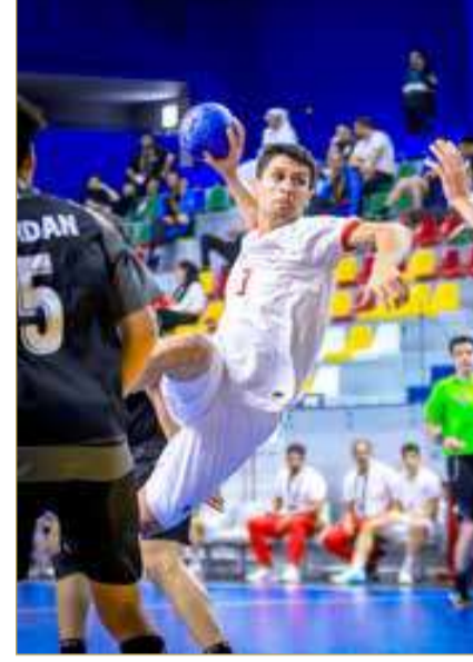
جانب من لقاء منتخبنا للشباب ونظيره الأردني

صراع الصدارة، وتحقيق العلامة الكاملة بالانتصار الرابع على التوالي لتأكيدها لتألقه في الدورة.