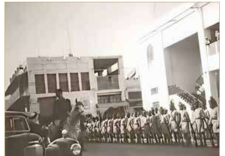
طابور عسكري في الخمسينات أمام باب البحرين