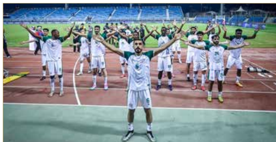
لقطة لفريق ”المالكية“