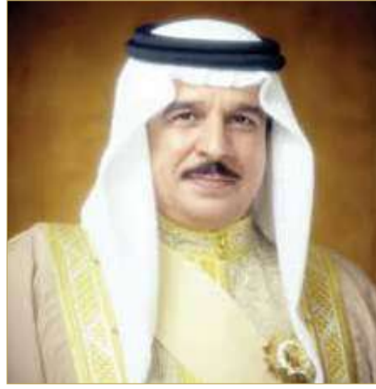
جلالة الملك المعظم

* الرئيس المؤسس رئيس مجلس أمناء الجامعة الأهلية