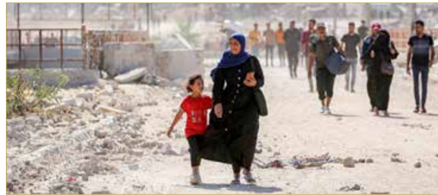
امرأة تسير مع فتاة في طريقها إلى مدينة غزة عبر ما يسمى ممر تساريم من النصيرات وسط قطاع غزة

لحركة حماس بالمطالبة في تسليم جثث الأسرى الـ 13 المتبقين في غزة، الجمعة، وكرر وزير الخارجية الأميركي ماركو روبيو الأمر نفسه، السبت، تحركت تل أبيب. فقد كشفت القناة 12 الإسرائيلية عن أن رئيس الحكومة بنيامين نتنياهو وافق بنفسه على دخول طاقم مصري قطاع غزة للمساعدة باستخراج الجثث. وأضافت المصادر أن إسرائيل سمحت، بضغط أميركي، بدخول الطاقم لاستعادة الرفات، موضحة أن الرفض الإسرائيلي كان بحجة أن "حماس" قادرة بالأدوات التي تمتلكها على إخراج رفات الرهائن الإسرائيليين. كما نقل عن مسؤول أمني لـ "i24NEWS" قوله، إن الموافقة جاءت في إطار الاتصالات الجارية لإعادة جثامين الرهائن، إذ صادقت المستويات السياسية في إسرائيل على الطلب المصري بإدخال معدات وفريق مصري فقط للمساعدة في جهود العثور على الجثامين، مؤكداً أن الفريق والمعدات دخلت غزة. أتى هذا التطور بعدما أعلن مكتب نتنياهو مساء السبت، أن رئيس الوزراء أكد في اتصال هاتفى مع وزير الخارجية الأميركي ماركو روبيو، ضرورة إعادة الرهائن ونزع سلاح "حماس".