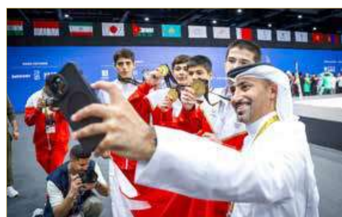
فرحة كبيرة لمنتخب الفنون القتالية المختلطة