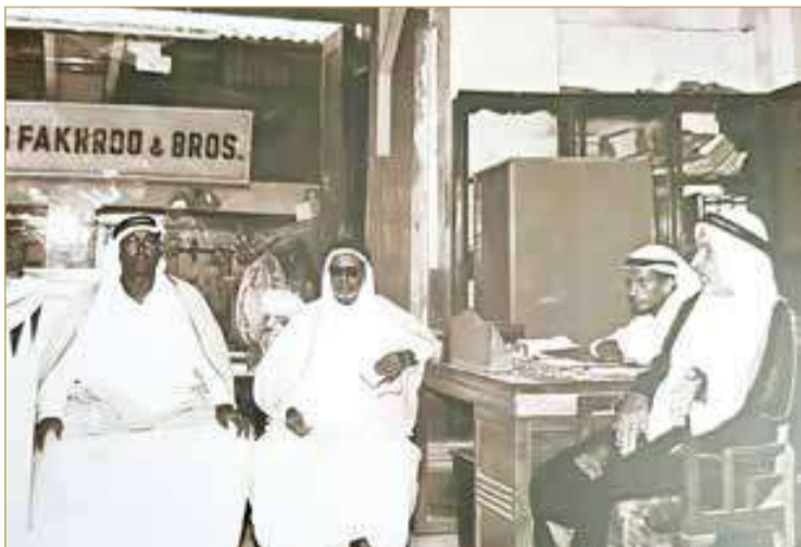
صورة تذكارية لمجموعة من التجار في ضيافة بوجي وفخرو في باب البحرين