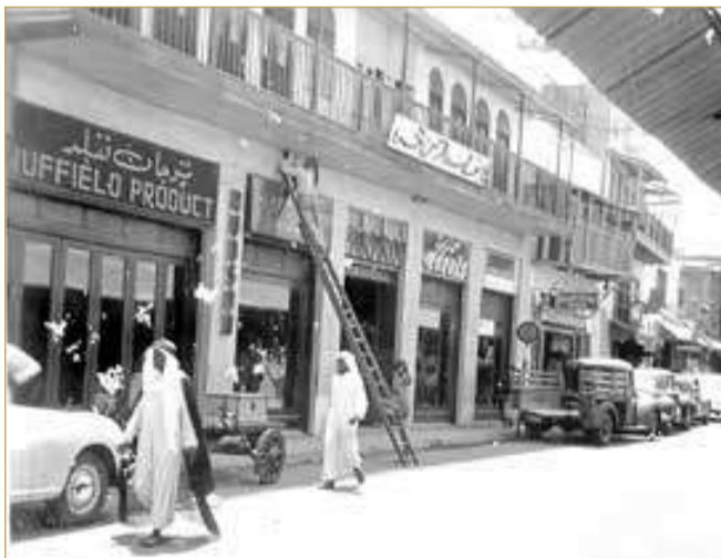
باب البحرين أواخر الخمسينات

”باب البحرين“ له رمزيته الوطنية والاجتماعية والثقافية والتاريخية والتجارية، ولهذا فهو موضع اهتمام الدولة، والدليل على ذلك هو مشروع وزارة الثقافة لتطويره باعتباره يعكس الهوية الفريدة للسوق البحريني التقليدي، كما أن المشروع يعتبر امتداد لمراحل متعددة خضع فيها باب البحرين للتطوير، فقد تمت إعادة ترميم باب البحرين ليعود إلى سابق عهده كما كان عام بنائه بالعام 1954، وتضمنت أعمال الترميم إعادة الواجهة الأصلية للمبنى وإزالة بعض أعمال التعديل التي وضعت على المبنى في منتصف ثمانينات القرن الماضي.