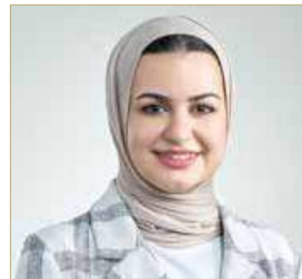
وزيرة شؤون الشباب