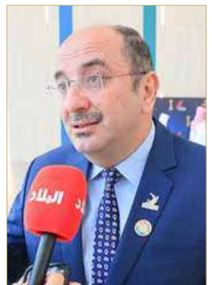
البروفيسور مهند الفراس

أعرب رئيس الجامعة الخليجية البروفيسور مهند الفراس، عن فخره بحصول الجامعة على المركز الأول في فئة التميز في الحكومة الإلكترونية للعام 2025، إضافة إلى تصنيف ثلاثة من مشروعاتها ضمن أفضل المشروعات المشاركة في الجائزة، مؤكدًا أن هذا الإنجاز يمثل