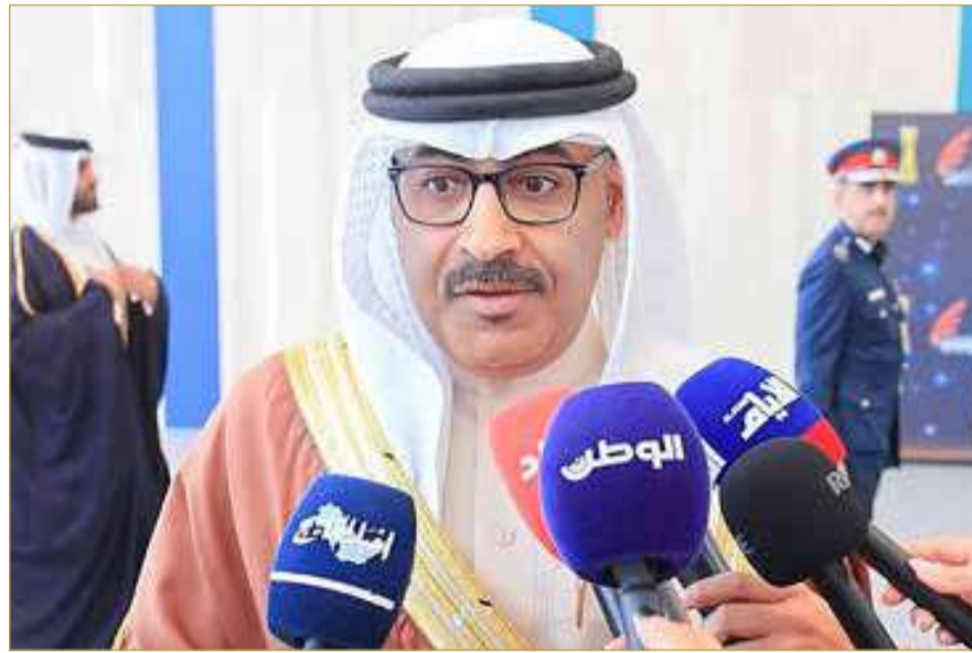
وزير التربية والتعليم

وأكد وزير التربية والتعليم د. محمد جمعة، أن جامعة البحرين تُعد من أوائل المؤسسات الوطنية التي دخلت عالم الإنترنت في مملكة البحرين، وذلك منذ العام 1995، حيث كانت تجربة استخدام الإنترنت لأول مرة جزءًا مهمًا من حياة طلبة الجامعة في ذلك الوقت، مشيرًا إلى أن هذه الخطوة كانت بداية مسار طويل من التطوير التقني والتحول الرقمي في التعليم العالي بالمملكة. وأوضح أن الجامعة واصلت منذ ذلك الحين تبني العديد من البرامج والمبادرات والمشروعات التي تعزز توظيف تكنولوجيا المعلومات والاتصالات في العملية التعليمية، وتوفر بيئة أكاديمية حديثة تواكب التطورات العالمية في هذا القطاع الحيوي. وأضاف أن فوز الجامعة بهذه الجائزة يُعد إنجازًا يُضاف إلى سجلها الأكاديمي والبحثي المتميز، ويشكل مصدر فخر ليس فقط لطلبتها