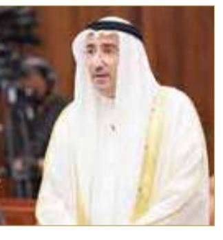
د. هاني الساعاتي

قال عضو مجلس الشورى د. هاني الساعاتي، خلال مناقشة مرسوم القانون الخاص بتعديل بعض أحكام المرور، إن ”أمن الطريق جزء من أمن المواطن، وأمن المواطن جزء من أمن الوطن، مشدداً على أن القيادة تتطلب فناً وذوقاً، فيما ما نشهده اليوم بعيد عن ذلك، وهو ما يعد سبباً رئيسياً للأضرار والمخالفات. وأشار الساعاتي إلى الإحصاءات