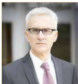
الأمين العام السابق لـ "الإنتربول"

ويقع التعاون الأمني والإقليمي كضرورة حتمية، لكن لا غنى عن برامج توعية وإعادة تأهيل المتعاطين، وفرض رقابة مالية على التحويلات المشبوهة، وتجنيف مصادر التمويل التي تجعل الكبتاغون "عملة حرب وسلام"؛ فهذه الحبة عبارة عن منظومة تمويل سياسي واقتصادي عابرة للحدود... حرب صامتة تُدار بالحبوب بدلا من الرصاص، لكنها لا تقل فتكاً؛ فحين يضعف الاقتصاد الرسمي "الأبيض"، يقوى الاقتصاد "الأسود".