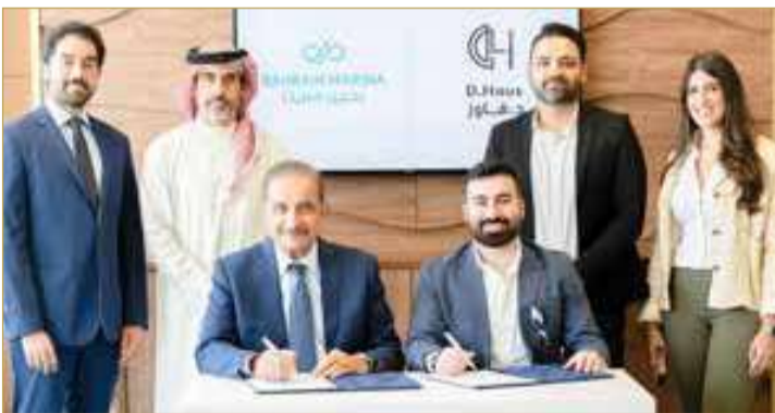
توقيع شراكة مع “دهاوس”