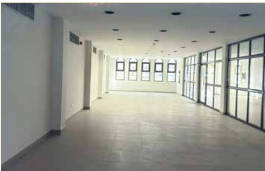
مقهى سوق الرفاع بلا استثمار