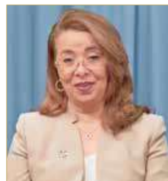
المدير التنفيذي لمكتب مكافحة المخدرات بالأمم المتحدة