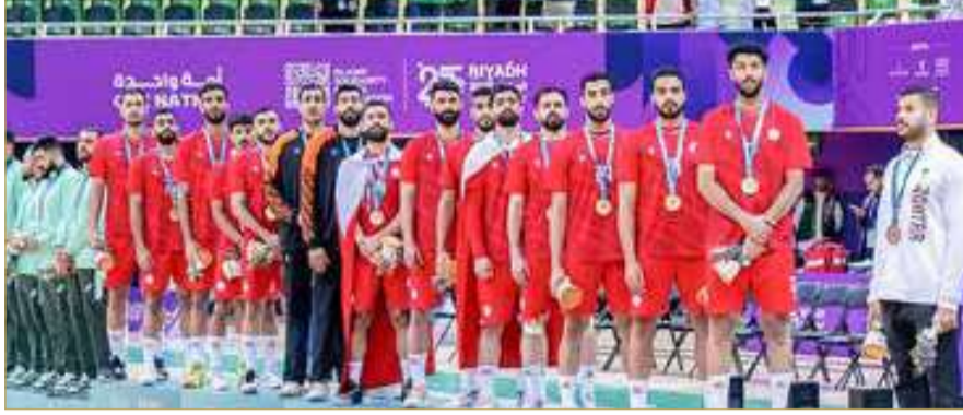
منتخبنا الوطني لكرة اليد متوجاً ذهبية دورة التضامن الإسلامي