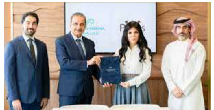
توقيع شراكة مع “بيسيسز”

الداخلية والخارجية، وقاعات السينما الخاصة، ومناطق لعب الأطفال، والمواقف الذكية. كما يحيط بالمشروع نطاق واسع من المتاجر والمطاعم والمقاهي الراقية التي تعزز من تجربة الحياة اليومية للمقيمين.