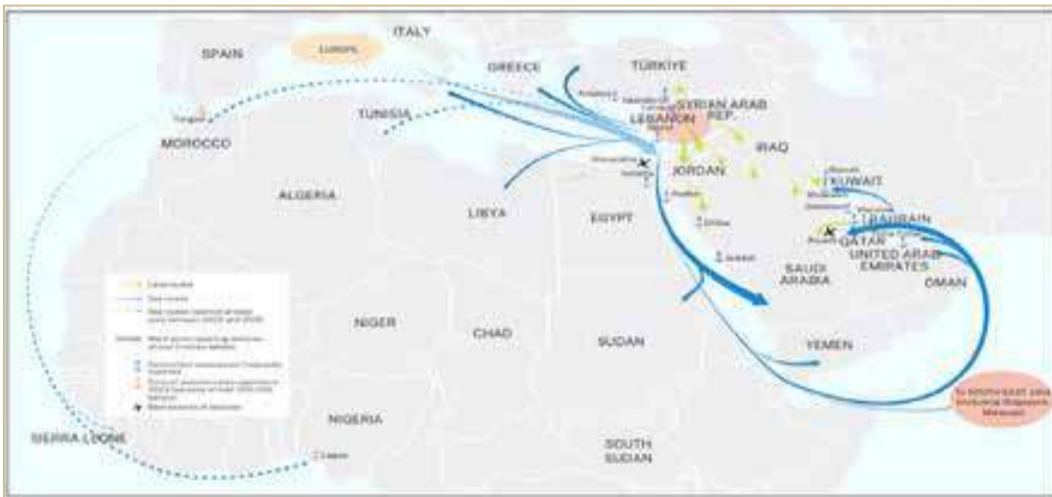
خريطة وردت في تقرير الأمم المتحدة في يوليو 2024 عن مسار الاتجار بالكبتاغون

الشباب، ويمثل الأطفال دون سن 15 عامًا نحو ثلث السكان في العام 2023، ويبلغ عدد الشباب قرابة 82 مليون شاب تتراوح أعمارهم بين 15 و24 عامًا بنسبة