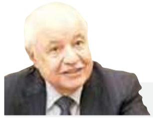
د. طلال أبوغزالة