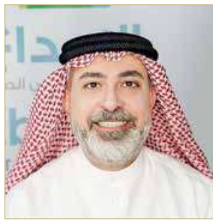
د. خالد الغزاوي

* رئيس ومؤسس مجموعة طلال أبوغزالة العالمية