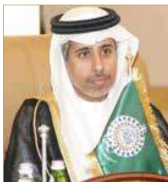
الأمين العام لمجلس وزراء الداخلية العرب