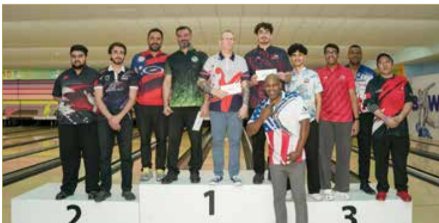
جانب من التتويج

وأكد توني أن بطولة Bowler of the Month ستكون ركيزة أساسية في خطط الاتحاد لرفع مستوى اللعبة، لما توفره من بيئة تنافسية مستمرة تمكن اللاعبين من خوض مباريات متكررة تسهم في تحسين جهوزيتهم وصل مواهبهم. وأضاف أن الإقبال الكبير والمنافسة القوية تعد مؤشراً إيجابياً على نجاح هذه المبادرة، مؤكداً أن الاتحاد سيواصل تنفيذ برامج نوعية تستهدف تطوير اللعبة وتعزيز حضورها محلياً وخارجياً.