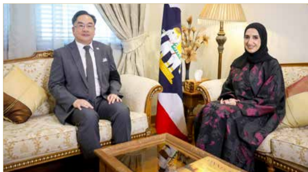
البلاد | تحاور السفير التايلاندي سوماتي تشولاجاتا

أود أن أتقدم بالشكر على الترحيب الدافئ الذي تلقينته من جميع البحرينيين والجالية التايلاندية هنا منذ وصولي إلى البحرين، مما جعلني أشعر أنني في وطني. إنني فخور بخدمة بلادي سفيرًا لتطوير وتعزيز الصداقة العريقة بين بلدينا. تشارك تايلاند والبحرين رابطًا فريدًا للغاية، لا يقتصر على التجارة والدبلوماسية فحسب، بل يمتد إلى احترام متبادل وتقدير ثقافي. أتطلع للعمل بشكل وثيق مع الحكومة البحرينية، قطاع الأعمال، والمجتمع البحريني لخلق المزيد من الفرص وتعميق علاقاتنا أكثر.