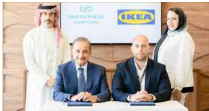
توقيع شراكة مع “إيكا”