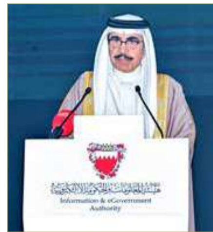
وزير الداخلية يلقي كلمة خلال الحفل

شهد وزير الداخلية رئيس اللجنة الوزارية لتقنية المعلومات والاتصالات الفريق أول الشيخ راشد بن عبدالله آل خليفة، صباح أمس، حفل تكريم الجهات والأفراد الفائزين في النسخة الثالثة عشرة من جائزة التميز للحكومة الإلكترونية 2025، الذي جاء تحت عنوان "التميز الرقمي والابتكار الحكومي"، متزامناً مع الاحتفاء بمرور 30 عاماً على ربط مملكة البحرين بشبكة الإنترنت، بحضور عدد من الوزراء وكبار المسؤولين والخبراء والمهتمين بقطاع تقنية المعلومات والاتصالات.