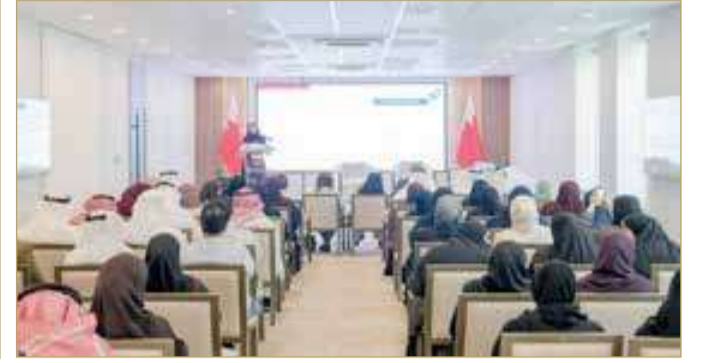
بوبشيت: منظومة التشريعات المتقدمة التي أرسستها مملكة البحرين شكلت أساساً راسخاً لتمكين المرأة في شتى المجالات

المساعد للموارد والنظم الرقمي، مدير الموارد البشرية والمالية، عرضاً آخر بعنوان "مبادرات الأمانة العامة في تمييز المرأة البحرينية وتعزيز جودة الحياة الوظيفية". واستعرضت رئيسة لجنة شؤون المرأة والطفل خلال نموذجاً متكاملًا لمسيرة التمييز والابتكار لدى المرأة، موضحة أن هذا النموذج يمر بأربع مراحل رئيسية تمكّن المرأة من الوصول إلى أعلى درجات التمييز. تبدأ المرحلة الأولى بالإعداد الشامل على المستويات النفسية، والجسدية، والفكرية، والعلمية، والمهنية، بما يشكل قاعدة قوية للانطلاق، ثم تأتي المرحلة الثانية التي تتطلب استجابة مرنة وواعية لمجمل المتغيرات في المجالات التكنولوجية، والاقتصادية، والسياسية، والاجتماعية. (اقرأ الموضوع كاملاً بالموقع الإلكتروني)