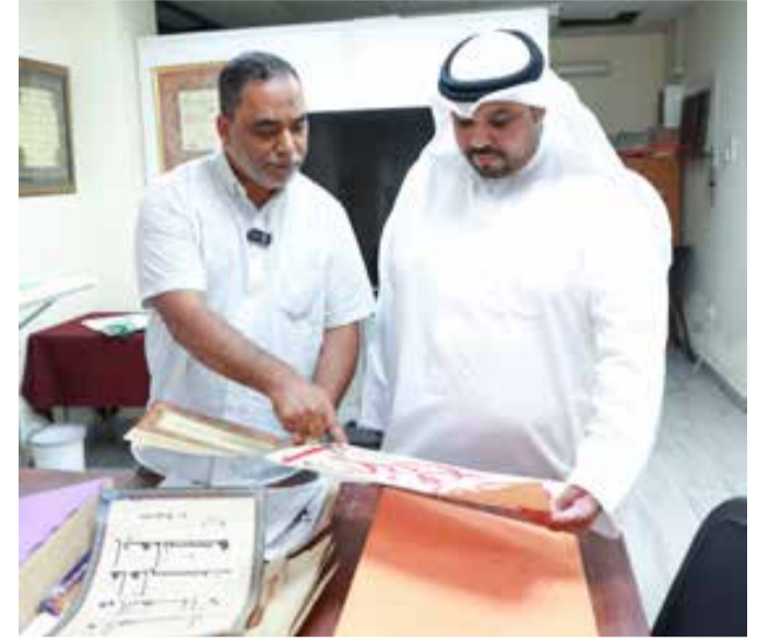
نماذج من أعمال الخط العربي