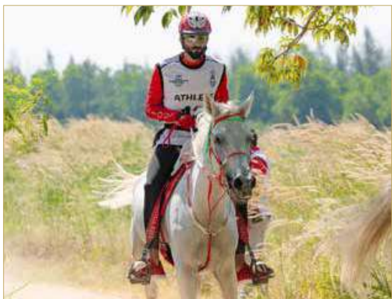
سمو الشيخ ناصر بن حمد يشارك في بطولة آسيا للفروسية