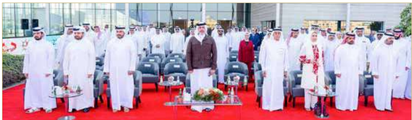
جلالة الملك المعظم ينيب سمو الشيخ عبدالله بن حمد لحضور ختام موسم الموروث البحري

المحاذية لمتحف البحرين الوطني، بحضور سمو الشيخ محمد بن سلمان بن حمد آل خليفة. بعدها، توج الممثل الشخصي لجلالة الملك المعظم سمو الشيخ عبدالله بن حمد آل خليفة الفائزين في المنافسات الختامية. وبهذه المناسبة، أكد الممثل الشخصي لجلالة الملك المعظم سمو الشيخ عبدالله بن حمد آل خليفة، أن الدعم والرعاية الملكية السامية من ملك البلاد المعظم لرياضات الموروث الشعبي تجسد الحرص على مواصلة مسيرة صون الرياضات التراثية، وتشجيع جلالته لجميع الجهود التي تهدف إلى رعاية مختلف هذه الرياضات التراثية والمحافظة عليها وتطويرها وتشجيع الشباب البحريني على المشاركة فيها؛ بهدف ترسيخ الهوية البحرينية وإحياء تراث الآباء والأجداد.