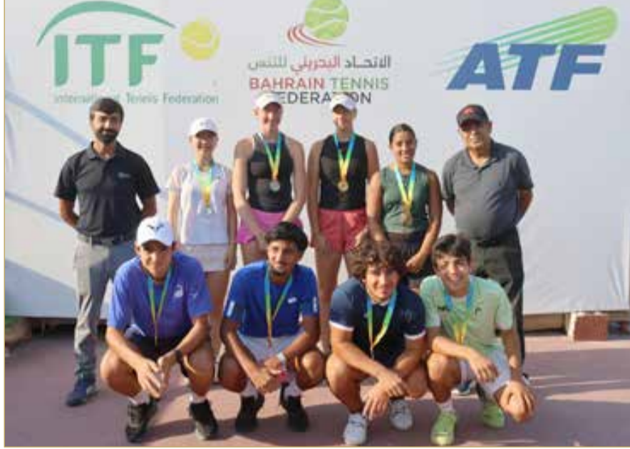
لقطة جماعية للمتوجين في فئة الزوجى

وقدمت لوماكينا أداءً مميّزًا، حيث كانت على مدى مجموعتي المباراة الطرف الأفضل، والأقل أخطاء خلال المباراة، خصوصًا في المجموعة الثانية التي حسمتها لوماكينا بسهولة.