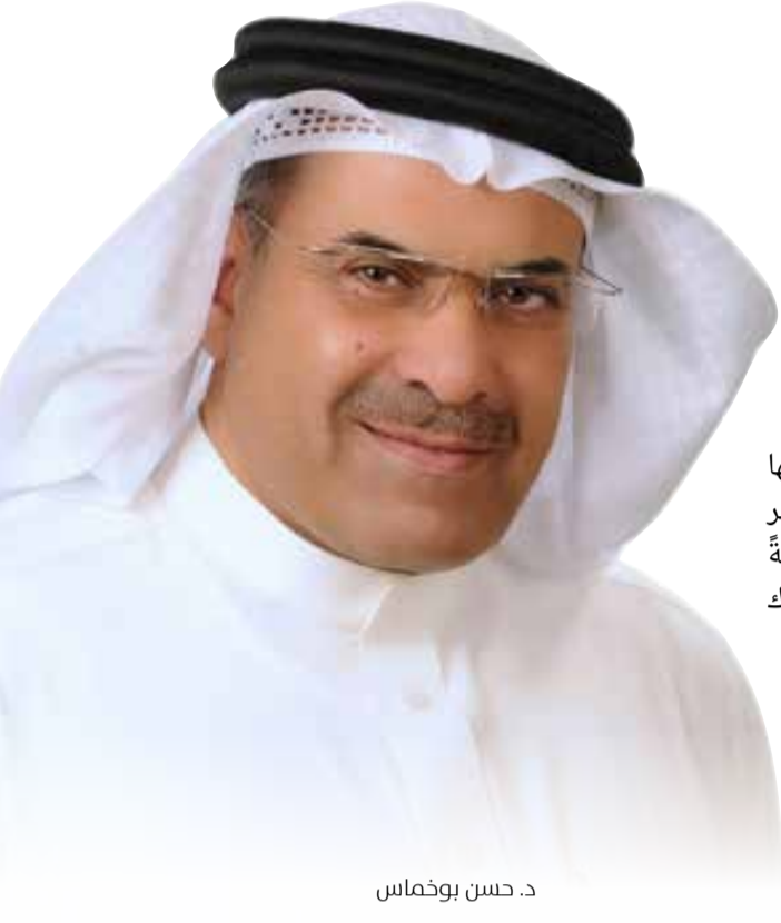
د. حسن بوخماس

المستهلك والملكية الفكرية، بما يسهم في جعل المنطقة كتلة اقتصادية واحدة جاذبة للاستثمار. كما أشار إلى اعتماد عدد من الاستراتيجيات الموحدة في الجوانب الأمنية والاجتماعية، وفي مقدمتها الاستراتيجية الأمنية الشاملة التي تستلزم تطوير أطر تشريعية موحدة لمكافحة الجريمة والإرهاب، إضافة إلى الاستراتيجية الاجتماعية التي تعزز العمل المشترك في مجالات الأسرة والرعاية الصحية. وقال بوخماس إن المسيرة الخليجية تثمر بشكل مستمر عن إنجازات تعود بالنفع على المواطن، وسوف تشكل قمة المناخ 2025 محطة جديدة في مسيرة المجلس المتواصلة، تستلهم فيها التوجيهات السامية لقادة دول المجلس، وتبني على ما تحققت من إنجازات، وتعمل على تعزيز التكامل في جميع المجالات.