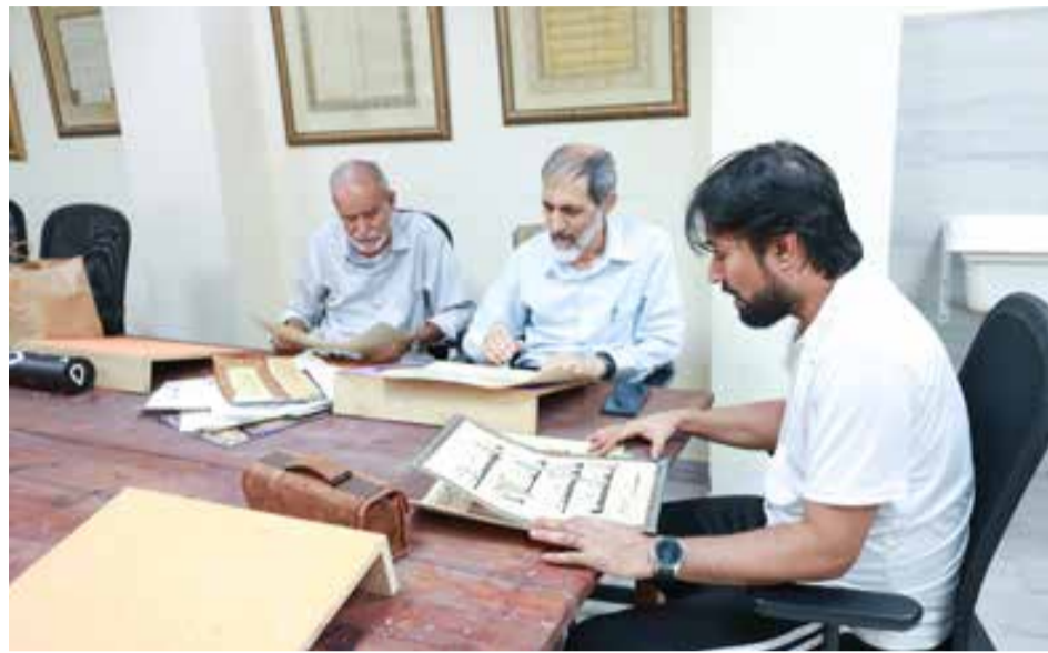
الخطاطون أثناء تبادل الخبرات الفنية

✎ تعليم الخط خطوة مطلوبة لحماية جمال الكتابة