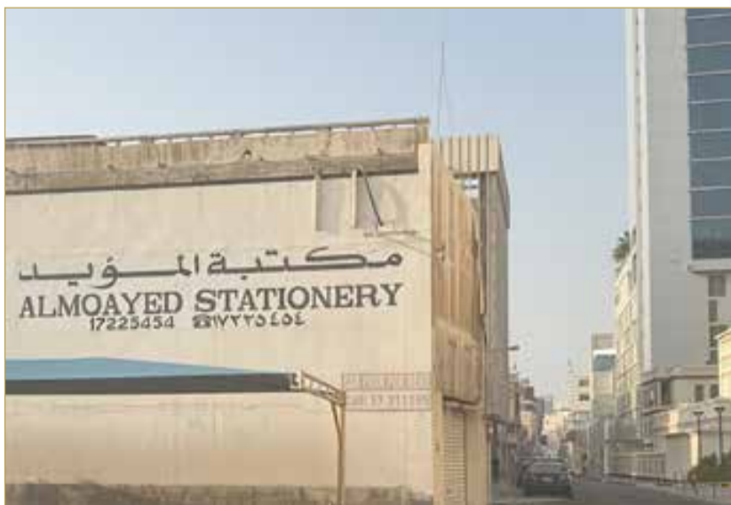
مكتبة المؤيد في فريج الفاضل أصبحت أيقونة تاريخية

الحكومية والتجارية، وصحف مثل القافلة العام 1952 والوطن والميزان العام 1955، واستمرت المطبعة حتى بيعها العام 1960 وتحولت بعد ذلك إلى مطبعة دلمون، وترك بصمة مميزة في المشهد الثقافي البحريني، جامعا بين إرث والده التجاري ورؤيته المعرفية الحديثة.