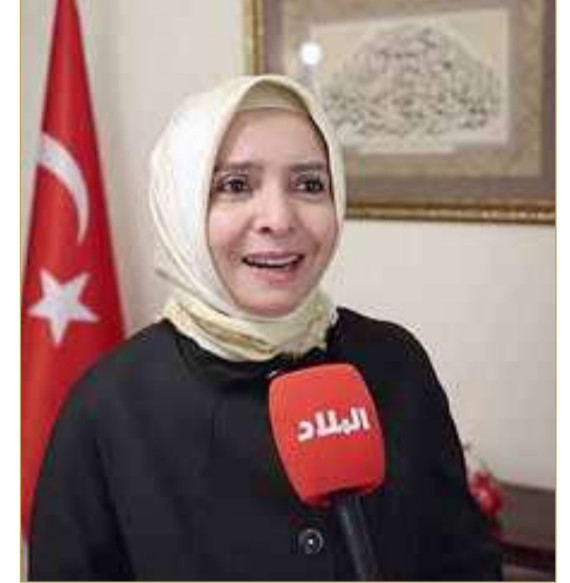
د. عائشة كويتناك

أعربت سفيرة جمهورية تركيا لدى مملكة البحرين د. عائشة كويتناك، عن تمنياتها بنجاح القمة الخليجية السادسة والأربعين التي تستضيفها البحرين، مؤكدة أن انعقاد القمة يأتي في مرحلة تشهد تحولات جيوسياسية واقتصادية عميقة، ما يجعل مخرجاتها مرتقبة لدورها في دعم الاستقرار الإقليمي وتعزيز التكامل الاقتصادي والعمل المشترك على مستوى دول الخليج والشرق الأوسط. وأكدت في تصريحها لـ "البلاد" أن تركيا تولي أهمية كبيرة لعلاقتها الممتدة مع دول مجلس التعاون الخليجي، مشيرة إلى أن الشراكة بين الجانبين شهدت تقدماً ملحوظاً في السنوات الأخيرة، مدفوعة بالحوار رفيع المستوى وتوسع التعاون في مجالات أبرزها الصناعات الدفاعية والاتصال، مشددة على أن زيارات الرئيس التركي الأخيرة لعدد من الدول الخليجية تعكس قوة العلاقات القائمة. وأضافت أن تركيا تتطلع لاستضافة الاجتماع الوزاري