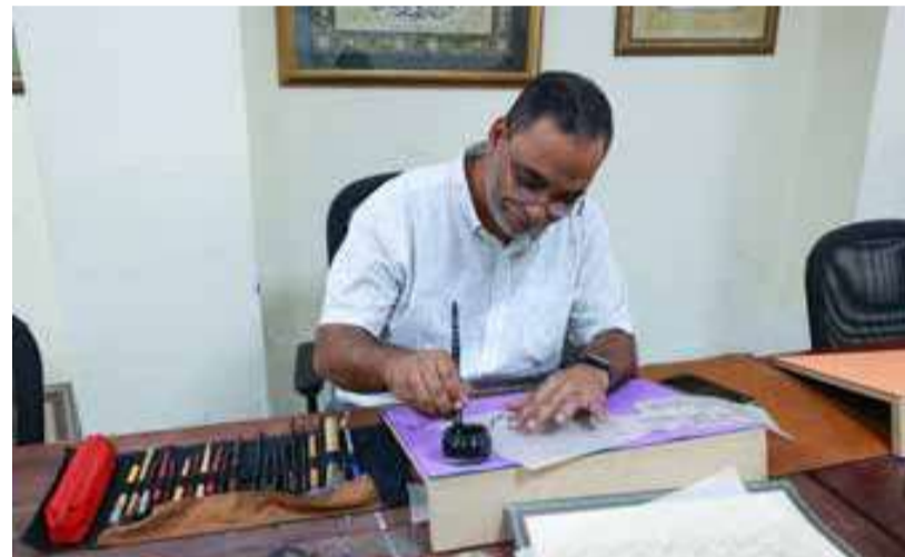
لحظة تركيز أثناء كتابة الحروف