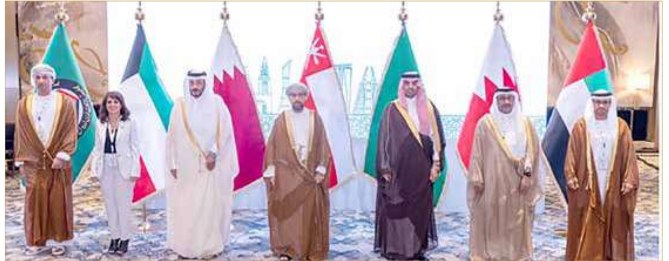
من اجتماع اللجنة الوزارية للأمن السيرياني في سبتمبر 2025

وأوضح أن المجلس الوزاري لمجلس التعاون الخليجي سيستعرض