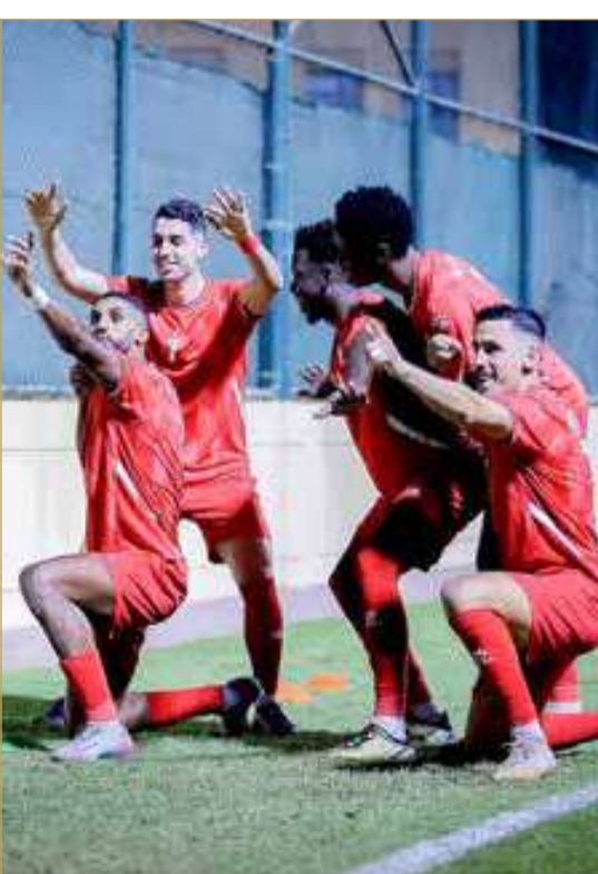
فرحة لاعبي الاتفاق تكررت ثلاث مرات