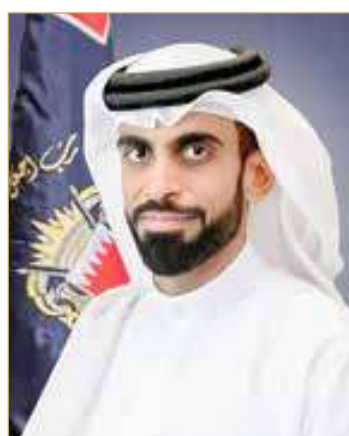
الشيخ خالد بن راشد

أشاد المدير العام لإدارة العامة لتنفيذ الأحكام والعقوبات البديلة الشيخ خالد بن راشد آل خليفة، بإصدار ملك البلاد المعظم صاحب الجلالة الملك حمد بن عيسى آل خليفة، مرسوما ملكيا بالعفو الخاص والإفراج عن عدد من النزلاء المحكومين في قضايا مختلفة، معبرا عن خالص الشكر والعرفان لمقام جلالته الملك المعظم لشمول العفو الملكي عددا من المستفيدين من برنامج العقوبات البديلة. وتنفيذا للتوجيهات الملكية السامية، التي تقضي بمواصلة التوسع في تطبيق