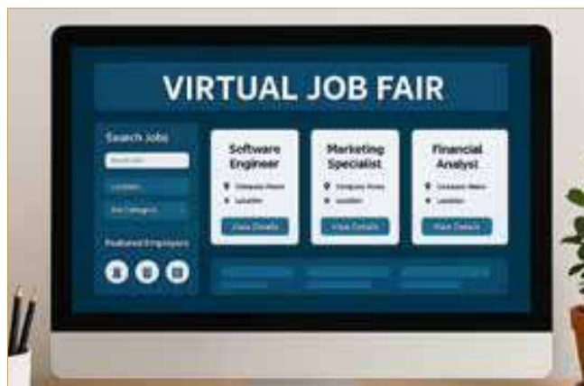
صورة تعبيرية مولدة بالذكاء الاصطناعي

يبحث المجلس البلدي للمحرق في اجتماعه المقبل، المساهمة في استكمال الأعمال المتبقية لافتتاح جامع محمد بن حميد بمنطقة عراد.