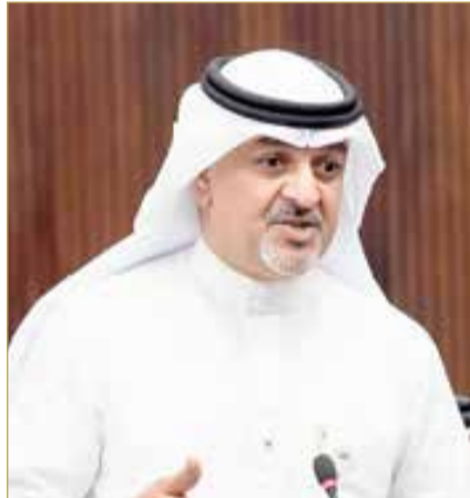
النائب جلال كاظم

متطلبات التنمية الحضرية. وأضاف أن الوزارة تحرص على التنسيق مع المجالس البلدية والجهات ذات العلاقة لدراسة الملاحظات والمقترحات التي ترد من النواب أو المواطنين، واتخاذ الإجراءات القانونية اللازمة حيال أي مخالفات، بما يسهم في تطوير الأسواق وتحسين مستوى الخدمات المقدمة. وأكد في ختام رده أن تنظيم الأنشطة التجارية سيظل محل متابعة دائمة، وأن الوزارة منفتحة على أي مقترحات من شأنها تعزيز النظام العام وتحقيق المصلحة العامة ورفع جودة الحياة في مختلف مناطق المملكة