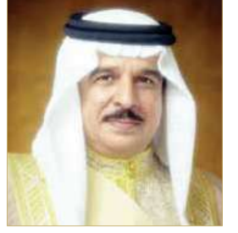
ملك البلاد المعظم