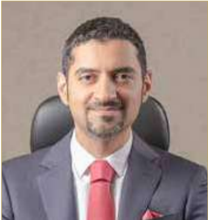
وزير شؤون البلديات والزراعة