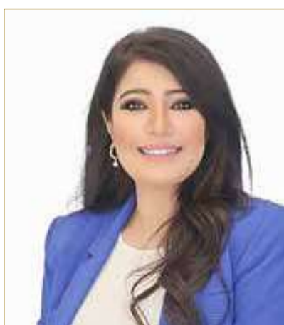
د. مريم الطاعن

السياسات الاقتصادية المتوازنة، واستمرار تبسيط الإجراءات أمام المستثمرين، إلى جانب التركيز على تنويع مصادر الدخل وتعزيز مساهمة القطاعات غير النفطية وزيادة مساهمتها في الناتج المحلي الإجمالي، بما أسهم في تحقيق نمو اقتصادي مستدام رغم التحديات الإقليمية والعالمية. وأكدت الطاعن أن الاستثمارات الأجنبية المباشرة شهدت نموًا ملحوظًا، مدفوعة بثقة المستثمرين في بيئة الأعمال البحرينية، ووضوح الرؤية الاقتصادية، فضلاً عن الموقع الاستراتيجي للمملكة والبنية التحتية المتطورة. وقالت الطاعن إن ما تحقق من إنجازات يشكل قاعدة صلبة لمواصلة مسيرة التنمية، وتعزيز المكتسبات الوطنية، والبناء على النجاحات، بما يواكب تطورات المواطنين، ويعزز مكانة مملكة البحرين كدولة رائدة في التنمية الشاملة والمستدامة.