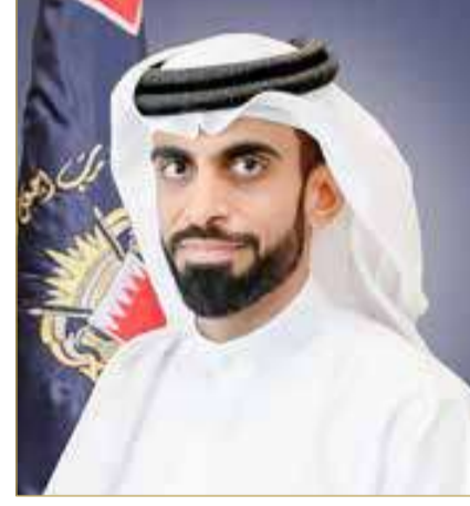
الشيخ خالد بن راشد

وعبر المدير العام للإدارة العامة لتنفيذ الأحكام والعقوبات البديلة عن شكره وتقديره للجهات الحكومية والمؤسسات والشركات الوطنية على دورها في دعم البرامج التأهيلية والتدريبية للمستفيدين من المشروع، منوها بمواصلة تطوير وتحديث وطرح مبادرات جديدة تساهم في مزيد من الإنجاز، بما يساهم في إعادة إدماج المستفيدين في المجتمع بشكل فعال.