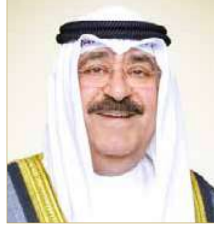
أمير دولة الكويت الشقيقة