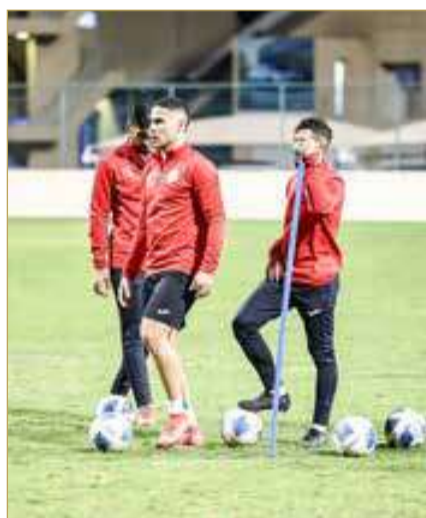
من تدريب فريق "سترة"

لمباراة يوم الثلاثاء. ويحتل فريق سترة المركز الثالث برصيد نقطتين، والقادسية الكويتي في المركز الأخير برصيد نقطة واحدة وخسارتين، فيما يتصدر فريق زاخو العراقي المجموعة برصيد 7 نقاط، يليه العين الإماراتي (6 نقاط).