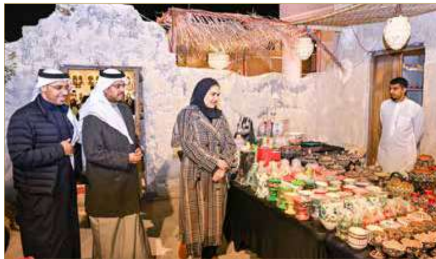
مستشار جلالة الملك للشؤون الثقافية والعلمية تزور مهرجان أعياد البحرين بالقرية التراثية

على الموروث الوطني وتعزيز حضوره في مختلف المناسبات الوطنية.