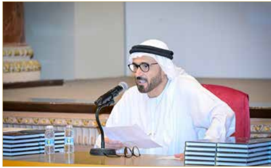
البلاد | إبراهيم التهام

دشن نادي الخريجين، مساء يوم أمس الأحد، كتاب "الرحم الاصطناعي.. عالم ما بعد التكاثر البشري" للمفكر الإماراتي الدكتور جمال السويدي، وذلك في قاعة عيسى بن سلمان الثقافية بمنطقة العدلية، بحضور رئيس مجلس الشورى علي الصالح، ومستشار جلالته الملك المعظم لشؤون الإعلام نبيل الحمير، إلى جانب عدد من أعضاء مجلس الشورى، ورجال الأعمال، والمفكرين، والكتاب، والمهتمين بالشأن العلمي والفكري، وذلك بتنظيم من نادي الخريجين بالتعاون مع منتدى الفكر والثقافة العربية.