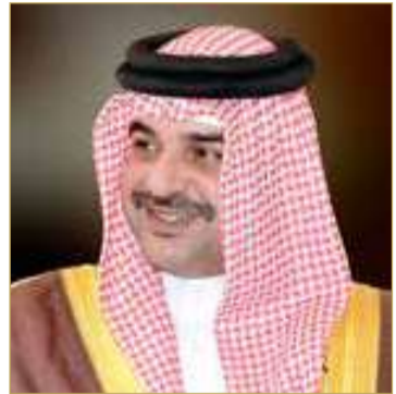
سمو الشيخ عبدالله بن حمد

محمد بن زايد آل نهيان في دعم قضايا البيئة والاستدامة وحماية الحياة الفطرية على المستويين الإقليمي والدولي.