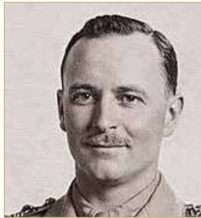
الميجور هارولد ديكسون

في كل من الوطن، أسد، أعلامته في طلبها، روح سيرة أسد، سيرة ساداته، دامت روحها للبلد وللرحل، ولما من هذه الدنيا، لرحلها، أيهم للرحلة، بعثت فاعلموا بآثارهم الطيبة، صحة "الرحل"، عند تلك الذكرى في سلسل: