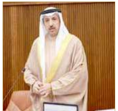
وزير المواصلات والاتصالات

قال وزير المواصلات والاتصالات د. الشيخ عبدالله بن أحمد آل خليفة، إن مركز الملاحه الجوية في مملكة البحرين أدار خلال الأشهر الستة الأولى من العام الجاري نحو 260 ألف طائرة عبرت فوق إقليم البحرين لمعلومات الطيران. وأشار الوزير إلى أنه في الفترة التي تعرضت فيها دولة قطر الشقيقة لهجوم غادر من قبل إيران، وما تبعه من انطلاق صفارات الإنذار عند الساعة السابعة وخمس دقائق مساءً، كان مركز الملاحه الجوية في مملكة البحرين يواصل أداء مهامه في حماية الأجواء الوطنية وإدارة