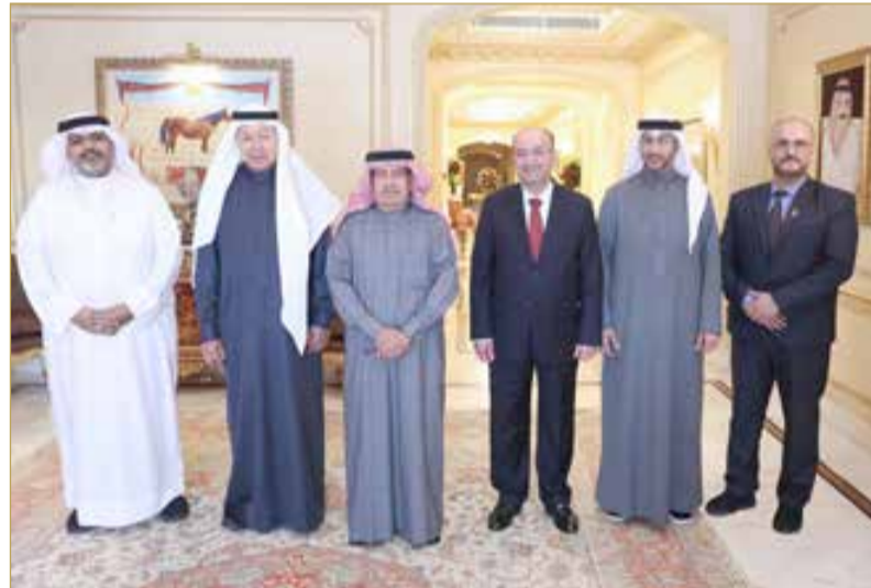
سمو الشيخ علي بن خليفة يستقبل رئيس مجلس إدارة دار البلاد للصحافة ورئيس التحرير