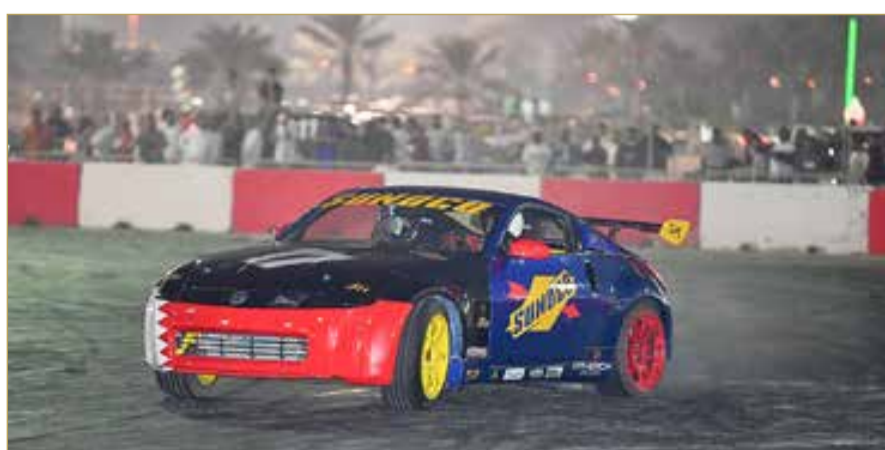
الفعالياتين 8 دنائير فقط.

وسيكون التسجيل للفعالية في مواقع الحلبة، فيما تطلق شارة الانطلاق عند الساعة الخامسة حتى الحادية عشرة قبل منتصف الليل. كما يتعين على المشتركين الخضوع لفحص سلامة إلزامي لسياراتهم قبل المشاركة على المضمار.