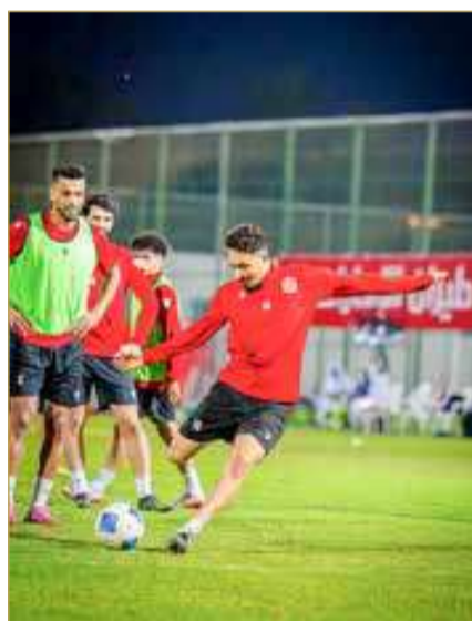
من تدريب فريق "المحرق"

يسعى إليه الفريق الإيراني في ظل فارق النقطتين بينه وبين المحرق. وفي سياق هذه المباراة، أقدمت إدارة نادي المحرق على شراء تذاكر جمهور فريقها؛ وذلك من أجل الحضور وتشجيع ومؤازرة اللاعبين بأكبر عدد ممكن لتحقيق النتيجة المرجوة.