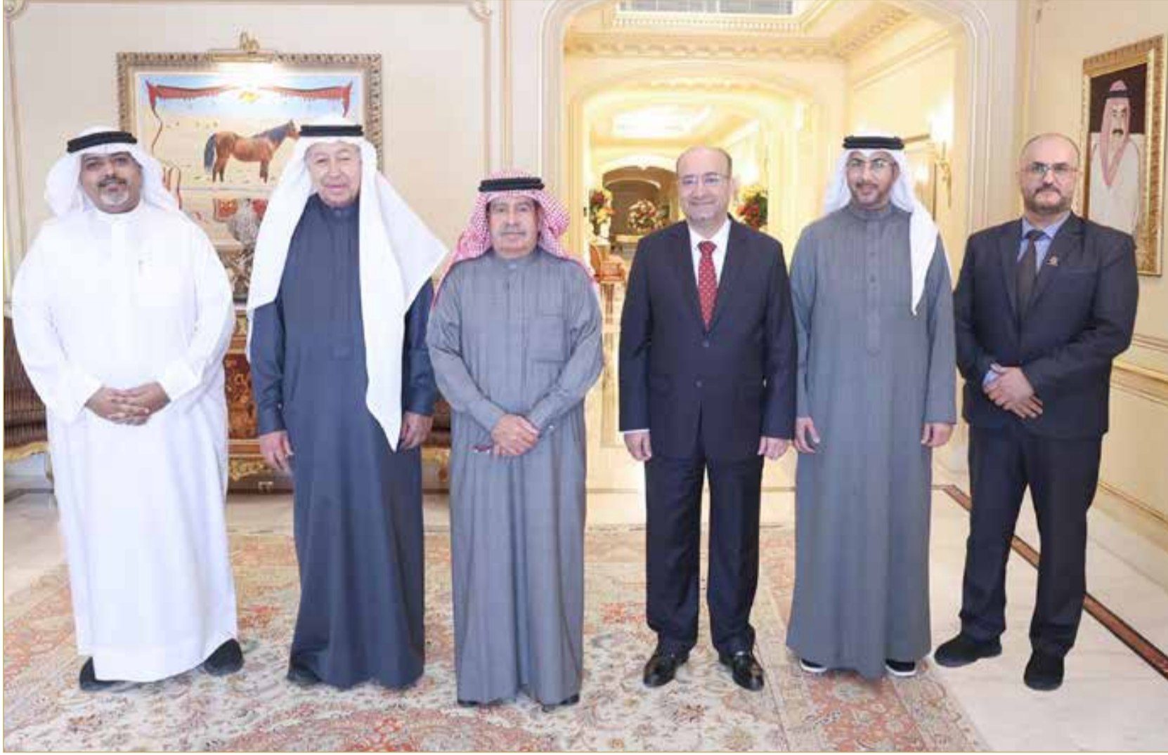
سمو الشيخ علي بن خليفة يستقبل رئيس مجلس إدارة دار البلاد للصحافة ورئيس التحرير