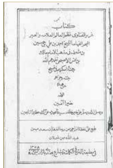
غلاف كتاب غرر الفتاوى

وُلد المرحوم الشيخ سعد عام 1880 في فريج البنعلي بمدينة المحرق، في أسرة عُرفت بالتجارة والدين، وكان والده المرحوم الشيخ عبدالله بن سعد الشمالان من تجار اللؤلؤ المشهورين، كما برز من العائلة عدد من الشخصيات الدينية والتجارية، فضلًا عن تولي بعض أبنائها مناصب رسمية في مراحل لاحقة، وقد تلقى تعليمه الأولي في مدرسة الشيخ