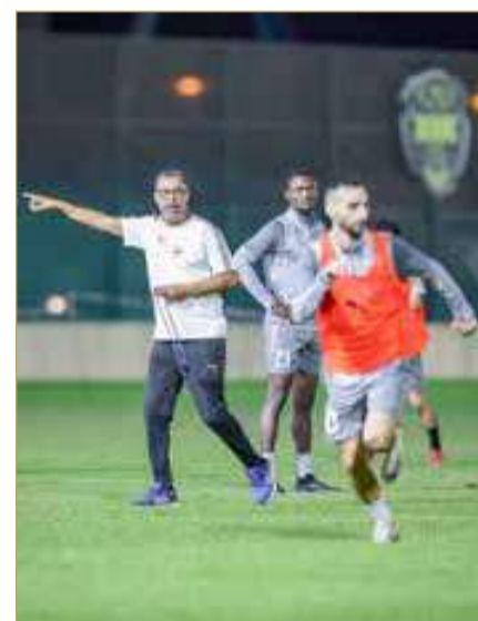
من تدريب فريق "الخالدية"

يسعى إليه الفريق الإيراني في ظل فارق النقطتين بينه وبين المحرق. وفي سياق هذه المباراة، أقدمت إدارة نادي المحرق على شراء تذاكر جمهور فريقها؛ وذلك من أجل الحضور وتشجيع ومؤازرة اللاعبين بأكبر عدد ممكن لتحقيق النتيجة المرجوة.