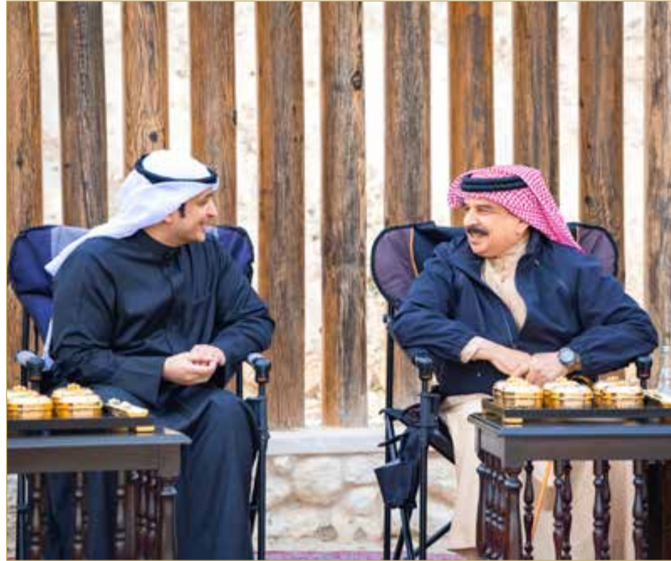
جلالة الملك المعظم يستقبل وزير الإعلام والثقافة وزير الدولة لشؤون الشباب بدولة الكويت الشقيقة