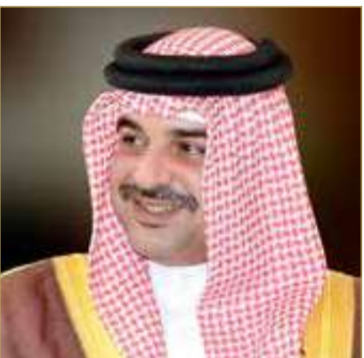
سمو الشيخ عبدالله بن حمد

الفطرية المحلية والإقليمية، كما تشكل المحمية مركزاً للتكاثف والإكثار العلمي للعديد من الأنواع النادرة، ومنشأة تعليمية وبحثية تدعم الجهود الوطنية في مجالات حماية البيئة وصون الحياة الفطرية.