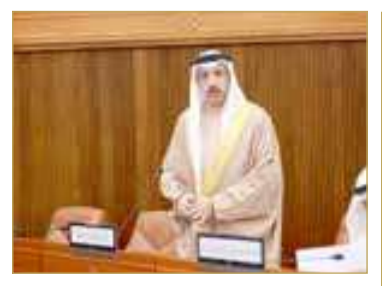
البلاد | حسن عبدالرسول

واقعة الهجوم الإيراني الغادر على قطر استوجبت إغلاق الأجواء ساعتين