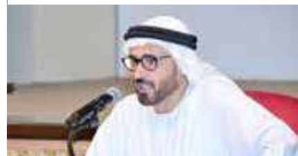
البلاد | إبراهيم النهام

« د. السويدي: “الرحم الامطناعي” بوابة إلى مرحلة “ما بعد التكاثر”