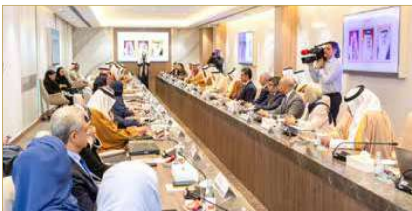
من اجتماع السلطين التنفيذية والتشريعية بشأن المبادرات المقترحة لتطوير المالية العامة

99 إيرادات على أرباح الشركات عند تجاوز حد مالي معين