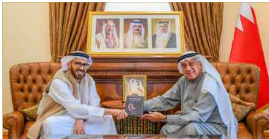
مستشار جلالة الملك للشؤون الإعلام مستقبلاً نائب رئيس مجلس أمناء مركز الإمارات للدراسات والبحوث الاستراتيجية

بحوث وتحليل لمختلف القضايا الخليجية والعربية والدولية، متمنياً له كل التوفيق ومزيداً من النجاح والتميز.